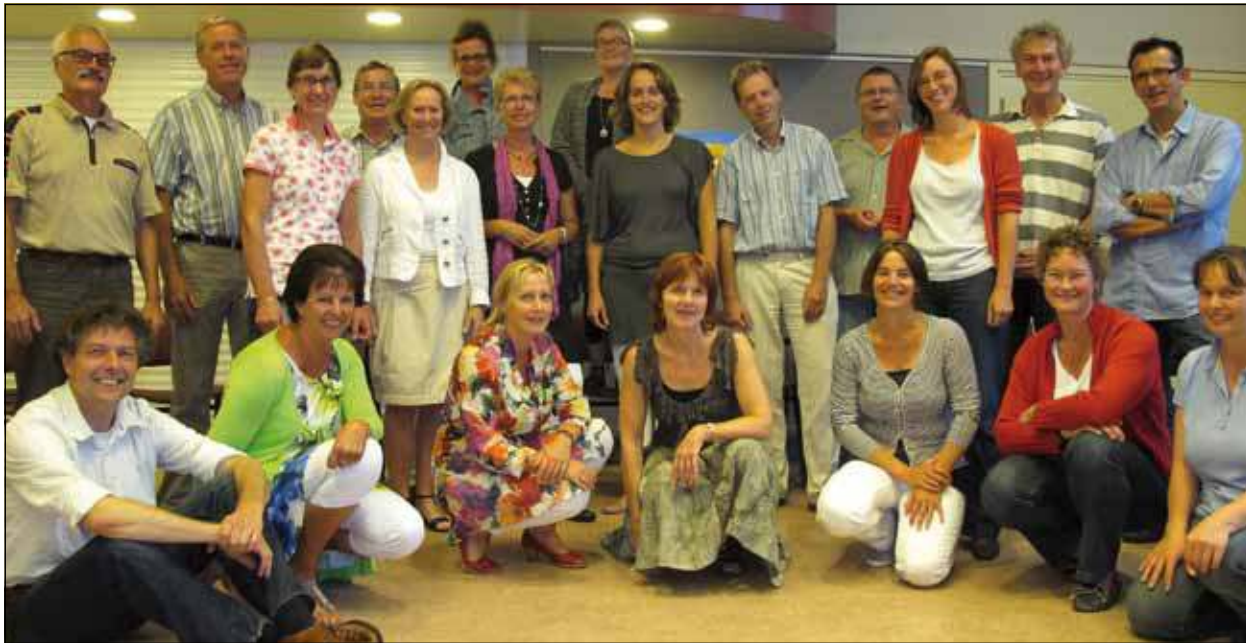
Het Kamerkoor De Bilt is een enthousiast koor met nog ruim plaats voor nieuwe stemmen. Maandag 29 augustus is er een kennismakingsavond is van 20.00 tot 22.00 uur.