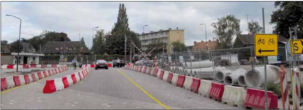
De situatie voor fietsers komende vanuit de Jan Steenlaan is veranderd: ze moeten deze straat nu eerder oversteken om bij de overweg Soestdijkseweg te komen.

Welke hinder valt te verwachten tijdens de afronding van de voorbereidende werkzaamheden in het stationsgebied? 'Het verleggen van de kabels en leidingen in het stationsgebied wordt vanaf 15 augustus hervat. De route van werken is dezelfde als die met het verleggen van het riool: via Jan Steenlaan - Soestdijkseweg Noord - richting trafohuisje - spoor over - Emmaplein - Soestdijkseweg Zuid. Deze werkzaamheden nemen behoorlijk wat ruimte in beslag, omdat naast de sleuven ook ruimte moet worden gemaakt voor de haspels. Dat geeft langs het genoemde traject enige hinder voor automobilisten tot circa half oktober. ProRail start in maart 2012 met voorbereidende werkzaamheden. Het gaat dan om werk aan de bovenleidingen van het spoor. Indien nodig zal 's avonds worden doorgerukt en in mei vindt in dat kader ook een weekendbuitendienststelling plaats. De werkzaamheden kunnen lichte hinder geven - geluids- en/of licht overlast - voor omwonenden, die tijdig geïnformeerd zullen worden via bewonersbrieven. De communicatie met treinreizigers wordt verzorgd door NS. Pas eind mei - begin juni wordt begonnen met de eerste graafwerkzaamheden voor de tunnel voor snelverkeer aan de westzijde. Het verkeer op de Soestdijkseweg heeft daar niet of nauwelijks hinder van. Naar verwachting kan de bypass in de zomer van 2013 in gebruik worden genomen.'