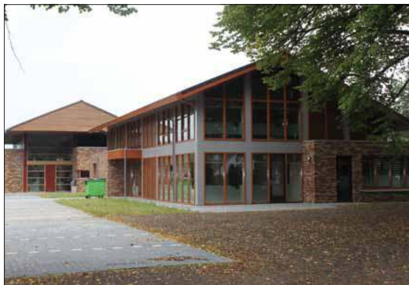
Maandag 29 augustus gaan cliënten en medewerkers van Reinaerde aan de slag in het nieuwe arbeidscentrum.

Er wordt gewerkt volgens een speciale methodiek met een ondersteuningsplan inclusief hoofd- en werkdoelen. Een weekprogramma biedt houvast: met op bepaalde dagdelen speciaal werk in bijvoorbeeld de