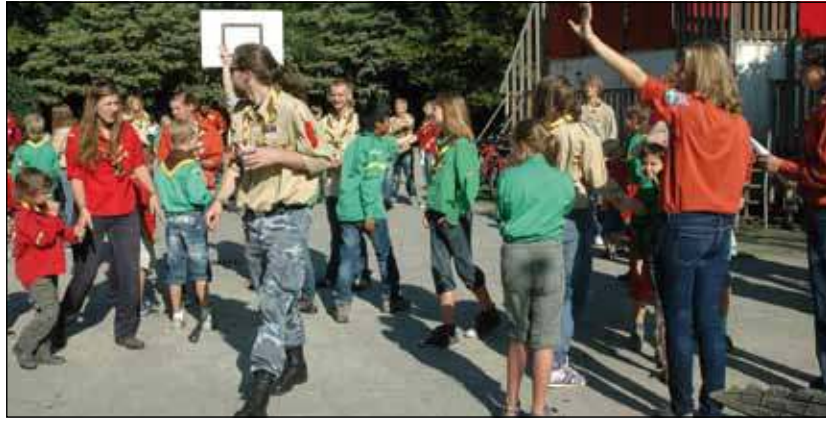
Opening nieuw seizoen bij Ben Labre.

Het doorstromen naar een nieuwe speltak, wordt overigens al eerder voorbereid met een introductie bij de nieuwe groep. De Scoutinggroep Ben Labre doet dit, omdat elke hogere groep niet alleen nieuwe uitdagingen maar ook nieuwe verantwoordelijkheden met zich meebrengt. Voorafgaand aan het overvliegen, was er eerst een gezellig gemeenschappelijk spel waarbij dit jaar alle Bevertjes, Welpen, Verkenners en Rowans gemengd in groepjes een vorm van levend bingo speelden.