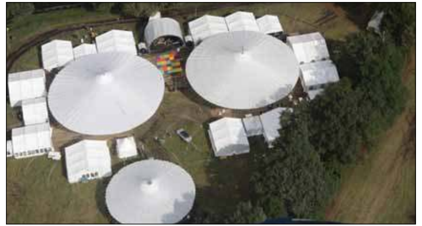
Ook dit jaar zorgen de grote zwevende tenten voor beschutting tegen zon of regen.

De opbrengst van zowel de Gijs van Lennep Legend 2011 als de Culinairie gaat dit jaar naar Stichting Doe Een Wens, de Nederlandse tak van de internationale Make a Wish Foundation. Doe Een Wens maakt zich sterk voor het vervullen van de allerliefste wensen van kinderen met een levensbedreigende ziekte om hen de kracht te geven weer kind te zijn. Bijdragen is behalve leuk en lekker, heel eenvoudig: iedere bezoeker doneert automatisch door het betalen van toegang tot en met het uitgeven van duiten op het terrein. Toegangskarten kunnen worden besteld via de website of op de dag zelf aan de kassa worden gekocht. Zie ook www.culinairie.nl en www.doeeenwens.nl .