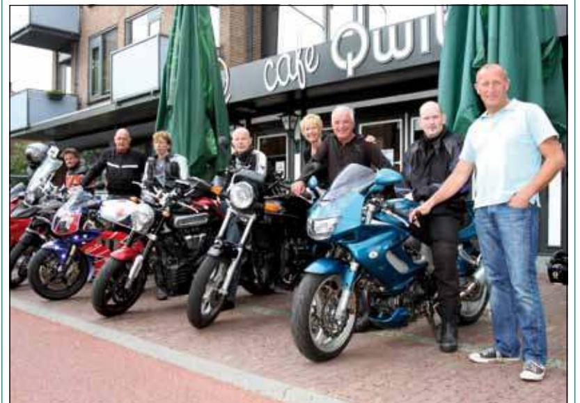
De groep voorverkeners ging afgelopen weekend alvast op pad.

Na afloop is er zoals alle voorgaande jaren een gezellige BBQ georganiseerd door de Qwibus. Aanmelden hiervoor kan bij de Qwibus tot en met donderdagavond 25 augustus. Tel: 030 2210150.