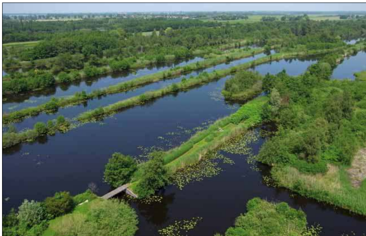
De Molenpolder van bovenaf gezien.

Het vertrekpunt is Staatsbosbeheer, Westbroekse binnenweg 5 te Tienhoven