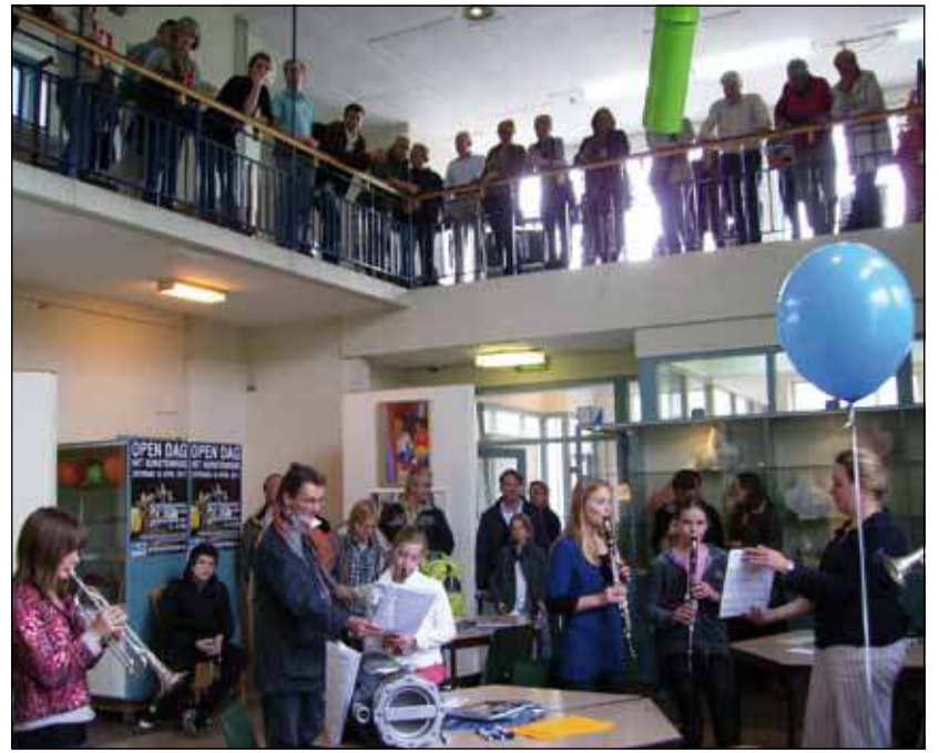
In 2010 was er goede belangstelling voor de Open Dag.

Een uitgebreide beschrijving van ons nieuwe cursusprogramma, evenals het exacte rooster voor de open dag vindt u op onze website www.werkschuit.nl en www.kunstenhuis.nl