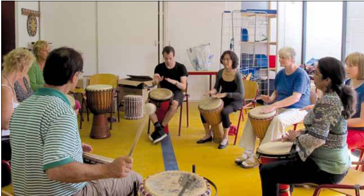
De workshop Afrikaanse percussie/djembe trok veel enthousiaste deelnemers.

Voor het intercultureel eetcafé, de High Tea en de Indonesische avond is aanmelding vooraf verplicht. De administratie van 't Hoekie is voor aanmeldingen en informatieverstrekking bereikbaar op maandag van 9.00 – 15.30 uur en van dinsdag tot en met vrijdag van 9.00 tot 17.00 uur op 0302201702, of via info@animo-werkt.nl . Voor meer informatie: zie www.hoekie.nu .