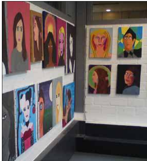
Het werk van de leerlingen.

Er wordt les gegeven in kleine groepen (maximaal 9 leerlingen) aan alle leeftijden. Er wordt getekend en geschilderd met verschillende materialen, van houtskool tot en met olieverf, op verschillende ondergronden, van papier tot doek of zelfs glas en servies. Af en toe wordt er met speeksteen gewerkt buiten op het plein als het weer het toe laat, of met klei. De lessen worden ingedeeld op leeftijd en niveau. Voor meer informatie zie de website: www.margodejong.com of tel.nr. 06 40593523.