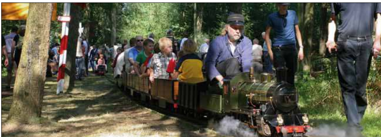
Net als voorgaande jaren kunnen tijdens de open dag van Stoomgroep Rading Spoor op zaterdag 27 augustus 2011 van 10.00 tot 17.00 uur ook weer ritjes gemaakt worden.

De open dag is op zaterdag 28 augustus van 10.00 tot 17.00 uur. Er zijn niet veel parkeerplekken voor auto's aanwezig, wel voor fietsen. Het adres van het complex is Karnemelksweg 8 in Hollandsche Rading. Via bordjes wordt de route aangegeven. Naast de vele mooie stoommachines van leden van deze Stoomgroep, kunnen er ook van leden van andere groepen stoomapparaten bekeken worden. Er kan er een ritje gemaakt worden of gesprongen op een springkussen maar ook is er iets te eten, te drinken en te snoepen te koop. De entree tot het complex is gratis.