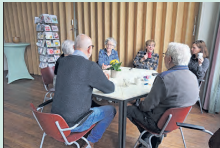
Iedere dinsdag is er gelegenheid om elkaar te ontmoeten in deze ruimte. Aanmelden kan, maar is niet noodzakelijk.