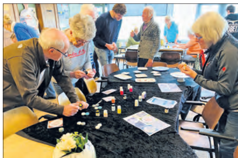
Veel creativiteit en gezelligheid bij De DerdeHelft.

Er waren 16 deelnemers en 4 studenten van de Hogeschool Utrecht die een snuffelstage kwamen doen. Mirjam legde eerst uit wat de be-