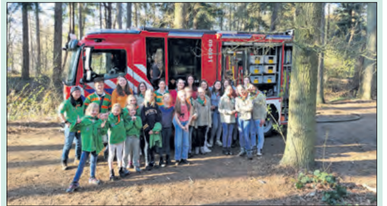
De meiden van Scouting Laurentius beleefden een leerzame middag met de brandweer.