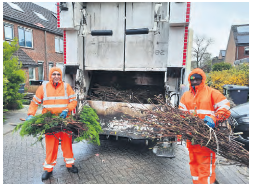
Ophalen van takken met vuilniswagen, door PreZero