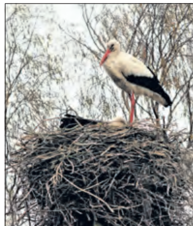
Samen in verwachting. In Westbroek zijn alle ooievaarsnesten weer bezet.

Anders gaat dit bij de ooievaar. Deze opvallende vogel, wit en zwart met knalrode snavel en poten, maakt zijn nest graag hoog in de boom of op een bouwmerk. Een strategie, die voort komt uit een sterke onderlinge band. Man en vrouw broeden om beurten en foe-