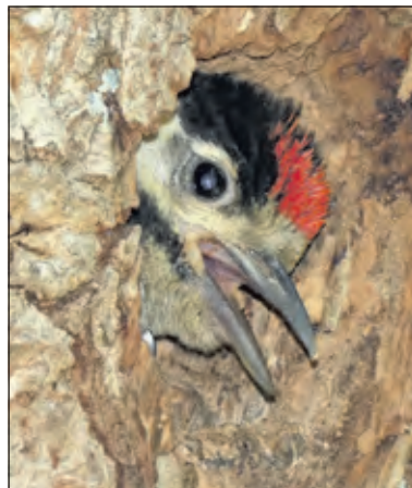
Een jonge grote bonte specht Kiekeboet.