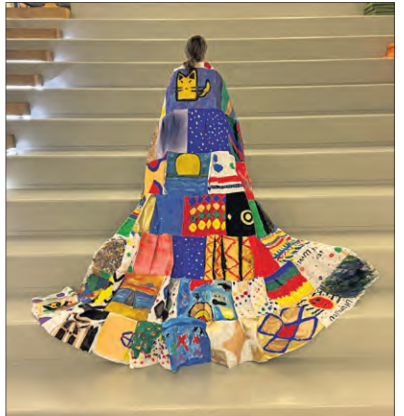
De mantel van Sint Maarten is te bewonderen bij de Paasexpositie van WVT.

Sjaak den Breeje (De Bilt) is gepassioneerd natuurfotograaf met de focus op landschappen en bossen. Een groot deel van zijn foto's is gemaakt in de buurt van zijn woonplaats. Te midden van de bossen op de Utrechtse Heuvelrug en de landgoederen rond Utrecht. Zijn portfolio biedt een gevarieerde se-