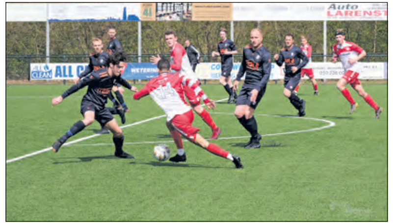
De Bilt in de aanval.

lers, staf, supporters: eindelijk een keer gerechtigheid! Daarna nog een minuut te spelen, na enige onhandigheid van De Bilt en gefrommel van Montfoort, belandde de bal op de paal en vanuit de rebound schoot Montfoort in de allerlaatste seconde alsnog de gelijkmaker binnen. De grensrechter vlagde, omdat de speler die scoorde echt buitenspel stond. De scheidsrechter nam niet eens de moeite om hierover na te denken, floot gelijk af, liet niet meer aftrappen: wel goedgekeurd of toch afgekeurd? Erg onduidelijk, maar de eindstand was 3-3. Het was in ieder geval spectaculair.