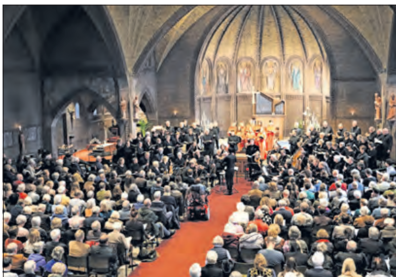
Afgelopen zondag klonk Bachs Matthäus-Passion weer in de OLV-kerk in Bilthoven.

In de talrijke koralen werd echter veel goedgemaakt: een volle, warme klank golfde dan door de zaal waarbij de liefde van tekst en muziek als een warme waterval tot in de zielen van de aandachtige luisteraars doordrong. En prachtige traditie die hopelijk nog lang blijft bestaan. (Peter Schlamilch)