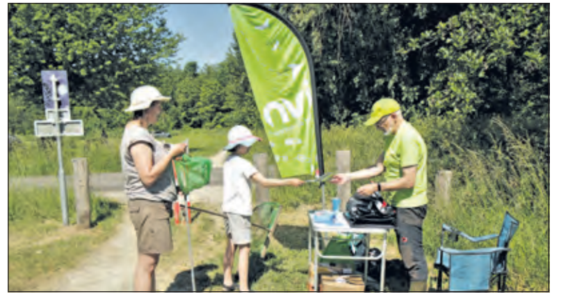
Een van de vele activiteiten van het IVN: 'sporen naar insecten'.

Judith: 'We zitten nu met een tekort aan bestuursleden. De voorzitter is verhuisd en ook de functie van secretaris is vacant. Ik vul die functie dus nu tijdelijk in. Niet ideaal, omdat ik al sinds lange tijd niet meer in deze buurt woon. Maar ja, iemand moet het doen. Wat we nu bij IVN De Bilt e.o. in bestuurlijke zin mee-