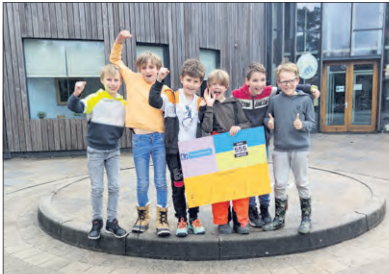
In de loop van de week groeide de opbrengst tot boven de 15.000 euro.

Op het terrein van het Oude Biltse Meertje werd de route uitgezet. Tijdens de gymles hebben de leerlingen gerend voor Oekraïne, aangemoedigd door ouders en andere bekenden. Al snel werd de tienduizend euro aangetikt. Daar bleef het niet bij, in de loop van de week groeide de opbrengst tot ruim 15.000 euro. Gedacht werd dat het daarbij zou blijven en er werd een fotomoment met de initiatiefnemers georganiseerd. Uiteindelijk