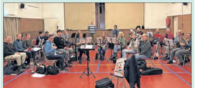
Jong en oud oefent regelmatig bij Vriendenkring.

Bijzonder aan deze repetitie is dat ook een aantal kinderen van basisschool 't Kompas mee-oefenen. Zij gaan namelijk, samen met Vriendenkring, op Koningsdag het Koningslied vertolken in de tent, en daar moet natuurlijk voor gerepeteerd worden: op school met de eigen leerkrachten én de 20ste met de hele fanfare. Natasja van het Dorpshuis zorgt die avond voor een hapje en drankje. De entree is gratis.