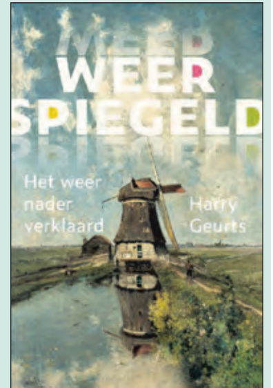
De omslag van het boek.

Van het boek 'Weerspiegeld' is voor lezers van De Vierklank een aantal exemplaren beschikbaar. Om hiervoor in aanmerking te komen stuurt u een mail naar info@vierklank.nl met in het onderwerp Weerspiegeld. De exemplaren worden onder de inzenders verloot, iedereen krijgt bericht.