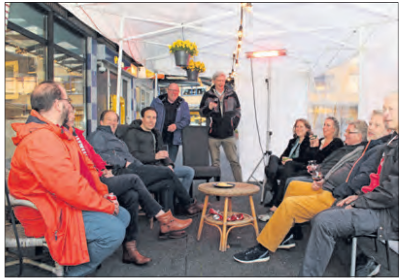
De jubilaris organiseerde op vrijdag 8 april een 'ouderwetse borrelavond', waardoor hij in de gelegenheid werd gesteld (veel) oudgedienden van vroeger te ontmoeten.