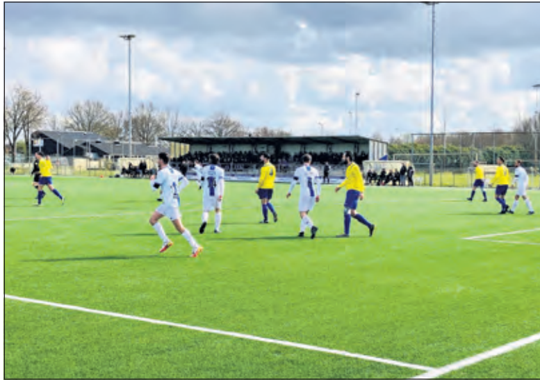
Een spelmoment uit een onnodig verloren wedstrijd.

Na de rust ging een verbeterd strijdend SVM op jacht naar de verdiende gelijkmaker. Elinkwijk loerde op de counter en bleef gevaarlijk. SVM wilde wel, maar bleef ongelukkig in het benutten