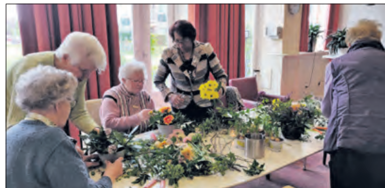
Zonnebloemgasten maken paasstukjes.

Het werd al lente, maar wie lag te loeren Koning Winter die zijn staart wilde roeren omdat hij ook doet wat hij wil zagen we op de eerste april dat je hem niet zomaar af kunt gaan voeren