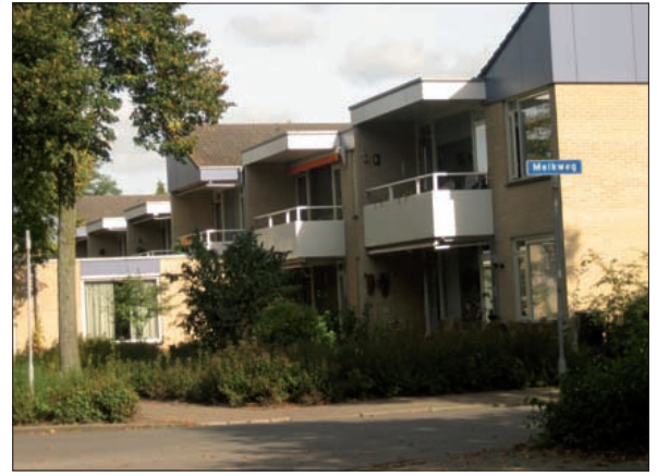
Toutenburg, op de hoek van de Kievillaan en de Melkweg.

'Dat verlies vind ik heel erg want die Sieraden heb ik nog van mijn man gekregen voor hij overleed. Het was een mooie herinnering. Maar ik begrijp niet hoe dit gebeurd kan zijn want de vrouw is niet in de slaapkamer geweest. Ik snap er niets van. Er moet dus nog iemand anders zijn geweest, een handlanger, die, terwijl zij zaten te praten, de slaapkamer is binnen gegaan. Maar ik heb niemand anders gezien. Je wordt zo afgeleid en het gaat allemaal zo snel. De volgende ochtend ontdekte ik dat