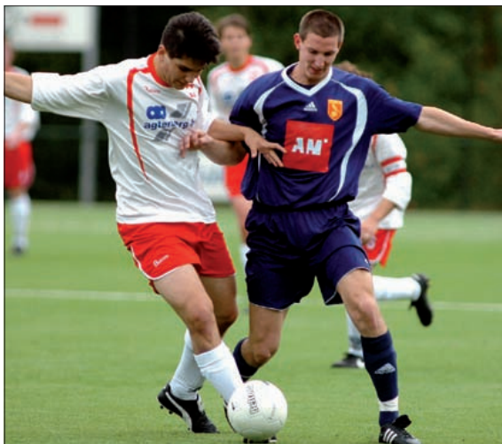
De wedstrijd tussen FC De Bilt en het Utrechtse DHSC is geëindigd in een gelijkspel. Beide ploegen kwamen niet tot scoren.