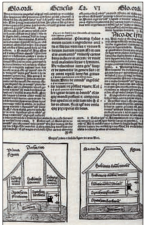
De zedelijke Bijbel die op het klooster Oostbroek in gebruik was bevat ook afbeeldingen. Hier de ark van Noach.

Tot de rijke geschiedenis van het gebied van de zes kernen van De Bilt behoren figuren met bovenlokale betekenis. Doedens noemt abt