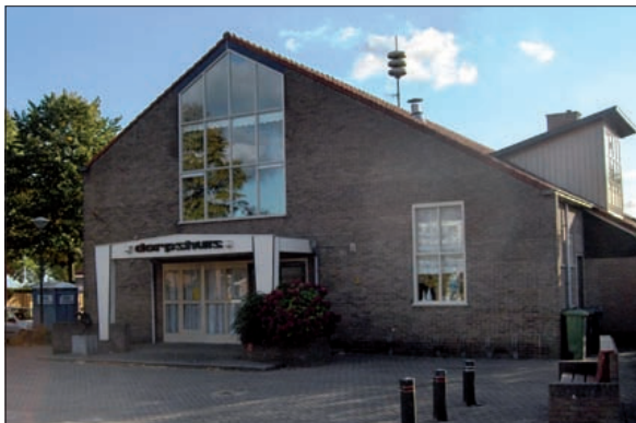
Het Gemeenschapshuis van Westbroek.

Intussen heeft het college een plan van aanpak vastgesteld dat voorziet in de uitwerking van het scenario 'Gemeenschapshuis' naar een concreet ontwerp. Bij de totstandkoming van het ontwerp worden de gebruikers, de dorpsraad en de bewoners van Westbroek betrokken. Volgens planning is het definitieve ontwerp in februari 2010 gereed en kan in oktober 2010 worden gestart met de werkzaamheden.