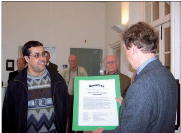
Het manifest dat op 16 november 2004 werd aangeboden.