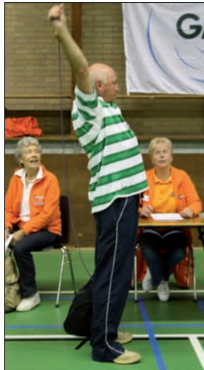
Zaterdag 10 oktober was er een fittest voor senioren in De Bilt, die gehouden wordt in de sporthal aan het Henri Dunantplein.