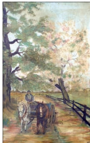
Nog niet herkende voorstelling van voerman met kar en twee paarden; eerder geplaatst in De Vierklank van 27 april 2005.

Inmiddels zijn er verschillende schilderijen van Teus Hunnik bekend. In 2003 besteedden we al aandacht aan zijn schilderij 'Zondagmorgen in de