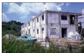
De bouw aan de school vordert, maar kan nog niet worden voltooid

Het resultaat van al die activiteiten eind 2008 was rond de 10.000 euro, zodat rond 1 april 2009 de bouw weer hervat kon worden. De afgelopen maanden zijn er weer 2 werkgroepen vanuit Nederland naar Siret gegaan om samen met de Roemenen de handen uit de mouwen te steken. Er is een volledige verdieping op de school gekomen. Een groep loodgieters uit Nederland heeft gezorgd voor het aanleggen van de riolering en de waterleidingen. Daarnaast zijn op de begane grond ramen