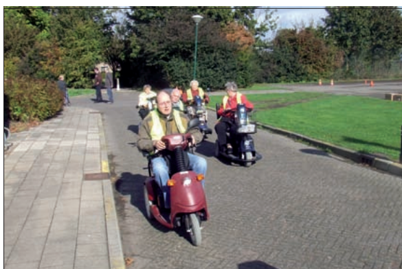
Scootmobielers op weg voor een tocht door de gemeente.

Zaterdag 19 september was de jaarlijkse kleding en speelgoedmarkt van peuterspeelzaal de stampertjes uit Westbroek. Wat aanvankelijk weinig leek te zijn, bleek achteraf voldoende kleding en speelgoed te zijn voor de verkoop. Alles was weer leuk en gezellig neergezet. De opbrengst was 478 euro, waar nieuw speelgoed voor de peuters kan worden aangeschaft.