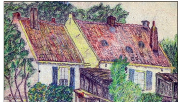
Huisjes aan het water; in 1941 gemaakt door J.G. Hunnik.

het landgoed Eyckenstein in Maartensdijk zijn geschilderd. Het tweede schilderij van Betty stelt twee huisjes aan een vaart voor met op de achtergrond een (kerk-)torensplits. Dit werk kan in een meer waterrijk gebied, bijvoorbeeld Achtienvoven, Westbroek of Tienhoven zijn gemaakt. Lezers die de afbeeldingen op de schilderijen herkennen, wordt gevraagd dit s.v.p. door te willen geven aan Koos Kolenbrander, tel 0346 211675.