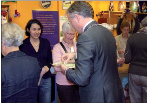
Alle medewerkers krijgen van de burgemeester het fairtrade lintje en een brief van minister Bert Koenders uitgereikt.