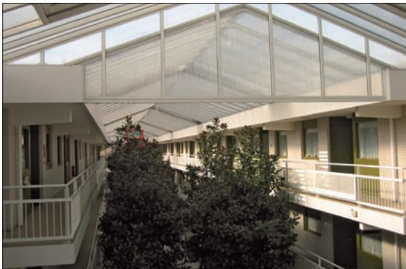
Vrijdag 16 oktober geeft de politie om 10.00 uur voorlichting in Dijkstate. De bijeenkomst is niet alleen bedoeld voor bewoners van Dijkstate en Toutenburg. Iedereen is van harte welkom.

'Hij zei dat hij geen contant geld mocht aannemen maar dat er moest worden gepind. Hij pakte mijn pinpas en zei dat hij dat hier even bij de bank zou doen. 'Ik ben zo terug', zei hij nog. 'Dan haal ik gelijk uw pakje uit mijn auto'. Hij vroeg mijn code die ik gaf, want nou ja, dacht ik, het was maar 1,69. Ik heb hem niet meer terug gezien maar het bleek dat hij een half uur later in Soest bij een bank duizend euro van mijn rekening heeft afgehaald. Ik heb er van geleerd en het zal me niet meer gebeuren. Ik doe ook de deur niet meer open voor onbekenden.' Dat klopt want het kostte deze verslaggever geruime tijd om binnen te komen en dat lukte alleen doordat zij bezoek had van familie.