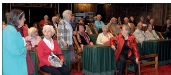
In de Eerste Kamer mochten de deelnemers even plaats nemen in de bankjes.