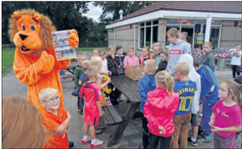
Grote drukte bij de tafel waar de sportplaatjesalbums worden uitgereikt aan de jongste verenigingsleden van TZ.

De actie loopt vanaf woensdag 2 september en tot en met 14 oktober. Elke klant ontvangt bij 15 euro aan boodschappen een gratis setje sportplaatjes. Na afloop van de actie wordt een ruilbeurs georganiseerd, waarbij dubbele plaatjes kunnen worden geruild voor de plaatjes, die gemist worden. Wanneer hierover meer bekend is wordt dat binnen beide sportverenigingen aan hun leden bekendgemaakt. Nu maar eens kijken of er met deze actie net zo fanatiek verzameld en geruild wordt door de kinderen als met de vorige actie.