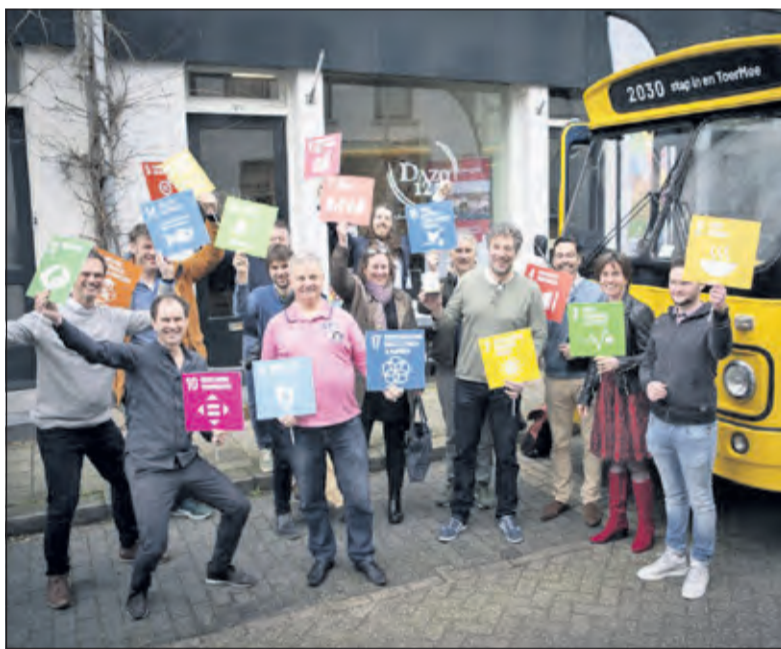
De duurzame ontwikkelingsdoelen zijn vastgelegd in 17 Sustainable Development Goals om van de wereld een betere plek te maken in 2030. SDG Nederland toert regelmatig rond om deze doelen breder uit te dragen.

Duurzaam De Bilt is een samenwerking van BENG!, Biltseerlijk, Werkgroep Fairtrade, Samen voor De Bilt en de Wereldwinkel. De gemeente De Bilt steunt deze activiteit. (Joanne Penning)