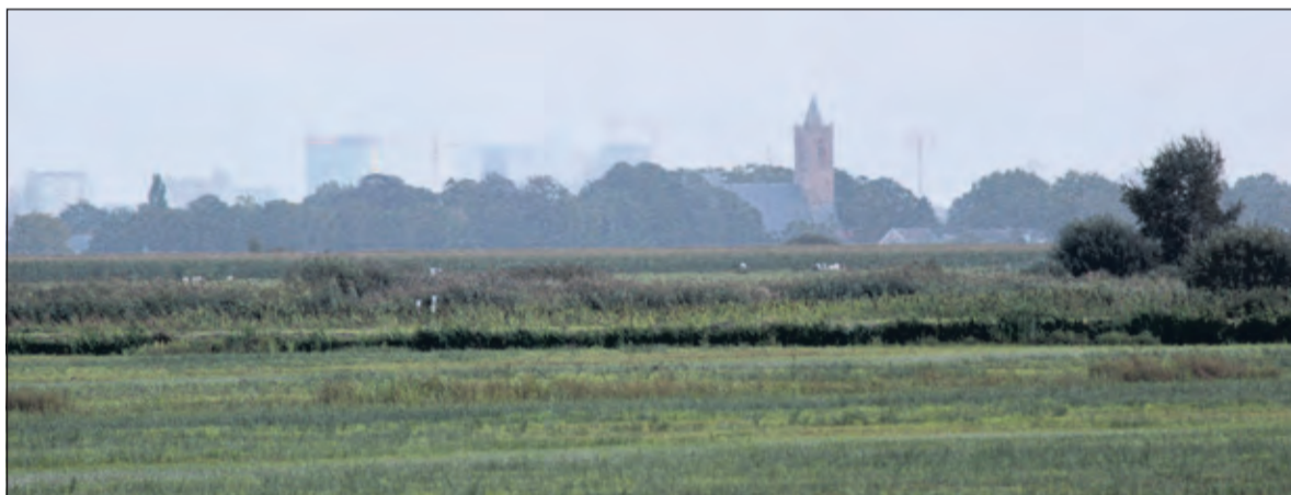
Vanaf de Kanaaldijk op de grens tussen Noord Holland en Utrecht weidse Noorderparkvergezichten naar Westbroek.

Behalve veel vogels hebben ook diverse boeren hun bedrijf in het Noorderpark. ‘De Agrarische Natuurvereniging (ANV) wil graag een bijdrage leveren door boerderijen open te stellen voor de burger. Zo hoopt zij een goede afstemming te bereiken tussen boer en natuur’. Kortom, het is een park waar natuur en mens samen komen. Boorsma: ‘Dus bezoek het park en consumeer verwondering’.