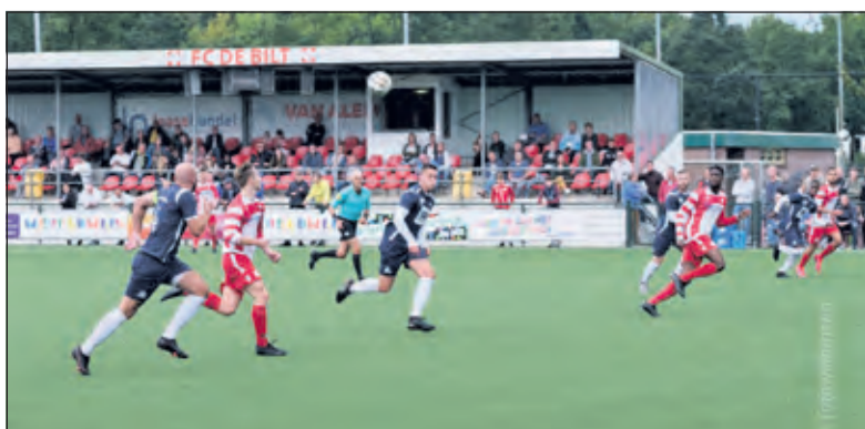
Op het veld en op de tribune was het afstand houden.