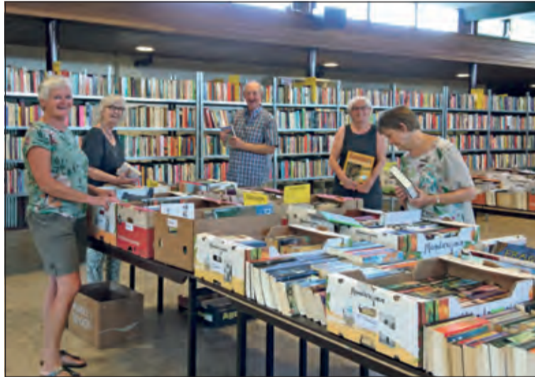
Het boekenteam keek met veel plezier naar het resultaat.