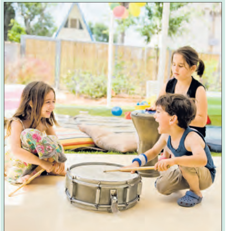
De kindercursus muziekkraft is de eerste stap naar een muzikale loopbaan.

Kijk op www.kunstenhuis.nl/muziek voor alle informatie over de muzieklessen in Maartensdijk en schrijf evt. in voor een proefles of een opstapcursus. (Dieuwertje van Ravenswaaij)