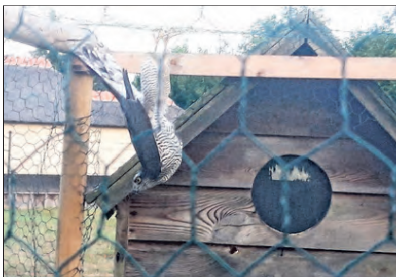
De havik in het kippenhok.

keer tegen de zijkant van het kippenhok, waarin nog een kleine opening was. Ik heb juist het hok ‘vosbestendig’ gemaakt, omdat in november mijn 3 kippen waren gedood door een vos. Gelukkig was ik in de tuin en opende de deur. In één lange vlucht vloog deze havik naar de hoge eikenboom. Kippen en havik gered’.