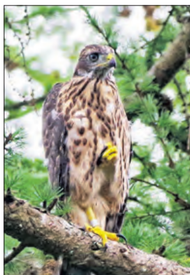
Jonge havik in Beukenburg.