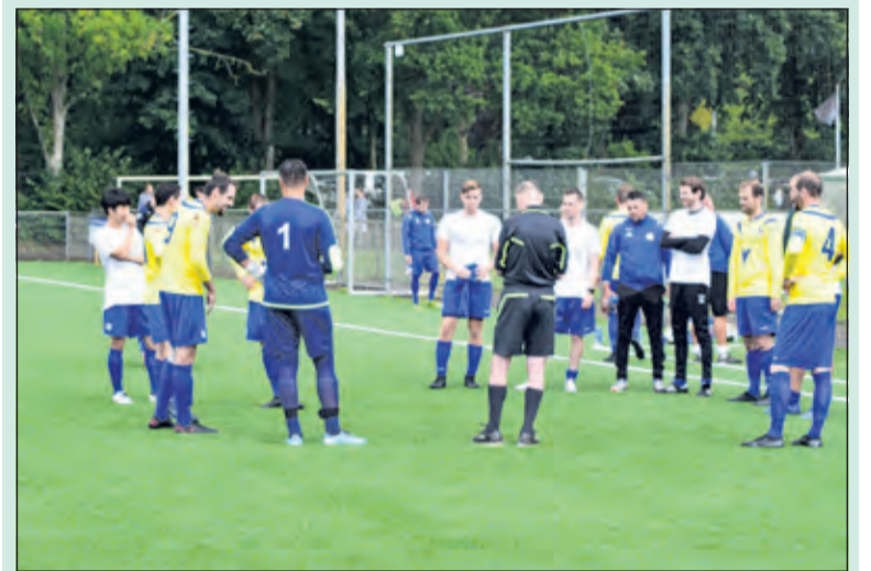
De arbiter van dienst controleert voorafter plekke of het namenregister goed is ingevuld.