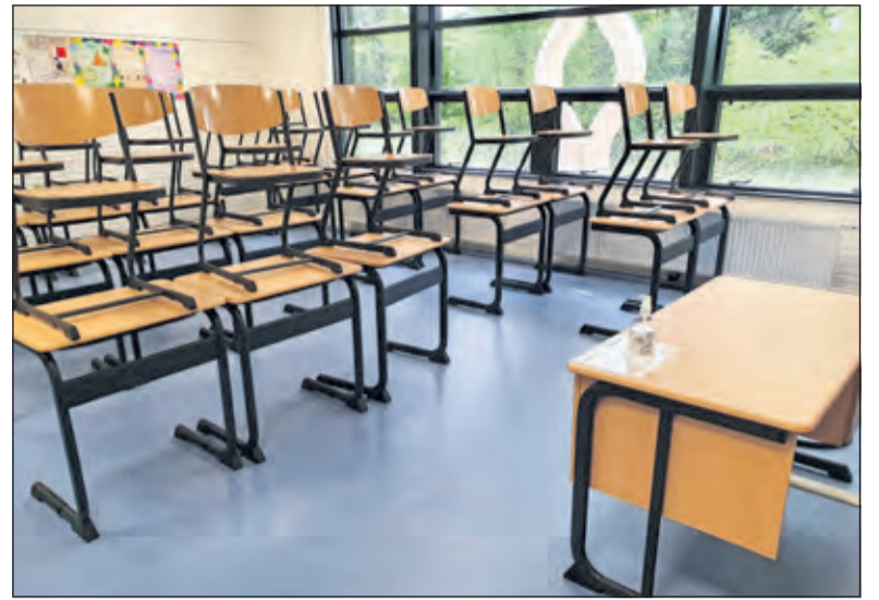
Deze week gaan alle leerlingen weer naar school met inachtneming van de anderhalve-meter-maatregelen.

HNL voert nog meer nieuwe maatregelen in. Aan het eind van ieder lesuur lucht de docent het lokaal, voordat de volgende klas deze betreedt. Ook pauzes voor leerlingen en docenten vinden niet meer tegelijk plaats. Zo krijgt iedere leerling een tussenuur, ergens in het vierde, vijfde of zesde lesuur. Hiermee komen andere pauzes te vervallen. Er