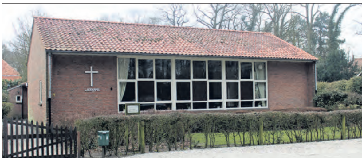
De Boskapel aan de Grothelaan 1 in Groenekan.