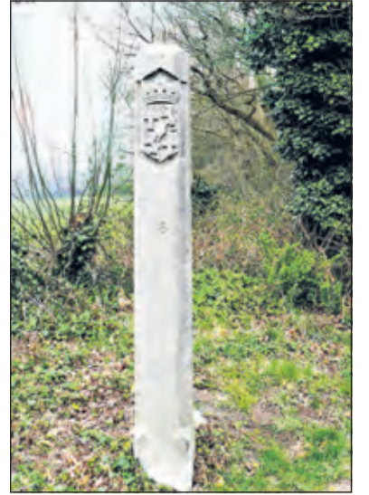
Een leeuwenpaal die de grens vormt met Holland, zoals die nu nog te zien is.

Aelmans en Keeck gingen zelfs naar Groningen, waar Peter een enigszins verwarde oude monnik ondervroeg die eerder in het klooster Oostbroek bij De Bilt had gewoond. Die wist te vertellen dat de grens met Holland zelfs helemaal aan de Steenstraat