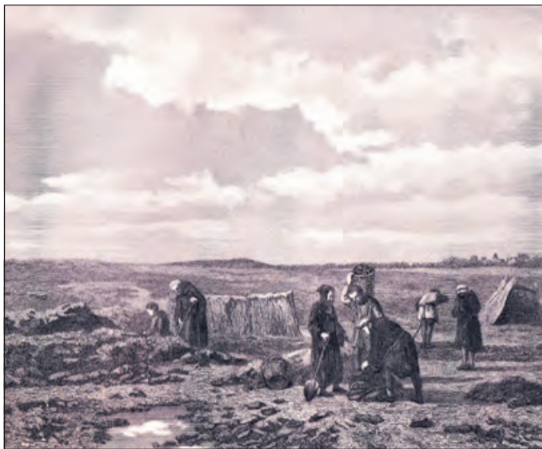
Boeren en geestelijken steken turf, gravure van een schilderij van S. van den Berg 1880.

Van zijn verslagen wordt een digitale uitgave voorbereid. Daarin staat behalve de oorspronkelijke tekst en een hertaling ook een uitgebreide toelichting op de inhoud. De publicatie is vanaf september/oktober dit jaar te raadplegen op Online Museum De Bilt. Dan valt er ook te lezen waar de beroemde hofstede van de Abdis van Elten gelegen heeft.