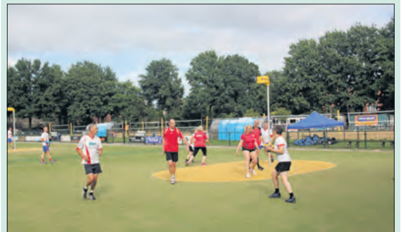
Afgelopen zaterdag speelden de Recreanten voor het eerst wedstrijden tegen andere clubs tijdens een oefentoernooi bij Nova.

De Nova recreanten trainen inmiddels een jaartje samen op de woensdagavond. De één heeft vroeger gekorfbald en wil dat weer op een lager pitje doen, de ander heeft kinderen bij Nova spelen en wilde zelf ook kennismaken met deze sport en weer een ander is er via via bijgekomen. Wie ook een keer wil meekijken kan mailen naar recreanten@kvnova.nl (Renske van Kempen)