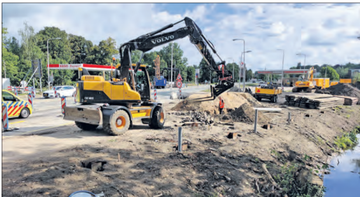
Er wordt hard gewerkt aan de aanleg van de faunapassage.

passage. Wij schreven daar eerder over: 'Provincie Utrecht, de gemeenten Utrecht en De Bilt en Utrechts Landschap hebben een samenwerkingsovereenkomst gesloten om er voor te zorgen dat deze laatste natuurverbindingen worden gerealiseerd: een ecodeuct over de Biltse Rading (tussen de Voorveldse en Voordorpse polder op het grondgebied van de gemeente