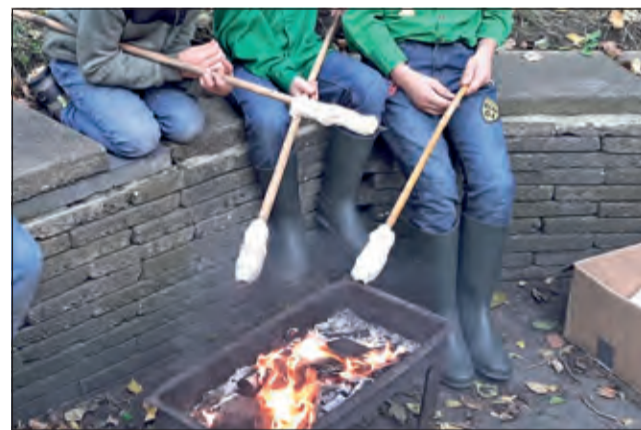
Broodjes bakken boven een vuurtje blijft een leuke bezigheid.