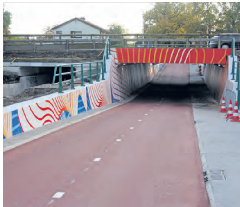
De ontwerper liet zich bij de noodzakelijke verbreding van het fietstunneltje inspireren door het KNMI bij het ontwerp voor de tunnel.