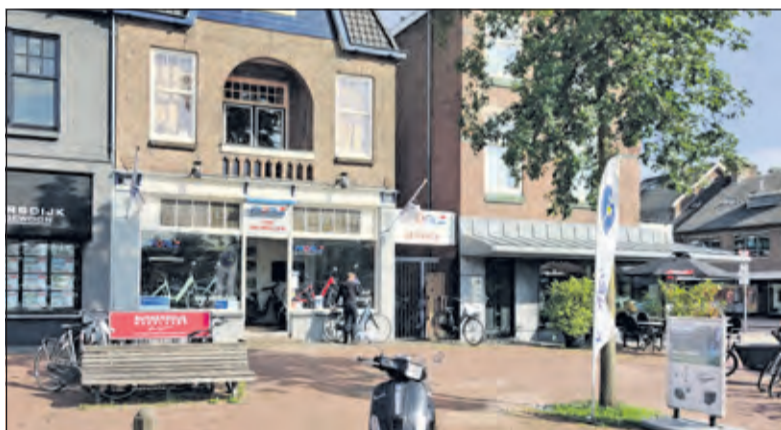
Al meer dan 65 jaar is Van Weelden op het Emmaplein gevestigd.

Al meer dan 65 jaar is er een plek op het Emmaplein waar je een fiets kunt kopen of laten repareren. Twee generaties Van Weelden stonden garant voor de goede en klantvriendelijke service, zoals je in een dorp verwacht. Het begon allemaal in 1955 met een werkplaats op Emmaplein 7a, het achterterrein van de Spoorwegen tussen het Emmaplein en het spoor. Daarna volgde de huur van het karakteristieke pand Emmaplein 3-7. Sinds 1997 vinden we Cees van Weelden op Emmaplein 4. Daarnaast is er een servicecentrum aan Rembrandtlaan 2a.