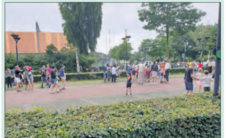
Grote drukte bij de start van de Kindervakantieweek

Nog maar zeven weken geleden werd een begin gemaakt met de organisatie van de Kindervakantieweek WVT 2021. Eerder werden al in januari de eerste stappen gezet maar in die jaren was er geen corona. Verleden jaar vond het evenement, dat al sinds 1969 onafgebroken 50 keer georganiseerd is, helemaal geen doorgang. Ook dit jaar zou er geen vakantieweek georganiseerd worden, maar na de versoepelingen van eind mei dit jaar is besloten alsnog de 51ste editie van 19 t/m 21 juli te organiseren. Dit jaar kon WVT terecht op het ruime sportveld achter De Werkplaats.