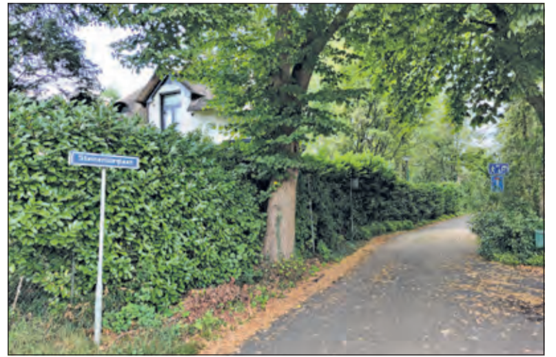
De Steinenburglaan is één van de kleine straatjes (doodlopend) langs de Utrechtseweg in De Bilt.