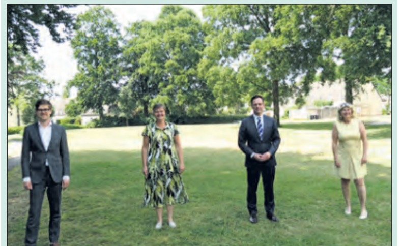
Het college van B en W dat tot de verkiezingen de gemeente De Bilt zal besturen.