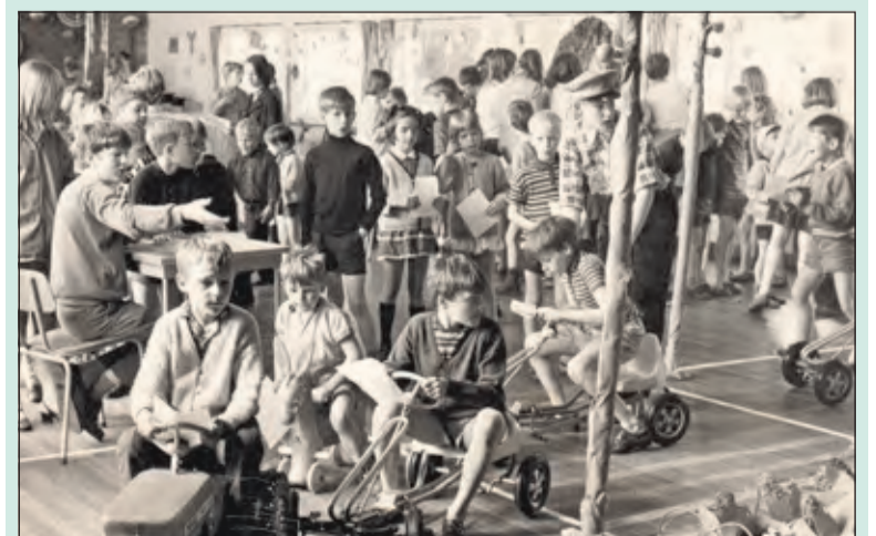
Rienk Miedema vond deze foto in de WVT-archieven; de eerste Kindervakantieweek in 1969.

De gemeente stond achter het initiatief en heeft alle medewerking verleend. Daarnaast stemden verschillende fondsen en instanties stemmen in, zoals het Van Ewijkfonds, Stichting Mens en zijn Natuur, Stichting Leergeld, Sportcentrum Kees en De Werkplaats Kindergemeenschap. Met als gevolg dat er maar liefst 407 kinderen zich konden inschrijven voor de drie dagen, die de KVV dit jaar duurt. Het gebruikelijke dagje uit kan niet doorgaan. Wel staan er 70 vrijwilligers paraat voor het pannenkoeken bakken, knutselen, buitenspel, watergevechten, wandelen in het bos en natuurlijk de catering. [HvdB]