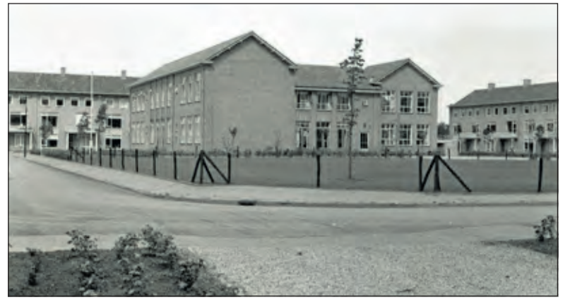
Foto uit 1959 met als beschrijving 'Zicht op de voormalige Wilhelminaschool gelegen in de Beatrixlaan'.