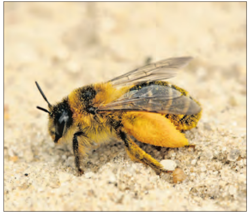
Een pluimvoetbij.