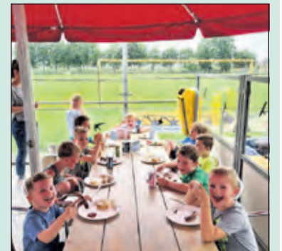
Dolle napret aan tafel.