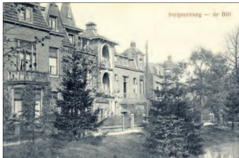
Het complex Steinenburg, dat als adres Utrechtseweg 378-392 heeft, bestaat uit een aaneengesloten rij van acht woningen van twee en drie bouwlagen. Op de kaart staat De Bilt, maar dat is ten onrechte, omdat Steinenburg toen nog niet op Bilts grondgebied lag. (foto Utrechts archief)

sinds 2001 in De Bilt is opgegaan. Achterwetering, Nieuwe Wetering, Groenekan en Hollandsche Rading zijn eerder als buurtschappen van het gerecht Oostveen opgegaan in Maartensdijk. Een aantal kernen is opgegaan in de gemeente Utrecht, zoals Blauwkapel, de Gagel en Tuindorp. De kern Steinenburg is in 1954 al bij de gemeente De Bilt gekomen. Deze grenswijziging in 1954 maakte abrupt een einde aan de toepasbaarheid van de formuleringen Maartensdijk, (post de Bilt) en De Bilt, gem. Maartensdijk. Het gedeelte van buurtschap Steinenburg ten oosten van de A27 kwam bij de gemeente De Bilt; bewoners die gewend waren De Bilt als woonplaats op te geven, konden daar gewoon mee doorgaan. Het gebied tussen Fort De Bilt en de A27 viel voortaan onder de gemeente Utrecht; de bewoners daar zouden De Bilt niet langer als hun woonplaats opgeven.