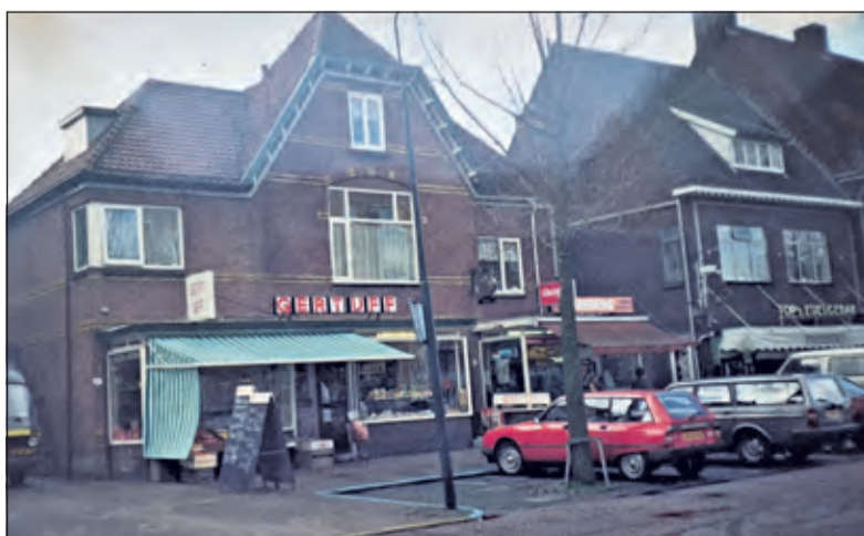
Gekneld tussen Gert IJff en Top betrokken zij de rechterzijde van het voormalig pension Ravenhorst.