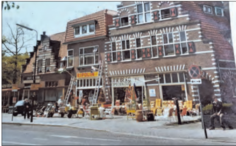
Emmaplein 3-7 in de jaren '70. Het bovenhuis van nummer 3 was bewoond door de familie Jonker. Boven nummer 7 was de familie Dijkman blijven wonen.