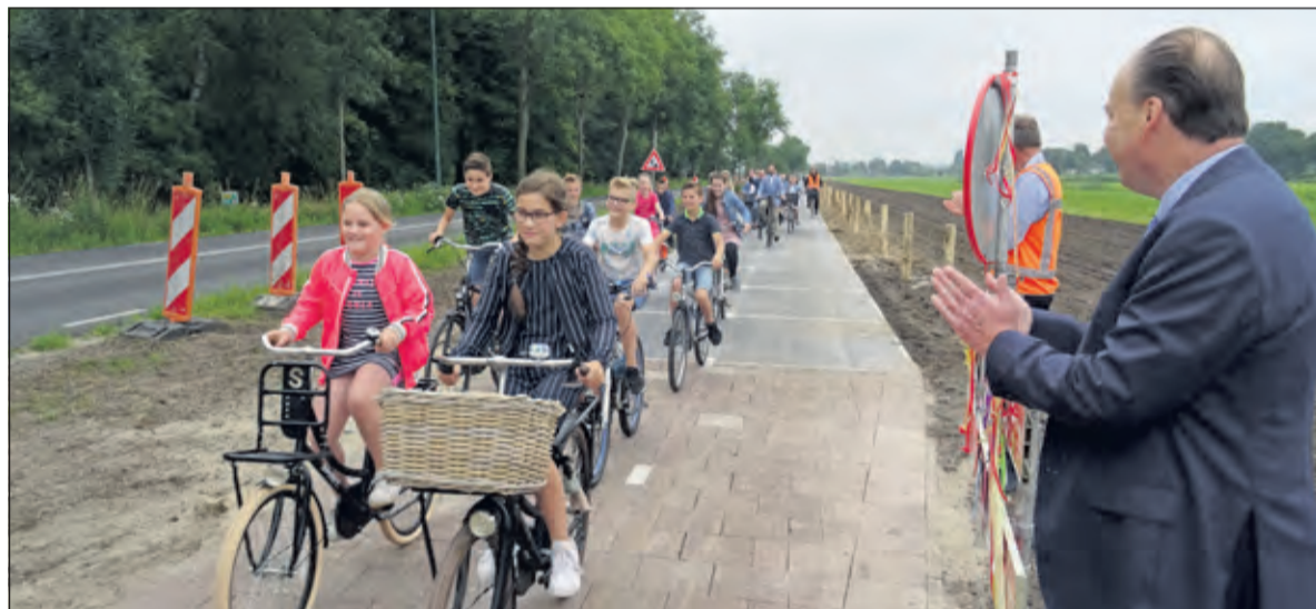
De leerlingen van groep 7 van de School met de Bijbel uit Maartensdijk rijden als eersten over het nieuwe zonnefietspad.

pad is comfortabel, voldoet aan alle veiligheidseisen en is vorstbestendig. Toekomstbestendig is het zonnefietspad ook, want de wegdekmodules zijn flexibel aan te passen met nieuwe en doorontwikkelde generaties zonnecellen.