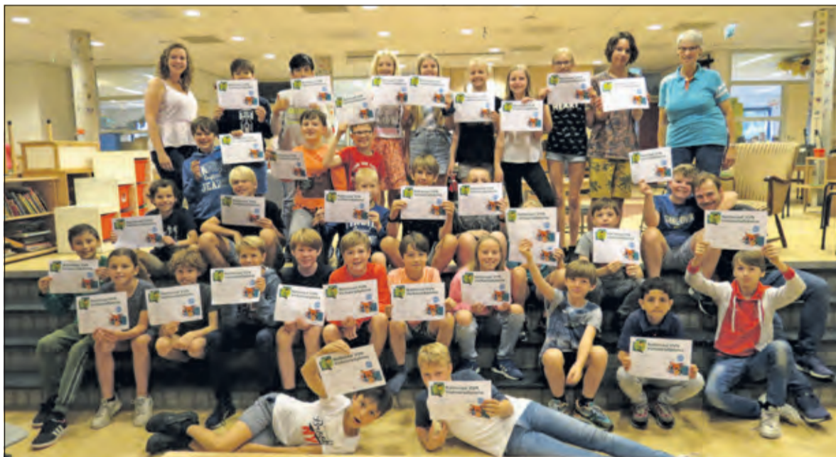
Trots tonen de kinderen van groep 7a hun behaalde diploma.

verkeersexamen in de gemeente wordt afgenomen door VVN De Bilt, die ook de route uitzet. Enny Doornenbal vertelt dat in de loop der jaren veel verbeteringen bij het uitzetten van de route zijn aangebracht. [GG]