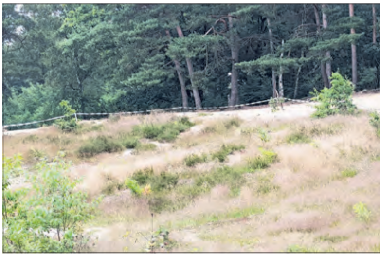
Het afgezette gebied.

Rob's vrouw Marga maakte een filmpje van een pluimvoetbij terwijl deze aan het graven was. Met haar pluimvoetpootjes groef ze achteruitlopend in het zand en maakte zo haar broedgang. Het filmpje werd – met een herhaald verzoek tot maatregelen – naar GNR getuurd. Binnen drie dagen stond er om de plaats waar de bijen zaten een keurige afzetting van paaltjes met lint. Niet dat rood/witte maar een bruin/groen/wit lint van het Gooisch Natuurreservaat.