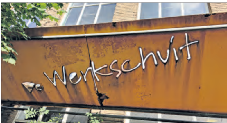
Alleen een fraai afdak boven de ingang herinnert nog aan de Werkschuitperiode.