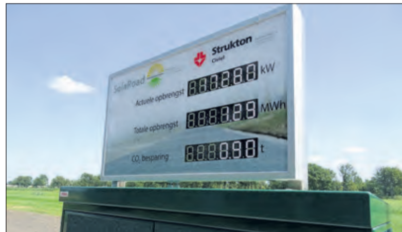
Op de meterkast is af te lezen hoeveel energie er is opgewekt en aan het netwerk wordt afgegeven.