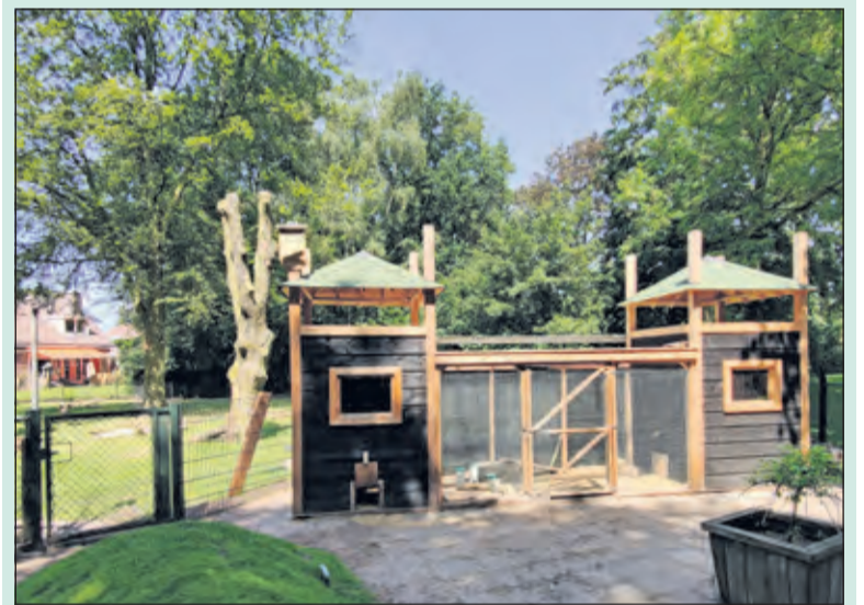
Stichting Dierenweide Maartensdijk is blij met het nieuwe konijnenverblijf.

Stichting Dierenweide Maartensdijk zou naast al deze verbeteringen graag ook de duiventil op de weide willen renoveren. Wie als vrijwilliger hierbij wil helpen kan een e-mail sturen naar info@dierenweide.nl . De dierenweide heeft inmiddels een officiële ANBI-status en de website dierenweidemaartensdijk.nl is vernieuwd.