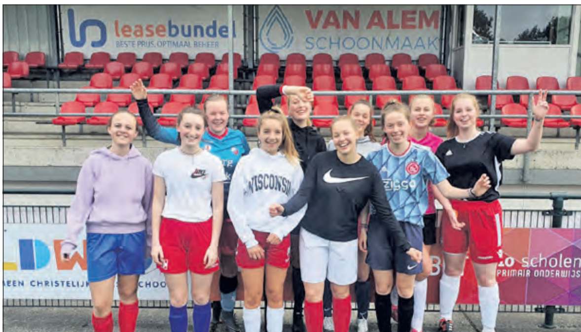
Dit zijn de meiden van FC De Bilt MO19-2.