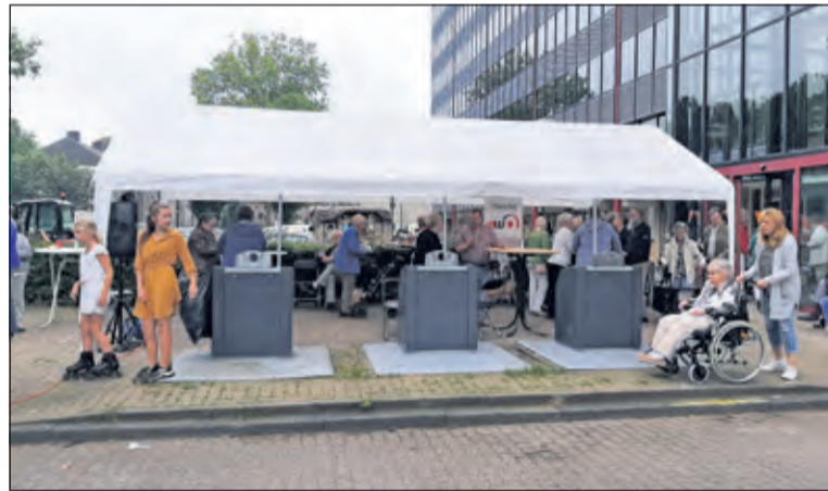
Bewoners van de Kometenlaan vieren het einde van de renovatie.

Bij het opleverfeestje aan de Kometenlaan werd de sleutel van de verbouwde Buurtkamer symbolisch weer overgedragen aan de vrijwilligers. Zij gaan de komende maanden met Mens De Bilt en bewoners aan de slag om de ruimten weer in te richten en een nieuw programma te maken voor ontmoeten en verbinden in de buurt. In de hoop dat de Buurtkamer in september weer open mag.