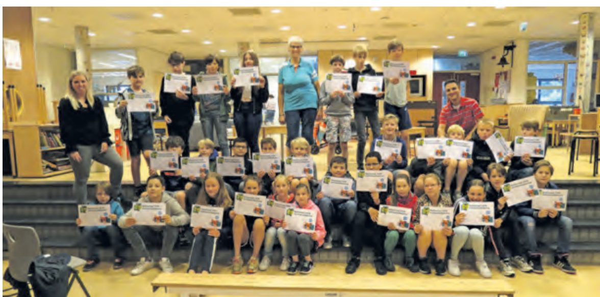
Leerlingen van groep 7b hebben ook hun diploma behaald.