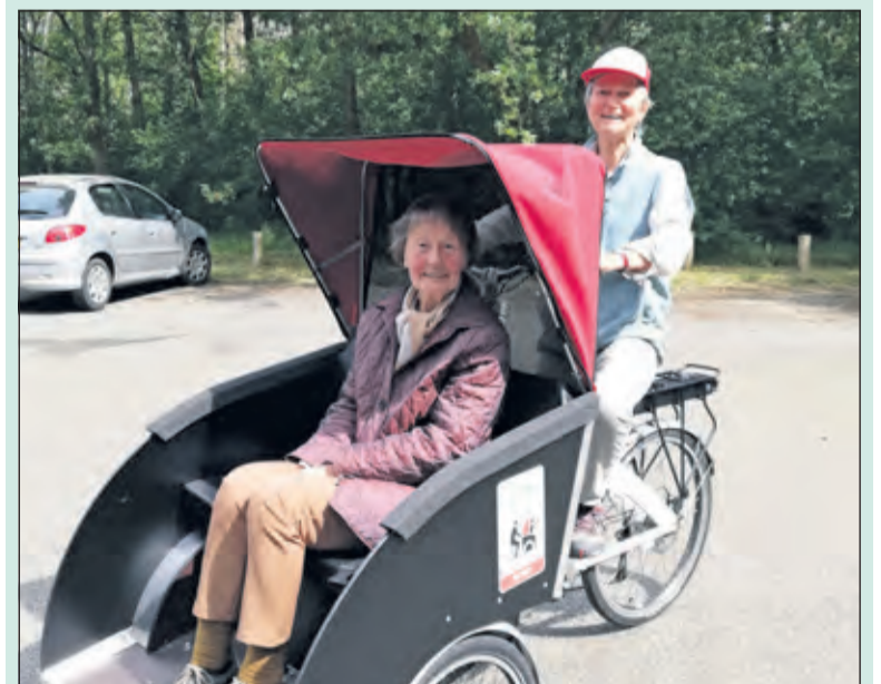
Zowel bestuurder als passagier zijn blij met de Riksja.

Heeft u interesse in een ritje met de riksja of kent u iemand die dat graag zou willen, aarzel niet en neem contact op met stichting Riksja De Bilt. Dat kan zowel via email (riksjadebilt@xs4all.nl) als telefonisch (06 34184509). Ook voor nieuwe vrijwilligers is plaats, zeker als straks de nieuwe fiets leverd is.