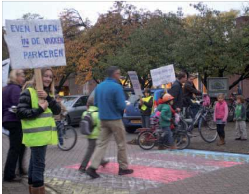
Naast aandacht voor de fietsen was er ruim aandacht voor verkeer in het algemeen.