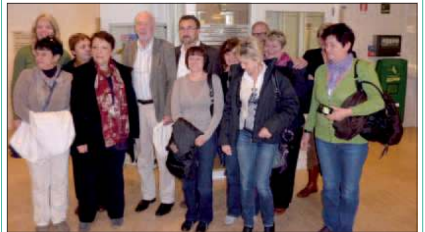
Bezoek aan Huisartsenpraktijk/Gezondheidscentrum aan de Hessenkamp in de Bilt.

Van 10 tot 15 oktober was een groep medewerkers uit de gezondheidssector van de Poolse gemeente Miescisko te gast. De Bilt onderhoudt een vriendschapsband met Miescisko en al twintig jaar zijn er warme contacten tussen de beide gemeentes.