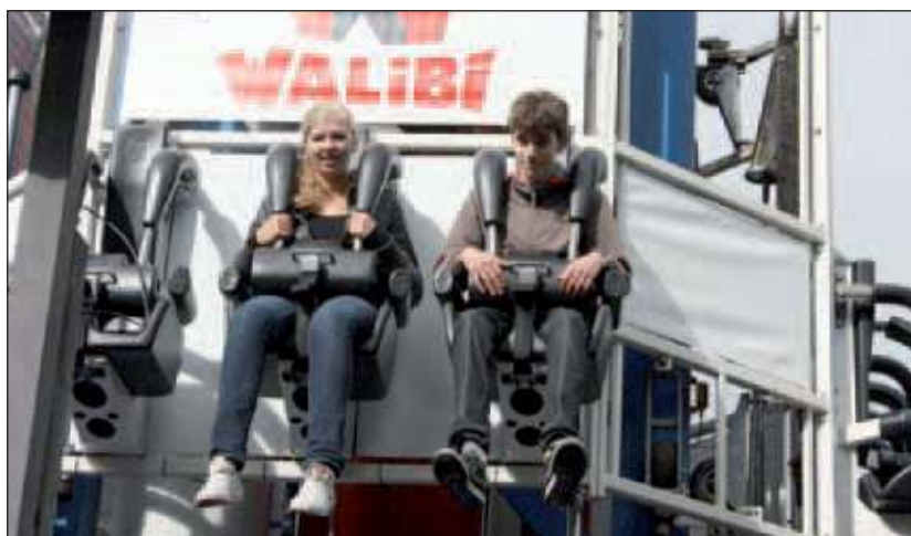
Modern leren in Walibi

De opdrachten die de leerlingen in Walibi hebben gemaakt, waren zeer divers; van een interview afnemen tot G-krachten meten in achtbanen. Alle gegevens werden verwerkt met behulp van formules die in de lessen voorafgaand aan de projectdag zijn besproken. Het gebruik van hun telefoon gaf een extra dimensie aan de