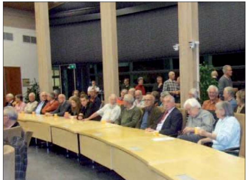
Belangstellenden uit de hele gemeente bezochten de voorlichtingsbijeenkomst over Burgernet.