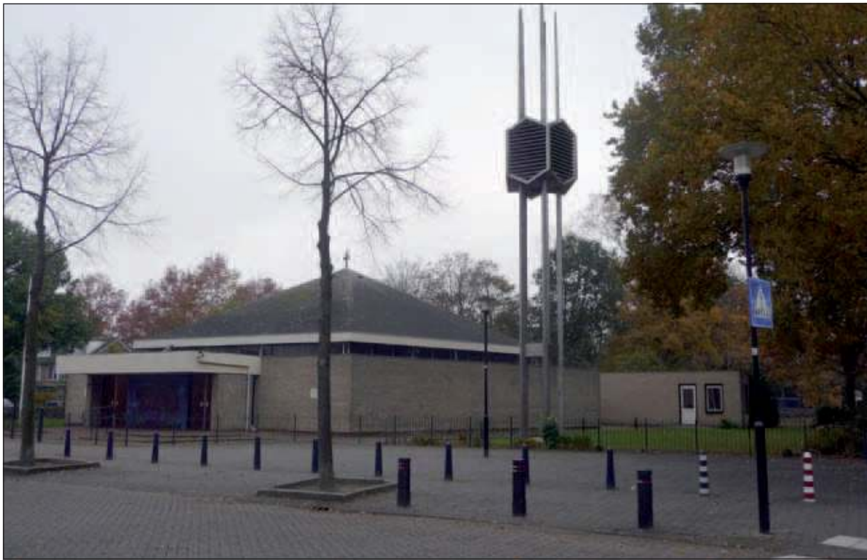
Zondag 6 november geeft het gelegenheidskoor een bijzonder tintje aan de ochtendviering in de RK St. Maartenkerk.