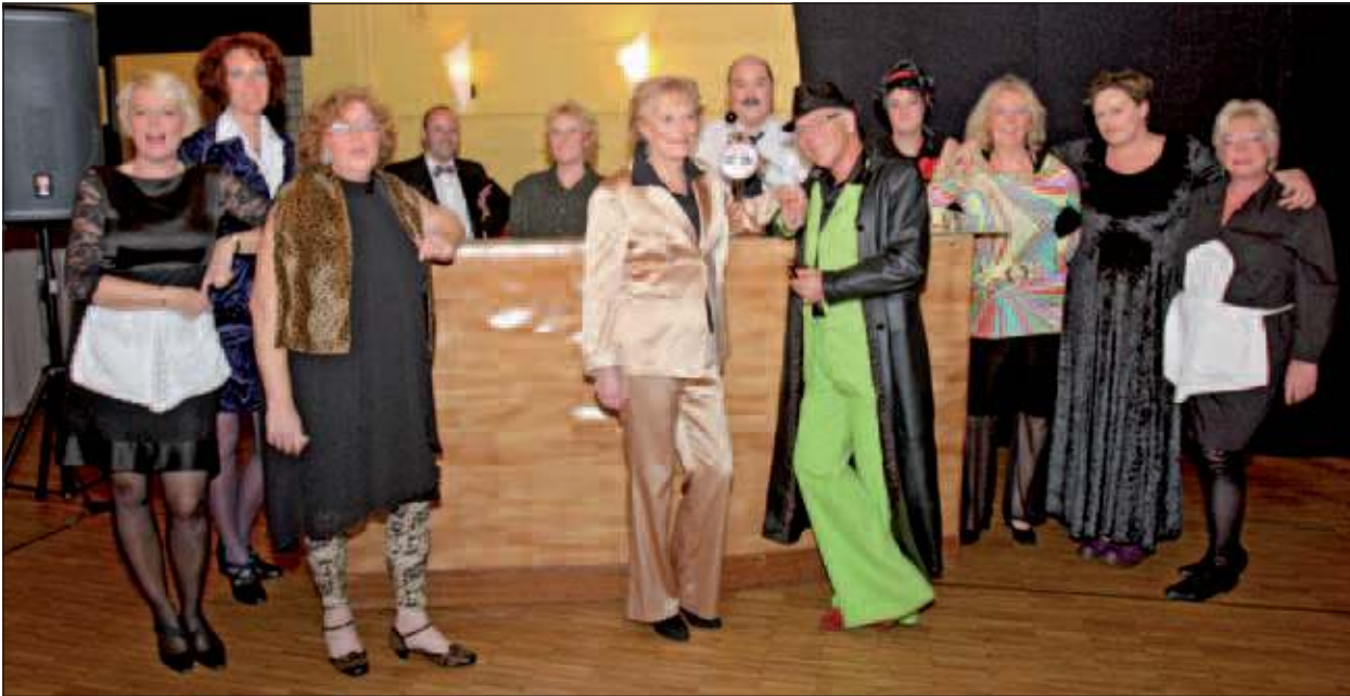
De cast van Sojater voor aanvang van de première op zaterdag 30 oktober jl.

Theatergroep Sojater uit Maartensdijk verzorgt in 2011 op de overgang van oktober en november vier voorstellingen in De Vierstee. Het decor voor deze voorstellingen bestaat uit een gezellig dorpscafé. Het is een intieme voorstelling, waarin veel wordt gezongen. Zaterdag 30 oktober was er voor een uitverkochte zaal de aftrap. Zondag 30 oktober volgde een druk bezocht matinee.