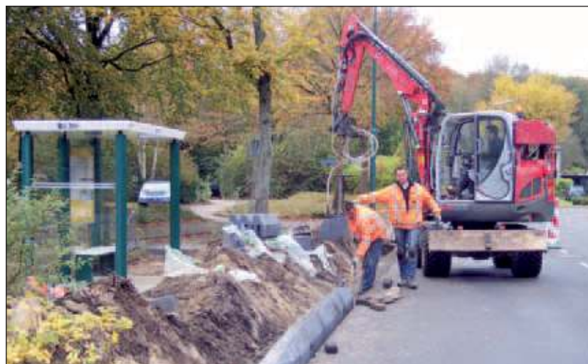
Momenteel wordt ook de bushalte ter hoogte van het Kromhoutkwartier aan de Berlagelaan in de Leijen aangepast waar over ruim een maand geen bus meer komt.