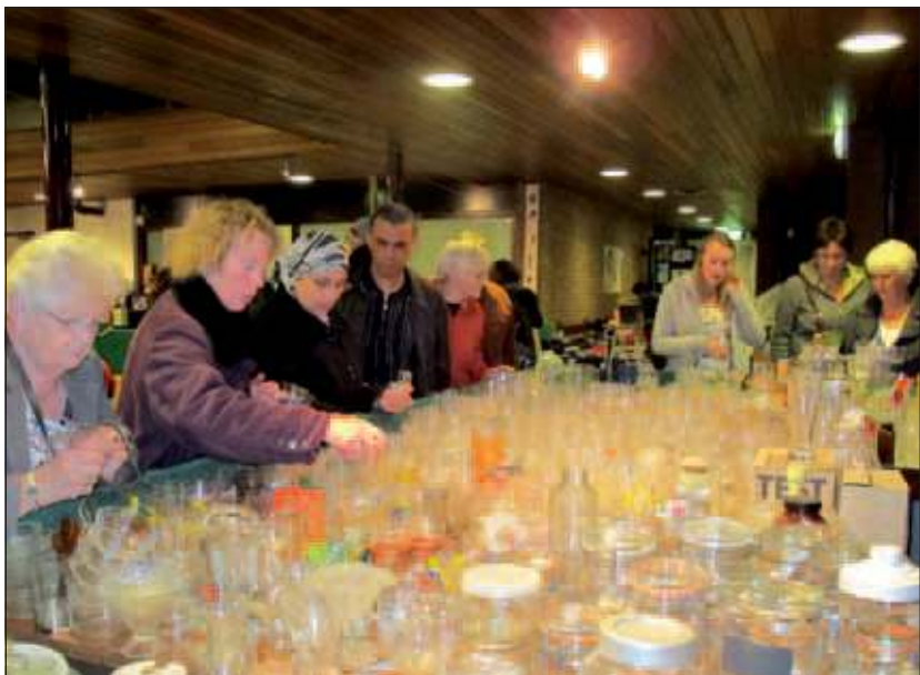
Het glaswerk blonk je tegemoet en er was veel belangstelling voor.

In het verleden konden bijvoorbeeld een bus, nieuwe verlichting, een geluidssysteem en nieuwe toiletten worden aangeschaft. Wie lid wordt van WVT - en dat kost maar heel weinig! - kan deelnemen aan allerlei activiteiten en cursussen die in het gebouw aan de Talinglaan worden georganiseerd. Nieuw dit jaar is dat kinderen tot 16 jaar met een U-pas gratis mogen deelnemen aan sportactiviteiten. Het eerstvolgende Repair Café, waar deelnemers onder begeleiding van experts hun kapotte spullen kunnen komen repareren, valt op zaterdag 19 november van 12.00-16.00 uur. [LvD]