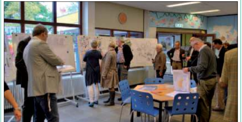
Er was gelijk al redelijke belangstelling voor het op 10 oktober geopende informatiepunt van het Melkwegproject.

In het informatiepunt kunnen belangstellenden terecht met vragen over het project Melkweg. Daarnaast zijn er de planning van de werkzaamheden, het ontwerp van het Cultureel en Educatief Centrum en het inrichtingsplan van de openbare ruimte te zien. In het informatiepunt wordt een animatiefilm afgespeeld, waarin de bezoeker meegenomen wordt door het plangebied in de toekomst om zo een goed beeld te kunnen vormen van hoe het er straks uit gaat zien. Naast het informatiepunt kunnen belangstellenden ook terecht op www.melkwegdebilt.nl .