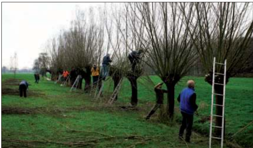
Wilgen knotten tijdens de natuurwerkdag vorig jaar.

In het Overbos, een onderdeel van het landgoed Vollenhoven wordt al decennialang multifunctioneel bosbeheer toegepast. In het deel met een verschralend grasland ligt een del waarin jonge elzen gestoken worden. Voor gereedschap wordt gezorgd. Na afloop is er koffie met een knabbel. Hier denkt men te werken van 9.00 tot 12.00 uur. Er is werk maximaal 15 personen en er zijn nog 8 plekken over. De locatie is Utrechtseweg 18 in De Bilt. Er wordt verzameld tegenover landgoed Vollenhoven aan de Utrechtseweg 18, De Bilt: ingang het Overbos. Parkeren op de parallelweg/fietspad. De Natuurwerkdag wordt georganiseerd door Landschapsbeheer Nederland in samenwerking met Natuurmonumenten, Staatsbosbeheer en Scouting Nederland en wordt ondersteund door IVN Vereniging voor natuur- en milieueducatie, Nederlandse Jeugdbond voor Natuurstudie (NJV), ANWB en KNNV vereniging voor veldbiologie.