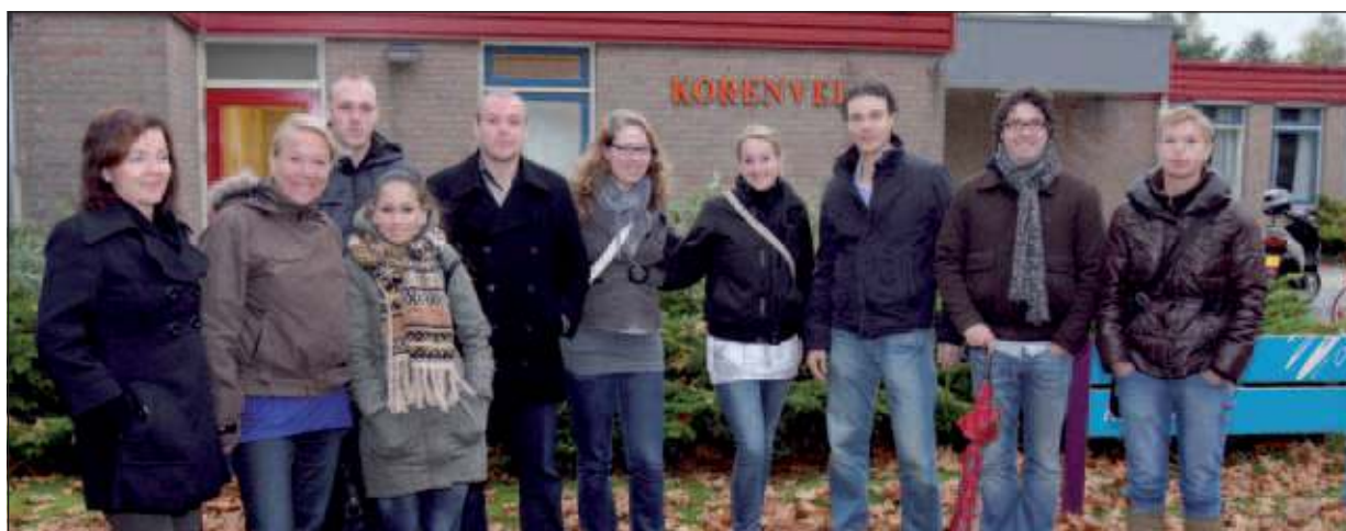
Medewerkers van de Biltse Rabobank voor het vertrek.

In het kader van maatschappelijk betrokken ondernemen ging een aantal medewerkers van de Rabobank Utrechtse Heuvelrug vestiging De Bilt op dinsdag 25 oktober een dag uit naar het Dolfinarium in Harderwijk met ca. 25 cliënten van De Linde (afdeling Korenveld) – Altrecht. De Linde biedt diverse vormen van klinische behandeling en begeleiding aan cliënten van zestig jaar en ouder. De behandeling is gericht op het verminderen van en leren omgaan met beperkingen in het dagelijks functioneren. Zo wordt de zelfredzaamheid vergroot en is de cliënt in staat om zo onafhankelijk mogelijk te functioneren. Deze match is ontstaan op De Beursvloer De Bilt dankzij Samen voor De Bilt.