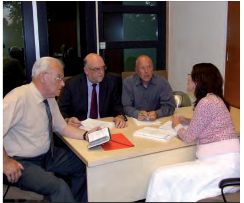
De D66-fractie voert overleg tijdens de schorsing.