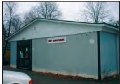
Nostalgie: het voormalig dorps huis in november 2003.

Deze twee bewoners stelden vast, dat de gemeenteraad op 24 januari 2008 een krediet beschikbaar heeft gesteld voor een vervolgonderzoek naar de haalbaarheid van een goed functionerend dorps huis in combinatie met andere functies. Hierbij heeft de gemeente naar eigen zeggen alleen de direct betrokken partijen gekend. De andere bewoners van Hollandsche Rading en de zeker de direct aanwonenden zijn gewoon vergeten. Sakia Sijbrandij: 'Het plan wat nu oorzaak is van veel commotie behelst het opzetten van een