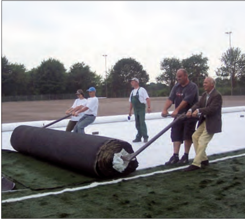
Wethouder aan de rol.

Daarna moest de wethouder het echte startschot geven. Een handje geholpen door een van de werknemers trok hij de zware rol, voorzien van een deken van kunstgras tot aan het einde over de voorbereikte verharde ondergrond. Bij de koffie daarna kon hij uitblazen.