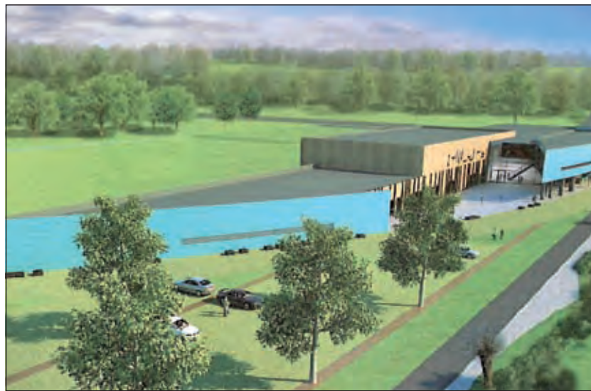
Zo kan het er volgens de brochure uit gaan zien.

Op dit moment geeft de gemeente jaarlijks zo'n 800.000 euro uit aan zwembad Brandenburg en het H.F.