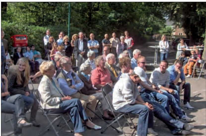
Er was grote publieke belangstelling.