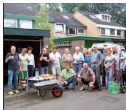
Halverwege de ochtend komen ze, in aangepaste kleding, te voorschijn voor de koffie. Daar wordt een tijdje gezellig gekletst en gelachen.

Deze burgeraanpak is begonnen toen in het najaar 2004 de gemeente De Bilt een bezuinigingsoperatie afkondigde m.b.t. het onderhoud van het openbaar groen in o.a. de gemeente Maartensdijk. De plannen van de gemeente De Bilt behelsden het omvormen van enkele tienduizenden vierkante meters struiken en bomen naar grasperken. Dit leidde tot grote onrust in de kern Maartensdijk. In