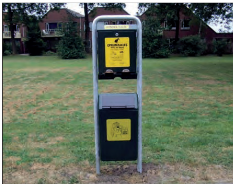
Als proef zijn in Maartensdijk enkele bakken voor hondenpoep geplaatst.