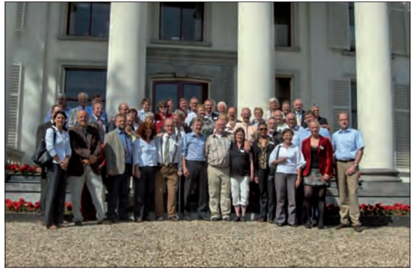
Onder de pilaren van Eijckenstein 'versamelt'.