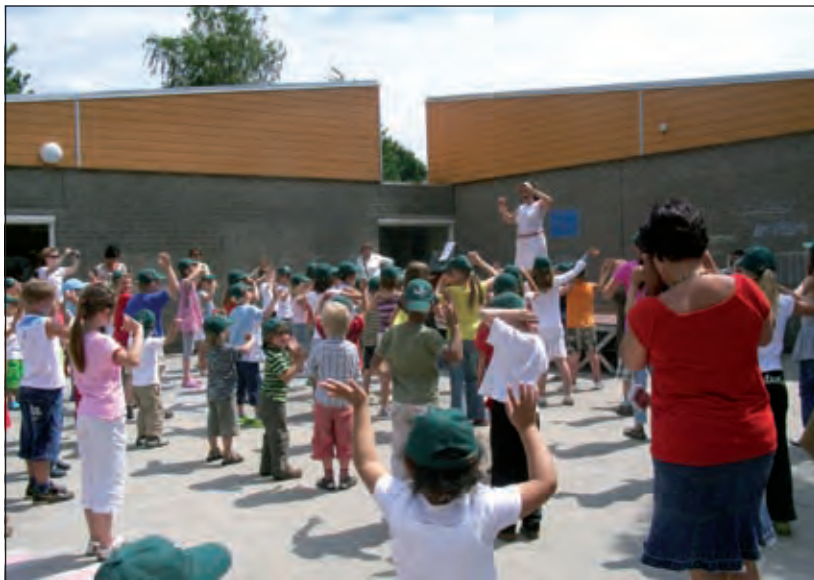
Vandaag is er, ter ere van de 15de verjaardag, feest in Hollandsche Rading.

Vorige week woensdag hebben 150 kinderen en ouders, die wel eens of met enige regelmaat gebruik maken van Buitenschoolse Opvang De Paddestoel in Maartensdijk gezamenlijk het 15 jarig bestaan gevierd. Het schoolplein van de Martin Luther Kingschool was omgetoverd tot een waar kinderparadijs. Er was een enorm springkussen, er was een echt podium dat gebruikt mocht worden om op te treden, een tent waarin theater centraal stond en er waren her en der verspreid speelplekken met onder andere spijkerbroekhangen, stokvangen en een stepfiets. Ook aan het eten en drinken was gedacht. [MD]