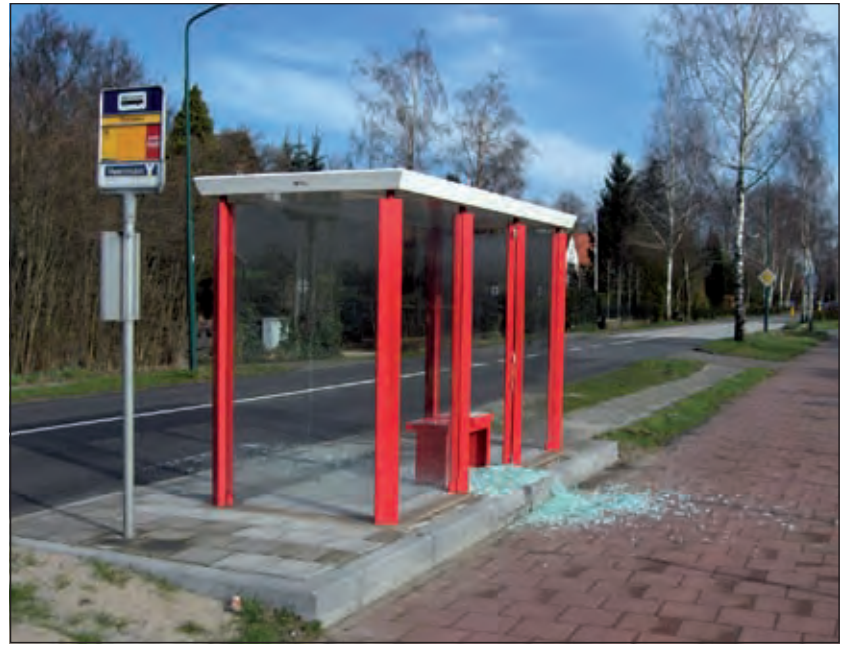
Het tegengaan van vernielingen is een gezamenlijke verantwoordelijkheid.

'Het gaat niet alleen over een groep jongeren op het schoolplein, ook