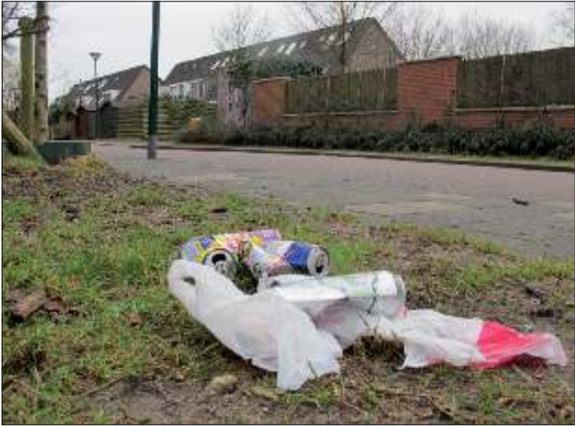
In De Leijen Noord zijn het niet zozeer de wijkbewoners zelf, maar de scholieren die voor veel zwerfvuil zorgen. De route tussen hun scholen en de supermarkt, langs het Kees Boekepad, ligt dagelijks bezaaid met afval.

Ondanks alle publiciteit heeft zich nog maar één inwoner van de gemeente De Bilt gemeld om mee te doen aan de Landelijke Opschoondag. Een ander reageerde enthousiast via de e-mail, maar heeft zich tot op heden nog niet opgegeven. Toch is het de bedoeling dat teams van vrijwilligers aanstaande zaterdag hun eigen wijk of dorpskern opschoonen.