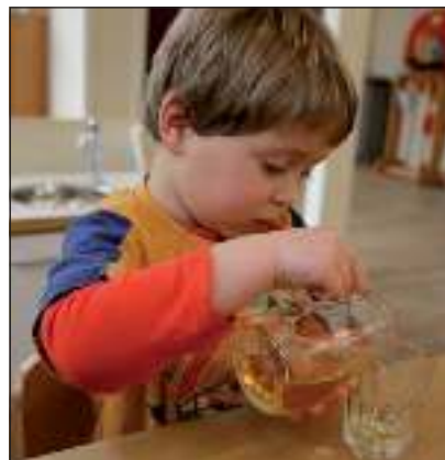
De Montessori Kinderopvang stimuleert zelfstandigheid van de peuters.

leiding die het kind helpt het zelf te doen. Ook de groepssamenstelling waar 0 tot 4 jarigen samen zijn, is kenmerkend. De ouderen leren verantwoordelijkheid te nemen voor de jongere kinderen en de jongere kinderen leren van de oudere kinderen. De kleinschalige groep geeft de leidsters de tijd om de ontwikkelingen van elk kind te observeren en elk kind op zijn eigen niveau te stimuleren. Ook is deze locatie erop ingespeeld dat ouders behoefte hadden aan peuterochtend-opvang en kinderopvang tijdens de schooltijden. Na het enthousiaste verhaal, trek ik mijn jas aan en zie ik naast me een grote peuter helpen met het aantrekken van de slossen van een dreumes. Bilthoven is weer een bijzondere kinderopvang rijker. Tijdens de opening op 15 maart is