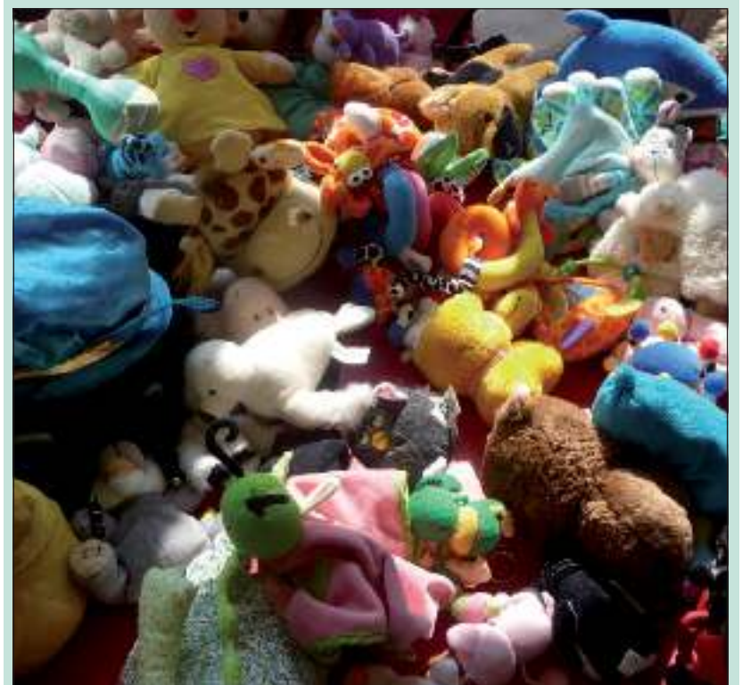
Ongetwijfeld zullen er tijdens de Kindermarkt op zaterdag 24 maart a.s. weer veel knuffels een nieuwe eigenaar krijgen.

Dat er gewerkt wordt aan het thema verkeer is duidelijk. Voor de klaslokalen staat een streep met haaiantanden. Voor de grap vraagt peuterleidster Ilona de Kok of ik wel goed naar links, rechts en weer links gekeken heb bij binnenkomst. Komende weken wordt er nog hard gewerkt aan een knutselwerk dat ouders tijdens de markt kunnen kopen. Verder is de verwachting dat er weer veel speelgoed en kleding aanwezig zal zijn. Overtollige kleding en speelgoed kan bij de peuterspeelzaal afgegeven worden op werkdagen tussen 8.00 en 12.00 uur.