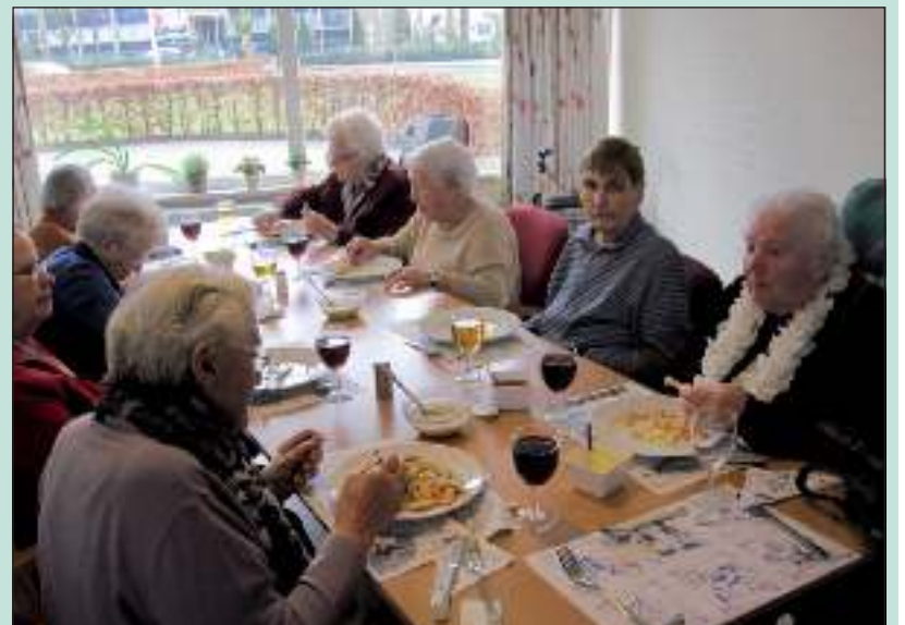
Bewoners laten het zich goed smaken. Velen hadden best plek voor een tweede, of zelfs een derde portie!