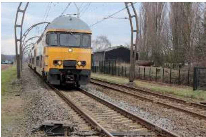
Vooralsnog zullen deze treinen niet in Maartensdijk stoppen.

Het tweede scenario, waarbij het Station Maartensdijk wordt geopend met behoud van het Station Hollandsche Rading, heeft de NS onderzocht op de inpasbaarheid binnen de dienstregeling en financiële haalbaarheid. De NS is daarbij uitgegaan van een stationslocatie ter hoogte van de Dorpsweg, waar naar inschatting het aantal potentiële reizigers het grootst is. Het onderzoek heeft uitgewezen dat binnen de huidige dienstregeling onvoldoende tijd beschikbaar is om een sprinter een extra stop te laten maken. Verder blijkt de vervoerswaarde te