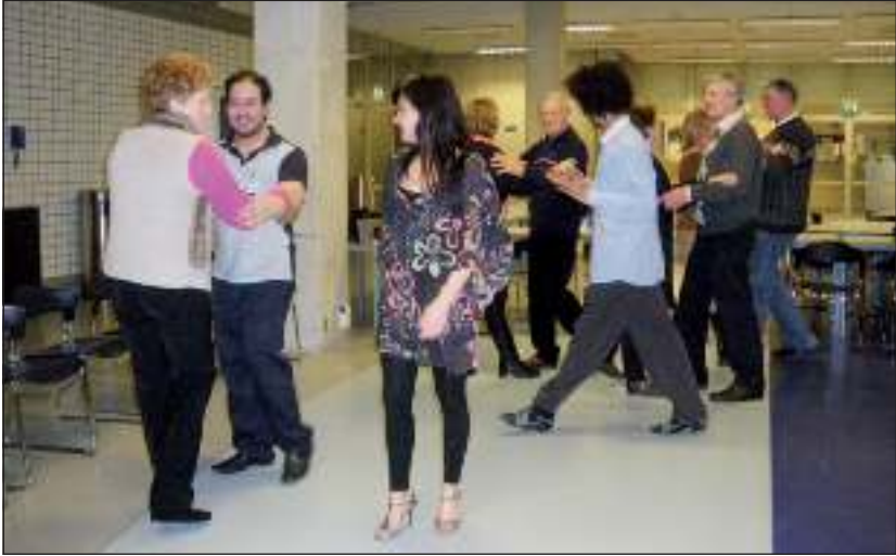
Bij een van de workshops tijdens de SMART-publieksdag leerden de deelnemers in het kader van meer bewegen de beginselen van de tango.

Op zaterdag 14 januari werd in samenwerking met de Nederlandse Hartstichting en de Hart & Vaatgroep een publieksdag gehouden voor deelnemers aan de SMART-studie (Second Manifestations of ARterial diseases). Daarnaast heeft de Hartstichting de landelijke campagne Tussen Lab en Leven opgezet, waarbij de noodzaak en nut van het doen van wetenschappelijk onderzoek onder de aandacht wordt gebracht.