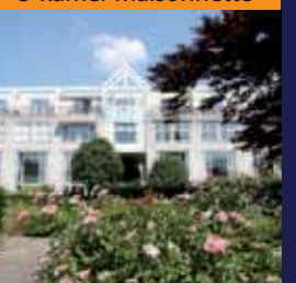
Clara Peeterslaan 23, Bilthoven 3-kamer maisonnette