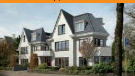
Nassaustaete, Bilthoven Luxe appartementen