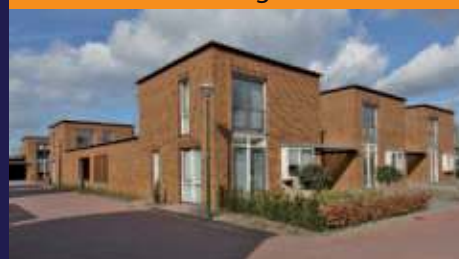
Park Brandenburg, Bilthoven Patio Bungalows