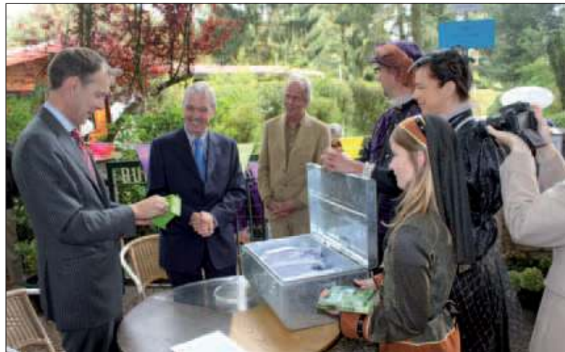
Door een ridderlijk echtpaar (en hun dochter) werden de steunbetuigingen aangeboden.

In de omgeving van Lage Vuursche en Maartensdijk komen wegen en gebouwen voor met 'Ridder' in de naam. Om de vraag naar de herkomst (van die naam) te kunnen beantwoorden moet ver teruggegaan worden in de geschiedenis en leidt het spoor o.a. naar een bisschop Guy, die in 1310 een groot gebied, waaronder de veengebieden van het huidige Lage Vuursche en Maartensdijk, aan de adellijke families Renes, Van Oostrum en Drakenburch schonk. Deze families mochten de titel van ridder voeren. De betreffende veenderijen werden vanaf die tijd de Riddervenen genoemd. Hierop gebaseerd is nadien sprake van de Ridderoordlaan, de