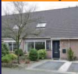
Jan Provostlaan 43, Bilthoven Middenwoning