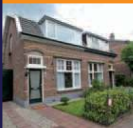
Kerklaan 89, De Bilt Helft van dubbel woonhuis