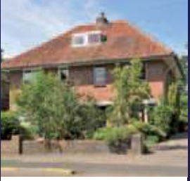
Paltzerweg 69, Bilthoven Helft van dubbel woonhuis