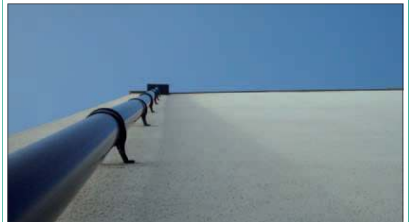
Voor zowel bedrijven als particulieren valt er geld te verdienen met het afkoppelen van regenwater.

Kijk voor meer informatie op www.destichtserijnlanden.nl , daar is ook een overzichtskaart te bekijken waarin is aangegeven welke delen van De Bilt subsidie kunnen ontvangen.