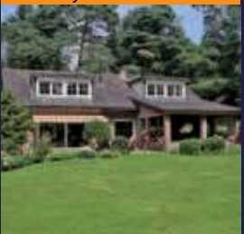
Hercules Segherslaan 14, Bilthoven Vrijstaande villa