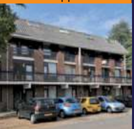
Albert Einsteinweg 87, De Bilt 2-kamer appartement