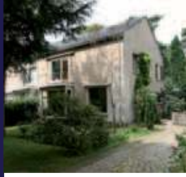
Julianalaan 103, Bilthoven Helft van dubbel woonhuis