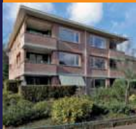
Ensaalaan 68, Bilthoven 3-kamer appartement