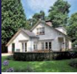
Vermeerlaan 7, Bilthoven Vrijstaande villa