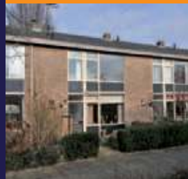
Halleylaan 14, Bilthoven Middenwoning