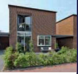
Kuifeendlaan 5, Bilthoven Patio Bungalow