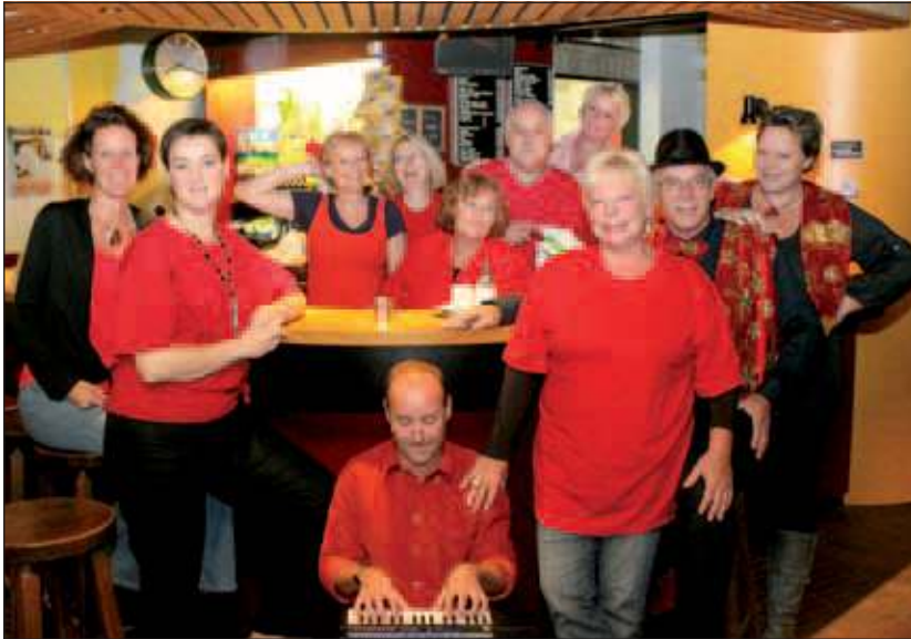
De bar van De Vierstee was vorige week woensdag een prima stageplek voor de cast van Sojater.

Natuurlijk loopt het weer uit op een licht chaotisch, maar heel gezellig feestje, waar de spelers een aantal rake typetjes neerzetten en iedereen naar hartelust mee kan zingen, lachen, eten en drinken. Sojater neemt u mee naar de feestzaal van het voor veel Maartensdijkers waarschijnlijk nog onbekende dorpscafé: Café Chantant L'ossetongue . Daar is een afscheidsfeestje georganiseerd voor twee dorpsbewoners, die naar De Grote Stad willen verhuizen. De gasten en de pianist zitten al vol verwachting klaar, maar de kroegbaas en het bedienend personeel zijn in geen velden of wegen te bekennen. Datzelfde geldt voor het zangkoor dat het feest muzikaal zal opluisteren. Gelukkig laat iedereen zich van zijn of haar beste kant zien: de pianist speelt bekende melodieën uit eerdere programma's en alle aanwezigen – ook de gasten – mogen de sterren van de hemel zingen. Voor de meezingteksten wordt gezorgd! Ook de bezongen thema's zijn zeer herkenbaar: van kleine dagelijkse ergernissen over te laat komen, te veel eten,