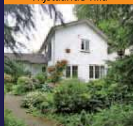
Wilhelminalaan 5, De Bilt Vrijstaande villa