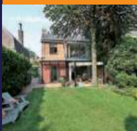
Looydijk 133A, De Bilt Vrijstaand woonhuis