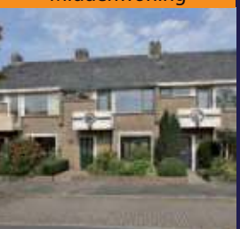
Prof. Dr. F. Zernikeweg 48, De Bilt Middenwoning