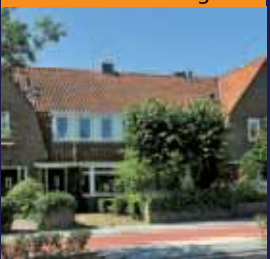
Groenekansegweg 113, De Bilt Middenwoning