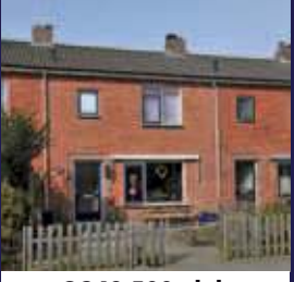
Koningin Julianalaan 60, Maartensdijk Middenwoning