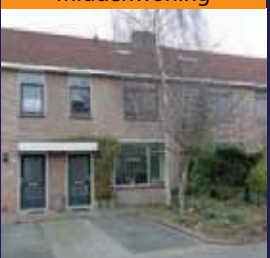
Agaatvlinder 10, Bilthoven Middenwoning