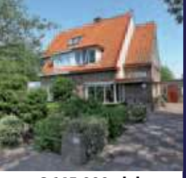
Koningin Wilhelminaweg 249, Groenekan Helft van dubbel woonhuis