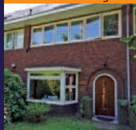
Burg. Van Heemstrakwartier 249, De Bilt Middenwoning