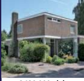
Groenekansegweg 34, Groenekan Vrijstaand woonhuis