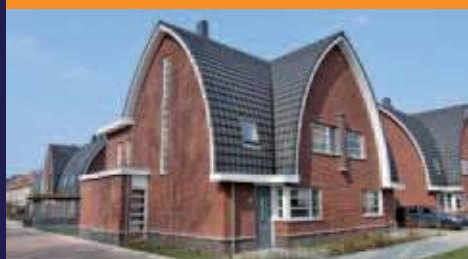
Plan Opgetogen, Maartensdijk Helft van dubbele woonhuizen