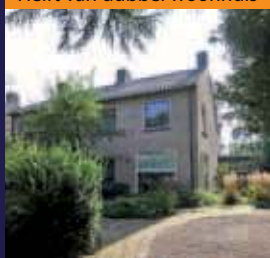
Dr. J. Röntgenlaan 54, Bilthoven Helft van dubbel woonhuis