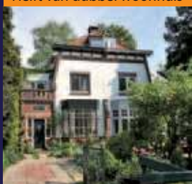
Tolakkerweg 23, Hollandsche Rading Helft van dubbel woonhuis