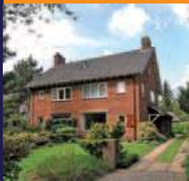
Gregoriuslaan 1A, Bilthoven Helft van dubbel woonhuis