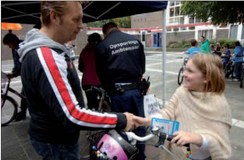
De meeste fietsen konden door de fietskeurmeesters van Veilig Verkeer Nederland, Mastwijk tweewielers en de politie beloond worden met de 'deze fiets is OK-sticker'.

Op woensdag 21 september zijn alle fietsen gecontroleerd van de leerlingen van groep 4, 5 en 6. Aan de hand van een checklist werd gekeken of alle onderdelen van de fiets in orde waren. Speciale aandacht was er dit keer voor de verlichting. Tijdens de 'donkere' dagen die weer gaan komen is 'goed gezien worden' erg belangrijk. Kleine reparaties werden gelijk gedaan door fietsmaker Mastwijk. In verband met de verkeersveiligheid is een veilige fiets erg belangrijk. De Regenboog is dan ook erg