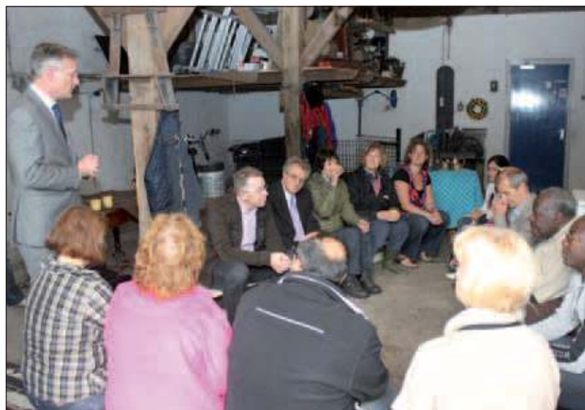
Mensen van Stichting Vluchtelingenwerk De Bilt en medewerkers van de Gemeente De Bilt bezochten gezamenlijk Zorgboerderij Nieuw Bureveld.

meijer boerderij Nieuw Bureveld met de mooie combinatie van een gangbaar agrarisch bedrijf en zorg voor mensen met een hulpvraag. Naast de dieren en de zorgboerderij houden zij zich actief bezig met natuur- en weidevogelbeheer. In samenwerking met lokale natuur- en milieueducatiecentra zijn complete boerderijprogramma's ontwikkeld voor de basis-