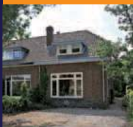
Kerkdijk 107, Westbroek Hoekwoning