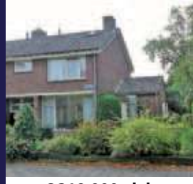
Koningin Julianalaan 23, Maartensdijk Helft van dubbel woonhuis