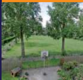
Abt Ludolfweg 9, De Bilt 4-kamer appartement