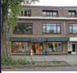
Julianalaan 18C, Bilthoven 2-kamer appartement