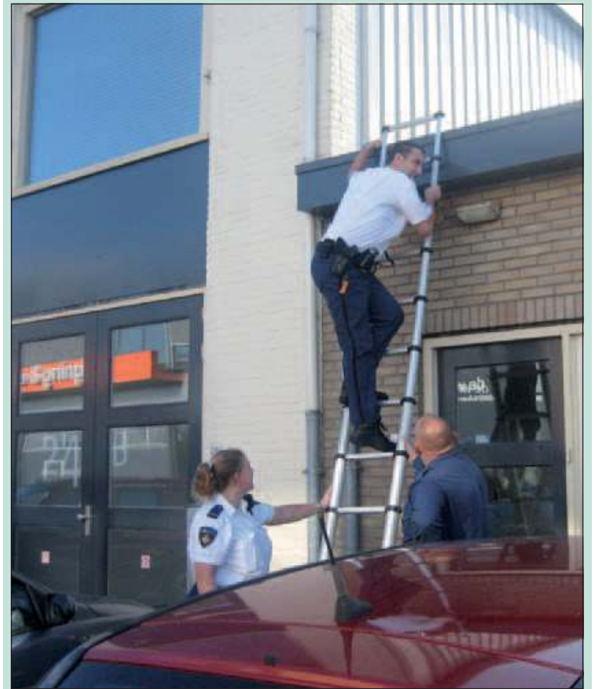
In afwachting van de sleutel, probeerde de politie alvast via het dak een kijkje te nemen.