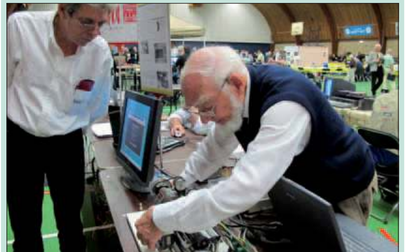
Een demonstratie van een draaibank die via een Conrad-kaart op USB werkt.

CompUsers, een Nederlandse vereniging met 20.000 leden, organiseerde zaterdag 24 september een gratis computer fair in het H.F. Witte Centrum. CompUsers helpt gebruikers van computers in de thuissituatie.