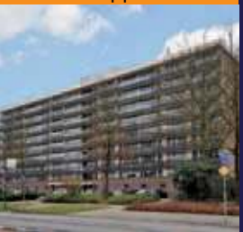
Groenlinglaan 70, Bilthoven 3-kamer appartement