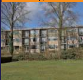
Abt Ludolfweg 85, De Bilt 3-kamer appartement