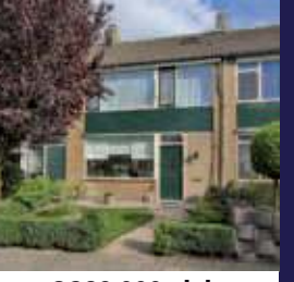
Prins Willem Alexanderplantsoen 9, Maartensdijk Middenwoning