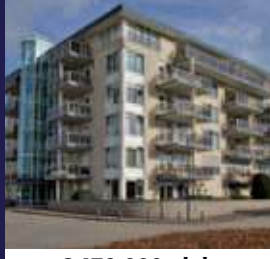
Dalplein 57, Soest 4-kamer penthouse