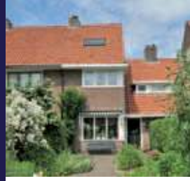
Oude Brandenburgerweg 93, Bilthoven Middenwoning