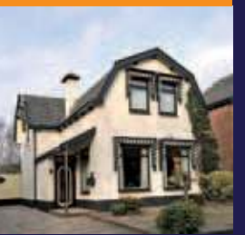
Kerklaan 65, De Bilt Vrijstaand woonhuis