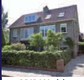
Copijnlaan 32, Groenekan Helft van dubbel woonhuis