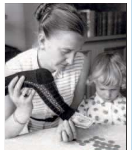
Een huisvrouw uit 1958 tovert voor de ogen van haar dochter geld uit een oude sok. Niet alleen muntgeld (voornamelijk guldens) maar ook een biljet van twee-en-een-halve gulden.

Lees het verhaal Kopen op de pof van winkelier Ad Baars uit De Bilt op onze website www.debiltschrijft.nl .