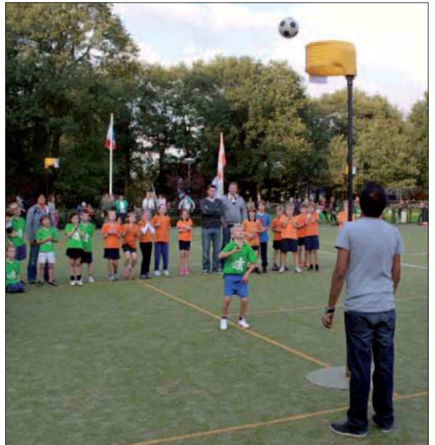
Vrijdag was er massale belangstelling zowel wat betreft de deelnemende ploegen als hun coachende en enthousiaste (groot-)ouders. Opmerkelijk volgens de organisatie hoe weinig beslissingen moesten worden geforceerd door het nemen van strafwerpen. [HvdB]