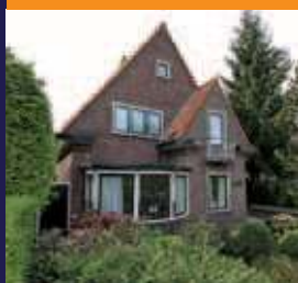
Kerklaan 97, De Bilt Vrijstaand woonhuis