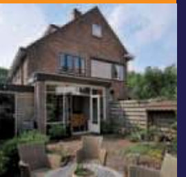
Hertenlaan 5, Bilthoven Helft van dubbel woonhuis