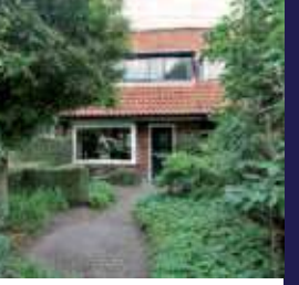
Pluvierenlaan 45, Bilthoven Middenwoning