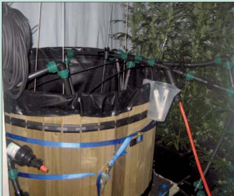
Een wietplantage in een pand aan de Industrieweg in Maartensdijk werd opgerold na een anonieme tip. Lees meer op pagina 3.