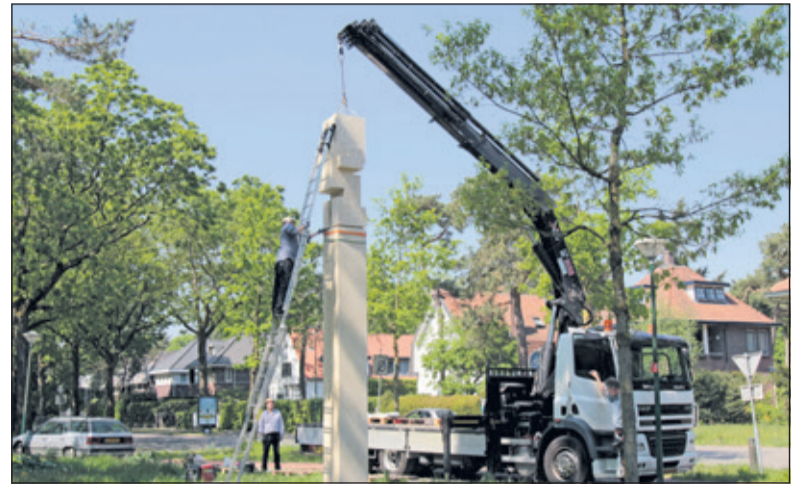
Plaatsing begin mei van de 'grenspaal' aan de Paltzerweg.

Op zondag 24 juni start om 13.00 uur in Amersfoort bij het Mondri-