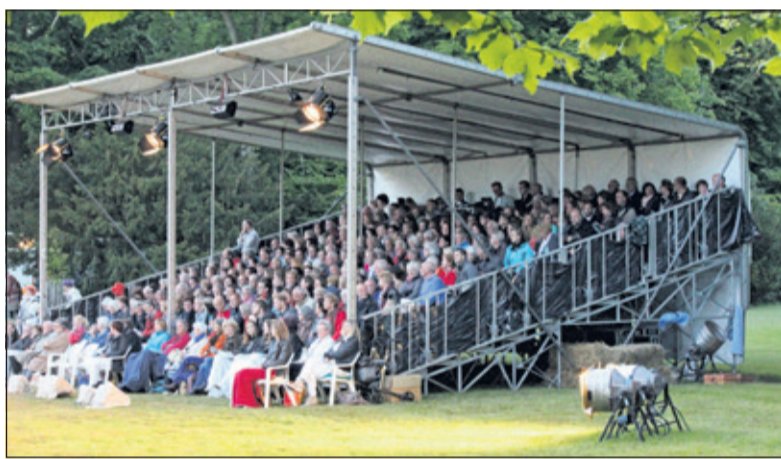
'Wat u maar wilt' (in 2013) op landgoed Eyckenstein was een publiekstrekker.

De nieuwe Theater in 't Groen voorstelling 'Penelope & De vos' speelt tussen 20 en 23 juni. op twee locaties in Groenekan. Informatie en reserveringen kan via www.Theaterinhetgroen.nl . Mensen die belangstelling hebben om-voor of achter de schermen-betrokken te zijn bij de voorstellingen kunnen mailen met: info@theaterinhetgroen.nl .