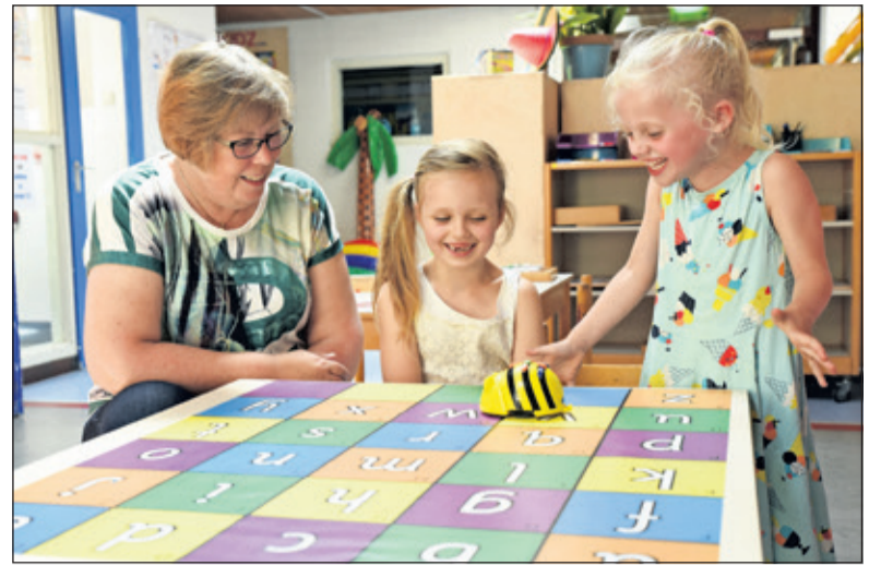
Kinderen leren vanaf groep 1 al spelenderwijs programmeren met de Bee-Bot.