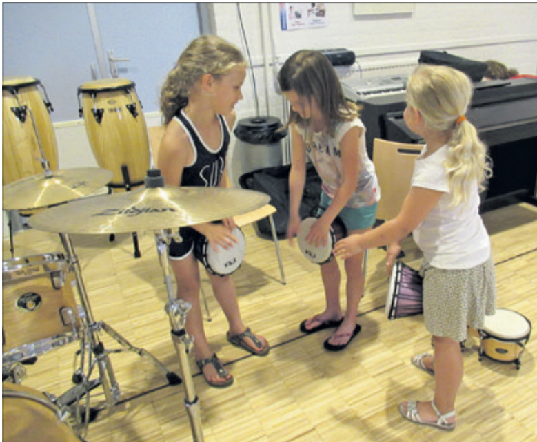
Er wordt goed geoefend met slaginstrumentarium.

Zaterdag 9 juni startte het Muziek Collectief Maartensdijk. In De Vierstee was de mogelijkheid om in workshops kennis te maken met het (be-)spelen van diverse instrumenten, waarna er de mogelijkheid was in te schrijven voor muzieklessen.