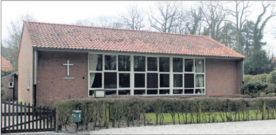
De Boskapel aan de Grothelaan 1.

kapel in de Grothelaan bezemt de buurvrouw de stoep van het kerkje. Ze zorgt al 35 jaar voor tuin en gebouw, vroeger samen met haar man tot zijn overlijden vorig jaar. Trots laat ze me het piepkleine kerkje zien. Veel glas en licht. Achter de kapel ligt de oude kleuterschool, dat is nu de kinderkerk. In de domineeskamer staat de antieke tafel, waarachter de dorpsdokter vroeger consultatiebureau hield. Elke zondag wonen ongeveer veertig mensen de dienst bij. De buurvrouw is gemeentelid maar gaat niet meer naar de dienst. 'Ik ben drie keer flauwgevallen in de kapel en dat geeft dan zo'n consternatie'. Ze beschrijft de verschillende smaken van het kerkelijk leven in Groenekan. 'Onze Boskapel is licht en de Dorpskerk is zwaar. En dan heb je nog de hele zwaren'.