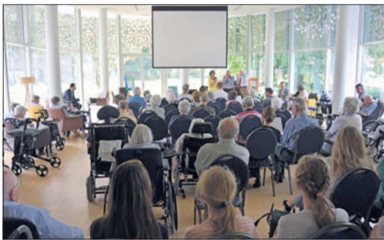
Woensdag 6 juni vond de opening plaats van de expositie Levensverhalen in Huize Het Oosten in Bilthoven, een project voor alle brugklassers van Het Nieuwe Lyceum.

In het kader van het Project Levensverhalen op Het Nieuwe Lyceum in Bilthoven interviewden groepjes leerlingen van Havo/VWO bewoners van Huize Het Oosten. De uiteindelijk ontstane, ingelijste portretten waren vanaf woensdag 6 juni door belangstellenden te bezichtigen in Huize Het Oosten.