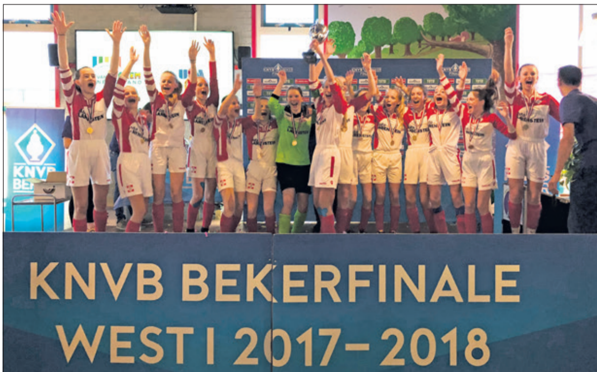
Eerste bekerwinst ooit voor een meidenteam bij FC De Bilt.