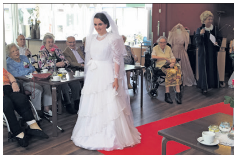
Bewoners van d’Amandelboom genieten van de bruidsmodeshow.