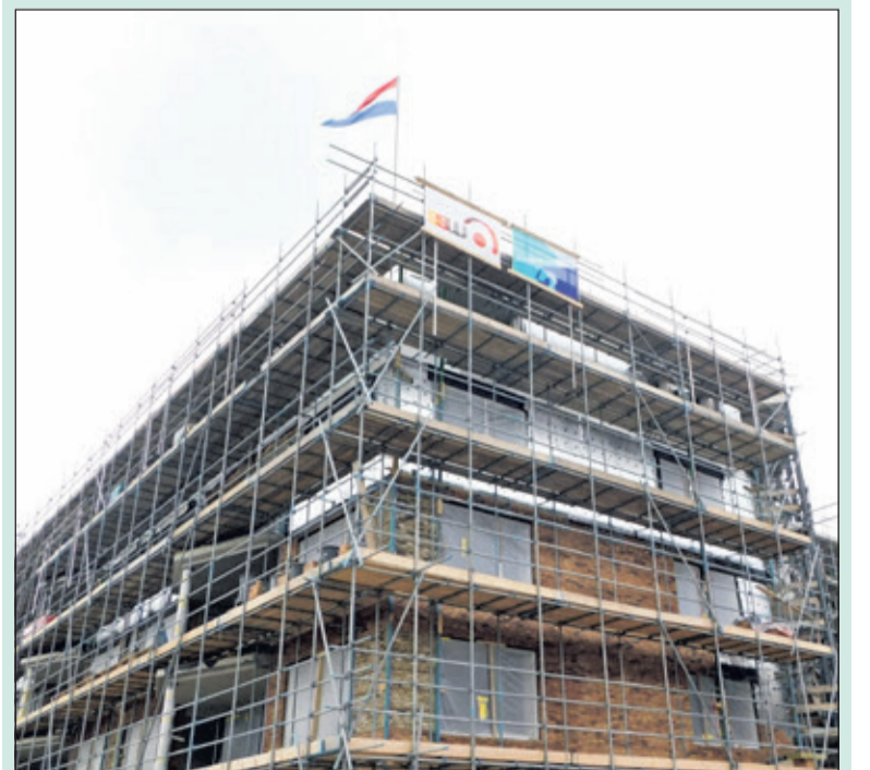
Vlaggen sieren de top van het nieuwe appartementengebouw De Leijen Zuid.