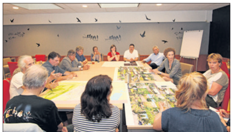
Na de introductie van het thema aan de hand van enkele voorbeelden gaan de deelnemers in twee gespreksgroepen uiteen.