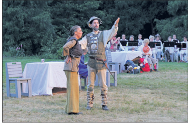
In 2017 speelde Theater in 't Groen in samenwerking met de KBH op landgoed Eyckenstein in Maartensdijk.

'De ruimte waar we spelen moet een integraal onderdeel van de voorstelling zijn. Mijn inspiratie komt bij theatergroepen als de Dogtroep of Vis-a-vis vandaan. Buiten kun je dingen doen die in een theater onmogelijk zijn: bootjes op een vijver, levende dieren. En de ervaring die het publiek krijgt als langzaam de avond valt, en het theaterlicht een dromerige, fantasievolle sfeer begint te scheppen... onvergetelijk. Zeker met als daar live bij wordt gezongen, of als er een sobere viool bij klinkt. Het is lichtvoetig, maar wel met diepgang, het is melancholiek, romantisch, ontregelend, spec-