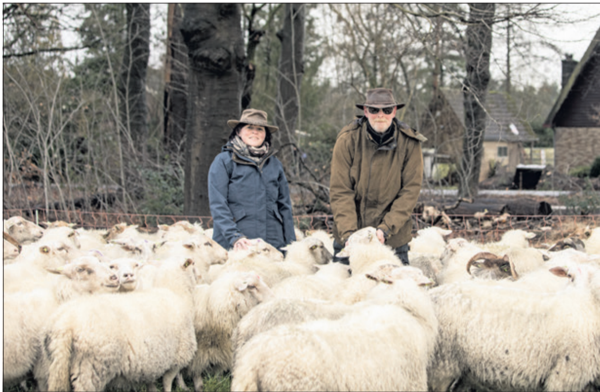
De zoektocht naar de perfecte graasplek voor de 260 schapen gaat nog even door.

dan gedacht. Begin dit jaar hoorden Werner en Ester Floor dat hun contract met het Utrechts Landschap niet werd verlengd en dat de 260