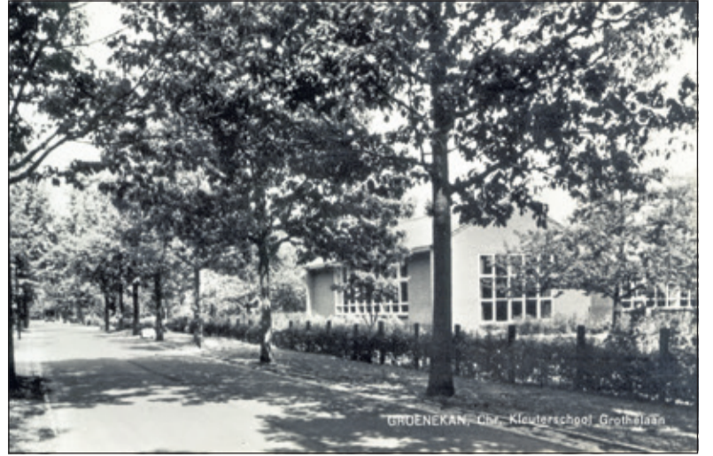
Een foto uit 1964 van de Chr. Kleuterschool aan de Grothelaan.

Na een paar jaar werd aan de kleuterschool een speel- c.q. gymnasietiekzaal aangebouwd en de gemeentesamenkomst verhuisde naar deze ruimte. Tot 1985 werd deze zaal voor elke zondagse kerkdienst omgebouwd tot liturgische ruimte. Dat was niet meer nodig toen in 1985 de kleuterschool sloot, omdat het kleuteronderwijs bij het basisonderwijs werd gevoegd. Nog in datzelfde jaar werd onder leiding van de Groenekanse architect Rob Brouwer deze ruimte omgebouwd tot een permanente kerkzaal en kreeg de naam De Boskapel'. Het kerkgebouw aan de Grothelaan is in beheer bij een afzonderlijke stichting ('De Springplank'). Behalve de kerk heeft ook de dagop-