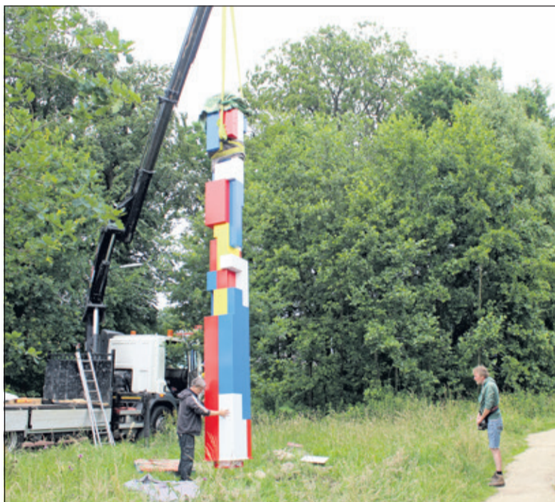
Plaatsing van het kunstwerk aan het Beukenlaantje.

Door verbeteringen aan de fietsinfrastructuur zal de 'De Stijl fietsroute' de komende jaren een nog snellere fietsverbinding tussen Utrecht en Amersfoort worden. Woon-werkverkeer op de (elektrische)fiets wordt zo aantrekkelijker. De route kan uiteraard ook gefietst worden als recreatieve tocht. Fietssers kunnen na het zien van de kunstwerken doorrijden naar het Centraal Museum in Utrecht of het Mondriaanhuis in Amersfoort en zich verder te verdiepen in De Stijl.