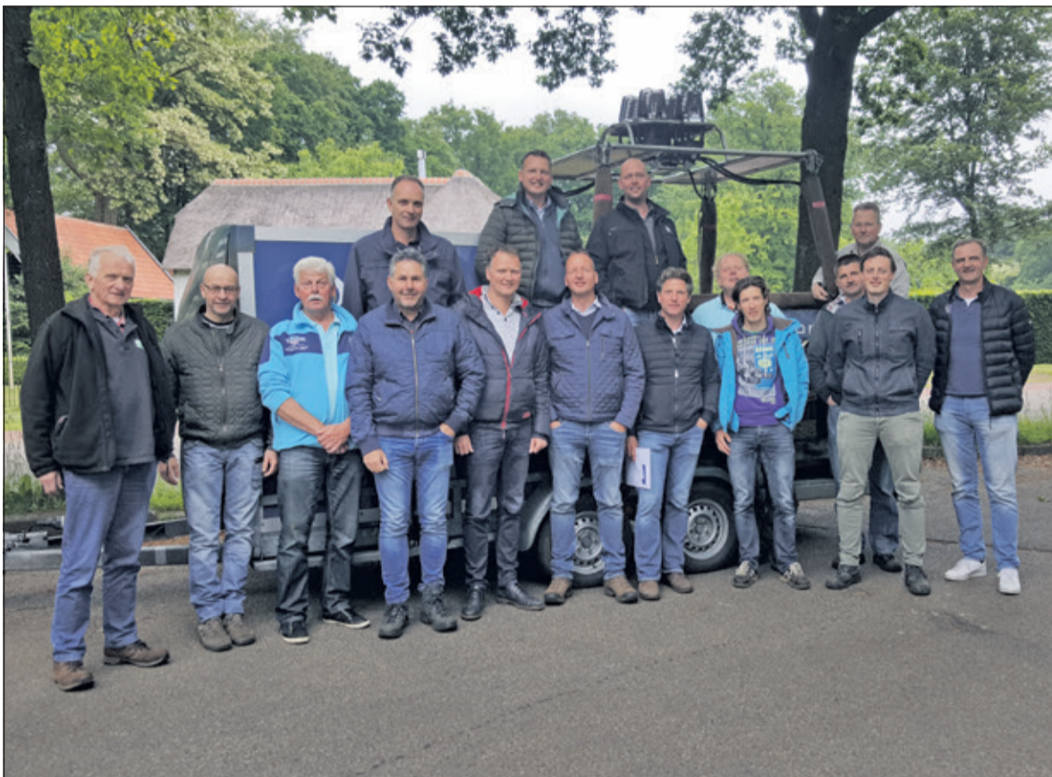
Bestuur + sponsors na ondertekenen contracten.