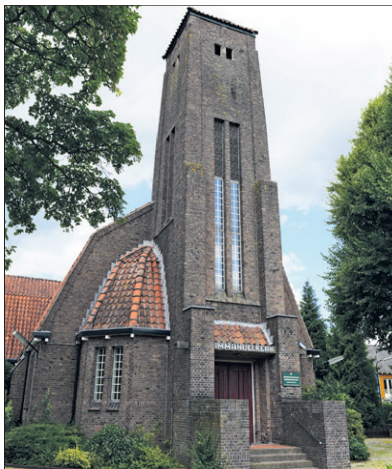
Vrijdag 15 juni wordt een afscheidconcert gehouden in de Immanuëlkerk.

pel uit Groenekan zal zich bij deze wijkgemeente van de PKN De Bilt aansluiten. Beide kerkgemeenten gaan in de komende maanden formeel fuseren. Voor de nieuwe wijkgemeente en het kerkgebouw aan de Eerste Brandenburgerweg wordt nog een nieuwe naam gekozen. Belangstellenden zijn van harte uitgenodigd het concert bij te wonen. De toegang is gratis en het concert zal ongeveer een uur duren. Na afloop is er gelegenheid na te praten onder het genot van een hapje en een drankje.