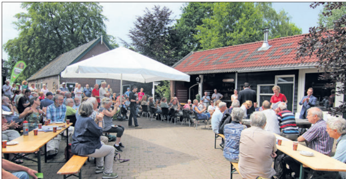
Een deel van de 10167 vrijwilligers was naar Museum Vredegoed afgereisd.

Landschap Erfgoed Utrecht ondersteunt vrijwilligers in Utrecht op vele manieren. Wil je je ook inzetten voor landschap en erfgoed in je eigen omgeving? Kijk dan eens op www.landschaperfgoedutrecht.nl . Of neem contact op met het Steunpunt Vrijwilligerswerk van Landschap Erfgoed Utrecht via: vrijwilligerswerk@landschaperfgoedutrecht.nl .