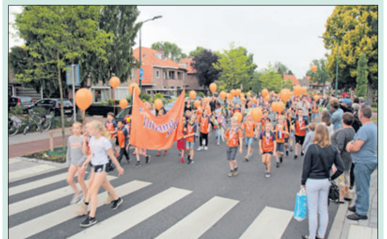
Vrijdag 8 juni was weer de traditionele intocht van de Avondvierdaagse op de Hessenweg in De Bilt. De Julianaschool liep er weer gekleurd bij.