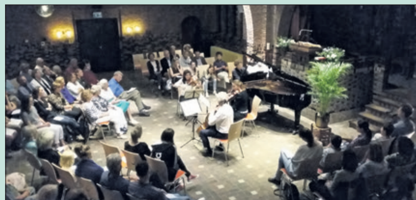
Intieme setting in de Woudkapel.