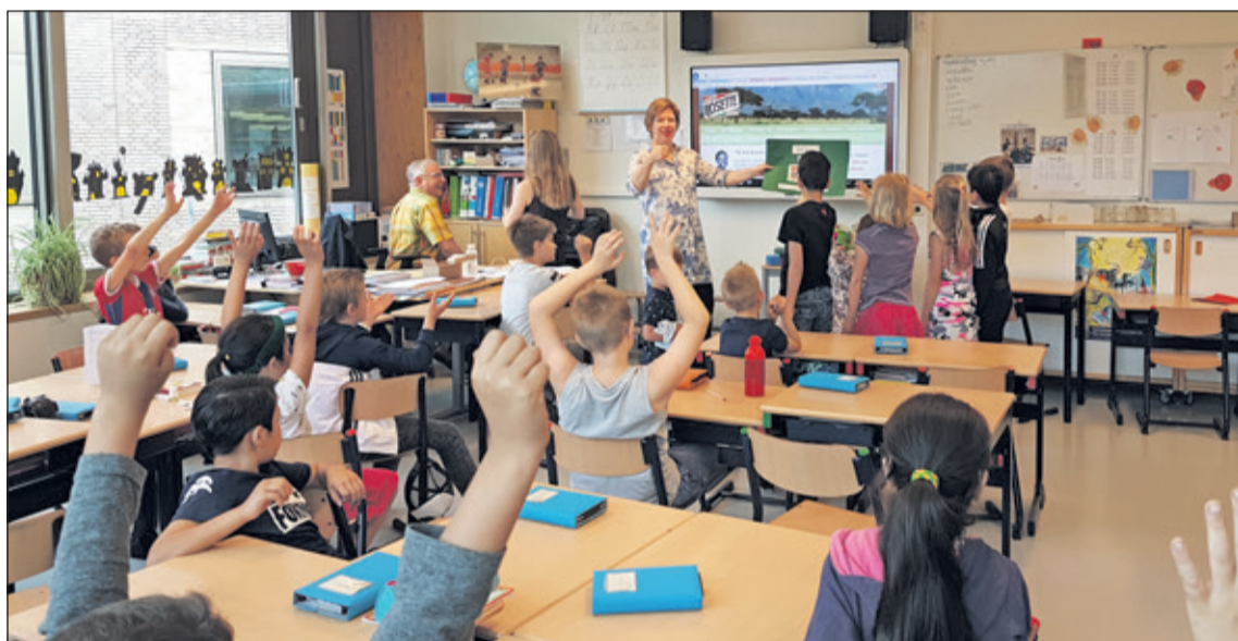
Kinderen van Wereldwijs juichen als ze zien dat hun wensster in vervulling gaat: een jaar lang onderwijs voor een kind in Uganda.