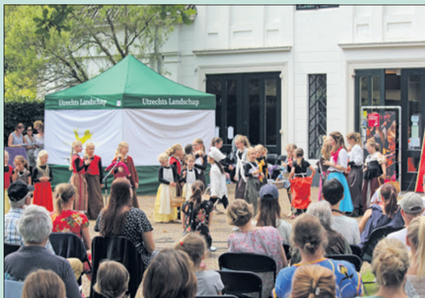
Veertig kinderen dansten, zongen en speelden met veel enthousiasme deze ontroerende familiemusical.