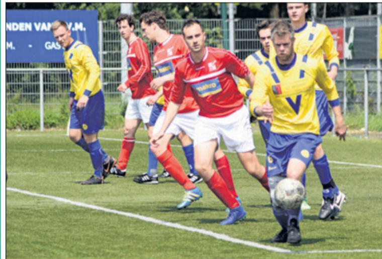
Volgens dit beeld van halverwege de 1ste speelhelft kan het nog alle kanten op in wat later bleek de voorlopig laatste wedstrijd in de 3de klas voor het Maartensdijkse SVM.

In de tweede ronde van de nacompetitiereeks is het doek dan toch gevallen voor SV Maartensdijk; de geelblauwe equipe van scheidend trainer Kevin de Liefde was niet opgewassen tegen het Utrechtse DVSU en verloor niet alleen de wedstrijd (0-2) maar ook het derde klasse-schap.