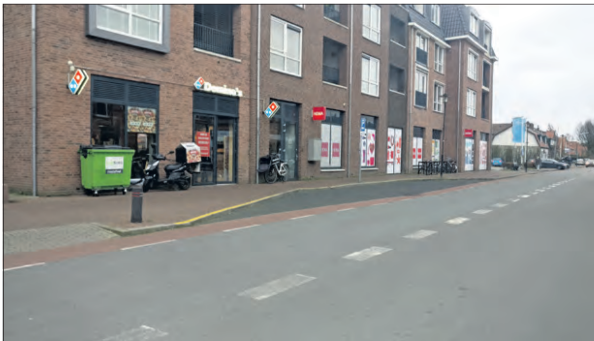
Het rapport geeft een goed inzicht over o.a. de laad- en losplek op de Looydijk, ter hoogte van de Hema.

wij deze mening niet'. Eén van de overige bewoners laat weten: 'Ons woongenot en de verkeersveiligheid tellen niet mee, het algemeen belang van AH staat bovenaan'.