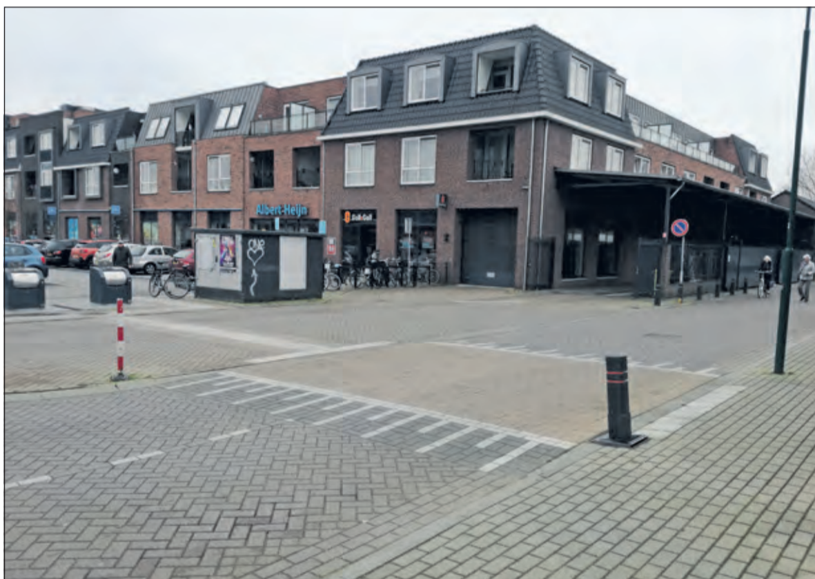
In het rapport van RH staat niets vermeld over de blinde-geleide-strook en over de glas- en vuilniscontainers.

In september 2018 gaf de 'adviescommissie bezwaarschriften' de omwonenden gelijk. Een maand later - in oktober - vroeg gemeente De Bilt een second opinion aan bij Royal Haskoning DHV (RH), uitgevoerd door een verkeerskundig