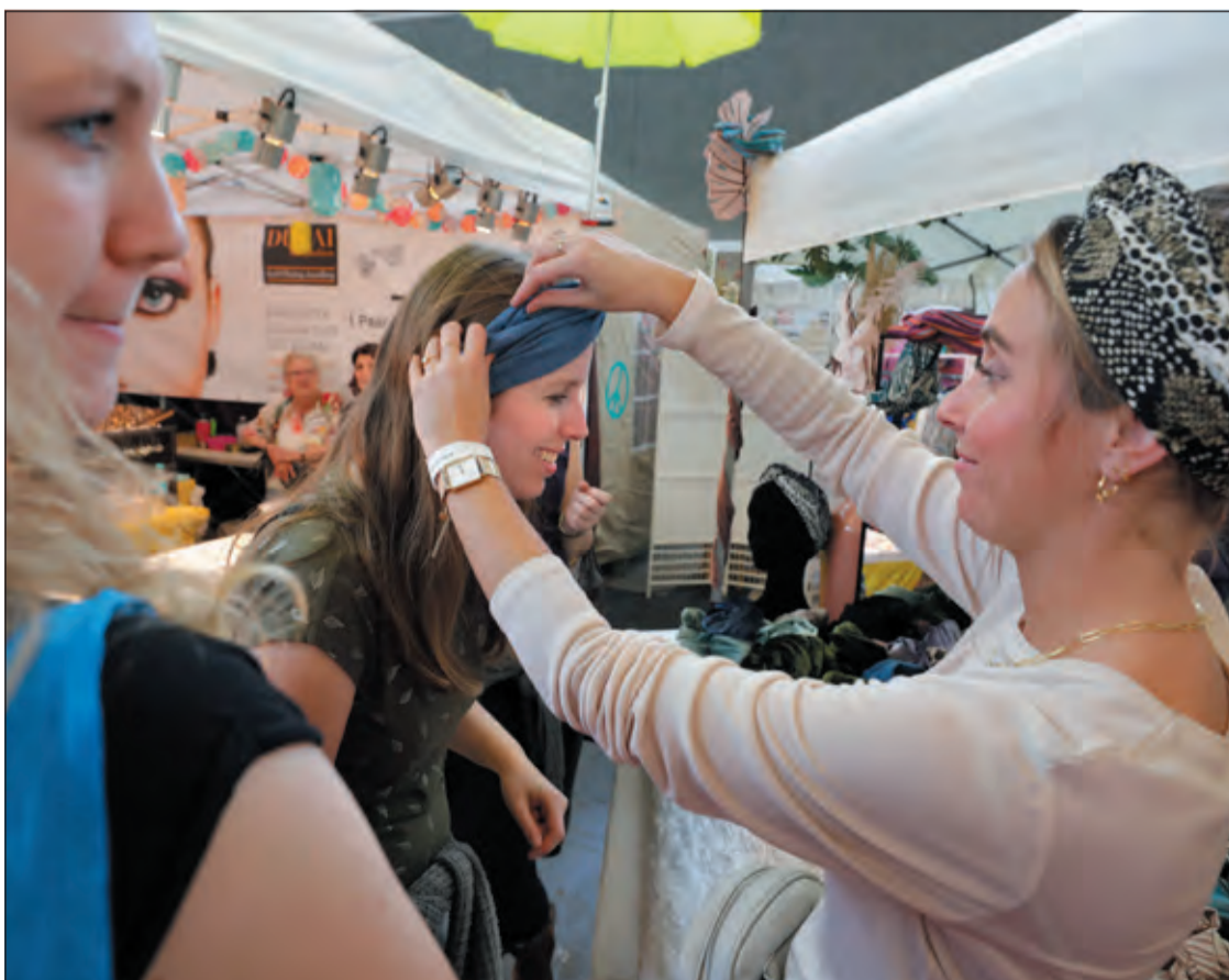
De huishoudbeurs is uitgegroeid tot een lifestyle evenement voor de moderne vrouw.

Voor de lezers van De Vierklank is een aantal kaarten beschikbaar. Om hiervoor in aanmerking te komen stuurt u een mail naar info@vierklank.nl met in het onderwerp 'rai75'. De kaarten worden onder de inzenders verloot. Iedereen ontvangt bericht.