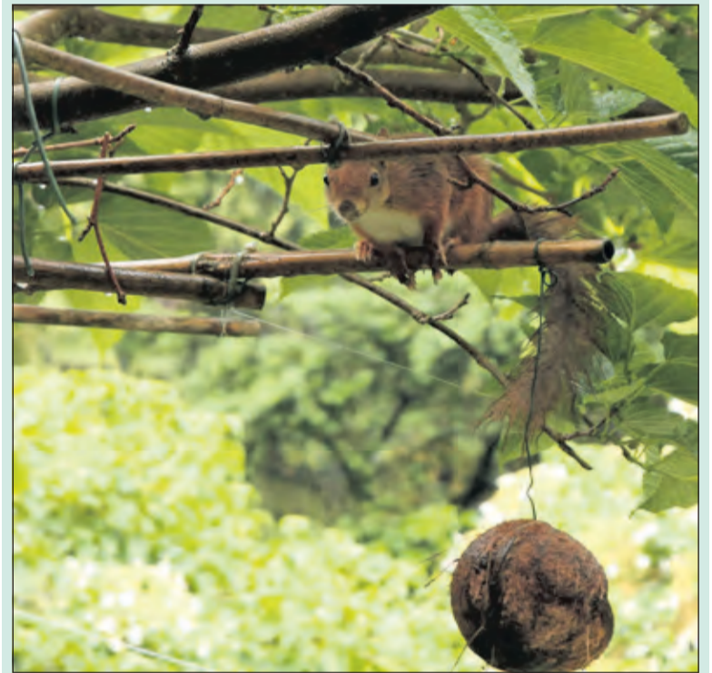
Een vergroende tuin biedt ruimte aan welkome gasten.

Werkgroep Operatie Steenbreek De Bilt is een samenwerking van vrijwilligers van Groei& Bloei afdeling De Bilt en IVN-afdeling De Bilt e.o. én de gemeente De Bilt. Zij hebben de handen ineengeslagen om Operatie Steenbreek onder de aandacht te brengen en bewoners daarbij te ondersteunen bij vergroenen. (Joke Schreuder-Borkent)