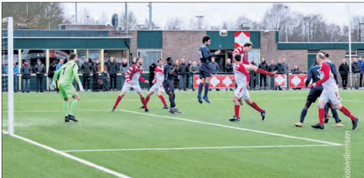
Een spelmoment uit FC De Bilt-Roda '46.

In het laatste halfuur kon het echt alle kanten op, maar het bleef 1-1. Voor beide ploegen slechts een punt, terwijl drie punten verdiend waren. Roda kan in de volgende thuiswedstrijd alsnog de tweede periode pakken en FC De Bilt kan op 7 maart thuis tegen AFC weer een poging wagen om de laatste plaats af te staan.