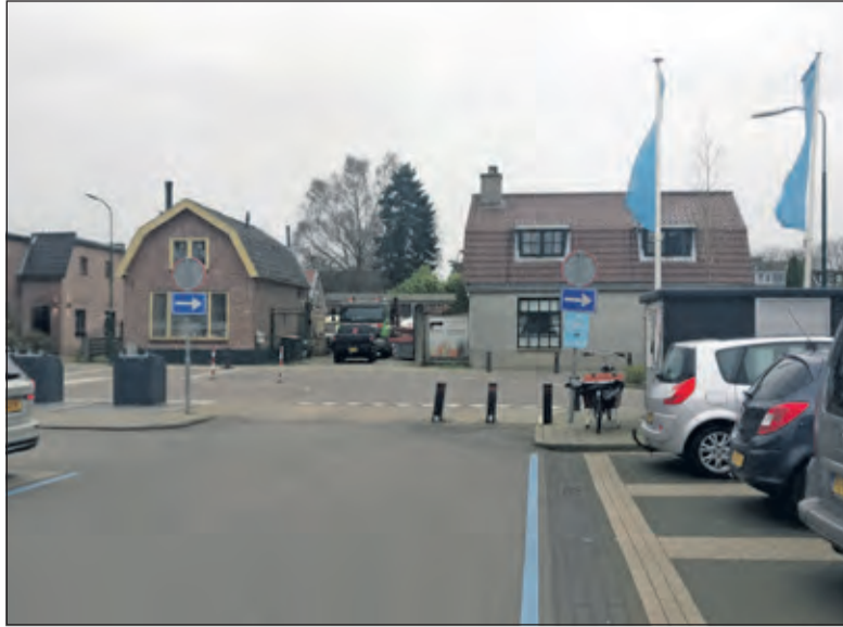
Op het parkeerterrein van AH tweemaal dit bord; C04-R. Eenrichtingsweg; Rechts?

'Waarom heeft de gemeente geen advies gevraagd aan de verkeersspecialisten van de politie?', vraagt de oud-medewerker zich af. 'Deze