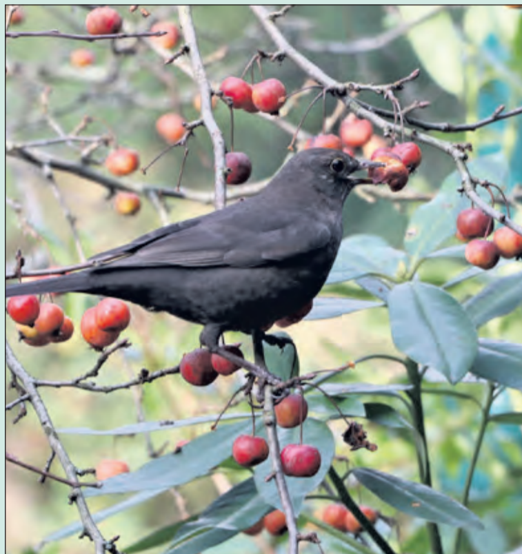
Vrijwilligers van Steenbreek geven advies over het ontsteden van tuinen. Lees meer op pagina 3.

twee onafhankelijke verkeersspecialisten vinden deze situatie onveilig'. Het rapport geeft een goed inzicht over o.a. de laad- en losplek op de Looydijk, ter hoogte van de Hema. Hier wordt veelvuldig gebruik gemaakt door voertuigen, die deze plaats gebruiken om te parkeren en niet om te laden/lossen. Bij chauffeurs wekt dit tot irritatie. Zij kunnen immers niet op deze plek laden/lossen.