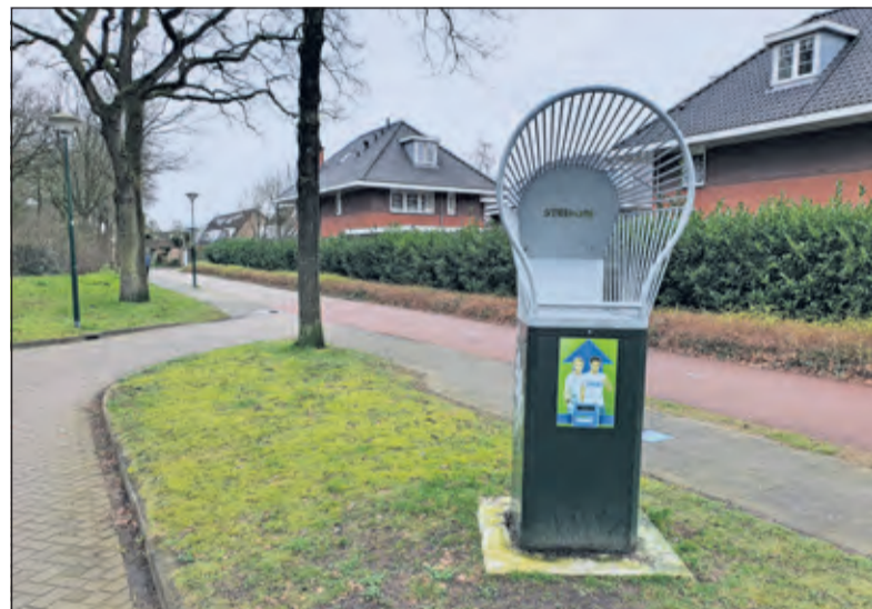
Langs de Snoeproute werden in 2013 nieuwe prullenbakken geplaatst.

Bij vervolgoverleg tussen de gemeente, de school en de Wijkraad werd de wens geuit om bij de verdere uitvoering van het afvalprogramma van de school te kunnen beschikken over afvalgrijpers. Wethouder Andre Landwehr overhandigde daartoe op 13 februari 25 afvalgrijpers aan Kindergemeenschap De werkplaats