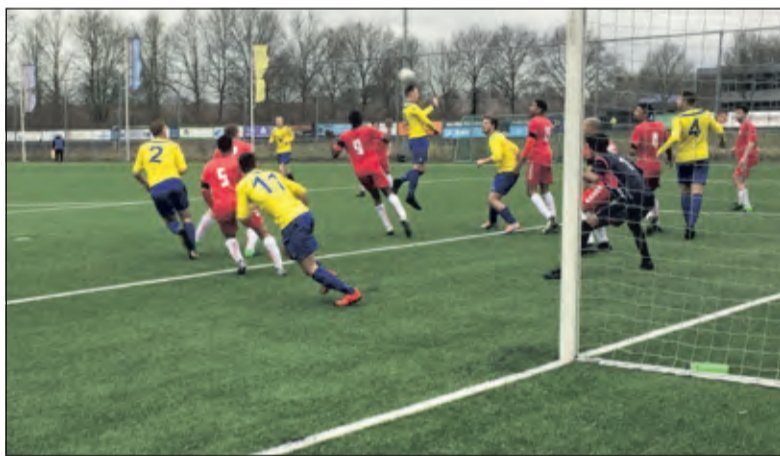
Een drukte van belang in het strafschopgebied van de bezoekers.