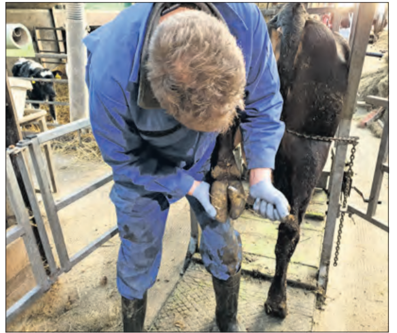
Op de boerderij is altijd wel iets te doen.