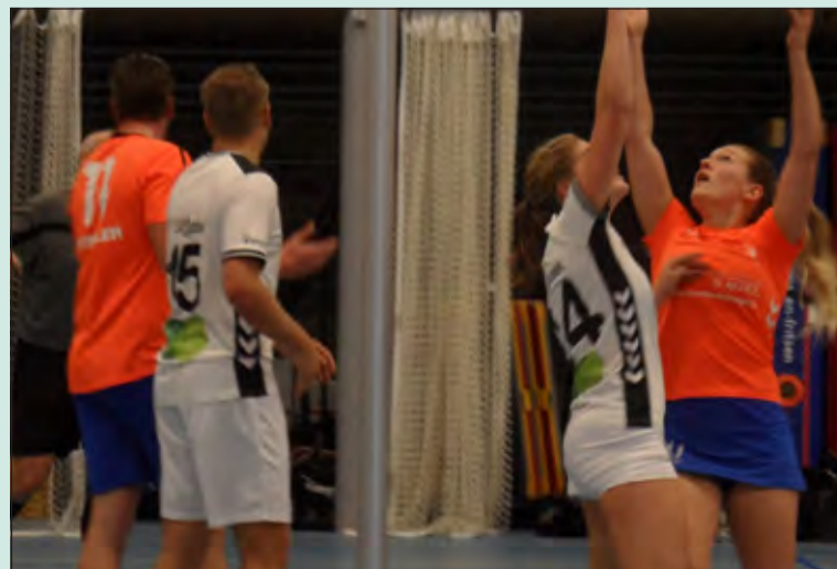
DOS en de Meeuwen zijn aan elkaar gewaagd.

Vanwege de voorjaarsvakantie zijn er de komende twee weken geen competitiewedstrijden. DOS hervat zaterdag 7 maart de competitie met een thuiswedstrijd tegen OWK, aanvang 20.25 uur.