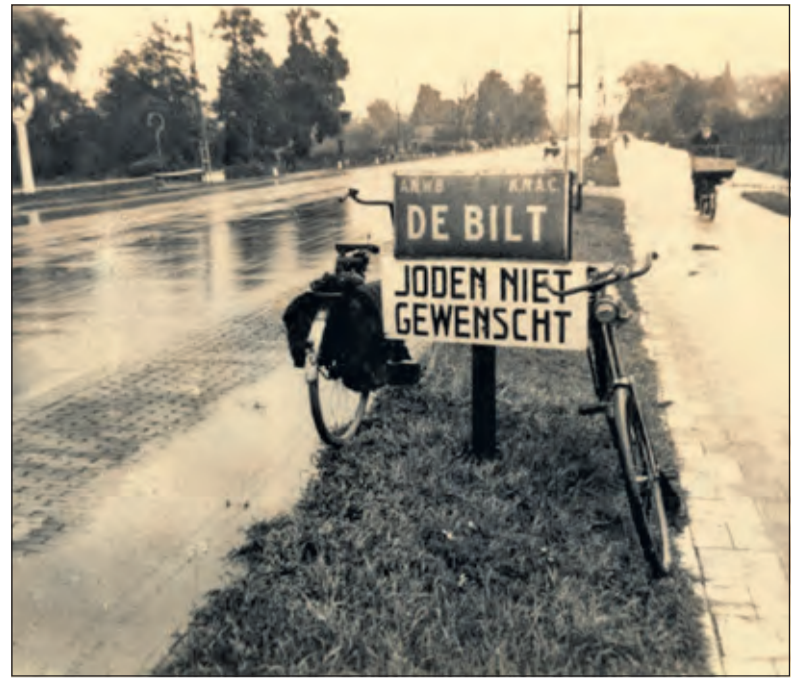
Dit bord stond in de Tweede Wereldoorlog bij de grens van de gemeente De Bilt aan de Utrechtseweg. Dergelijke bordjes zijn ook op andere plaatsen in de gemeente neergezet.

line. Bij De Vierklank ontbreken de jaargangen 1996 t.e.m. 2012 op de website en de Biltse Courant viel helemaal af, omdat alleen de laatste jaargang online staat. Niettemin is het een mooi begin en we blijven er de komende maanden aan werken. Wellicht heeft iemand suggesties ter verbetering of zijn er fouten ingeslopen die gecorrigeerd moeten worden. Ik houd me aanbevolen voor reacties'. Maasen vertelt nog dit dossier de komende maanden regelmatig onder de aandacht van de leden van de HVM te willen brengen in een digitale nieuwsbrief: 'Het idee is om tenminste vier nieuwsbrieven te publiceren, waarin telkens één van de publicatiebronnen (OMDB, Vierklank, DBG en St. Maerten) centraal staat en waarin een artikel of onderwerp uit de publicaties door de 'eigen' bron kan worden aanbevolen'. Wie ook deze nieuwsbrief wil ontvangen kan een e-mail sturen naar info@historischeverenigingmaartensdijk.nl of bellen met 06 22274054.