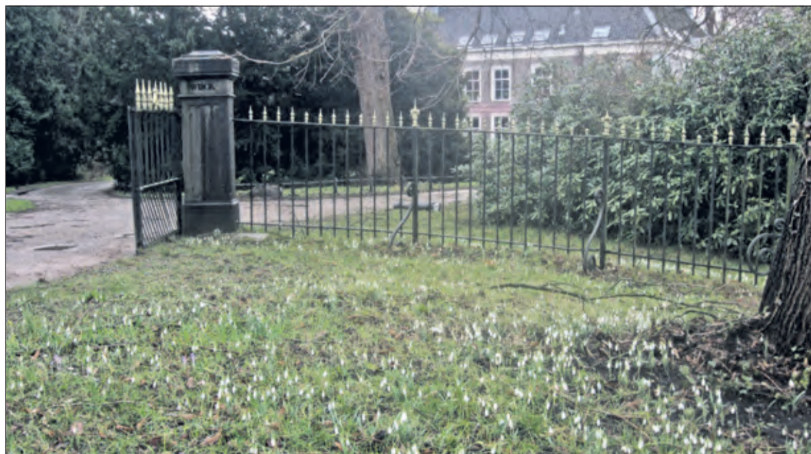
Ook bij Sandwijkstraal bloeien de sneeuwkllokjes al.

Info Rijk van Oostenbrugge rijk.vanoostenbrugge@gmail.com.