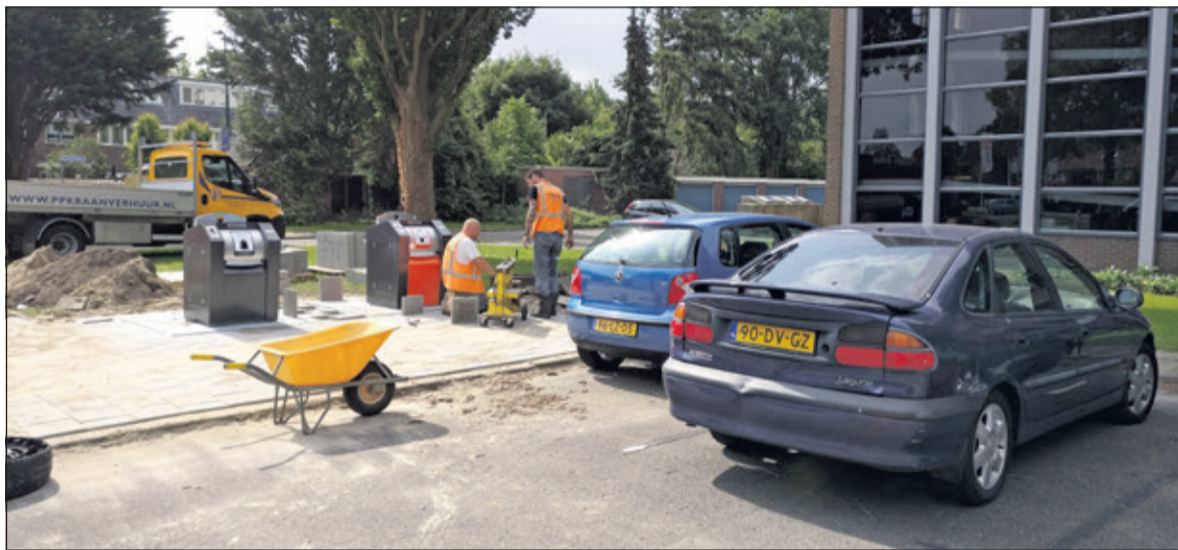
Donderdag 14 juni werden bij de Kleine Beer te Bilthoven een PMD- en een restcontainer geplaatst. Een dag later werd het straatwerk hersteld.

Hierdoor ontstaat een ander straatbeeld. De lage inworpening maakt de nieuwe verzamelcontainers ook toegankelijk voor mindervaliden. Correct gebruik van ondergrondse containers maakt ze minder aantrekkelijk voor ongedierte.