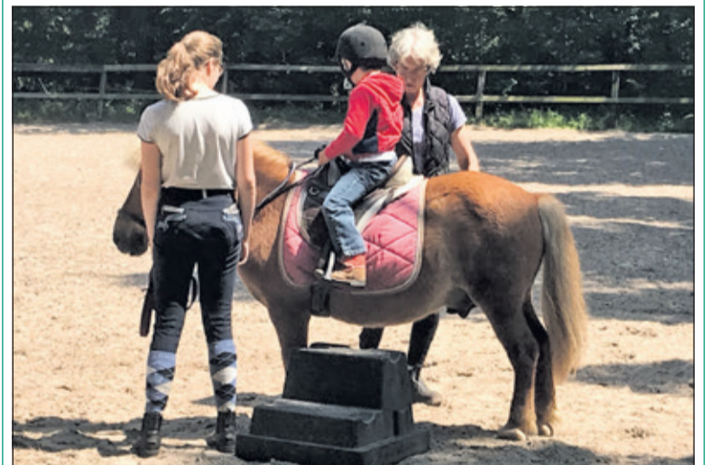
Kinderen maken op een vrolijke en ontspannen manier kennis met andere nieuwkomers en Nederlandse kinderen.