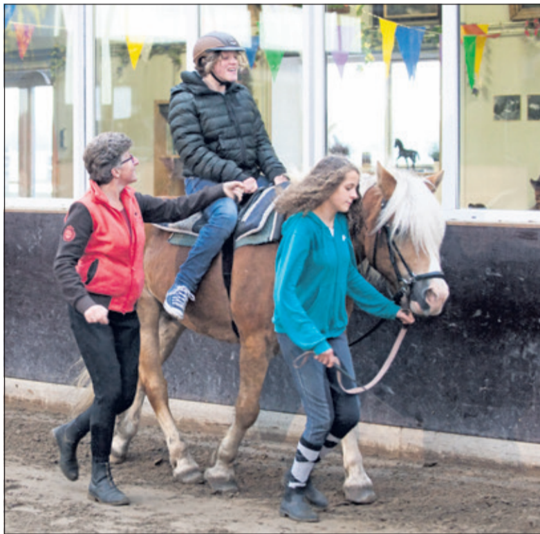
Ruiters met een beperking hebben veiligheid en goede ondersteuning nodig.