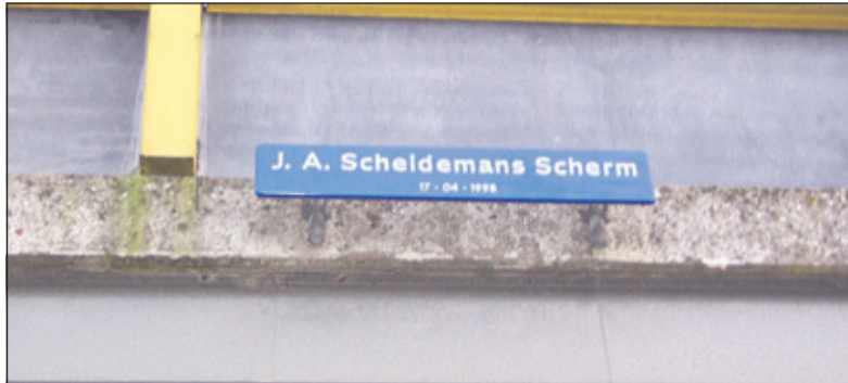
Eerder sierde dit bord het Groenekanse viaduct.

De nieuwe naamgeving van de viaducten in Groenekan en Maartensdijk in de verbrede A27 verbaast velen en roept allerlei vragen op. De Historische Vereniging Maartensdijk (HVM) verwoordt de vragen.