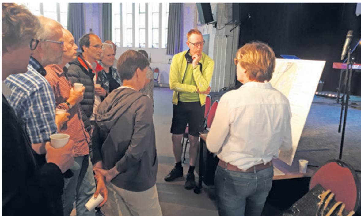
Maandag 25 juni was er nog een bijeenkomst in Hilversum.

De organisatoren van de informatie-avond hebben de geringe belangstelling voor deze avond opgevat als een positief signaal en als een instemming beschouwd met de plannen van de adviesgroep van het GNR.