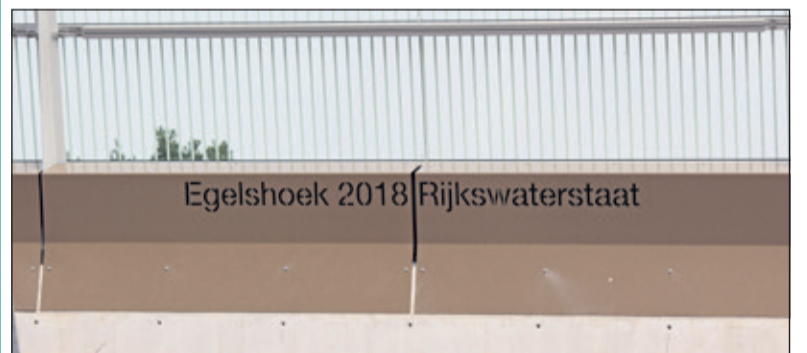
Het viaduct in Hollandsche Rading heet Egelshoek.

De gekozen naam Egelshoek heeft topografisch niets met de Vuursche Dreef c.q. Hollandsche Rading. Doedens: ‘Egelshoek is een buurtschap in de gemeente Hilversum, ten zuidoosten van het vliegveld Hilversum, richting Westbroek die vanaf Egelshoek alleen te voet bereikbaar is. De buurtschap telde in 2007 40 inwoners. Tussen de buurtschap en het vliegveld ligt het woonwagencamp Egelshoek dat strikt genomen niet tot de buurtschap hoort. Wel bevindt zich daar een plaatsnaambord met de naam Egelshoek met cursieve letters, alleen leesbaar als men het kamp verlaat. Ruigenhoek komt (ten onrechte) niet voor op het kaartje van de gemeente Maartensdijk van Kuijper (1868)’.