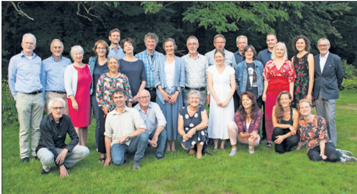
De 25 nieuwe gediplomeerde IVN-natuurgidsen.