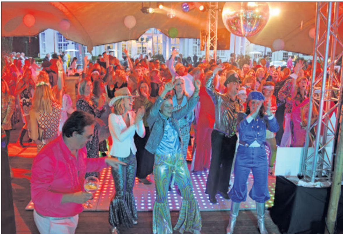
Dancing Queen in de tent voor Jagtlust.

Act Now is inmiddels een begrip in Bilthoven en omgeving. Alweer voor het achtste jaar organiseerde Rotary Club Groot Bilthoven, op vrijdag 15 en zaterdag 16 juni een spetterend tweedaags evenement, in een opvallende en stijlvolle tent op het terrein voor Jagtlust in Bilthoven.