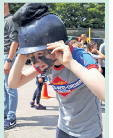
Brandweerrace tijdens de Spel-dag op de Groen van Prinstererschool.