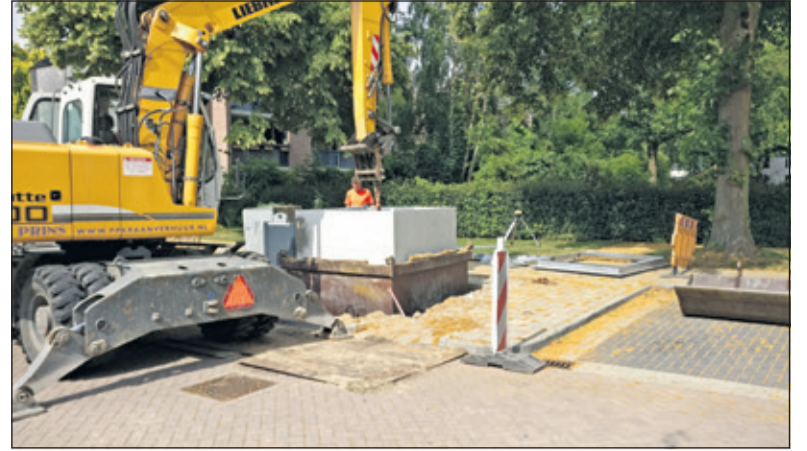
Vrijdag 15 juni werd deze PMD-container aan de Plutolaan in Bilthoven ondergronds geplaatst. [foto Henk van de Bunt].