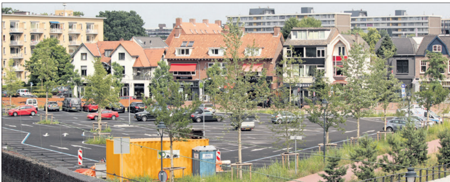
Er gaat onderzocht worden of de stopplaats van het openbaar busvervoer op de Driehoek bij station Bilthoven kan worden ingericht.

Hessenweg 4 * 3731 JK De Bilt hazekampparket.nl * 030 - 633 26 91