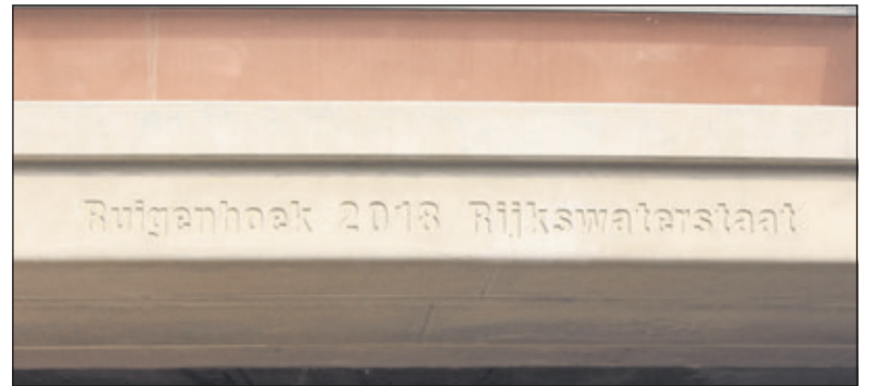
Het Groenekanse viaduct heet nu Ruigenhoek.

nog steeds gewaardeerd en in het verleden is het idee al gevormd om een bord te plaatsen met vermelding van zijn naam. Aan dit idee wordt nu uitvoering gegeven.