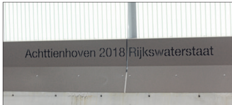
Het Maartensdijkse Viaduct heet Achtthhoven.