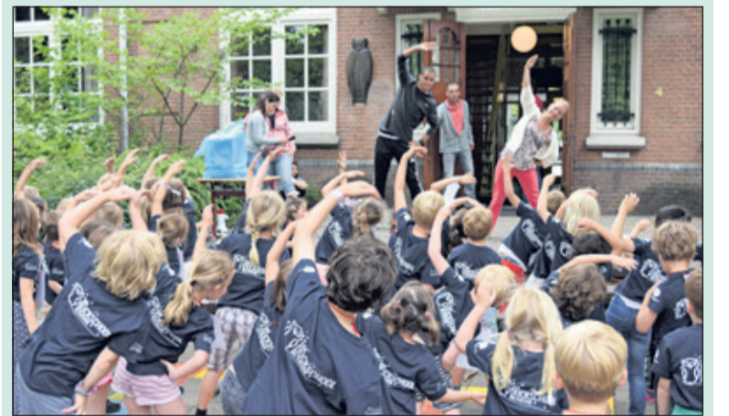
Warming-up voor leerlingen van groep 1 en 3.

Alle leerlingen deden mee aan de sponsorloop. De jongsten startten met hun rondjes op het voorplein van de school, terwijl de ouderen het grote rondje, rondom de school, voor hun rekening namen. Van Manen: 'Na ieder rondje krijgen de kinderen een stempel op hun kaart. Voor elke stempel worden zij gesponsord'. Naast de sponsorloop vond nog een bakwedstrijd plaats, ook voor het goede doel. Bij het ter perse gaan van de krant, was het opgehaalde bedrag nog niet bekend.