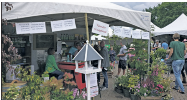
Bij de Vaarder-vraagbaak konden vragen gesteld worden die aan de waslijn gedeeld werden.

Wie zin had in een feestelijk vakantiegevoel kon dit weekeinde terecht bij ‘t Vaarderhoogt aan de Dorresteinweg 72b in Soest. Al tientallen jaren achtereen organiseert het tuincentrum een zomers festijn als gebaar aan alle klanten en trouwe bezoekers.