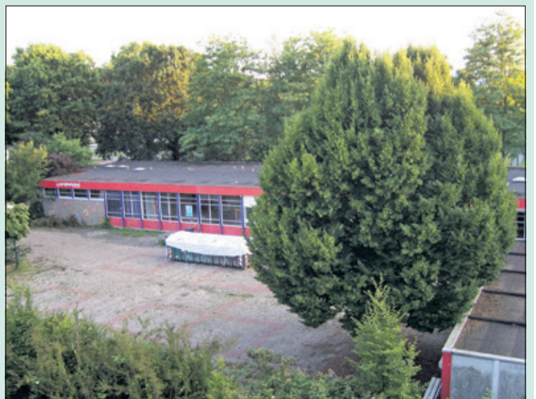
Deze foto laat zien dat de feitelijke afbraak nog moet starten. Afgelopen vrijdag was men klaar met het saneren van asbest.

De gemeente start met het bouwrijp maken van het gebied ten noorden van de Melkweg in Bilthoven. Op het terrein worden honderd woningen gebouwd, waarvan 30 procent in de sociale huur. De woningen worden gebouwd zonder aardgasaansluiting. SSW zal de sociale huurwoningen realiseren en een marktpartij de overige woningen. De definitieve vastlegging van de gemaakte afspraken vindt binnenkort plaats. De werkzaamheden beginnen met de sloop van de beide voormalige schoolgebouwen en het graven van proefsleuven voor archeologisch onderzoek. Na de zomervakantie worden de werkzaamheden voortgezet met het rooien van bomen en het verleggen van de riolering. De omwonenden zijn daarover via een nieuwsbrief geïnformeerd.