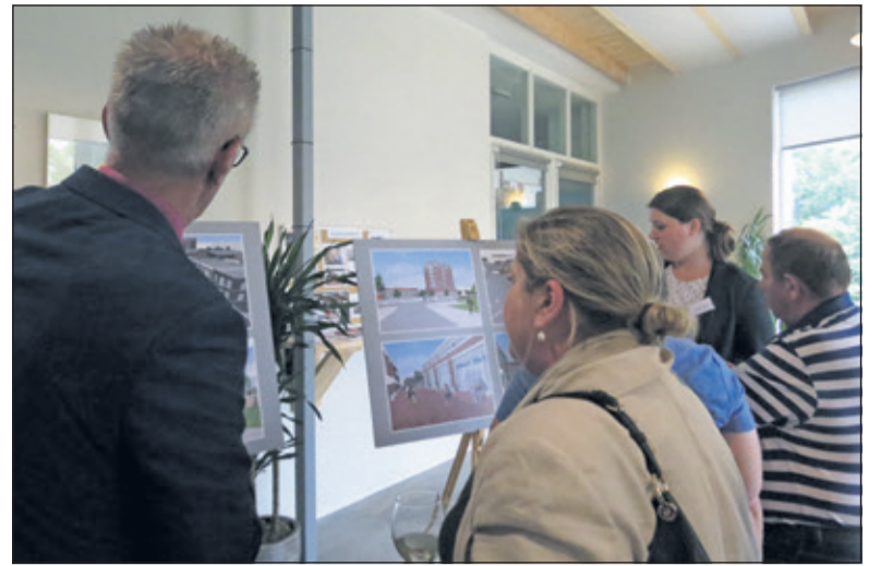
Op afbeeldingen is duidelijk te zien hoe de gerenoveerde Kwinkelier eruit gaat zien.