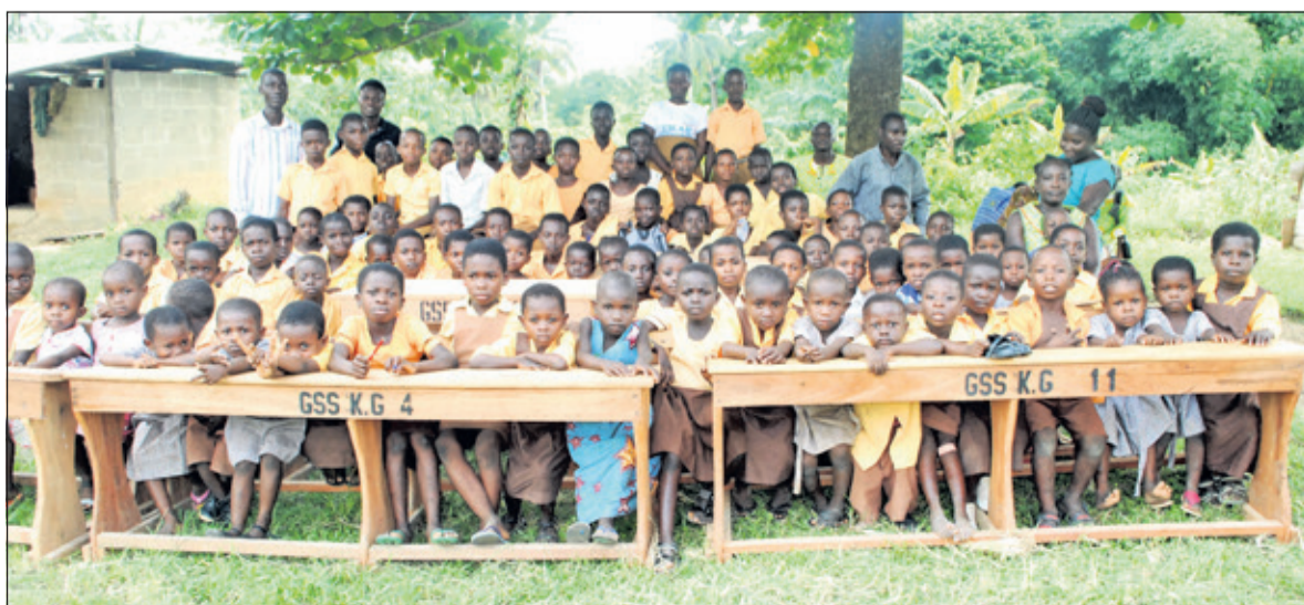
Nieuw meubilair voor de schoolkinderen in Ghana.

John: 'De ambitie van onze stichting is om alle dertien scholen vooruit te helpen. Met onze donaties hopen we twee scholen per jaar te kunnen ondersteunen. Een en ander in overleg met de schoolhoofden. Afgelopen maand is ook opdracht gegeven om bij de Akaasu school in Ghana een kleuterschool te bouwen. In dit gebouw kunnen circa tachtig kleine kinderen opgevangen worden. De bouw is gestart en de verwachting is dat eind van het jaar de kleuterschool in gebruik genomen kan worden.' Zie ook www.ghanaschoolsupport.nl .