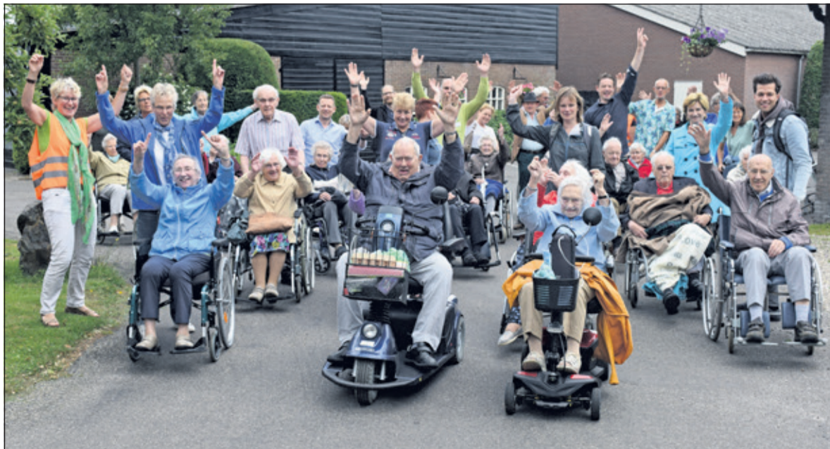
Vrijwilligers wandelden met de bewoners van d'Amandelboom naar de aspergeboerderij in Noord-Houdering.

ligers en negen gemeenteambtenaren liepen wij richting de boerderij. Onderweg opende de boswachter van Noord-Houdering het hek, speciaal voor onze groep en liepen wij door naar de aspergeboerderij, om daar te genieten van een ijsje. Via het bos liep onze groep weer terug naar d'Amandelboom, waar wij afsloten met een drankje en een bit-terbal'.