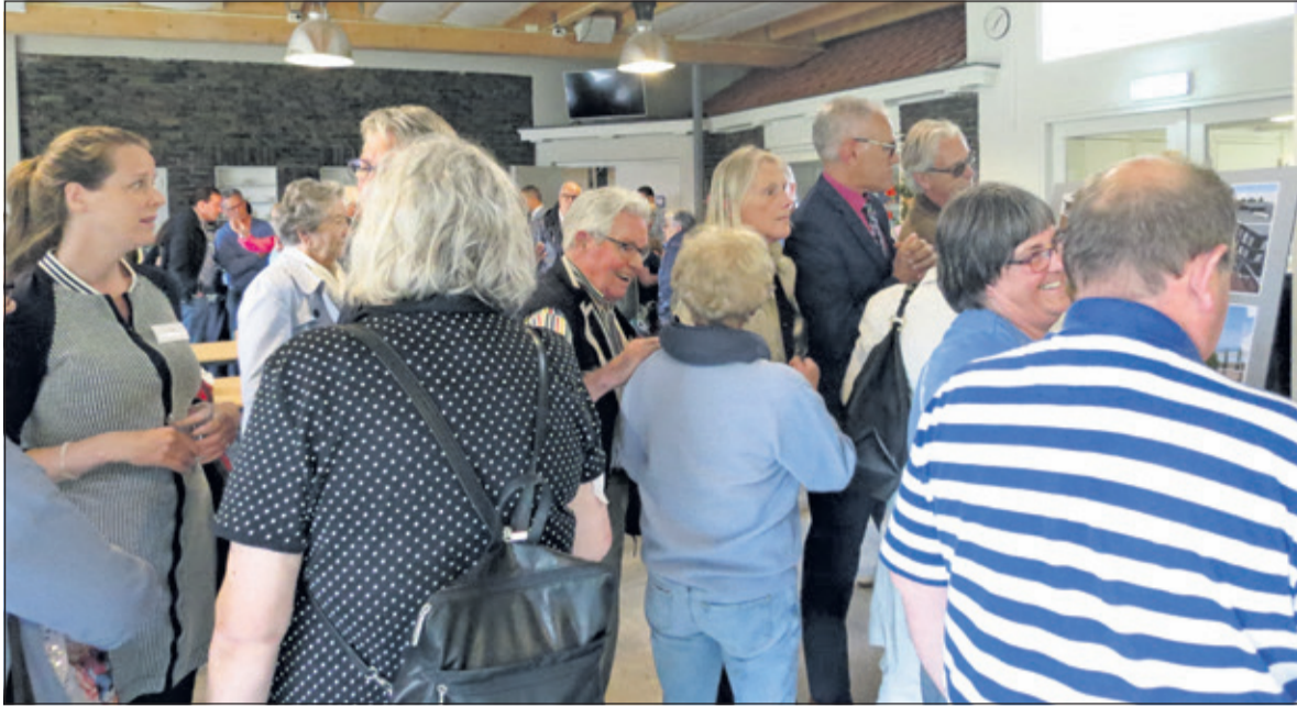
In de serre krijgen bezoekers een toelichting op de verschillende onderdelen.

Namens Real Estate Invest II B.V. werd op dinsdag 12 juni in de Centrumkerk in Bilthoven uur een inloop- informatieavond gehouden over de herontwikkeling van winkelcentrum de Kwinkelier in Bilthoven. Tijdens de drukbezochte avond hield architect Wim de Bruijn van Bureau voor Stedebouw en Architectuur BV in Rotterdam een videopresentatie.