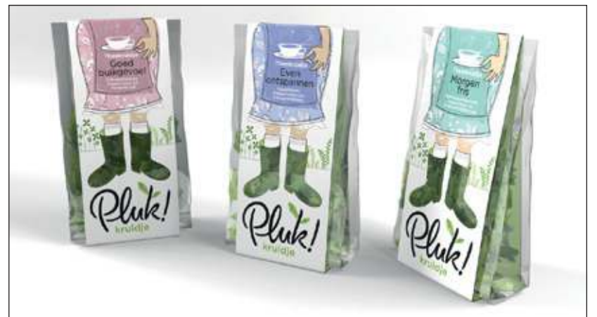
Uitspraak van wijlen Chaim Potok (Amerikaans schrijver en rabbijn): 'Kom laat ons thee drinken en doorgaan met praten over vrolijke dingen'

Zoon Willem Landwaart somt nog graag even de voordelen en het gemak op: 'Er is veel smaakvariatie en ook de verpakking is goed doordacht: drie zakjes in handzame verpakking, elk voor 1 theepotje of in het glas, dat dan wel twee tot drie keer kan worden gevuld met heet water van 80-90 graden. Er is sprake van een maximale hygiëne en een schoon product met een goede houdbaarheid in de verpakking'. Vrijdag a.s. kan iedereen komen proeven.