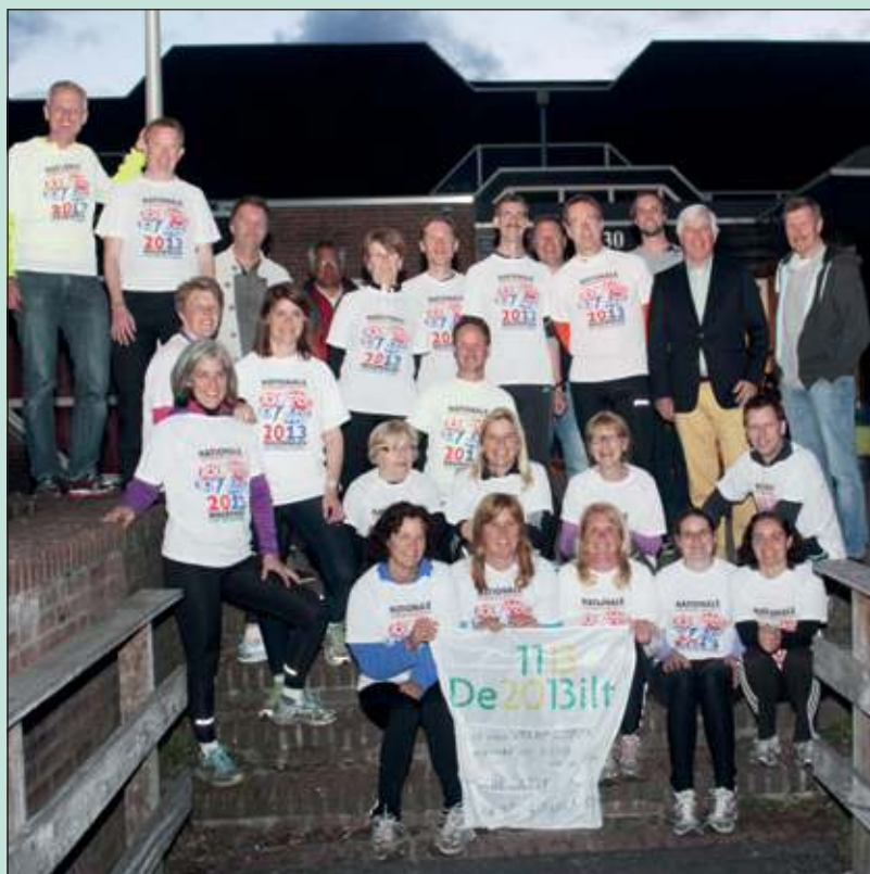
Een twintigtal lopers uit De Bilt vertrok afgelopen zaterdagavond vanaf De Vierstee in Maartensdijk naar Wageningen om het bevrijdingsvuur te halen. (lees meer op pag. 3)