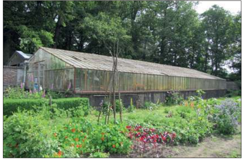
Tijdens de Open dag wordt onder meer aandacht gevraagd voor het herstel van de monumentale druivenkas.

Zie ook www.vriendenvaneyckenstein.nl en www.agneskruiden.nl . [HvdB]