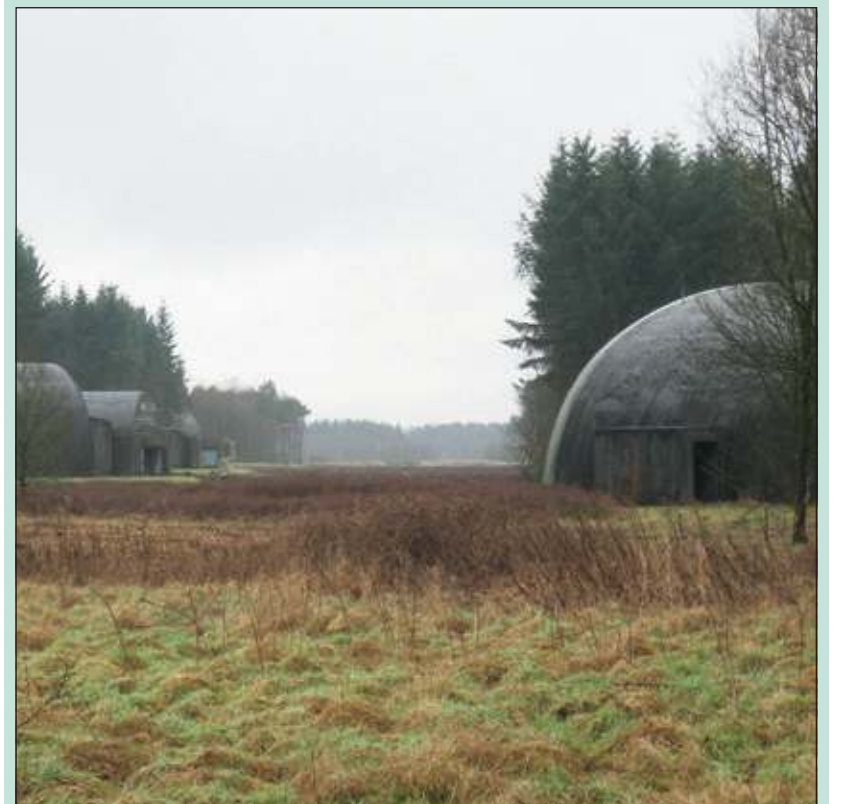
Vrijwilligers van Utrechts Landschap maken toegang tot Vliegbasis Soesterberg mogelijk.

Heeft u interesse voor de fiets- of de natuurexcursie? Meld u dan aan via www.utrechtslandschap.nl/reserveren . Verzamelpunt is het toegangshek bij de ingang van de Vliegbasis aan het einde van de Batenburgweg te Soesterberg.