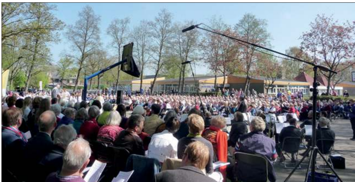
Meer dan zevenhonderd mensen uit Westbroek, Maartensdijk, Groenekan, Hollandsche Rading, De Bilt en Bilthoven hebben zondag 5 mei 2013 de openluchtdienst op 'het diepe plein' van de Martin Luther Kingschool in Maartensdijk bijgewoond.