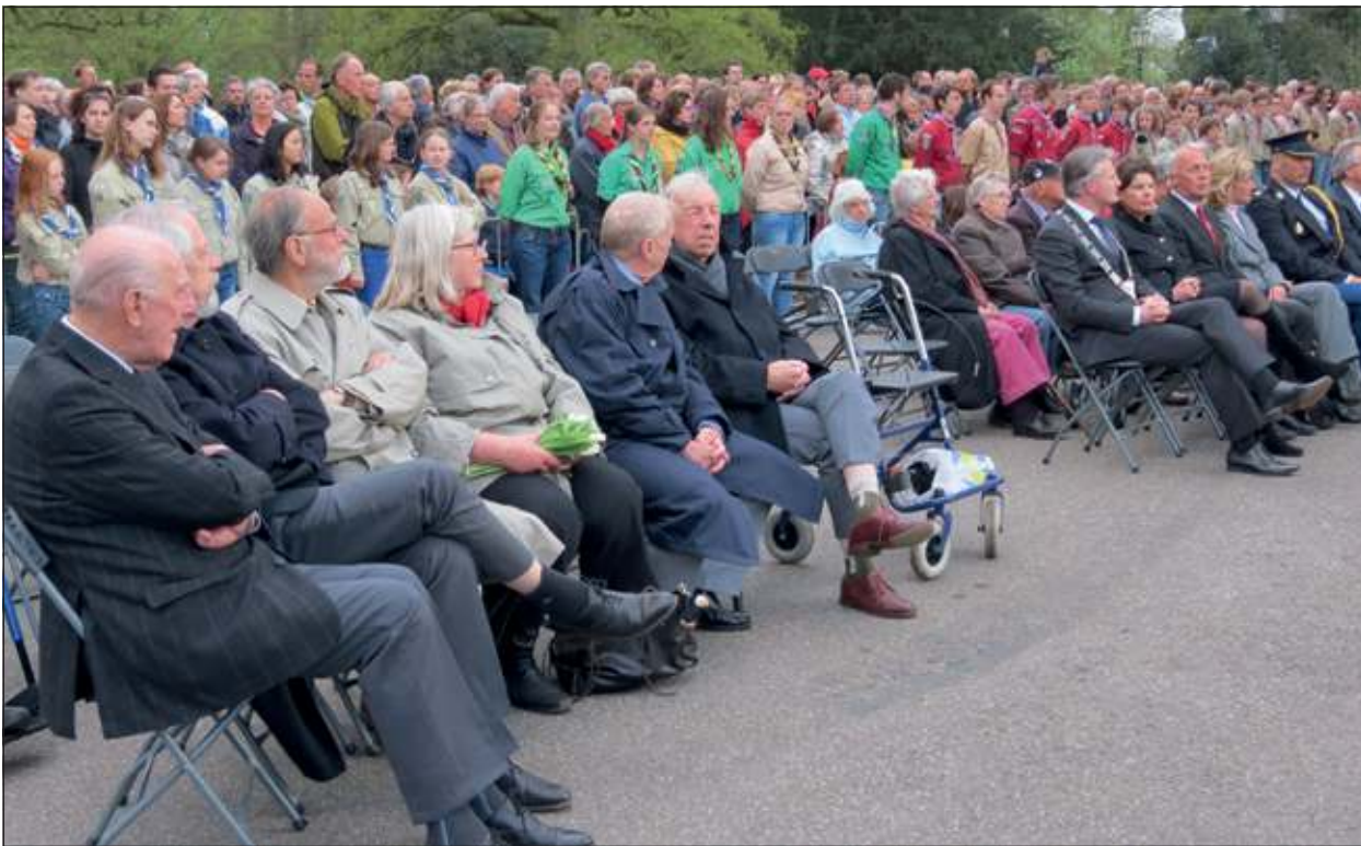
Veel mensen woonden de Dodenherdenking bij Jagtlust bij.