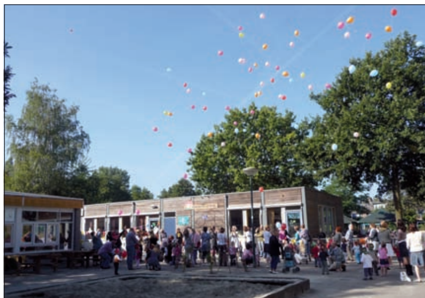
't Bruggetje; 35 jaar. Eén groot ballonnenfeest.

Rond elf uur gaan alle peuters met een kleurige ballon naar buiten en samen met de leidsters tellen ze tot drie en na het blazen op de toeter gaan alle ballonnen de lucht in. Een jongetje vertelt tenslotte trots dat ook hij zijn 'ballon de lucht in heeft gegooid'.