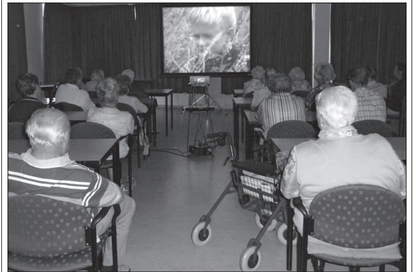
Dinsdag 27 oktober wordt het vervolg van Merijntje Gijzen vanaf 14.30 uur getoond in de cursusruimte van SWO Maartensdijk. Op dinsdag 15 december volgt een kerstfilm.