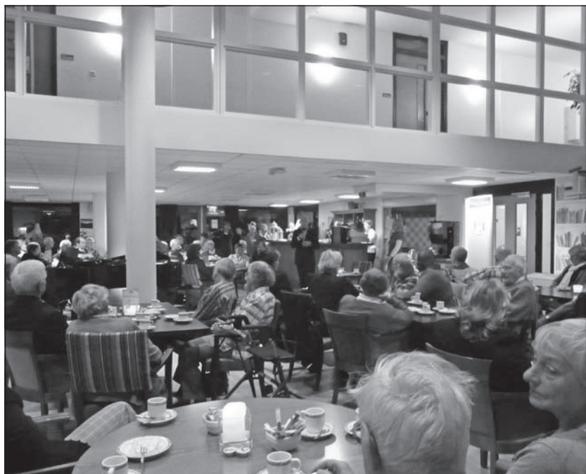
Iedere derde dinsdag van de maand vanaf 19.30 uur is dit Café open in het restaurant van Zorgcentrum De Koperwiek in Bilthoven.