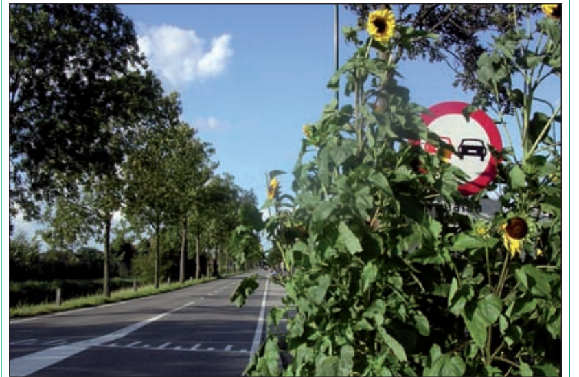
Wees vriendelijk, dus 'Zeg het met bloemen'. Maar ... komt de totale boodschap over het inhaalverbod zo wel over?