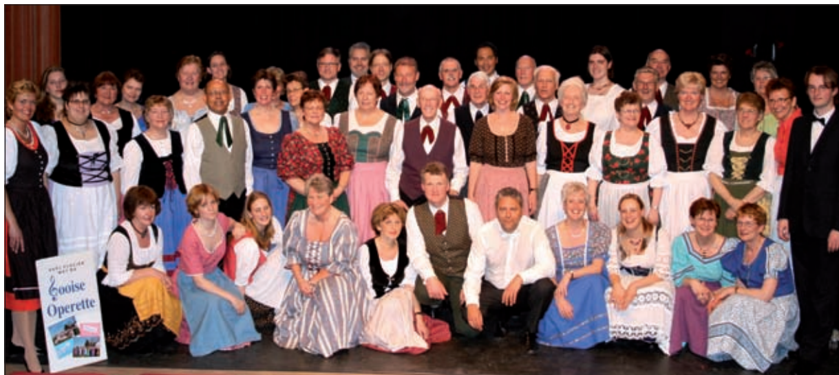
Een groepsfoto van de Gooise Operette (genomen eind 2008 in Wesopa te Weesp).

De Gooise Operette is een professioneel werkend amateurgezelschap dat met operetteproducties en gevarieerde operetteconcerten volle zalen trekt in het Gooi en omstreken. Op vrijdag 25 september a.s. verzorgt dit gezelschap een optreden in de recreatiezaal van Dijkstate.