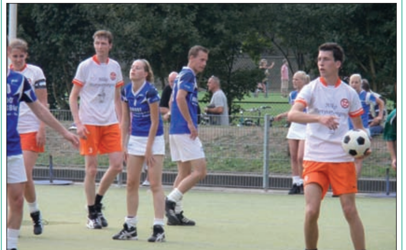
Na een slordige eerste helft herpakte Tweemaal Zes zich en won uiteindelijk met 15-26.

Een prima overwinning, waarin de aanvallende scherpte op een goed niveau was. Volgende week komt De Meervogels uit Zoetermeer op bezoek in Maartensdijk. Deze ploeg heeft al vier punten, dus zal er wederom 'volle bak' gespeeld moeten worden. Aanvang: 15.30 uur.