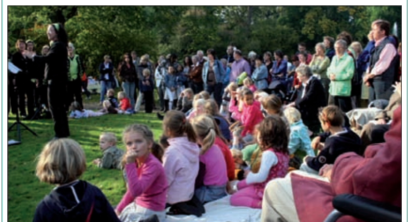
Bij voorgaande jaargangen was er altijd een goede belangstelling voor parkmuziek.

De middag wordt georganiseerd door De Culturele Tak, onderdeel van de Vereniging Vrienden van het Van Boetzelaerpark en is mogelijk dankzij sponsoring door de Gemeente De Bilt, culturele fondsen en sponsors uit het bedrijfsleven.