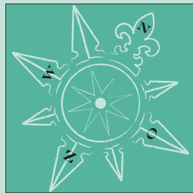
Dit wordt het nieuwe beeldmerk van De Vierklank. Nieuws uit alle richtingen.

Mensen uit De Bilt en Bilthoven die met De Vierklank kennismakten waren vaak meteen enthousiast en begonnen aan te dringen om het blad gemeentebreed te laten verschijnen. Aan deze roep wordt op 30 september gehoor gegeven. De redactie en de medewerkers van De Vierklank gaan vanaf die datum ook uitgebreid aan de slag met nieuwsfeiten uit De Bilt en Bilthoven. De formule blijft hetzelfde. Nieuws met daar tussendoor advertenties en niet omgekeerd. Ook de bezorging gaat op dezelfde wijze als tot nu toe plaatsvinden. Dus met bezorgers waarmee De Vierklank persoonlijk contact onderhoudt. In de beginperiode zal de bezorging misschien niet helemaal vlekkeloos verlopen, maar per 1 januari moet die voor het nieuwe verspreidingsgebied net zo goed gaan als nu het geval is. Wie op woensdag een uurtje tijd heeft om De Vierklank in een wijk van het nieuwe verspreidingsgebied te bezorgen, kan zich telefonisch aanmelden op 0346 211992 of per e-mail info@vierklank.nl.