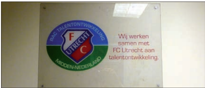
In de eigen ruimte van hoofdtrainer Wout van Dronkelaar is ook te lezen dat de vereniging nauw samenwerkt met FC Utrecht.

Het complex zit goed in de verf met natuurlijk veel geel en blauw. Het aantal leden, waaronder heel veel jeugd biedt een goed perspectief voor de toekomst. Het nieuwe veld, op het complex van korfbalvereniging Tweemaal Zes, ligt weliswaar wat buiten het zicht maar is een prima veld om op te voetballen. Een tweede kunstgrasveld staat op het verlanglijstje. Vrijwilligers, zowel in de teambegeleiding als bestuur en klussers zijn er altijd wel te vinden. Frans van de Tol: 'Ze zien dat wij er veel tijd in stoppen en zijn daarom als ze gevraagd worden bijna altijd wel bereid om ook hun handen uit te mouwen te steken. We zijn een goed georganiseerde, gezellige dorpsclub, met volgend jaar ons 60 jarig jubileum. We zijn klaar voor de toekomst!'