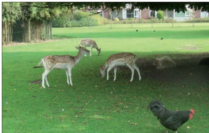
De hertenkamp aan de Melkweg in Bilthoven.

Bij realisering van het project Melkweg in Bilthoven is voor de nu aanwezige hertenkamp naast buurtboerderij De Schaapskooi geen plaats meer. Omwonenden maken zich daar zorgen over en zijn een handtekeningactie begonnen. De fractie van GroenLinks&PvdA heeft daar begrip voor en dient tijdens de gemeenteraadsvergadering op 24 september een motie in om de hertenkamp voor de wijk te behouden. In de motie stellen de indieners voor om te zoeken naar een passende en tijdig beschikbare alternatieve locatie voor de hertenkamp. Dit in overleg met de Stichting Reinaerde, de beheerder van de buurtboerderij. Er wordt een locatie voorgesteld in de nabijheid van de woonwijken in Bilthoven-West. De fractie wil die locatie bij voorkeur betrekken bij de groenvoorziening van het bedrijvenpark Larenstein, dat op enkele honderden meters afstand ligt. [GG]