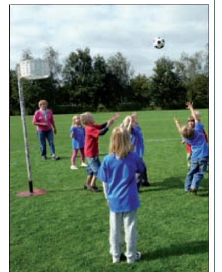
Het was heerlijk weer tijdens de wedstrijden van het schoonkorfbaltoernooi.

De beide kampioensteams mogen in juni meedoen met het Provinciaal Schoonkorfbaltoernooi.