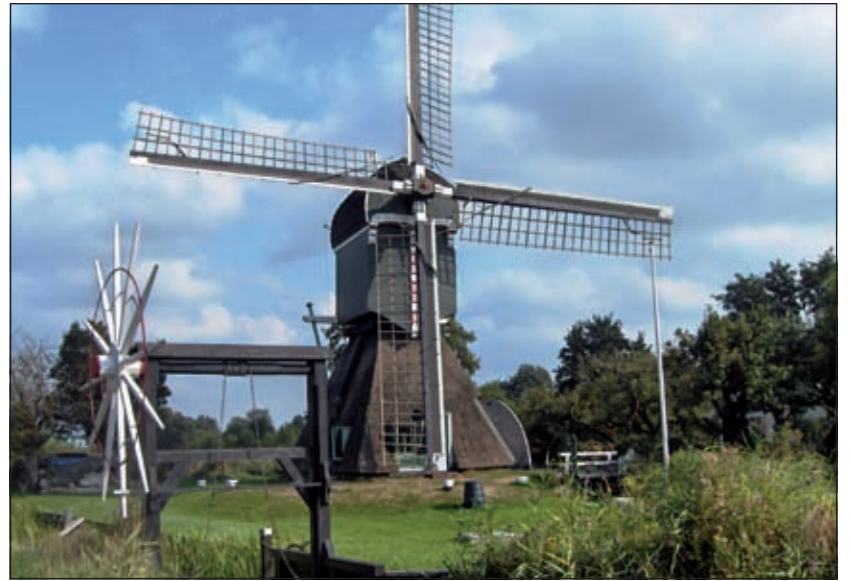
'De trouwe wachter' is een Hollandse wipwatermolen. Deze verzorgde vanaf 1832 tot 1948 de bemaling van de Oostelijke Binnenpolder.

Theo Schouten (73) is er één uit een gezin van 5 kinderen. Hij trouwde met de Maartensdijkse Janny Gasenbeek en werd in 1957 postbode in Maartensdijk. Vanuit het toenmalige postkantoor aan de Dorpsweg 101 in Maartensdijk - met Leo Kalmijn als kantoorhouder - bezorgde hij jarenlang de post in Hollandsche Rading en Maartensdijk. In 1962 is hij naar Maarssen overgeplaatst en in 1995 is