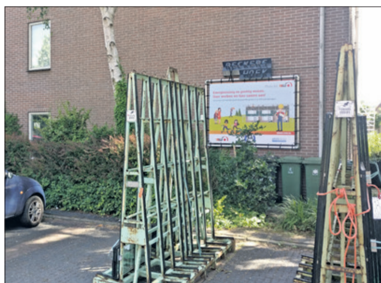
Aan de Snippenlaan wordt gewerkt aan energiezuinig en prettig wonen.

dat vrijwillig werd verzet rond de 18,9 miljoen euro. Maar het maatschappelijk belang is vele malen groter.