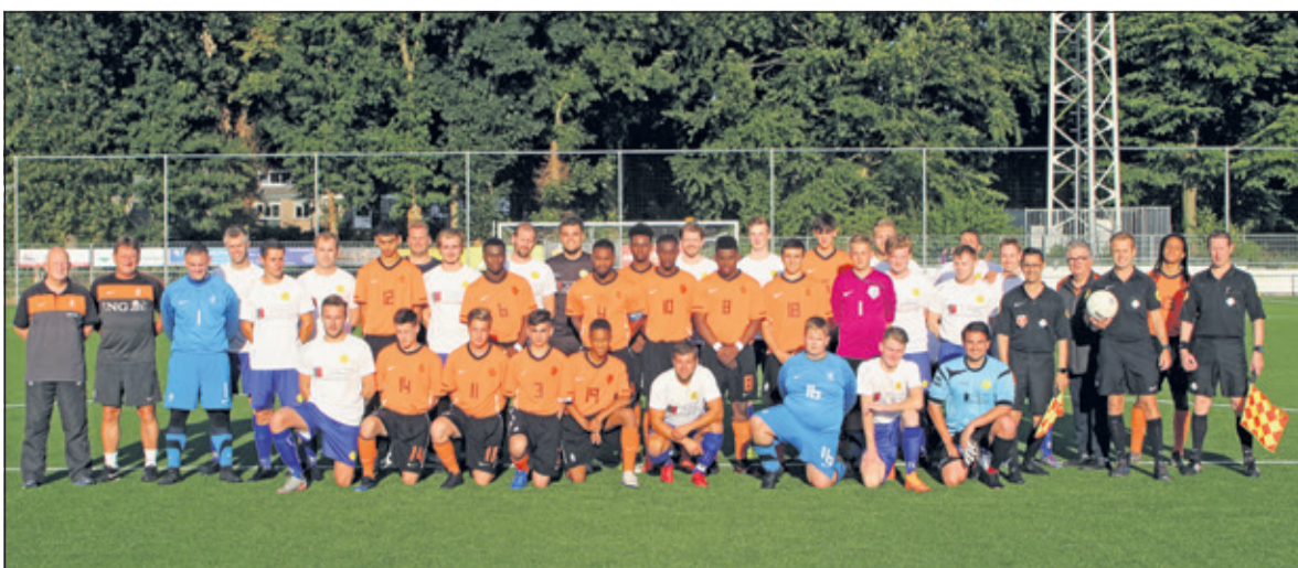
'Het Andere Oranje' te gast bij SVM.

de selectie van het Nederlands LD voetbalelftal te gast bij SVM. In de middag werd er getraind door de talentvolle voetballers. 's Avonds speelde het team tegen een selectieteam van de Maartensdijkers.