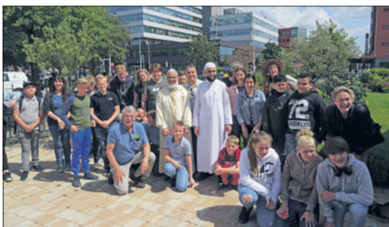
Teamfoto van de bezoekers met de gastheren.

Vervolgens ging de groep naar een leslokaal in een ander deel van de moskee waar het gesprek werd voortgezet. Docenten en leerlingen konden openlijk vragen stellen aan de imam die de accenten vooral legde op een goede onderlinge harmonie in de samenleving waar-