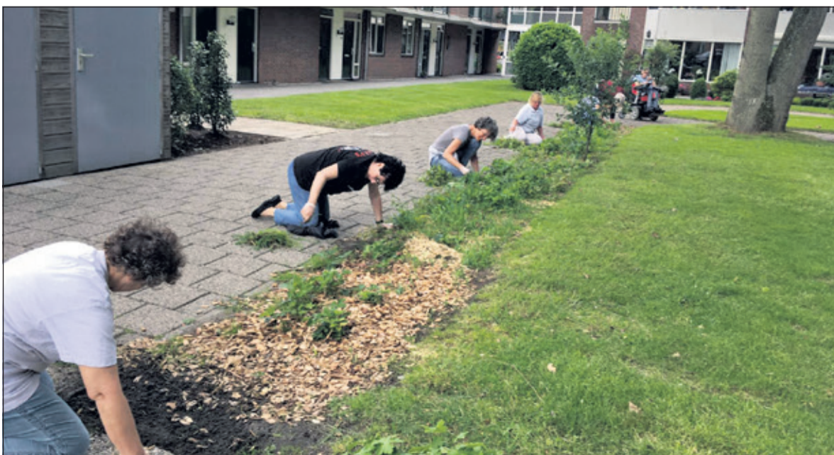
Medewerkers RIVM steken de handen uit de mouwen in de tuin van d’Amandelboom.

Terwijl de muziek zorgde voor mooie verbindingen tussen de bewoners en medewerkers van het RIVM, werd door andere