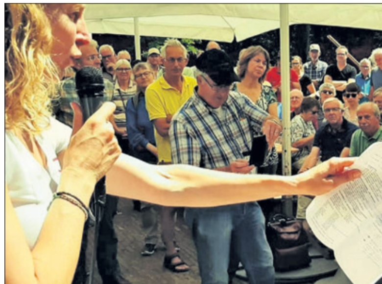
Zo'n 200 vrijwilligers worden tijdens dit evenement bedankt voor hun inzet.