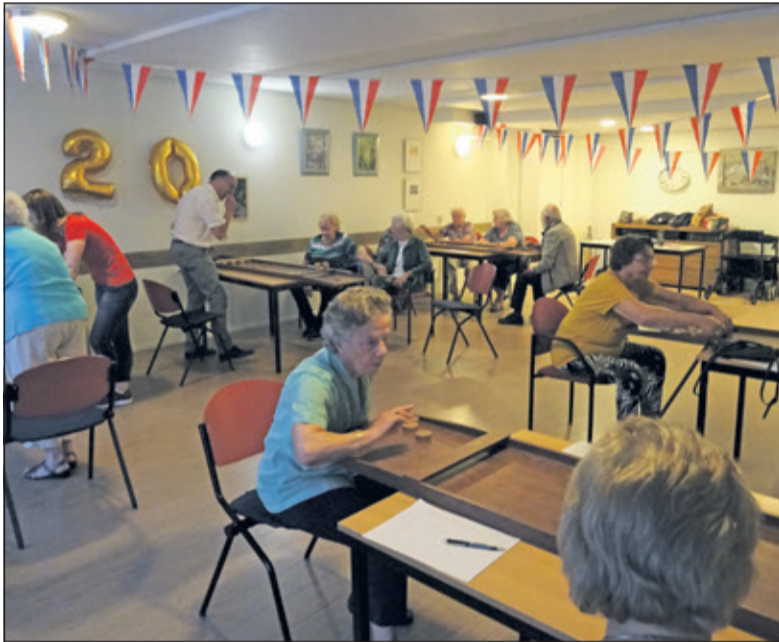
Er wordt geconcentreerd om de punten gespeeld.

De gymlessen worden gegeven op woensdag in Dijkstate in Maartensdijk. Een groep van 9.30 uur tot 10.30 uur en een groep van 10.30 uur tot 11.30 uur. Voor meer informatie over de gymnastieklessen zie www.mensdebilt.nl .