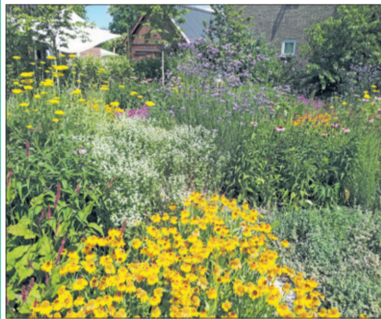
Op de hoek van de Cirrus- en de Aeoluslaan' ligt een bijenparadijs.