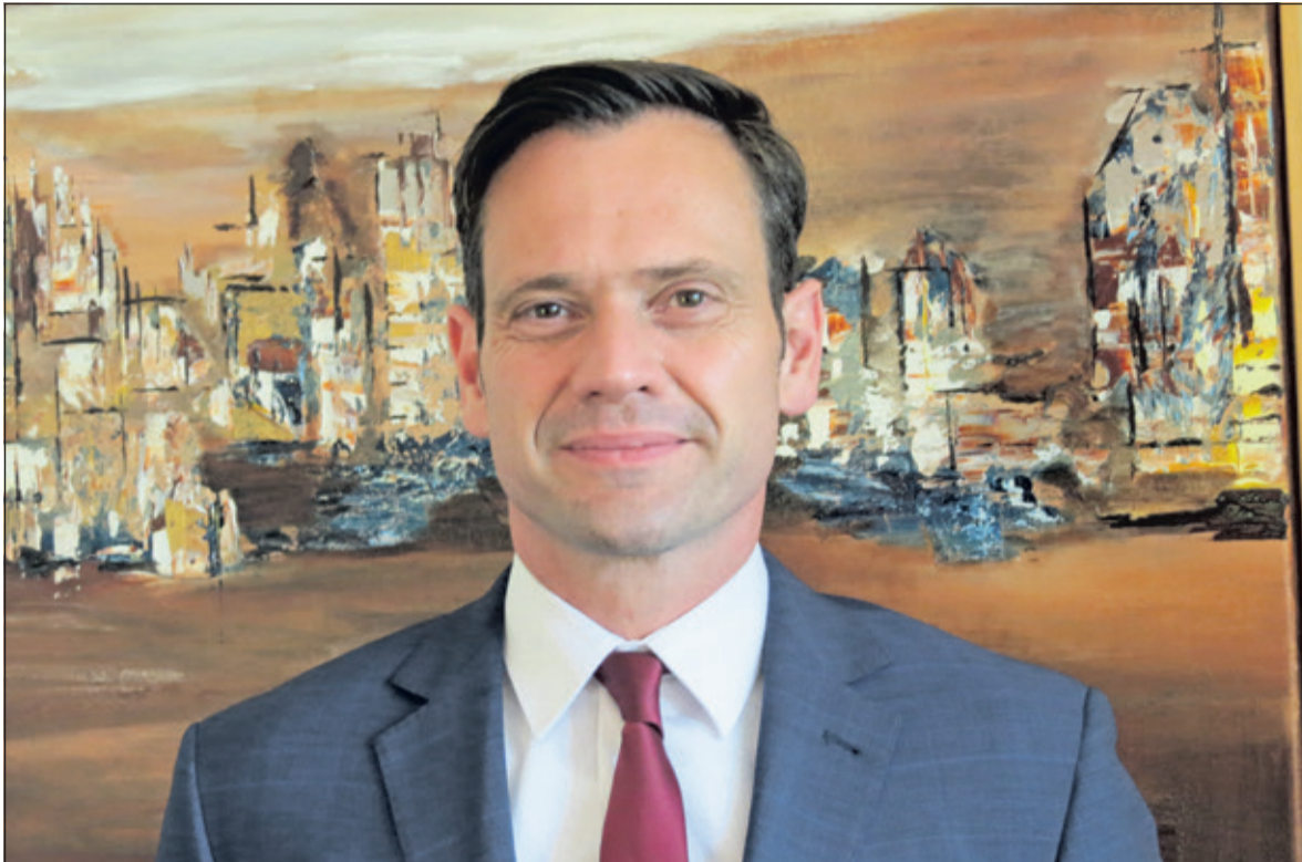
Burgemeester Sjoerd Potters kijkt terug op een geslaagde missie.

Hij leidde als vertegenwoordiger van de regio Utrecht van 10 tot en met 14 juni een economische missie naar de stad Pune in India. De burgemeester deed veel indrukken op en kijkt terug op een geslaagde missie.