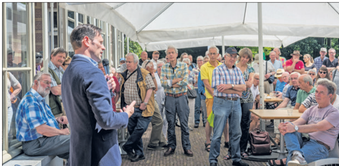
Tijdens de vrijwilligersdag worden indrukwekkende cijfers bekend gemaakt. (foto Gert Hindriks).