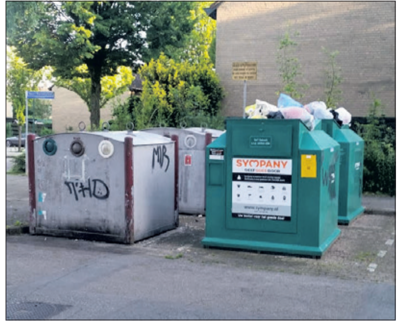
De textiel-containers tegenover de voormalige Aldi-winkel puilen uit; een lelijk gezicht en een gevaar in een verder mooie wijk.

Huurders zijn tevreden over het onderhoud door woonstichting SSW. Wel klaagt men over de opeenvolgende huurstijgingen. Een aantal bewoners moet noodgedwongen verhuizen en oudere inwoners denken er niet over om naar een kleiner maar veel duurder appartement te verhuizen. De buurt wil ook graag een vaste parkeerplaats voor de deel-auto, tot nu toe werd dit niet ingewilligd door de gemeente. Ook ergert men zich aan de overlast van drugsdealers in deze hoek. Het wordt tijd, dat hier iets aan wordt gedaan. Inwoners vinden dat de