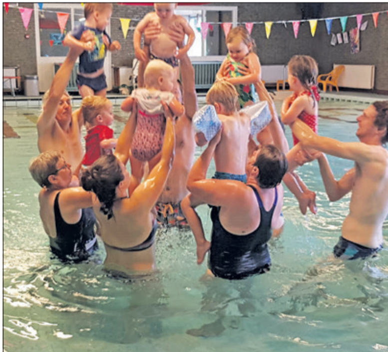
Ouder en Kind zwemmen tijdens het Guppy afzwemmen in Combibad Brandenburg.

Het zwembad was voor de gelegenheid mooi versierd en samen met de mama's, de papa's, oma's of opa's werd mooi gezongen en gevierd dat deze zeer jeugdige zwemmers hun Guppy- of Puppydiploma hebben gehaald. (Johan L'Honoré Naber)