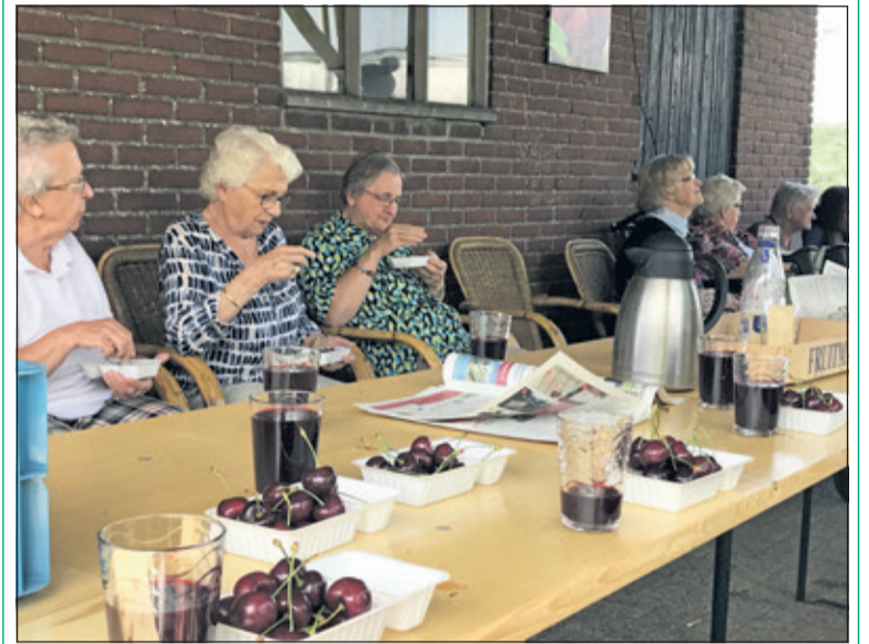
Zonnebloemgasten genieten van vers geplukte kersen.