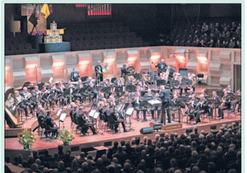
Een van de beste militaire orkesten ter wereld speelt vrijdag in De Bilt.