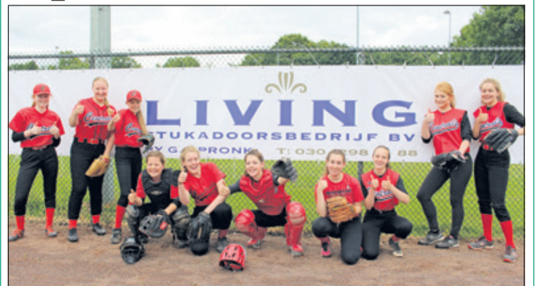
Living Stukadoors (Bilthoven) is een nieuwe sponsor van Honk- en Softbalvereniging Centrals.