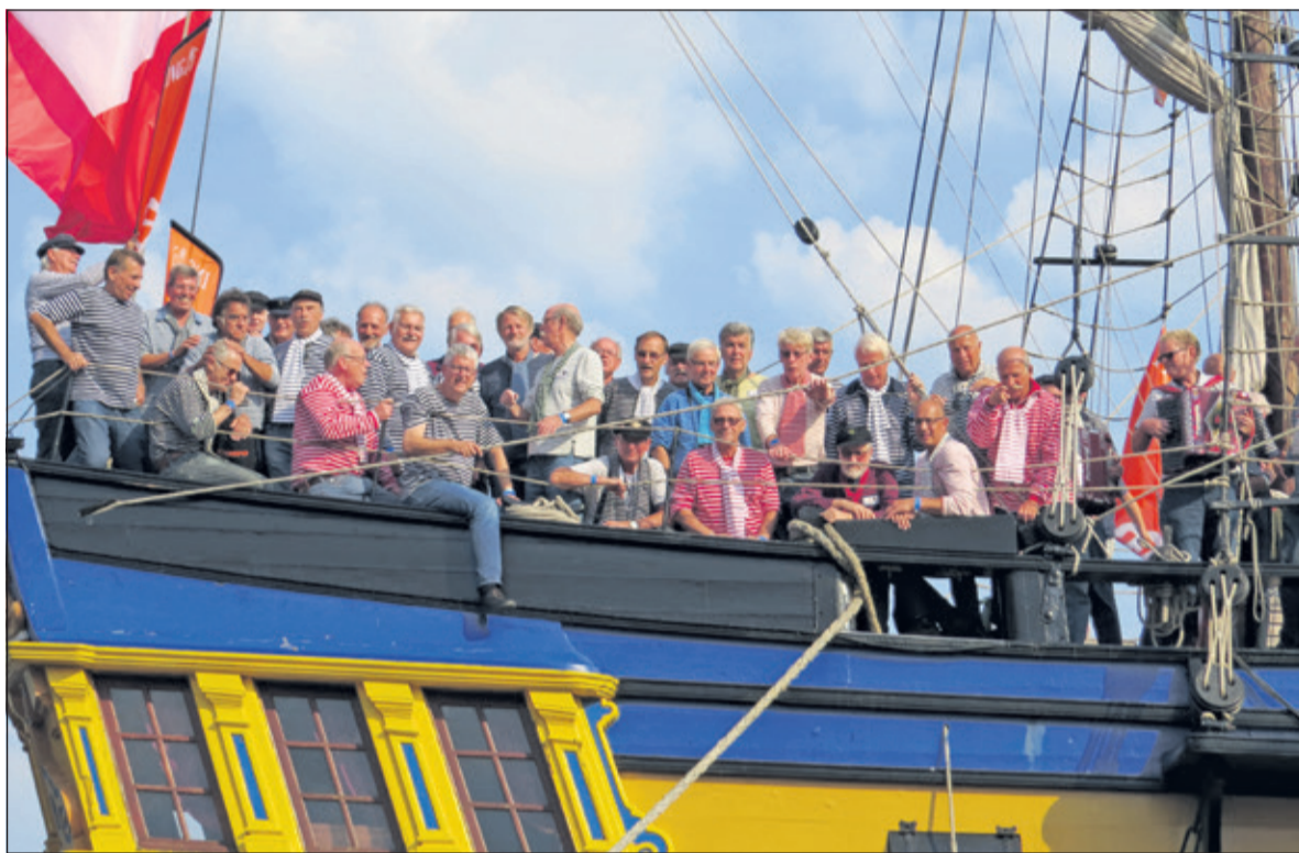
Nootdweer brengt Shanty- en andere zeemansliederen in verschillende talen.

Het volgende en laatste concert vindt plaats op 8 september. Voor info. 06 51229733.