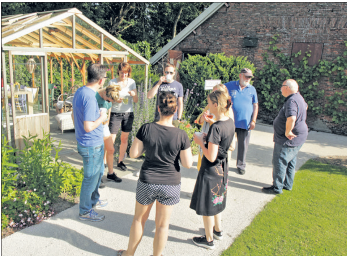
Rustmoment voor de vrijwilligers in de Hospicetuin.

Onlangs kreeg het Hospice Demeter hulp van zes medewerkers van een commerciële sales organisatie. Met stralend weer wieden de bedrijfsvrijwilligers onkruid, spotten tuinmeubilair schoon en snoeiden de heggen.