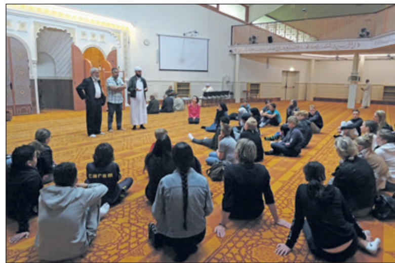
In de gebedsruimte van de moskee luisteren de leerlingen vol aandacht naar de gastheren.

door we kunnen samenwerken met elkaar en veilig kunnen leven. De boodschap was duidelijk: we moeten absoluut meer met elkaar praten om elkaar beter te begrijpen. Vervolgens werd in een islamitisch cafetaria gezamenlijk van de couscous genoten. Nadat de leerlingen het vrijdagge-