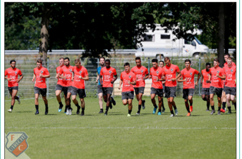
Dankzij de goede samenwerking mocht SVM vorige week gastheer zijn voor de selectie van jong FC Utrecht. Zij trainden iedere ochtend van 10.30 tot 13.00 uur op de Maartensdijkse velden. [HvdB].