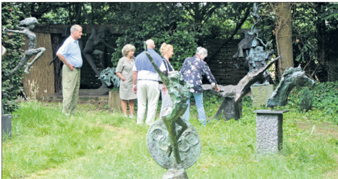
Een vrijwilliger geeft uitleg over het werk van de kunstenaar.