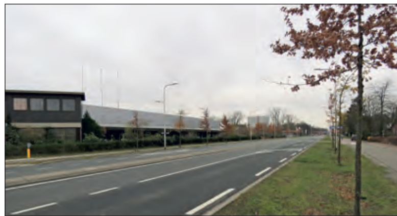
De plek langs de Utrechtseweg in De Bilt waar het allemaal om gaat.

De wethouder ontraadt de amendementen en de moties. Beide amendementen krijgen alleen steun van Forza. De motie die vraagt om de uitkomst van de berekening open-