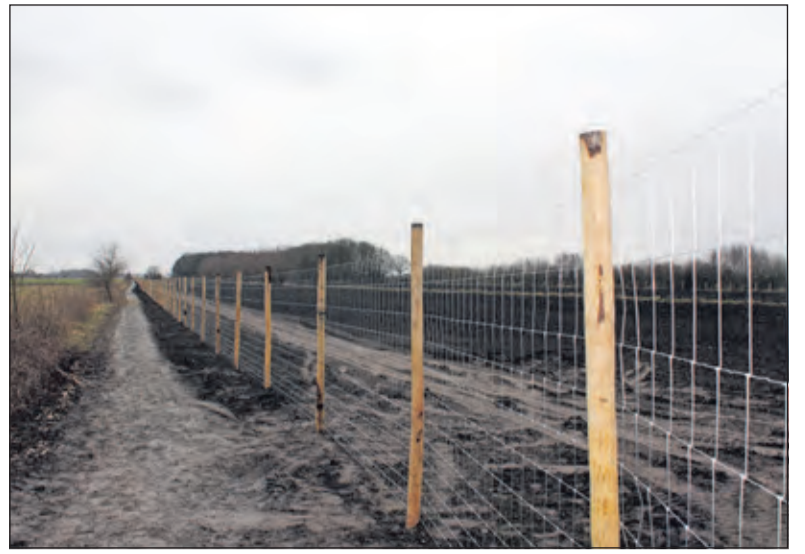
Langs het nieuwe bos wordt aan de oostzijde een wandelpad aangelegd.

'De locatie waar het bosplantsoen te Hollandsche Rading West wordt aangelegd, ligt aansluitend op het reeds bestaande Dassenbosje (lokaal bekend en naar verluidt het