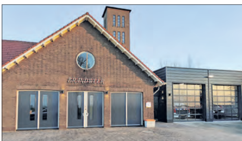
Beeldbepalend; ook na de restauratie.