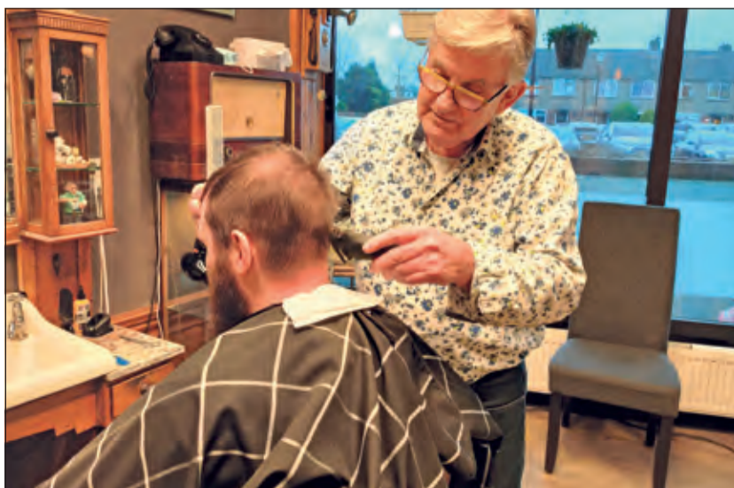
De uitzending is in Maartensdijk opgenomen.