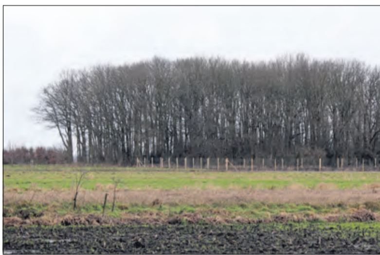
Op deze foto, genomen vanaf de Tolakkerweg, is duidelijk te zien dat de aanplant doorloopt tot het bestaande bosje.

Inmiddels is ook het eerste deel van een hek rond het perceel geplaatst van 1,80 m hoog en er komen korte dassentunnels onder het hek door (geen openingen). Dit is noodzakelijk om de reeën weg te houden van de jonge aanplant. Voor de migratie van dassen en klein wild komen er openingen in het hekwerk. Over aan aantal jaren zal dit hoge hek vervangen worden door een laag hek om de honden uit het gebied te weren'. [HvdB]