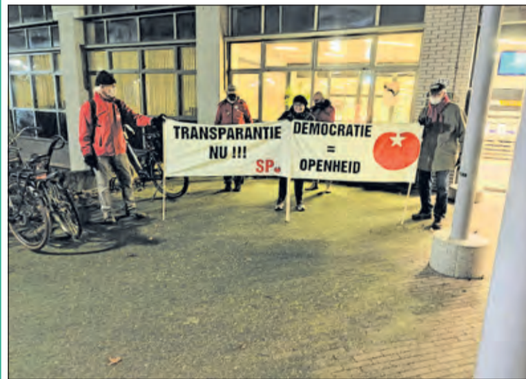
SP De Bilt strijdt voor een open communicatie vanuit het gemeentebestuur naar de gemeenteraad en de inwoners.

De strijd tussen het college en de raad gaat over een strook die belangrijk is voor de natuur, waar nog recent een faunapassage is gemaakt.