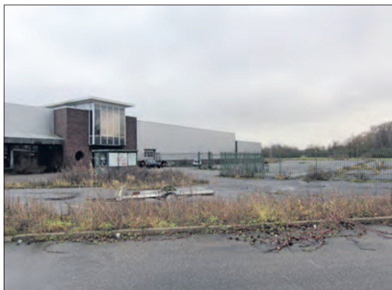
Hoe lang is deze aanblik vanuit Utrecht van het deels bebouwde - de oppervlakte van de oorspronkelijke gebouwen beslaat circa 10.000 m 2 - en deels verharde terrein er nog.