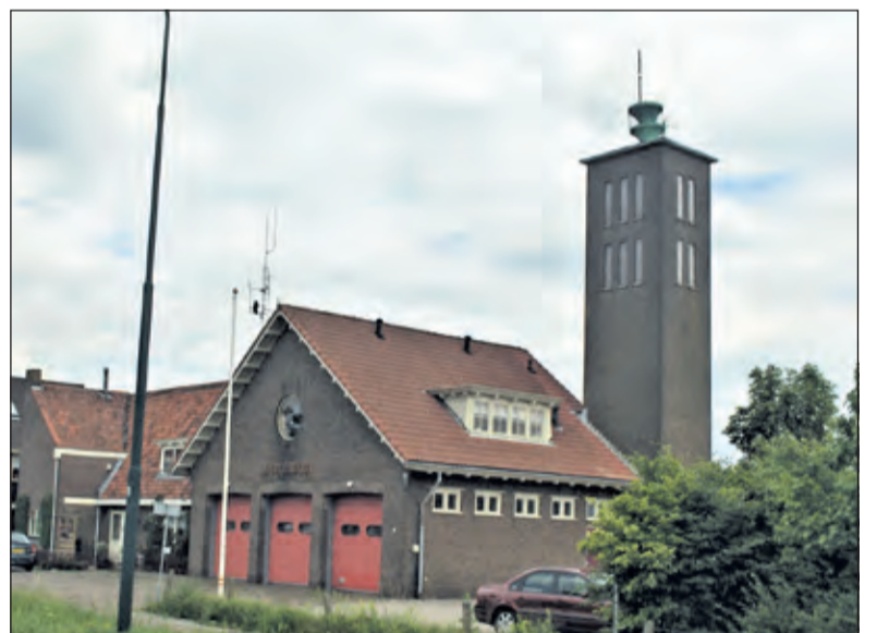
De brandweerkazerne voor de restauratie.

De toren is volgens de monumentenbeschrijving de blikvanger in de landelijke omgeving. Van deze blikvanger is echter die koperen kroon verdwenen. De vraag wanneer het monumentale koperen dak weer op de toren zou komen werd na lang doorvragen beantwoord met 'het monumentale koperen dak is er niet meer'. De aansluitende vraag of er een nu een koperen replica op gaat komen kon niet door de gemeente beantwoord worden'.