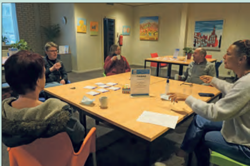
Aan de tafel Culinair worden afspraken gemaakt om bijvoorbeeld samen te koken of ergens te gaan eten.

Er waren meerdere tafels bezet, waarvan de tafels creatief en culinair de meeste bezoekers trokken. Ook konden er afspraken gemaakt worden om bijvoorbeeld samen te bewegen, een spel te spelen of iets te ondernemen op cultureel gebied. Juist in deze tijd van beperkingen is deze markt voor menigeen een mogelijkheid het leven meer kleur te geven. (Frans Poot)