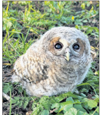
Jonge bosuultjes kunnen vaak zelf weer terug naar het nest klimmen.

ouders en had ik liever gezien dat deze onweerstaanbare vogel wat voorzichtiger was geweest, maar stiekem ben ik nog steeds onder de indruk over deze bijzondere ontmoeting. Als ik aan dit diertje denk, snak ik nog steeds een beetje naar adem.