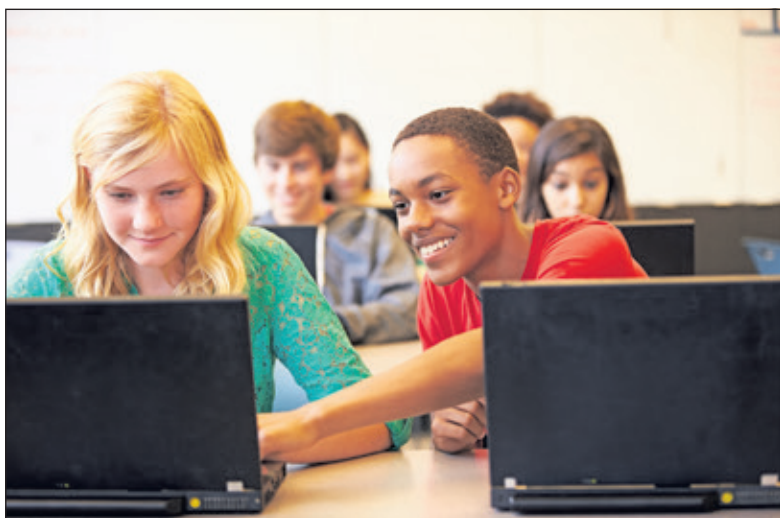
Stichting Leergeld maakt een laptop mogelijk.

Door Leergeld krijgen haar kinderen wat ze nodig hebben: 'Dat neemt mijn schuldgevoel weg. En dat van mijn kinderen ook! Ze zijn zo dankbaar'. Zeyneb benadrukt nog eens: 'Alles wordt zoveel duurzamer de laatste tijd. Geldproblemen kunnen ons allemaal overkomen. Dus als het nodig is: zet je trots en je schaamte aan de kant en zoek contact met Leergeld De Bilt. Voor je kinderen'. (Nicole Groenendal)