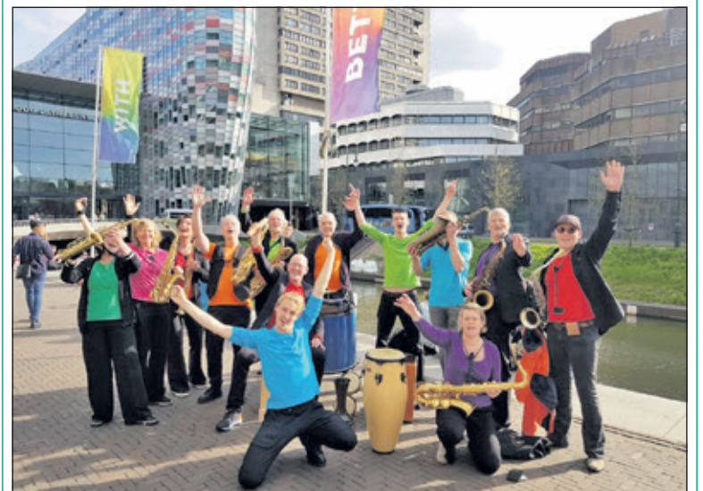
Tutti Saxi levert Sabroso.

Op 15 april aanstaande is er een open repetitie. Wil je komen kijken of Tutti Saxi iets voor je is? Of vind je het leuk om al direct mee te spelen? Er is plek voor beginnende én gevorderde muzikanten. Tutti Saxi heeft ruimte voor muzikanten die zich structureel willen aansluiten maar ook voor muzikanten die het leuk vinden om mee te spelen tijdens (project) optredens. Interesse? Stuur een mailtje naar pr@tuttisaxi.com . Als je wilt krijg je van tevoren al een paar muziekstukken. Repetities zijn op maandagavond om 20.00 uur in De Bilt, Weltevreden nr. 14