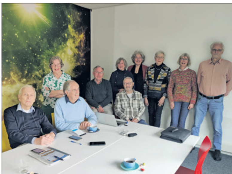
De jubilerende Studiekekring 50+ De Bilt in de Bilthovense bibliotheek.