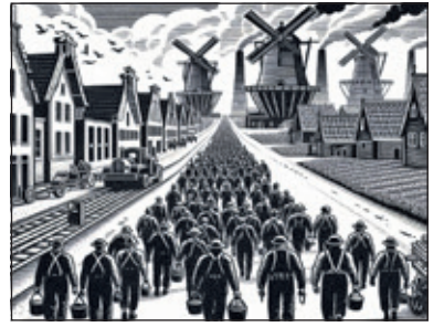
Hoe verliep de overgang van de landbouwsamenleving naar een gedeeltelijk industriële samenleving? (afbeelding Dick Berents)

Vraagstelling: Welke gevolgen had de Tweede Wereldoorlog voor de inwoners van de dorpen van de gemeente De Bilt? In het leven van de Nederlanders grepen de Duitse bezetting en de Tweede Wereldoorlog diep in. Ook de inwoners van de zes dorpen, die samen het huidige De Bilt vormen, voelden de gevolgen.