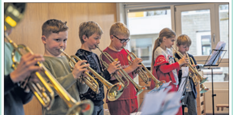
Leerlingen blazen bolle wangen op de trompet.