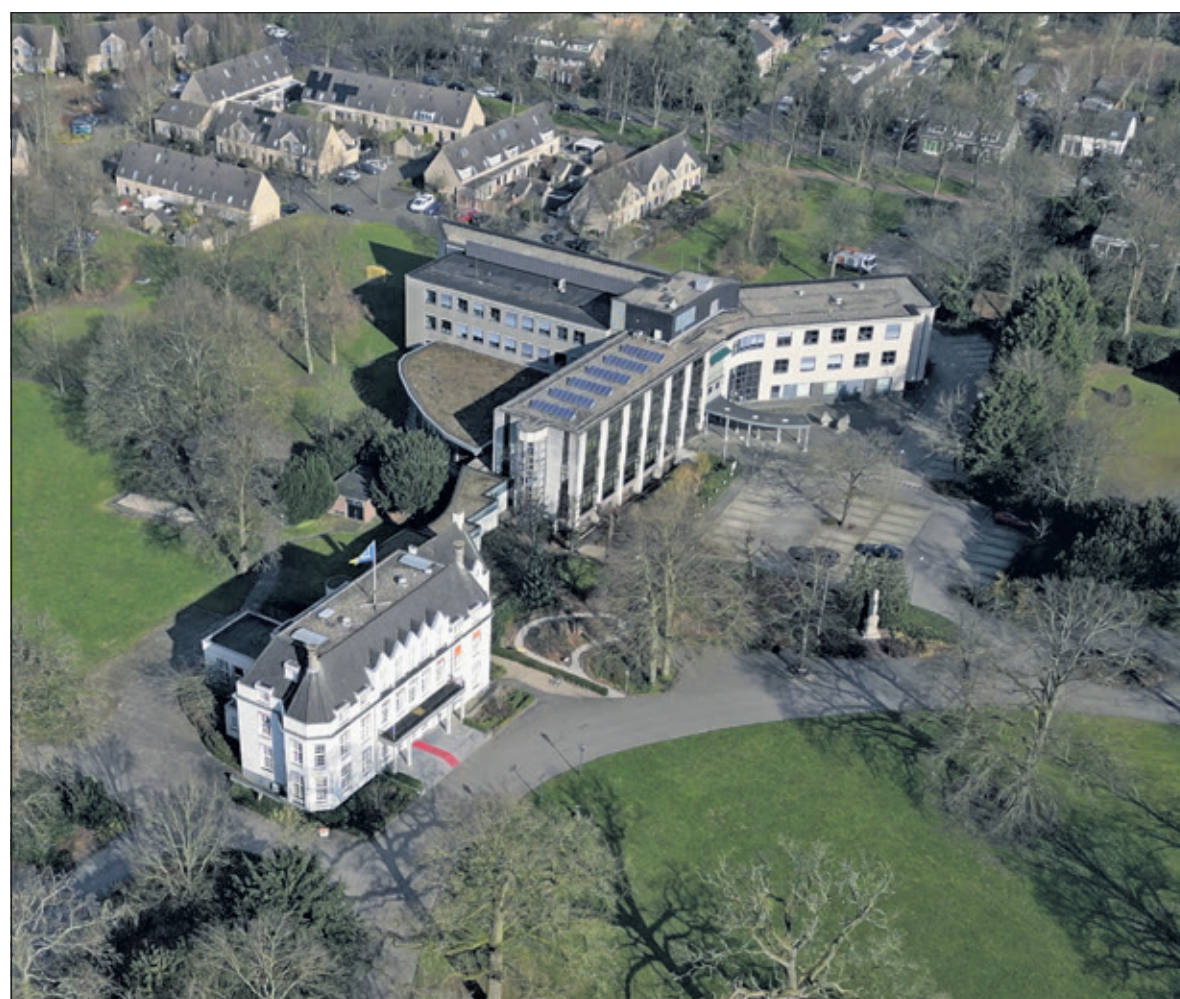
Jagtlust en het aangebouwde administratiekantoor.