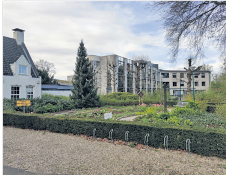
Naast het monumentale Jagtlust wil het college mogelijk een nieuw onderkomen laten bouwen voor de ambtenaren én burgers.