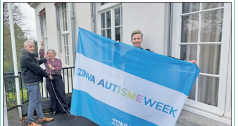
Gemeente De Bilt hijst de autismevlag.