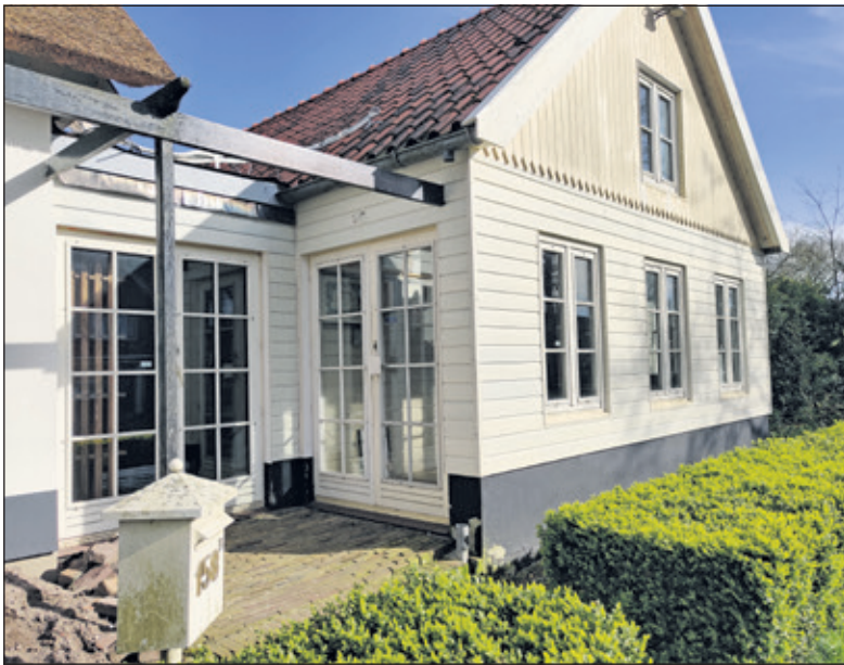
De deuren van Op de Terp zijn definitief gesloten.

Thuis heft hij een glaasje wijn: 'Gezondheid, het ga jullie goed en bedankt voor alle gezelligheid'.