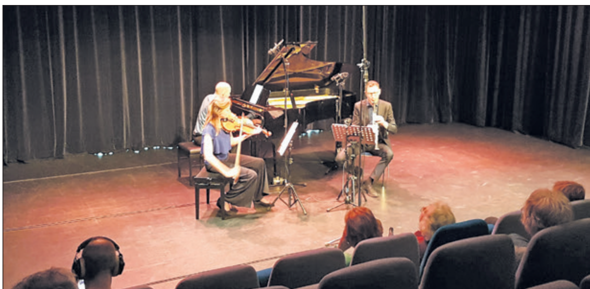
Trio Van der Hoeven speelde afgelopen zondagmiddag in het laatste concert van de serie Meesterpianisten in Het Lichtruim.