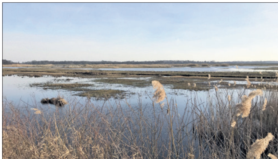
Kenmerkend voor de Westbroekse Zodden zijn de petgaten die ontstonden bij de turfwinning en de legakkers waarop de turf werd gedroogd.

De excursie wordt begeleid door vrijwillige gidsen van IVN De Bilt en Geopark Heuvelrug Gooi en Vechtstreek. Aanmelden (verplicht) kan via www.ivndebilt.nl . Er kunnen maximaal 20 men-sen mee. Deelname is gratis, honden kunnen niet mee. Denk aan stevig schoeisel. Start is bij de parkeerplaats, tegenover Kerkdijk 85 in Westbroek. Kom vooral op de fiets. Er is niet veel parkeerplek. (Roel Maas-Bakker)