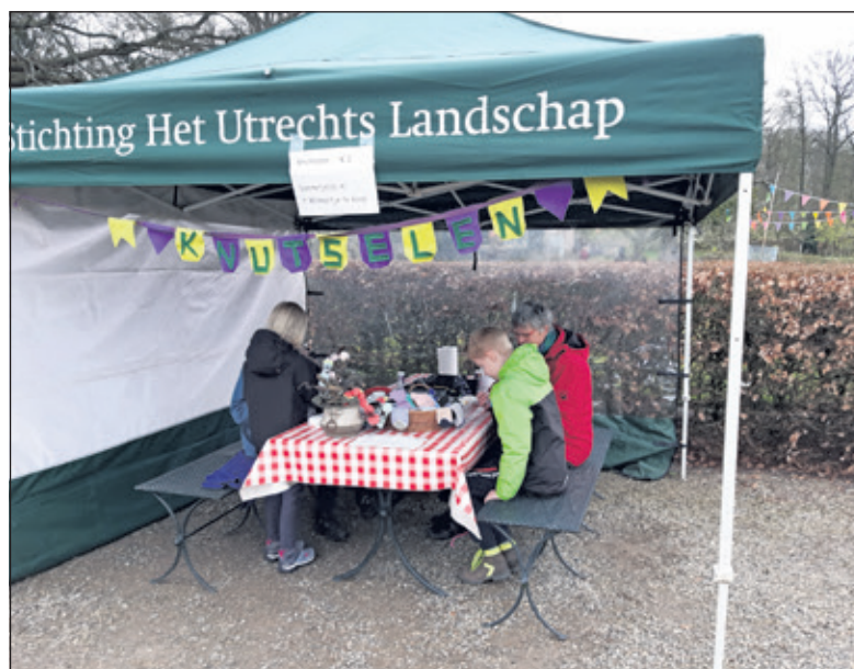
Knutselen op Oostbroek.

Dit jaar is er voor de kinderen een leuke bijen-knutsel en een nieuwe puzzelwandeling over het landgoed samengesteld. In de boomgaard staan spelletjes en vanaf de vlonder kan in de sloot naar waterdieretjes gezocht worden. Misschien lukt het wel om een hele grote zeepbel te maken. Na al die activiteiten is het lekker uitrusten op het terras met koffie, thee, sap en iets lekkers en voor de heel lekkere trek is Bram er met zijn pannenkoekenkraam. Landgoed Oostbroek ligt verscholen achter het Prinses Maxima Centrum aan de Bunnikseweg 45a te De Bilt. De toegang is gratis. Ga bij voorkeur met de fiets. Parkeermogelijkheden zijn beperkt. (Anja van Doorn)