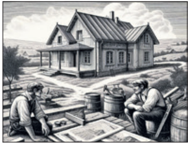
In welke bouwstijlen zijn de landhuizen gebouwd in de dorpen van de huidige gemeente De Bilt en wat zijn de afzonderlijke kenmerken van die bouwstijlen? (afbeelding Dick Berents)

Het is boeiend om op school dingen uit te zoeken over de omgeving waarin je woont en leeft. Het Online Museum beschrijft al zes jaar de cultuur en geschiedenis van jouw dorp en regio. Daarom is op de website een gevarieerd aanbod aan opdrachten en informatie te vinden voor in de klas en