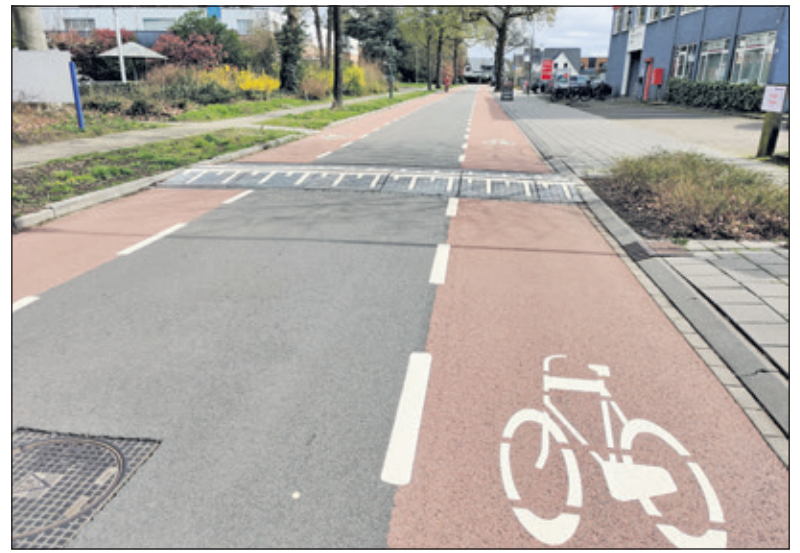
Om de hoge verkeersdrempels te vermijden kijken (bak-)fietsers graag uit naar de stoep.

een grote meerderheid van aanwezige inwoners heeft aangegeven de snelheid sterk naar beneden te willen brengen. Omdat de Berlagelaan voor een 30 km-weg breed is en daardoor - meer dan de meeste andere 30 km-wegen - eerder uitnodigt tot sneller rijden, is gekozen voor een 'hardere' drempel dan de gebruikelijke, c.q. de 20 km-drempel. Het kennisplatform CROW geeft richtlijnen over de maatvoering van drempels, waarbij een bandbreedte wordt gehanteerd die past bij een snelheidsregime. Er zijn momenteel geen verdere werkzaamheden gepland. Indien er nadrukkelijk de wens bestaat om deze drempels aan te passen, zal extra krediet moeten worden geregeld. We hebben subsidie ontvangen van de provincie voor het noordelijke deel van de Berlagelaan en zullen beoordelen of een mogelijk restant kan worden ingezet voor verbeteringen van het zuidelijke deel van de Berlagelaan. De stappen die worden ondernomen om ervoor te zorgen dat