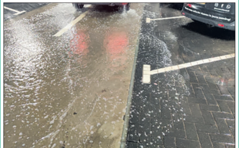
Inmiddels is de parkeergarage weer normaal begaanbaar.