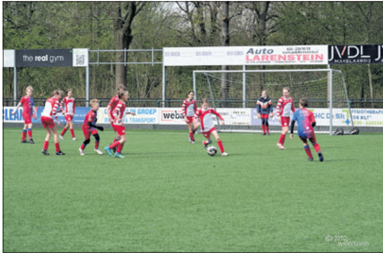
Twee van de 30 jeugdteams in actie tijdens de Paascup.

's Middags konden 30 teams in de leeftijdsgroepen 11 en 12 jaar aan de bak op een half veld. Mooi om te zien dat er ook meerdere meisjes meevoetbalde in de jongensteam. Van FC De Bilt deed ook een volledig meisjesteam mee, die dit ook in de reguliere voetbalcompetitie doet om de talentvolle meiden voldoende weerstand te bieden. Over de hele dag heen veel blijde kindergezichten die lekker actief