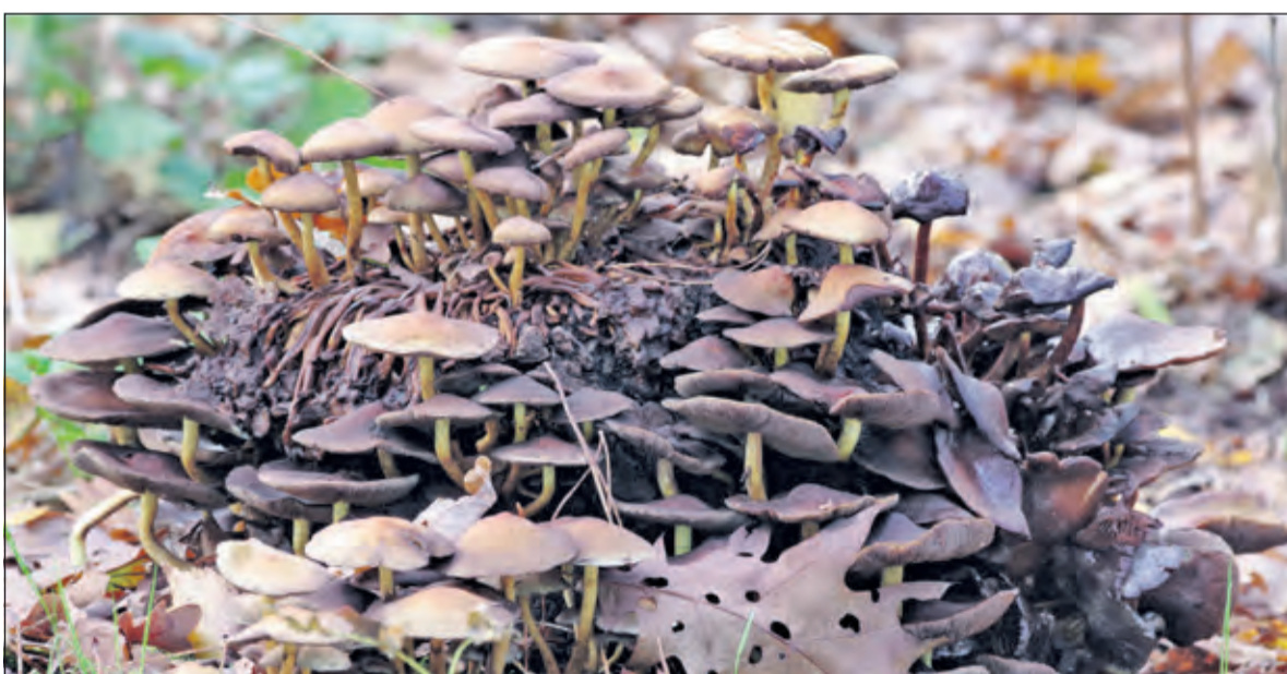
De laatste resten van een boomstam worden massaal opgeruimd.

Geïnspireerd door het artikel over paddenstoelen in De Vierklank van vorige week maakte Eugène Jansen nog een aantal foto's.