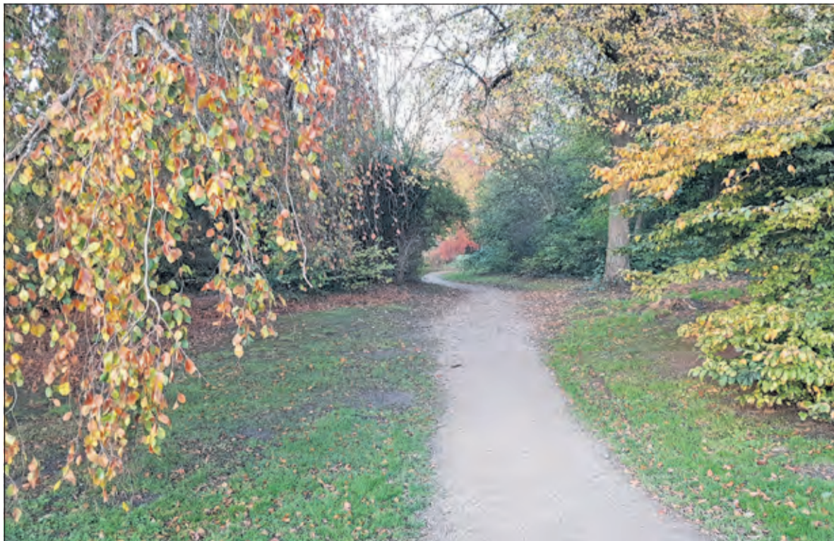
Romantische kronkelpaden in een herfstachtig Van Boetzelaerpark