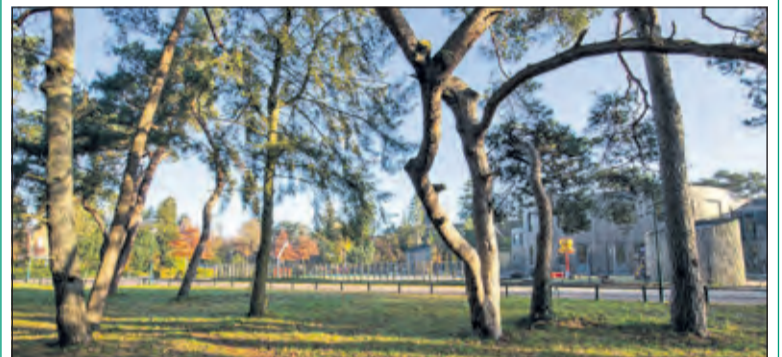
Het oude Biltsche Meertje ligt er weer prachtig bij.

Het oude Biltsche Meertje is een ontmoetingsplek voor jong en oud. Kinderen uit de buurt, van de naast gelegen Theresiaschool en Buitenschoolse opvang maken er graag gebruik van om lekker te spelen en kennis te maken met de natuur. Ook voor volwassenen is het een heerlijke plek om even te ontspannen of te wandelen. Vooral de 'oud Bilthovenaren' hebben mooie herinneringen aan deze plek waar ooit de ijsbaan was en waar mensen vanuit de wijde omtrek naar toe kwamen om even 'pootje te baden'. Ook zijn er dagelijks vrolijk spelende honden te zien en speciaal daarvoor is enige tijd terug een 'hondentoilet' geplaatst. Ook daar wordt veel gebruik van gemaakt. Zie voor info op www.vriendenoudebiltschemeertje.nl . (Ad van Gameren)