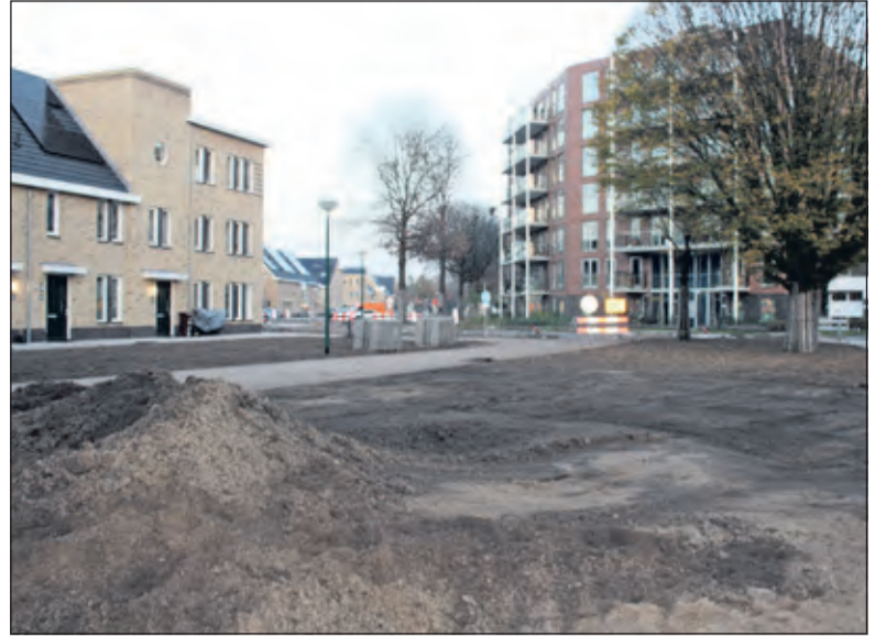
De Hof van Bilthoven (links) ligt 'dichtbij een dorpscentrum met winkels en horeca' (rechts).

dan een vijfde (19%) vindt dit niet belangrijk. De belangrijkste redenen waarom inwoners het een belangrijke opgave vinden, is omdat er veel mensen op zoek zijn naar een woonruimte (67%), dat het belangrijk is dat jongeren in de gemeente kunnen (blijven) wonen (66%) en dat er voor elk inko-