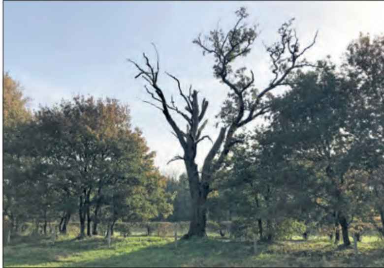
Veterane eik op Houtringe met links het dode deel en rechts het levende.

Bij bomen gaat het net iets anders. Oude bomen verzorgen over het algemeen tot aan hun dood de kleintjes. Van beuken is bijvoorbeeld bekend dat de grote bomen die vrijwel al het zonlicht wegnemen, voeding via de wortels doorspelen aan hun kroost. Als de ouder uiteindelijk doodgaat en instort komt er licht op de bodem en kunnen de kleintjes beginnen aan hun opmars. Tientallen jaren zorgt de ouderboom na het moment van sterven nog voor de kleintjes. De ouderboom verrot en vergaat langzaam. Beetje bij beetje wordt de ouderboom omgezet in humus dat weer wordt opgenomen in de grond als de ideale voedingsbodem voor de nakomelingen.