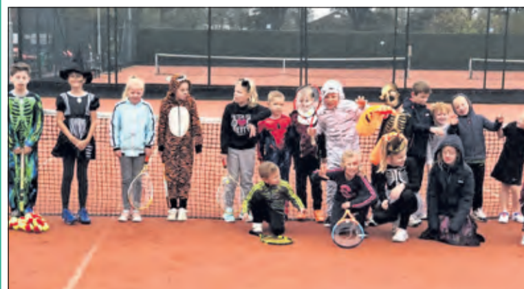
Voor de jongste jeugd heeft Tautenburg op vrijdag 30 oktober een halloween-event georganiseerd. 20 Kinderen hebben verkleed op het tennispark spellen gedaan, getennist en gezocht naar een griezelschat... in de buitenlucht... met 1,5 m afstand.

De tennisverenigingen hopen dat de daling van het aantal besmettingen zal doorzetten en dit ertoe leidt dat er minder strenge veiligheidsmaatregelen nodig zijn die de tennisverenigingen evenals andere sportverenigingen weer wat meer bewegingsruimte geven.