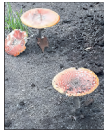
Herfst op de Bosuillaan