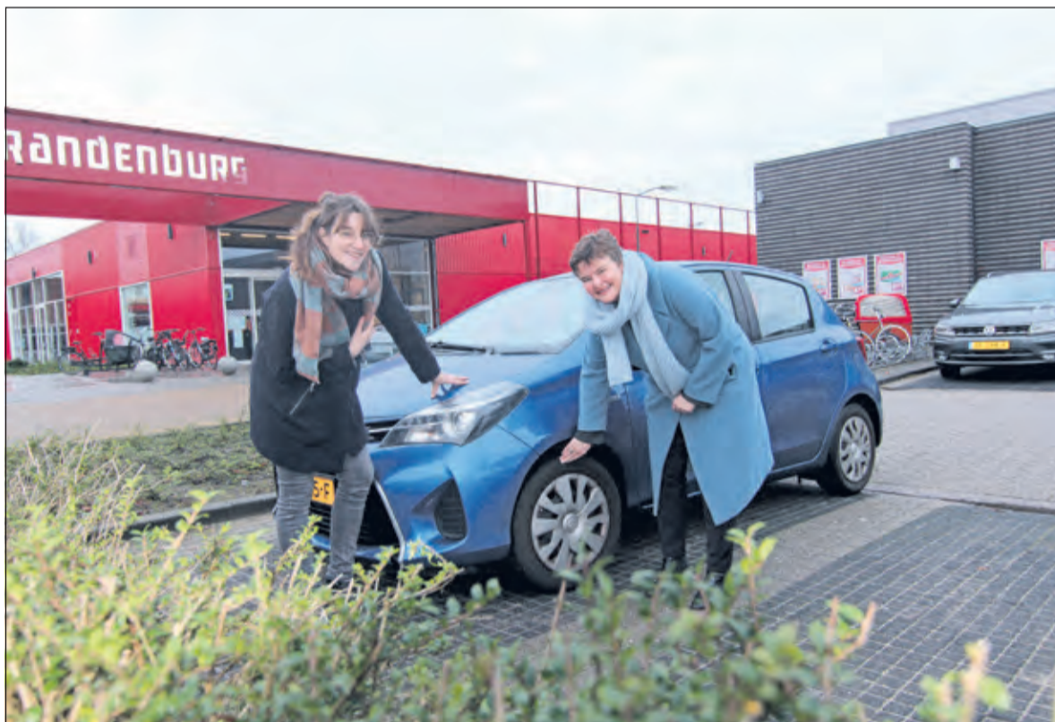
Duurzaamheid stond tijdens de beschouwingen volop in de belangstelling. De Slimme Bandenpomp geeft de gebruiker inzicht in de besparing en stimuleert gedragsverandering in het regelmatig oppompen van de banden.