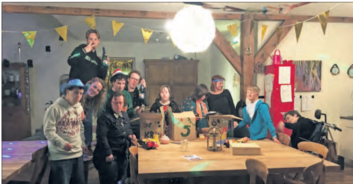
De bewoners van het Thomashuis in Maartensdijk slaan geen Kroeg over. Maar ook thuis werd een kleintje Kroeg groots gevierd.