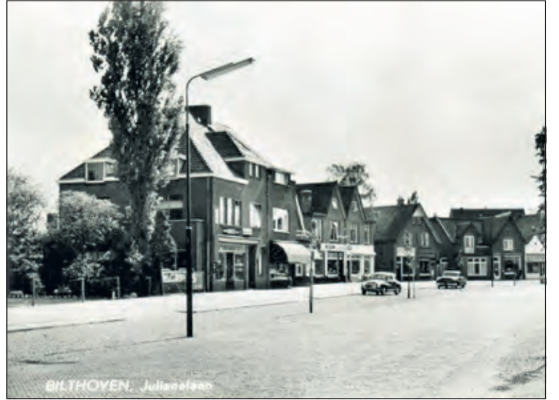
Het pand met de uitgeklapte luifel links is Julianalaan 38a in Bilthoven.