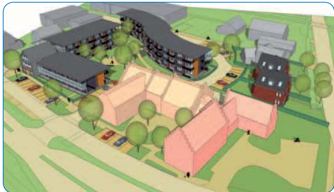
Artist impression van het SSW-plan rond het oude Raadhuis van Maartensdijk.

http://home.kpn.nl/bouws066/lugtensteyn/