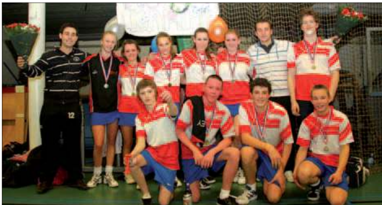
Nova B3 is afgelopen weekend kampioen geworden