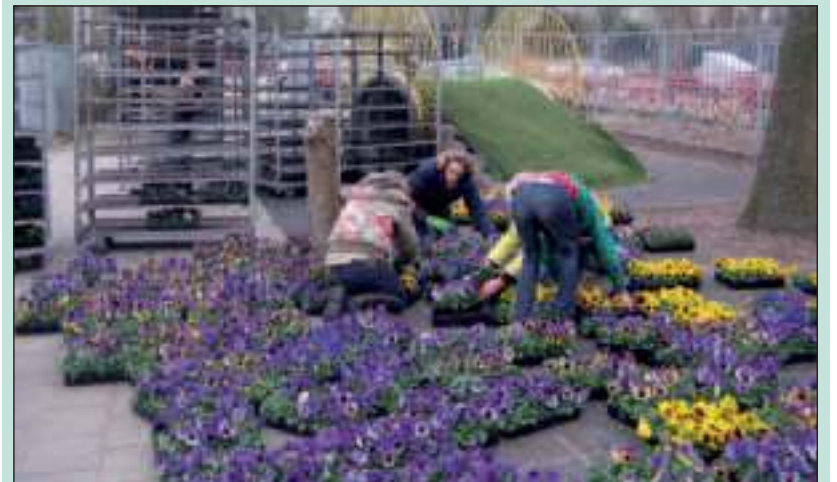
De violenactie van Patioschool De Kleine Prins was een succes.

Zaterdag 12 maart stond de vrachtwagen met 1150 bakken violen op het plein van Patioschool De Kleine Prins. Binnen een half uur waren de violen uitgeladen. Daarna kwamen de ouders de door hun kinderen verkochte violen ophalen om ze vervolgens bij de 'klanten' af te leveren. De opbrengst van de violenactie dit jaar is 3.700 euro. Dat is meer dan vorige jaren. Daarvan gaat 2000 euro naar het Ronald Mc Donald-huis. De rest van het geld zal besteed worden aan buitenspeelgoed voor de kinderen. (Corry de Rooij)