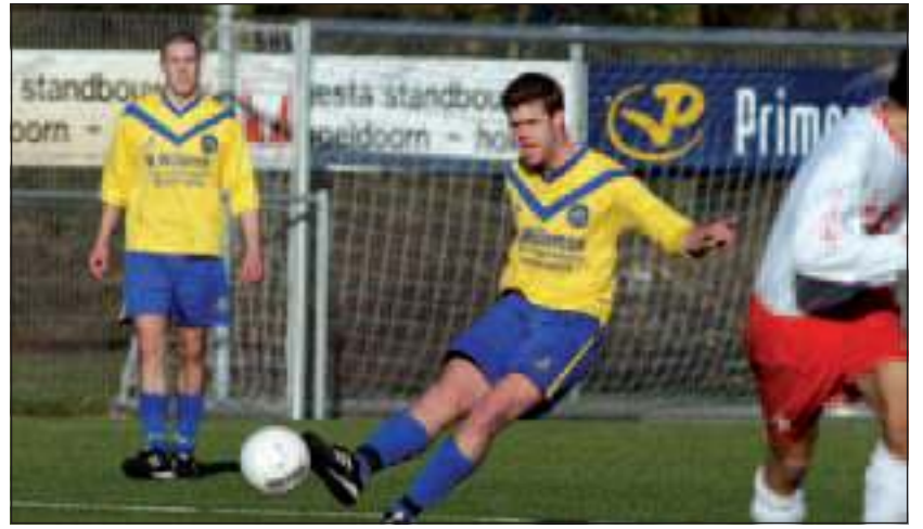
SVM heeft nipt met 2-3 verloren van Woudenberg.

Kevin van Dronkelaar prima in. De Kok kreeg kort daarop nog twee levensgrote kansen. Eerst werd hij in stelling gebracht door Eric Röling en in de 30ste minuut ontfutselde De Kok zelf de bal van de laatste man en mocht alleen op de keeper van Woudenberg af. Beide pogingen misten echter doel. In de 38ste minuut was het toch weer raak voor de spits, die liet zien dat hij sneller was dan zijn tegenstanders. SVM nam een verrassende voorsprong van 2-1. Dat was een mooie ruststand geweest, maar Woudenberg slaagde er in kort voor rust de gelijkmaker te maken. Een schot werd in eerste instantie gestopt door keeper De Groot, maar in de rebound werd de bal toch in het SVM-doel gewerkt.