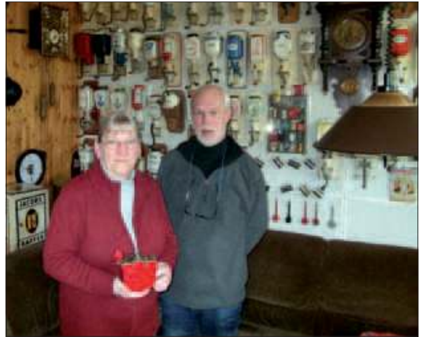
Belangstelling is er genoeg voor de koffiemolens van het echtpaar, waarvan de unieke koffiemolen in de vorm van een tulpe het pronkstuk is.

Het zijn dergelijke verhalen die ze indirect allemaal aan hun 'verzamelverslaving' te danken hebben. Dus