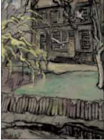
'Het oude gemeentehuis in de avondzon' is één van de schilderijen, die straks in het Museum Hilversum is te bewonderen.

Om de fraaie maar kwetsbare werken voor de komende generaties te behouden, moeten de schilderijen in goede klimatologische omstandigheden worden bewaard. In de gemeente De Bilt zijn geen goede mogelijkheden voor handen om de werken permanent te tonen of op te slaan. Het Museum Hilversum is toegerust en bereid om de werken onder ideale omstandigheden te bewaren. De schilderijen blijven eigendom van de gemeente De Bilt en kunnen op afroep worden opgenomen in gemeentelijke exposities. Ieder die dat wenst kan de schilderstukken daar onder goede omstandigheden bestuderen.