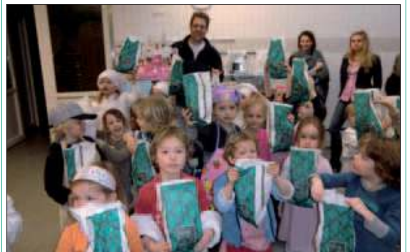
Aan het einde van dit leerzame uitstapje mocht ieder kind zijn eigen warme broodjes mee naar huis nemen.

De kleuters gingen koekjesdeeg maken en koekjes bakken, cakebeslag maken en cake bakken. Als afsluiting van dit geslaagde project mochten zij bij Bakker Bos in Maartensdijk komen. Daar mochten ze de hele bakkerij zien; ze mochten een kijkje nemen bij de rijkast, de ovens en de deegmachine. En ze leerden zelf broodjes kneden, rollen en vlechten met een smakelijk resultaat. (Yvonne Pennings)