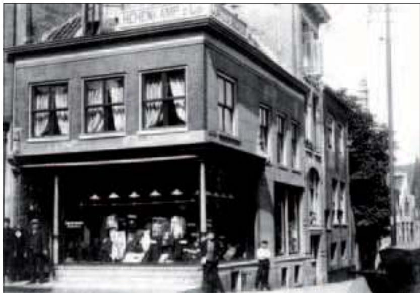
Hehenkamp 2 eeuwen geleden.

Ik heb een creatief beroep ontwerpers kiezen de stoffen en daarna worden de dessins ontworpen maar daar houdt het niet mee op. om een vergelijking te maken: een fabrikant kan de beste verfkwesten en schilderslinnen leveren maar daarmee heb je nog geen schilderij toch dan komt er weer een andere discipline bij kijken pas als een klant 100% tevreden is ben ik het ook Hehenkamp herenmode is zeker niet van gisteren.