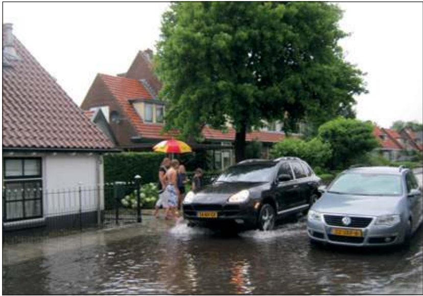
Het riool op de Molenweg in Maartensdijk heeft grote moeite om het hemelwater af te voeren.