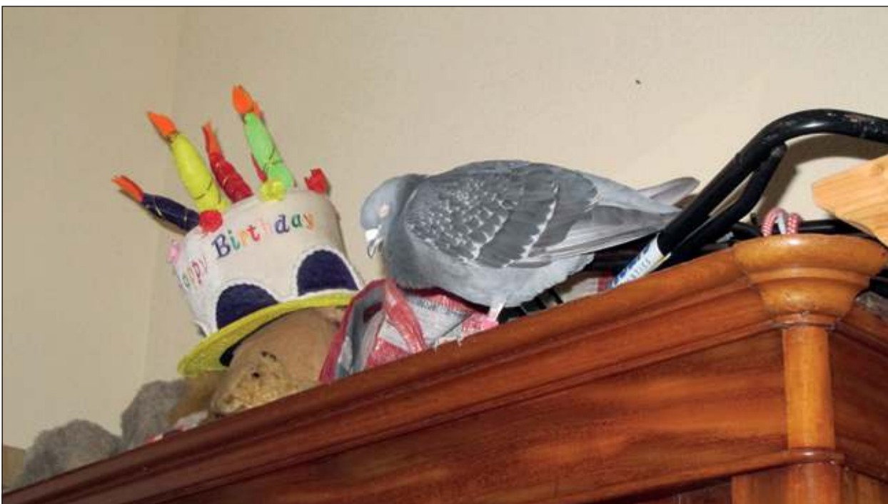
Duif komt binnenshuis even bij tussen de knuffels.

beloofde de duif te komen halen en zich over hem te ontfermen. Aan de hand van de ontlasting van het dier constateerde hij dat het ziek was, maar voegde er geruststellend aan toe: 'Het komt wel goed met hem.' Thuis vulde hij via de website www.npoveendaal.nl/duif-gevonden de gegevens op de pootring in om uit te vinden waar de duif vandaan kwam. Het dier bleek afkomstig te zijn uit Heino, een dorpje bij Raalte in de provincie Overijssel, zo'n honderd kilometer van Bilthoven af. De postduivenhouder zal contact leggen met de eigenaar, die het dier - volgens de regels van de Nederlandse Postduivenhouders Vereniging - wel zal komen ophalen. [LvD]