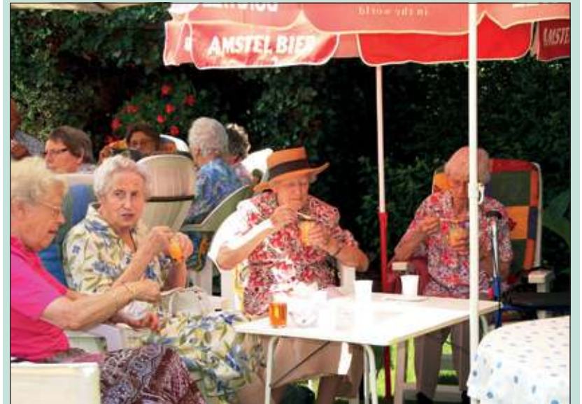
Ouderen genieten zichtbaar tijdens de Zonnebloem picknick.

Het werd een zonovergoten picknick van de Zonnebloem Maartensdijk op 25 juli jl. in de boomgaard van een der vrijwilligsters in Westbroek. Onder de vele parasols werden de 52 gasten verwend met sandwiches, hartige hapjes, zoete lekkernijen en aardbeien die gedoopt werden in slagroom. Een lekker glas witte wijn of een romig advocaatje bekroonde dit heerlijke genieten. Muzikaal werd de sfeer nog meer verhoogd door accordeonist Ebbe Rost van Tonningen.