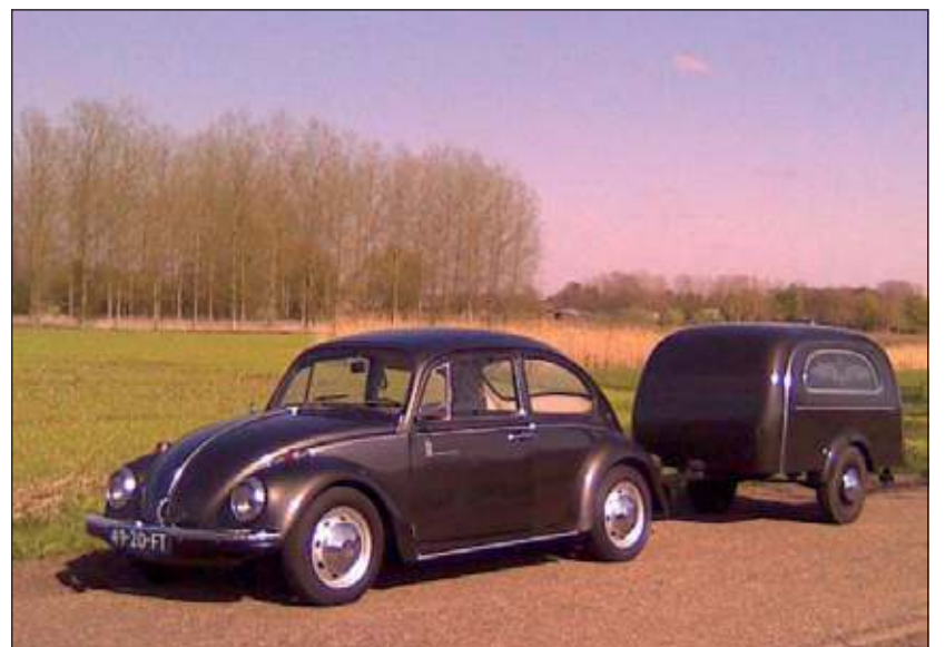
Ter plekke kunt u eens informeren naar de functie van de aanhanger

Er is wel sprake van wegfzetting maar waar precies was nog niet bekend. Het dorp Lage Vuursche niet wordt aangedaan voelen leden van de Contactcommissie Lage Vuursche zich gepasseerd. Men was graag tevoren op de hoogte geweest en zal alsnog contact opnemen met de organisator.