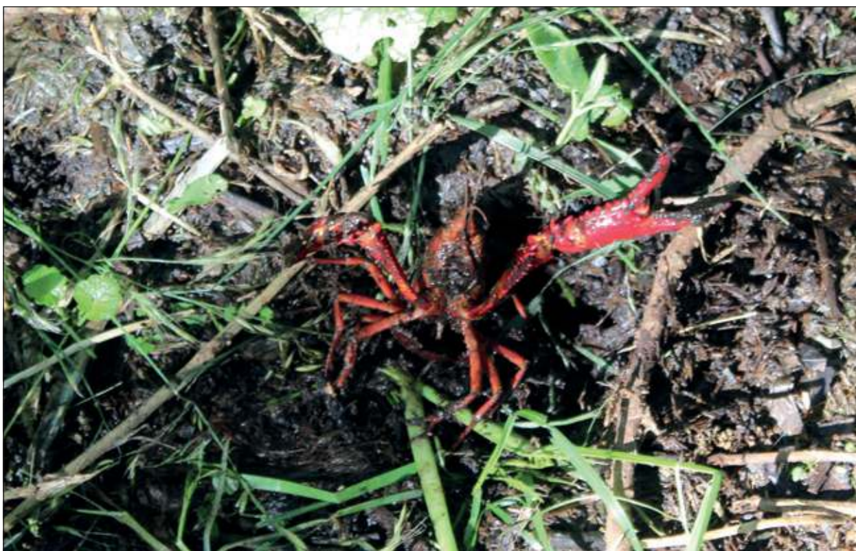
Zeer waarschijnlijk is dit de rode Amerikaanse rivierkreeft, een exoot, die 15 cm lang kan worden, een alleseter die plaatselijk een plaag kan worden en inmiddels talrijk is in de Vechtstreek.

Mocht iemand ons willen bijpraten, dan is een e-mail naar info@vierklank.nl voldoende om ons in contact te brengen. [HvdB]