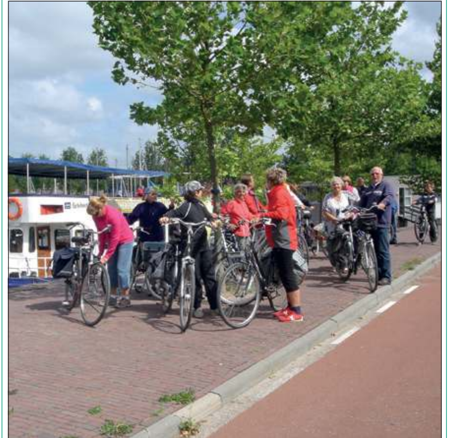
Deelnemers aan de combi fietstocht verlaten de Fietsboot Eemlijn in Huizen.

Voor meer informatie over deze en de overige tochten van Fietsgilde 't Gooi, zie www.fietsgilde.nl