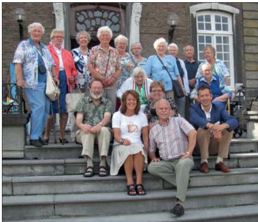
Op het bordes van Nederlands grootste kloostercomplex; Abdij Rolduc te Kerkrade, genieten de gasten van De Bilthuysen UITbureau voor Ouderen na in de heerlijke zomerzon.

'De korte vakanties van het UITbureau blijken iedere keer voor een brede doelgroep ouderen aantrekkelijk en fysiek haalbaar. Dit is tevens een grote bijdrage aan het voorkomen van eenzaamheid en helpt mee aan het opbouwen van sociale contacten. Ook het personeel van het hotel in Valkenburg zorgde met hun klantvriendelijke benadering en service voor een heerlijk verblijf', aldus Arjan Walraven, coördinator UITbureau voor Ouderen. [HvdB]