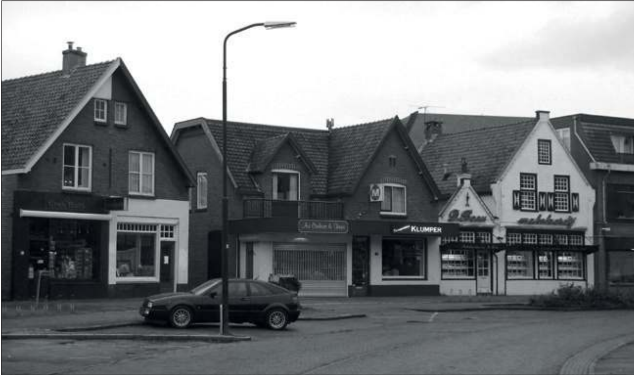
Het is onzeker of de huidige situatie, gefotografeerd vanaf ongeveer hetzelfde punt, de ingezette modernisering van ons dorpscentrum zal overleven.

De Historische Kring D' Oude School wil u in deze serie artikelen graag laten meegenieten van dit interessante beeldmateriaal.