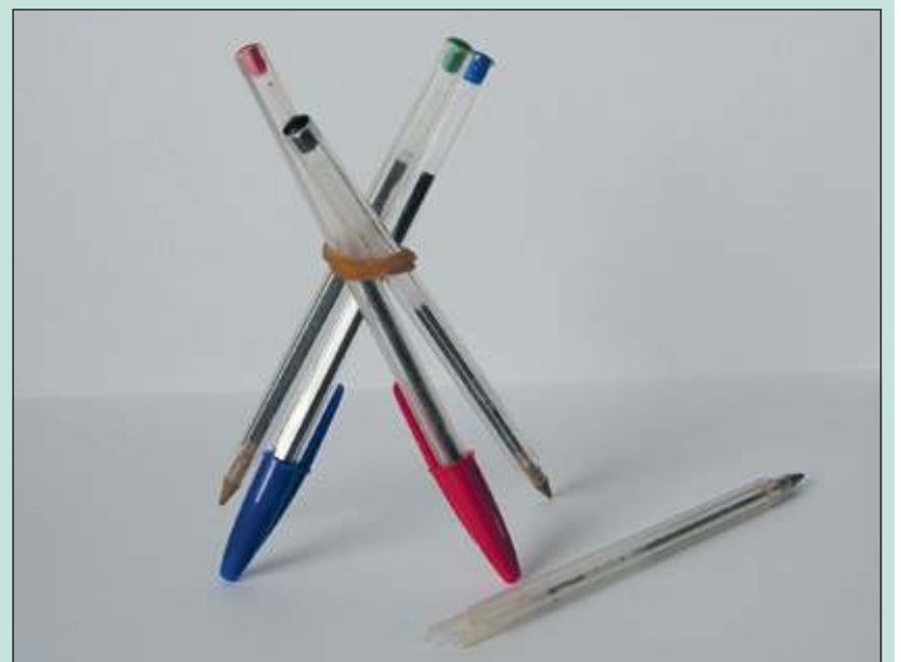
Vier BiC pennen in verschillende kleuren. Twee ervan hebben nog het originele dopje. Op de voorgrond een intensief gebruikt en 'afgekloven' exemplaar.