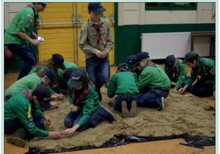
Racing Domino met lucifers kan je zelf thuis niet doen.

Ga gezellig mee doen op zaterdag van 9.00 uur tot 11.15 uur in het clubhuis aan de Dierenriem, als je het leuk vindt kun je na een paar keer lid worden en alle leuke en boeiende opkomsten mee maken. Voor meer informatie: mail naar akelajose@gmail.com .