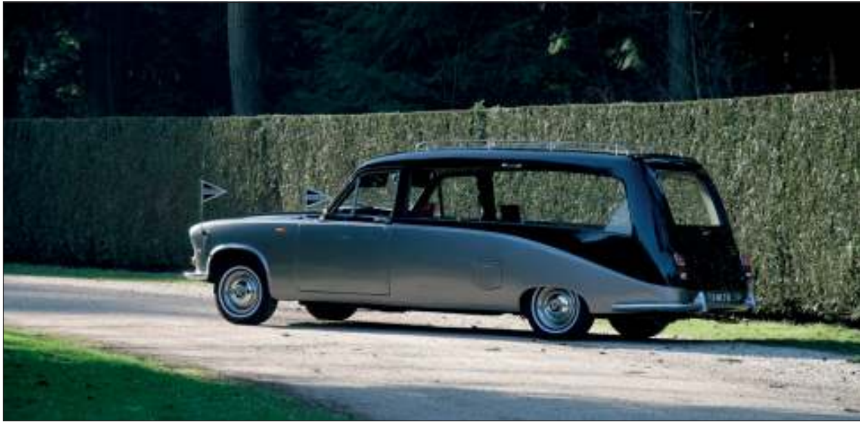
Een replica van de lijkwagen van prinses Diana rijdt ook mee.

De naam Nuvema staat voor 'Nederlandse Uitvaart Verzekering Maatschappij' en is al zestig jaar een zeer serieuze onderneming met driehonderd aangesloten uitvaart bedrijven die landelijk werkt en binnenkort een ludieke actie organiseert. Een reclamestunt die aandacht trekt waarvoor overheden toestemming hebben