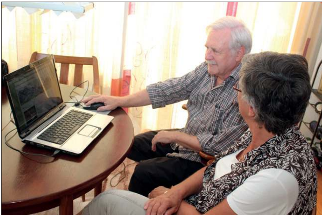
Leden van het Dorpsoverleg Wijk- en Dorpsgericht Werken in Hollandsche Rading bekijken de nieuwe site.

We vroegen ook waarom er met een eigen site is gekomen. Dit is volgens hem gedaan omdat het Dorpsoverleg zelfstandig in staat moet zijn de eigen communicatie naar de dorpsgemeenschap te onderhouden. Zij is daarvoor verantwoordelijk en aanspreekbaar. Bovendien staan op de site links naar andere sites waar men aanvullende informatie vandaan kan halen; bijvoorbeeld is er een link met de site van de gemeente. Het Dorpsoverleg hoopt dat de site in een behoefte voorziet en dat deze in het dorp veel zal worden bekeken. [HvdB]