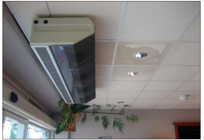
Bij de slager en de bakker zijn de plafonds doordrenkt

Over de Prins Bernhardlaan wordt verteld dat daar al vaker problemen waren die daarna zijn opgelost. Op het gemeentehuis bij Beheer Openbare Ruimte afdeling riolering was de ambtenaar niet bereikbaar. Die heeft veel te regelen. Uit een keurige reactie van afdeling communicatie blijkt dat de Maartensdijkse ondernemers binnenkort persoonlijk op de hoogte worden gebracht van de komende gemeentelijke aanpak.