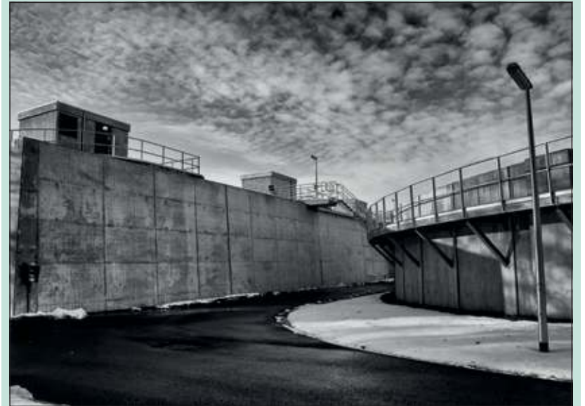
Eén van de geëxposeerde foto's is van de waterzuivering van De Bilt aan de Groenekansweg van Kees Alfien.

De expositie kan worden bekeken tijdens de openingstijden van het gemeentehuis aan de Soestdijksweg Zuid 173 te Bilthoven. Voor meer inlichtingen: www.fotoclubbilthoven.nl [HvdB]