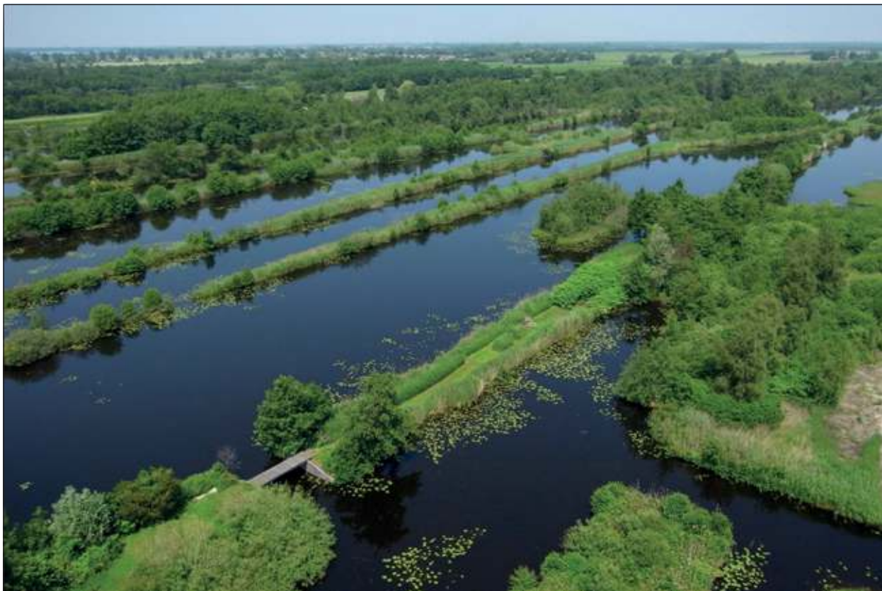
Staatsbosbeheer vaart u rond in dit prachtige natuurgebied.

Staatsbosbeheer aan de Westbroeksebinneweg 5 te Tienhoven (Molenpolder). Bij aankomst om 10.00 uur staat de koffie klaar en de vaarwandelexcursie duurt ongeveer 2 uur. Er is plaats voor 18 personen en de deelnemers dienen zich vooraf aan te melden via www.groenehartcentrum.nl of via 06-23774925. Het is aan te bevelen om goede schoenen of laarzen aan te trekken en eventueel regenkleding mee te nemen. Een verrekijker vergroot het kijkplezier. De excursie is minder geschikt voor mensen die slecht ter been zijn. Kijk voor meer info en kosten op www.staatsbosbeheer.nl en www.groenehartcentrum.nl