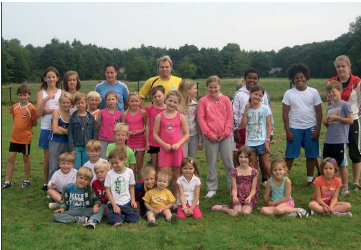
Sportweek Doe Mee De Bilt trapt maandagmorgen veelbelovend af met een recordopkomst in Hollandsche Rading.

Afgelopen maandag is de sportweek aangebroken. Gelukkig voor de organisatie was er sprake van beduidend meer opkomst dan vorig jaar. Vorig jaar was de opkomst in Hollandsche Rading nul-komma-nul. Dit jaar meldden zich voor de eerste activiteit al 24 kinderen. Voor de 2 resterende dagen geven we de activiteiten hiernaast nog 1 keer schematisch weer.