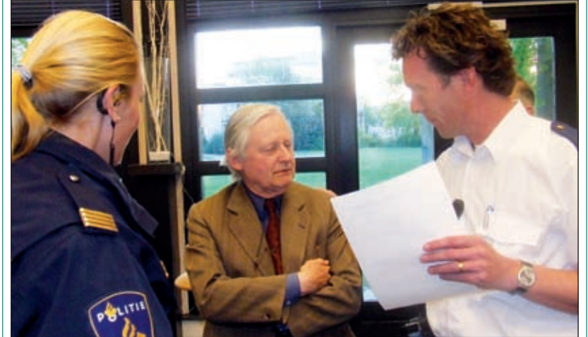
De Biltenaar wordt door de politie uit de raadzaal verwijderd.