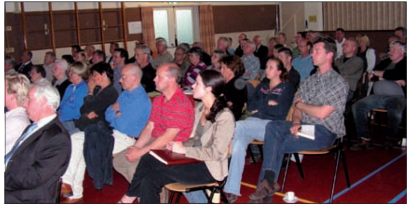
Veel belangstelling voor de presentatie in het Dorps huis van Westbroek.

Zo'n 5 inwoners van Westbroek zijn woensdagavond 22 april naar het dorps huis gekomen voor de presentatie in concept van de Toekomstvisie Westbroek. Dat waren er meer dan verwacht werd. In allerijl moesten er stoelen worden bijgeschoven om iedere belangstellende een zitplaats te geven. Het toont aan hoe groot de belangstelling van de Westbroekse gemeenschap is als het gaat om de toekomst van hun zo geliefde Westbroek. Ze kregen uitleg over de vele onderwerpen en uitgangspunten die in de visie zijn opgenomen. Na afloop was er de mogelijkheid om vragen te stellen. Het college van De Bilt zal nog deze zomer de toekomstvisie vaststellen en ter besluitvorming voorleggen aan de gemeenteraad.