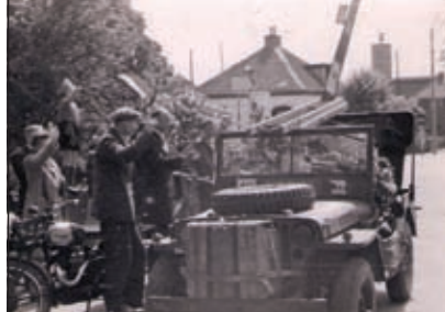
Canadese bevrijders bij het gemeentehuis.