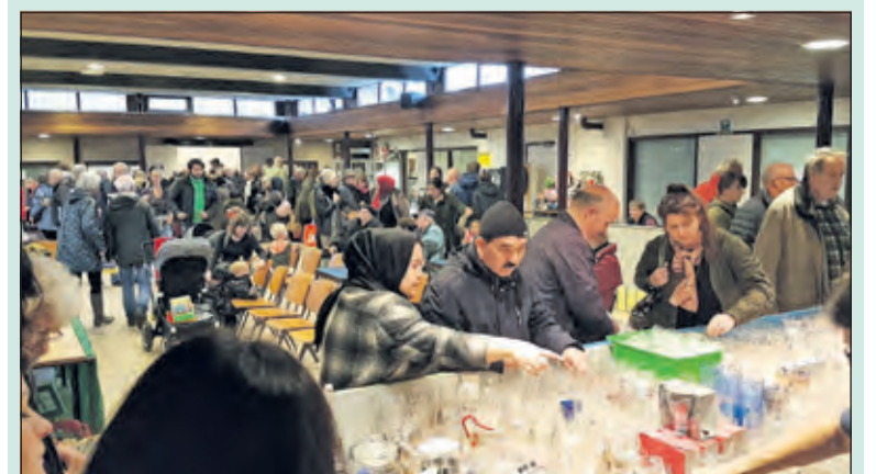
Turkse bazaar in WVT.