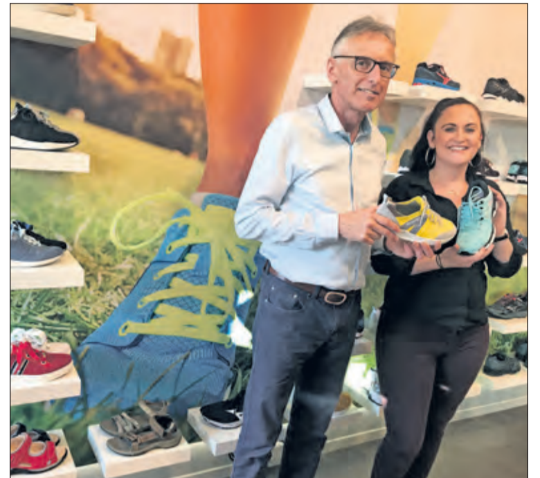
Met reflecterende schoen ben je goed zichtbaar in het donker.

Je bent welkom om de wandelschoenen te komen uitproberen bij George In der Maur Beterloperwinkel, Koningin Wilhelminaweg 497 in Groenekan. In de