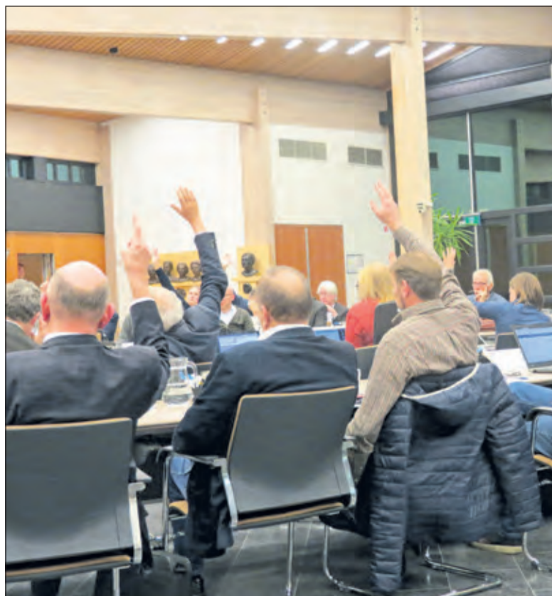
Veel moties zorgen voor veel stemmingen.