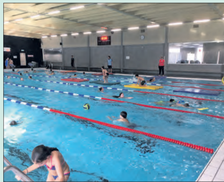
Zwemfestijn in het nieuwe zwembad Brandenburg.

Er waren geen prijzen aan het festijn verbonden, maar alle 400 kinderen gingen met een vrijkaartje voor een avondje discozwemmen naar huis. (Paul van den Brink)