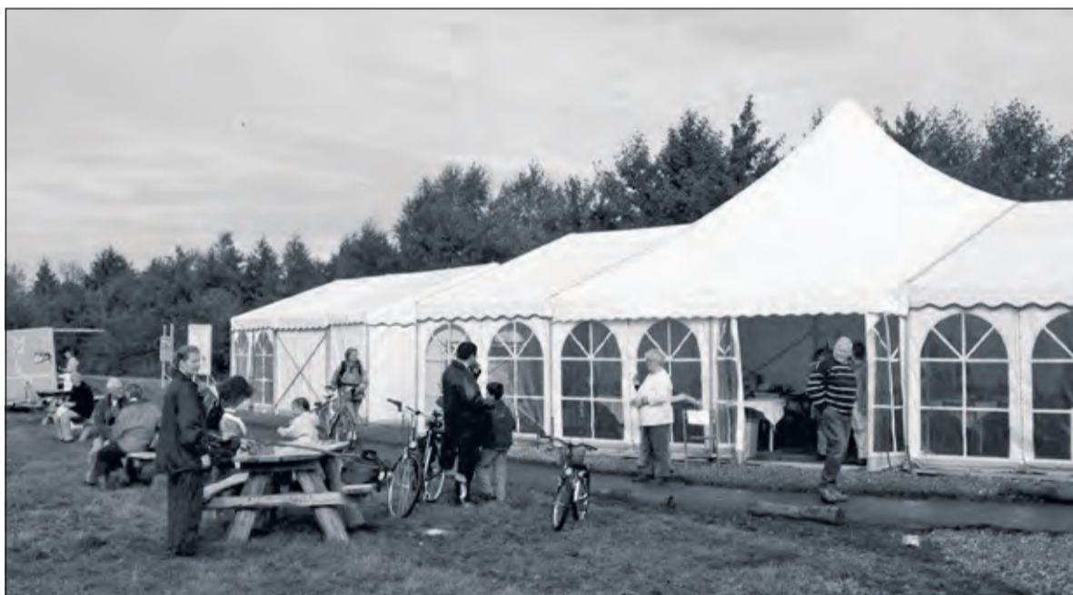
De tent van het Utrechts Landschap bij de Hooge Kampse Plas en de bezoekers op zondag 26 september 2004.