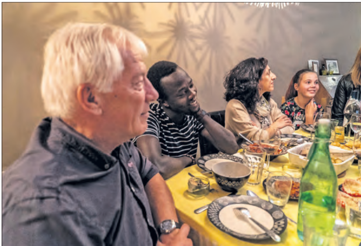
Aanschuiven via Eet mee leidt tot gezellige ontmoetingen.

als gast en bij iemand aanschuiven. Aanmelden kan tot 15 december via tel. 030 2213498 of www.eetmee.nl .