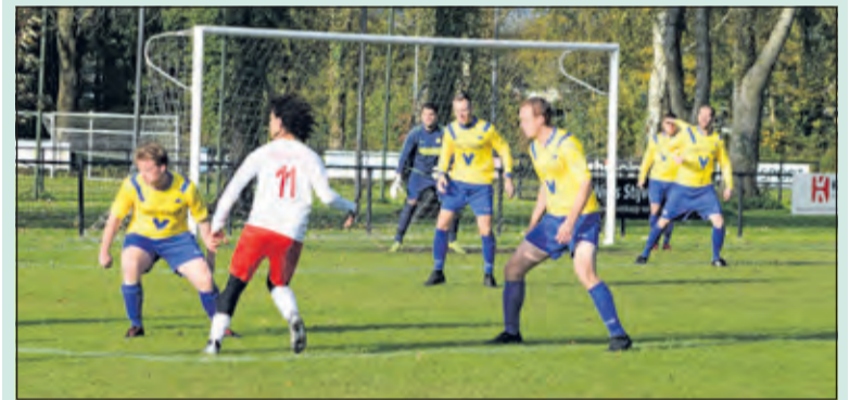
SVM wint met ruime cijfers en verdedigt met 6 man tegen één.

De tweede komt Stijn Orsel voor Perry van den Bunt en in de 55ste minuut komt Bouty voor Leroy Engel. De laatste 10 minuten van de 2e helft zijn nog even leuk: Mike scoort de 0-7, Nicky Engel de 0-8 en in de laatste minuten via een strafschop tilt Mike de Kok de 0-9 op het scorebord. Volgende week 9 november ontvangt SVM het in de middenmoot bivakkerende SV de Vechtstroom uit Utrecht Overvecht.