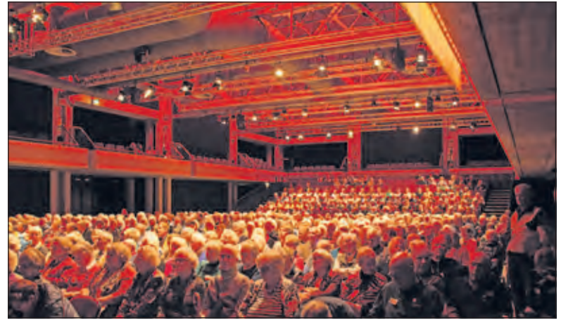
De deelnemers hebben genoten van de feestelijke middag. 'Vele meezingliedjes van vijftig, zestig jaar terug (...)', zei een deelnemer: 'Ik had een mooie en fijne middag'.