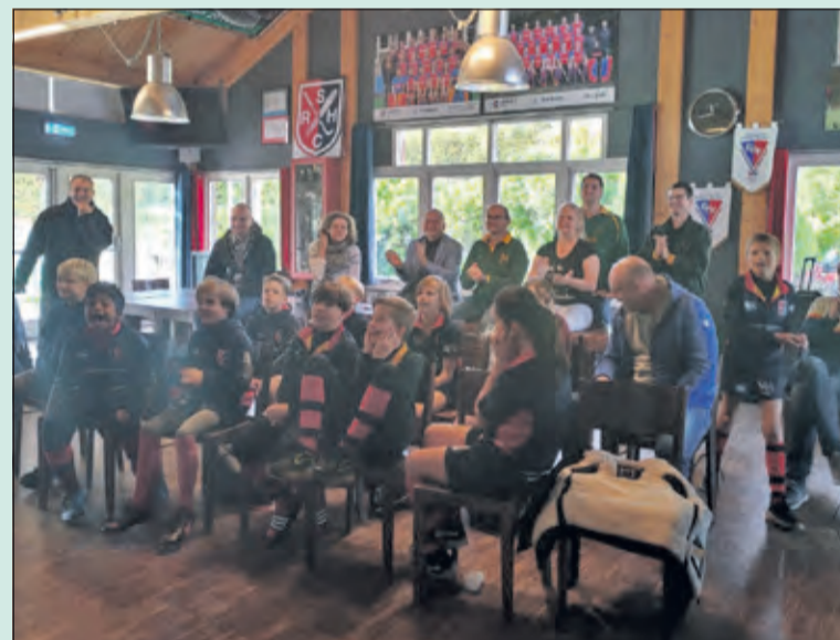
Het SRFC U12 team kijkt samen met hun Zuid Afrikaanse trainer naar de finale van de Rugby World Cup