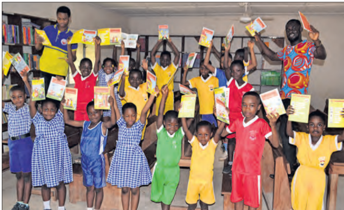
Blijde gezichten in Ghana.

De vrijwilligers van stichting Ghana schoolsupport zijn geïnspireerd door de uitspraak van Nelson Mandela 'Education is the most powerful weapon which you can use to change the world'. Inmiddels zijn al 12 mooie projecten sinds de oprichting in 2015 gerealiseerd. Samen met Stichting Emmaus Domstad hebben ze de wereld voor kinderen in Ghana weer een beetje mooier kunnen maken. Kijk voor meer informatie over Stichting Ghana schoolsupport www.ghanaschoolsupport.nl of bel 030 2252467. [HvdB]