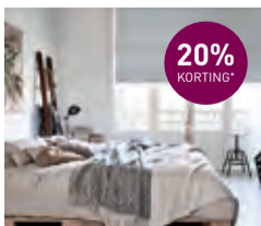
Decorette plisségordijn 60x100 cm (bxh) vanaf € 176,- voor € 136,-