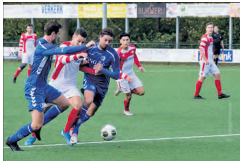
WV-HEDW gaf FC De Bilt weinig kansen voor een beter resultaat.