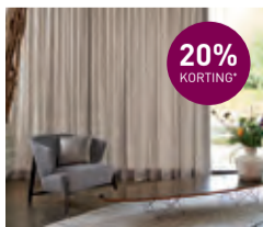
Gordijnstof Paddock kamerhoog 310 cm van € 83,95- voor € 67,20 per meter

Bekijk ons gehele assortiment op Decorette.nl