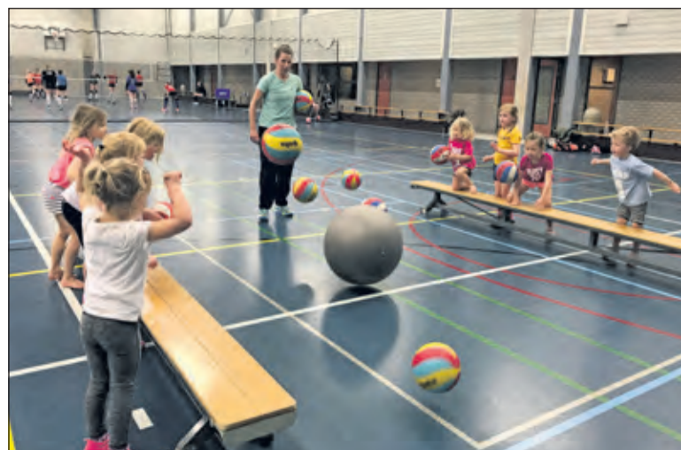
In de sportspeeltuin van Irene worden er wekelijks leuke spelletjes gedaan

Afgelopen zaterdag zijn er bij scoutinggroep Ben Labre in De Bilt 4 nieuwe welpen en een nieuwe leiding geïnstalleerd. Samen met hun ouders, broertjes en zusjes en andere leden van de groep werd hier een leuk feestje van gemaakt. Doordat er dit jaar ook weer nieuwe leiding is geïnstalleerd, is er bij de groep nog ruimte voor meer welpen. Voor meer informatie kan men kijken op www.benlabre.nl of mailen naar bestuur@benlabre.nl . (Cecile-Marie Boots)