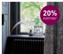
Gordijnstof Elsa kamerhoog 300 cm van € 66,95- voor € 45,50 per meter

EEN SFEERVOLLE WOONSTIJL CREËER JE MET ONZE PRACHTIGE GORDIJNSTOFFEN.