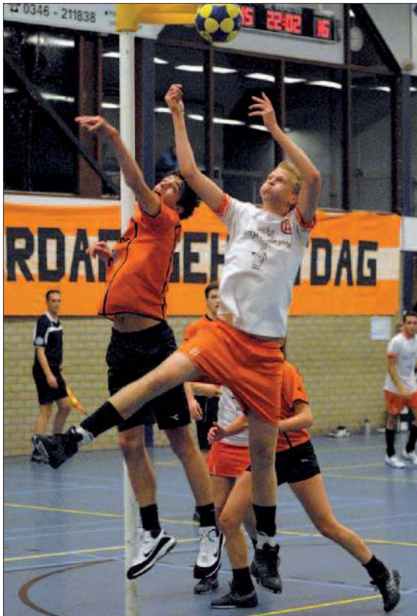
TZ heeft de thuiswedstrijd tegen het Gorinchemse GKV met 24-26 verloren.

Na de rust was het opnieuw GKV dat scoorde en TZ op 12-15 achterstand zette. Daarmee werd de toon gezet voor de tweede helft. TZ moest in de achtervolging en kwam weliswaar enkele keren op gelijke hoogte. GKV reageerde steeds door direct opnieuw tegen te scoren waardoor het initiatief bij GKV bleef. In een spannende slotfase kwam TZ nog terug tot 24-25. In de laatste minuut maakte GKV opnieuw een doelpunt waardoor de wedstrijd werd beslist. Eindstand 24-26. TZ 2 speelde ook thuis en won het eerste competitieduel met heel ruime cijfers. Tegen ODO 2 werd met 21-3 gewonnen. Volgende week spelen beide TZ- teams uit tegen Tempo in Alphen aan de Rijn.