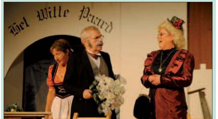
De cast van Steeds Beter zette een bijzondere jubileumuitvoering neer.