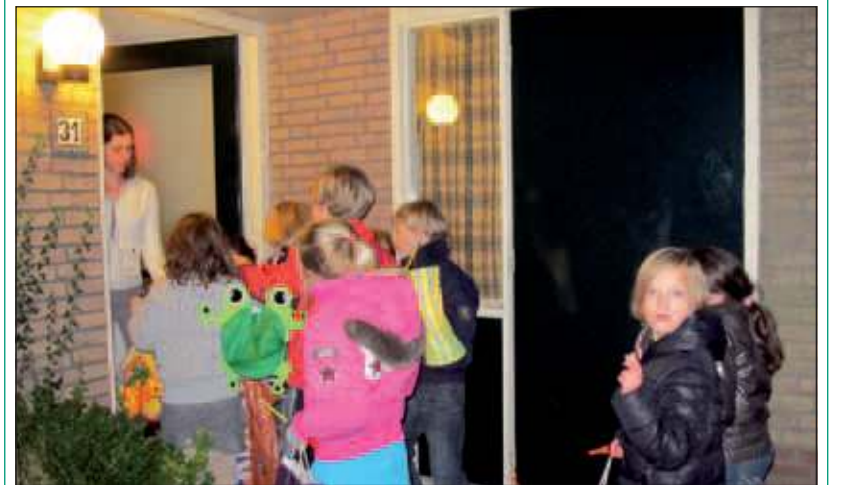
In De Leijen in Bilthoven trokken groepjes kinderen met lampionnen in vrolijke kleuren langs de huizen. Als de voordeur open ging, werd het liedje 'Sint Maarten Sint Maarten, De koeien hebben staarten' gezongen. De kinderen kregen dan allerlei lekkers in hun snoepzakken. Maar wee degene die niet open deed. Bij diens voordeur werd het liedje 'Hier woont een kikkerbil die ons niks geven wil' heel hard ten gehore gebracht. [LvD]