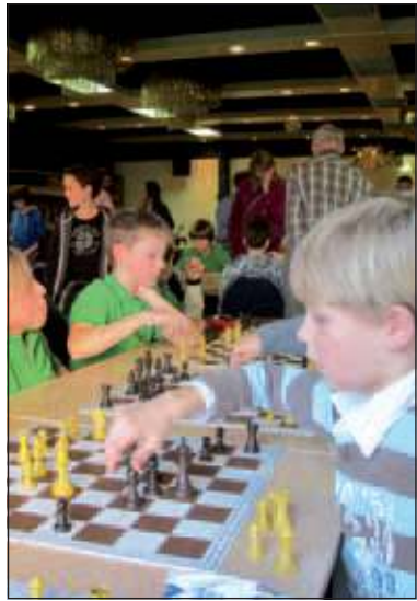
De leerlingen van de Biltse scholen die meededen aan de Schaakkampioenschappen waren misstilt tijdens de wedstrijden.

den van een schaakclub ambiert hij niet. 'Ik doe andere dingen in mijn vrije tijd. Ik zit op rugby en ik speel saxofoon.' Het eerste team van de Julianaschool wist alle rondes te winnen en werd met 14 punten nummer één en werd daarmee voor de derde achtereenvolgende keer schaakkampioen van de gemeente De Bilt. Het tweede team van de Montessorischool werd