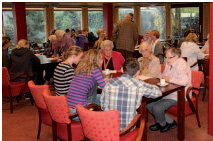
Ze dachten mild over elkaar.