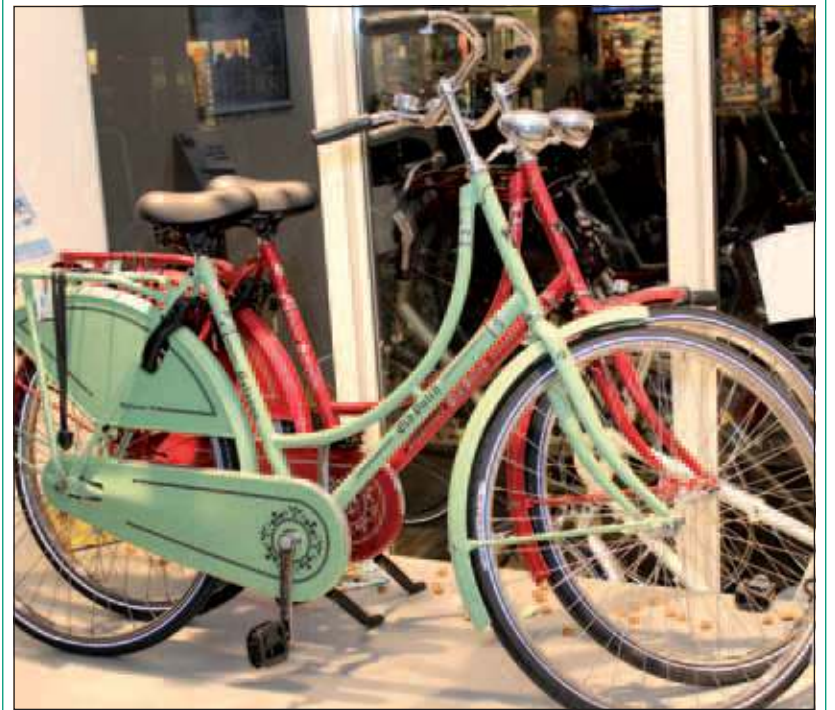
De hoofdprijs van de MMV kassabonnenactie.