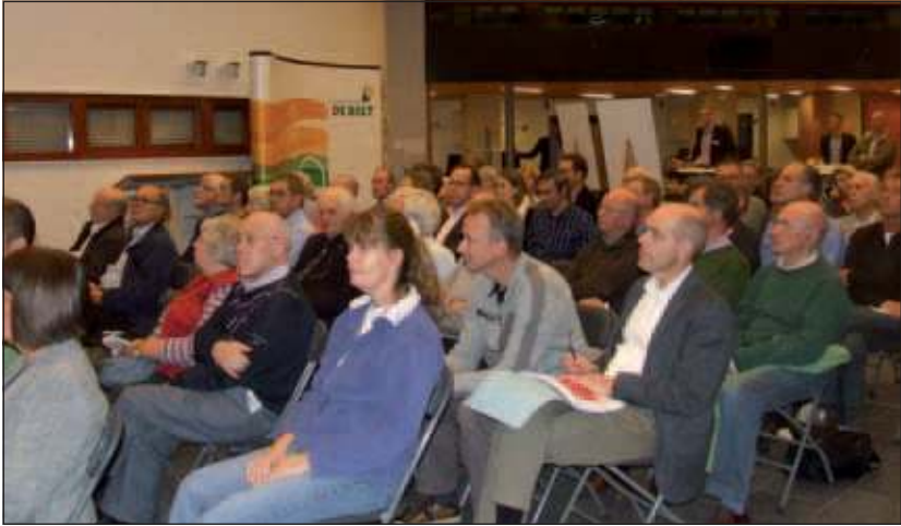
Aanwezigen luisteren naar de presentaties.

Op 9 november hield de gemeente in de Mathildezaal van het gemeentehuis een inloopavond over de concepten van de Structuurvisie en het Gemeentelijk Verkeers- en Vervoersplan (GVVP). Er werden presentaties gehouden, waarna bij verschillende informatiepanelen onderdelen van de plannen werden toegelicht en vragen beantwoord. Enkele aanwezigen waren niet gelukkig met de opzet van de avond, omdat op deze manier vragen en opmerkingen niet bij iedereen terecht konden komen.