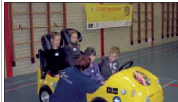
Veilig oefenen in de sportzaal.

Fietsbeheersing en trapvaardigheid op het schoolplein. stilstand kwam. En in de rijderstoel konden ze zelf ontdekken hoelang een remweg is. Intussen waren de groepen 7 en 8 op een uitgezet parcours op het verdiepte schoolplein bezig met fietsbeheersing en gevaarherkenning. Balancerend op hun fiets oefenden ze het moeilijke parcours vol hindernissen. Als ik een meisje vraag waarmee ze bezig is, zegt ze kordaat: 'Met trapvaardigheden en straks worden onze fietsen door specialisten ook nog onderworpen aan een technisch onderzoek.'