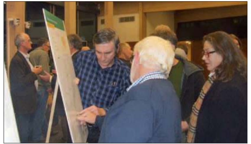
Bij de informatieborden gaan bezoekers in op onderdelen van de plannen.

Om de sociale cohesie vorm te geven is de woningmarkt van groot belang. Op een aantal kleine bedrijventerreinen wordt gewerkt aan revitalisering,