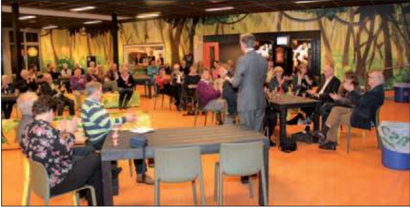
Respect centraal in het Groenhorstcollege.

In de aula van het Groenhorst College in Maartensdijk werd dinsdag 8 november een door plm. 80 personen bezochte avond gehouden waarbij het respect voor elkaar centraal stond. De avond stond in het teken van de 'Week van Respect', welke van 7 tot en met 12 november gehouden werd. Burgemeester Arjen Gerritsen leidde de avond en omschreef respect als 'Waardering voor een ander'.