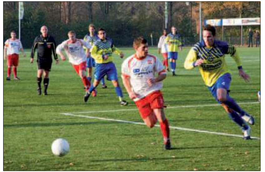
FC De Bilt en OSM strijden om de bal.