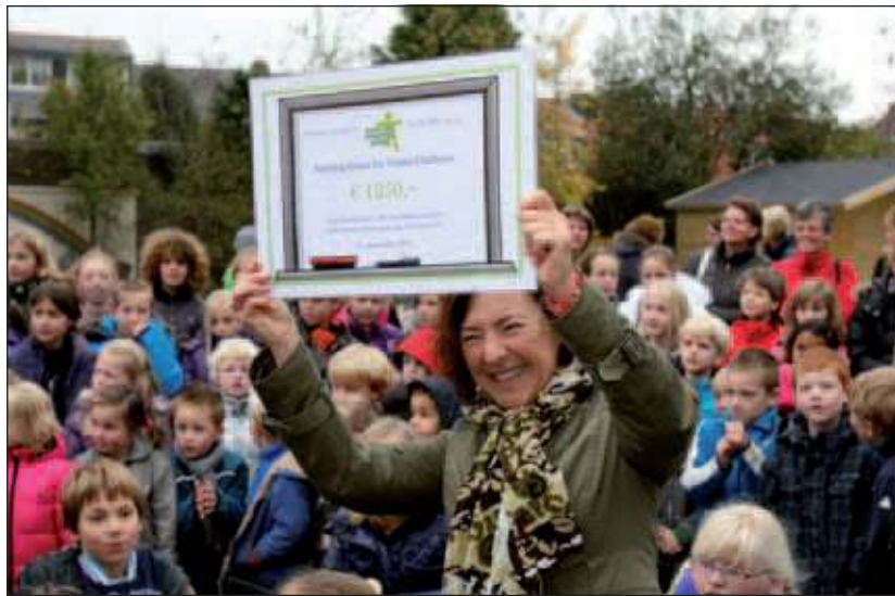
De opbrengst voor de Stichting 'Grace for Victim Children' was 1250 euro.

Dit jaar is gekozen voor een andere actie en wel het verkopen van pakjes stroopwafels. Het bleek een goede keuze. Door het enthousiasme van de kinderen zijn er heel veel pakjes stroopwafels verkocht. De opbrengst is 3 keer meer dan voorgaande jaren. Dat betekent dat het goede doel ook 3 keer zoveel krijgt. Dit jaar is de helft van de opbrengst voor de Stichting 'Grace for Victim Children', een doel dat al eerder door de school is gesteund. Het hoofddoel van deze stichting is het ondersteunen van een kindertehuis van een gelijknamige Non Gouvernementale Organisatie in Nepal. In dit kindertehuis worden vanaf 2002 vele straat- en weeskinderen opgevangen, liefdevol verzorgd en er wordt hen onderwijs aangeboden. Nu heeft de stichting zich tot doel gesteld een bijdrage te leveren aan een andere basisbehoefte, namelijk de gezondheidszorg. Vrijdag 11 november werden alle pakjes stroopwafels ver-