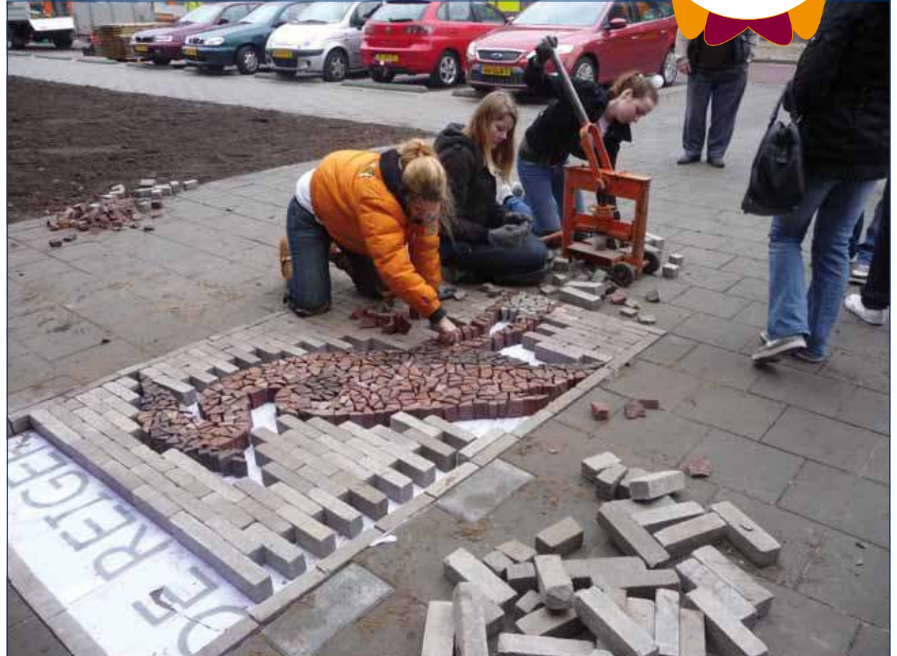
Medewerkers van SSW en De Jong BV zorgen samen met leerlingen van de derde klas Havo van de Werkplaats o.a. voor een straatmozaïek bij Zorgcomplex De Reiger in Bilthoven.

Aan organisaties die dit jaar een klus willen aanbieden adviseert Van Pomeran om de eigen medewerkers goed bij