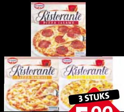
Dr. Oetker Ristorante pizza