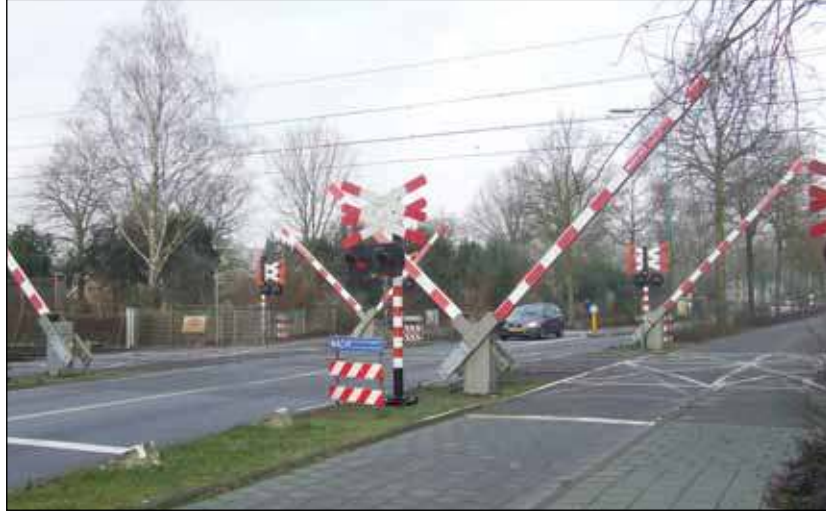
De spoorwegovergang in de Leijenseweg.