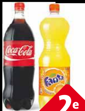
Coca-Cola, Fanta en Sprite