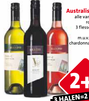
Hardys Australische wijn