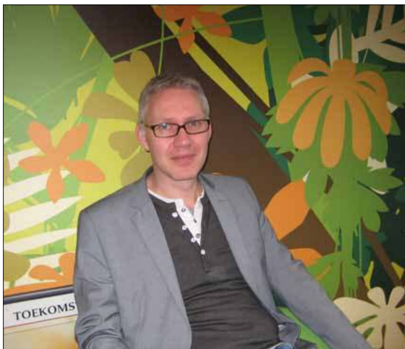
'Wij doen graag mee met de actie RemixIT en iedereen kan gedurende onze schooltijden klein ICT afval komen inleveren'.

Elk jaar worden er gemiddeld 6 miljoen verkocht; dus die berg groeit gigantisch. In alleen al die mobieltjes zitten grondstoffen die hergebruikt kunnen worden. Tel daarbij dan nog eens op alle ongebruikte opladers, afstandbedieningsapparaten, rekenmachines, koptelefoons en muizen en