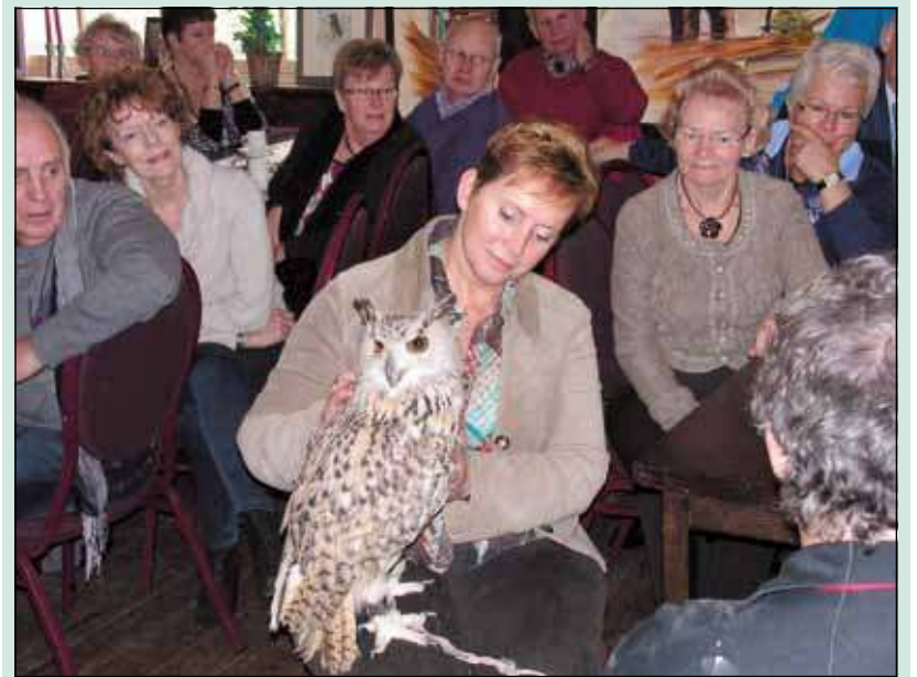
Dan heb je opeens een echte uil op schoot. De andere Westbroekers kijken gespannen toe.

Maar de dag was nog lang niet ten einde. Na aankomst in Westbroek kregen de deelnemers een goed verzorgde broodmaaltijd voorgezet. Aansluitend werd de film vertoond die door Gijs Franken met zijn medefilmers is gemaakt van de Oranjefeesten in 2011. De zaal vulde zich ondertussen met Westbroekers die ook wel eens wilden zien wat het resultaat was. Een uur lang kregen zij een uitgebreid en kleurrijk beeldverslag te zien. Maar dat was nog niet alles. Na de laatste beelden werd de zaal van het Dorpshuis opeens gevuld door het Utrechtse dweilorkest de 'Domdweilers'. Die hadden meteen de stemming er goed in wat resulteerde in een spontane polonaise. Het vormde de afsluiting van een lange dag. De traditionele lampionnenoptocht voor de kinderen ging op deze zaterdagavond niet door. Maar voor hen is er vandaag, woensdag 1 februari om 15.00 uur een kindermiddag in het Dorpshuis. [MN]