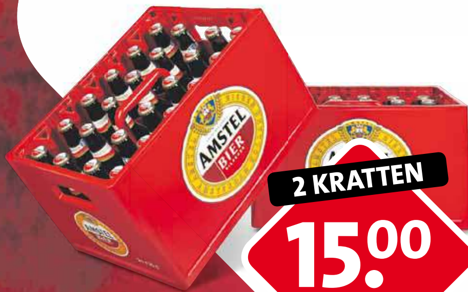
Amstel bier 2 kratten à 24 flesjes à 300 ml