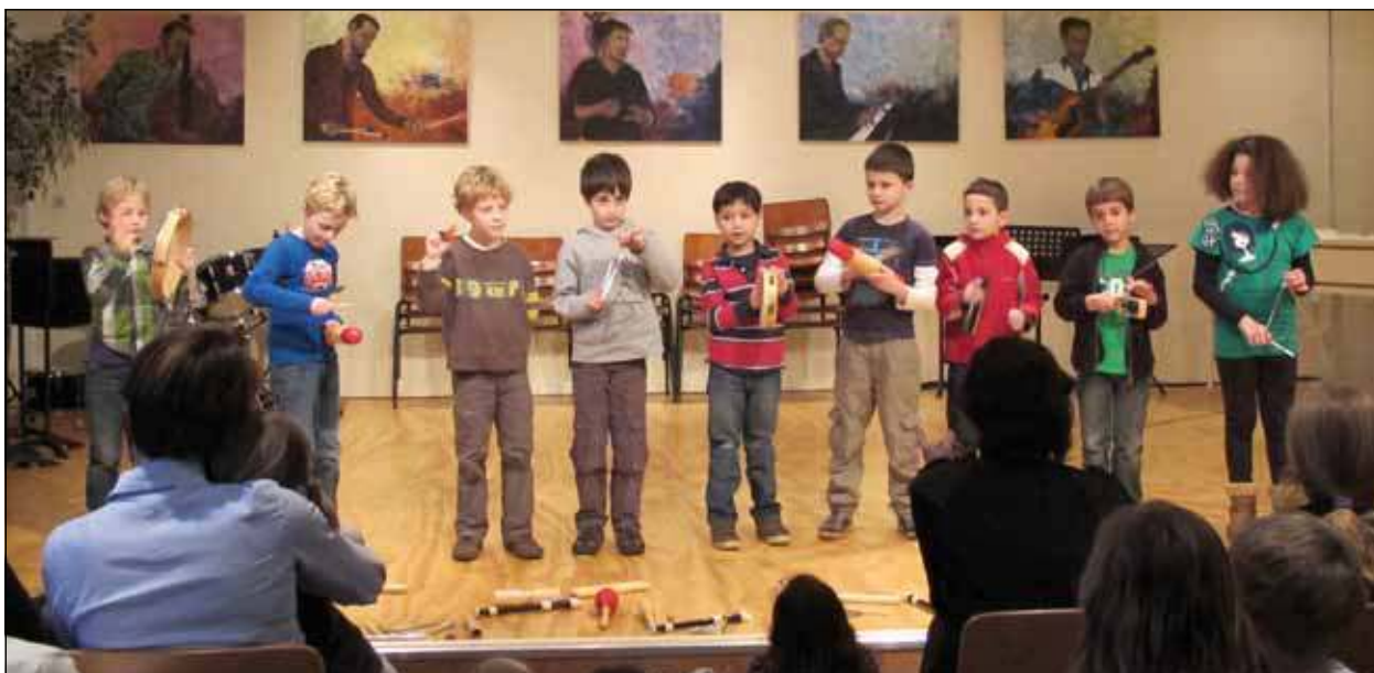
De leerlingen van MuziekKids zongen en speelden met veel inzet en enthousiasme de ingestudeerde liedjes.

Ouders, grootouders, broertjes en zusjes luisterden en keken met gepaste trots naar hun kinderen, kleinkinderen, broers of zusjes tijdens de