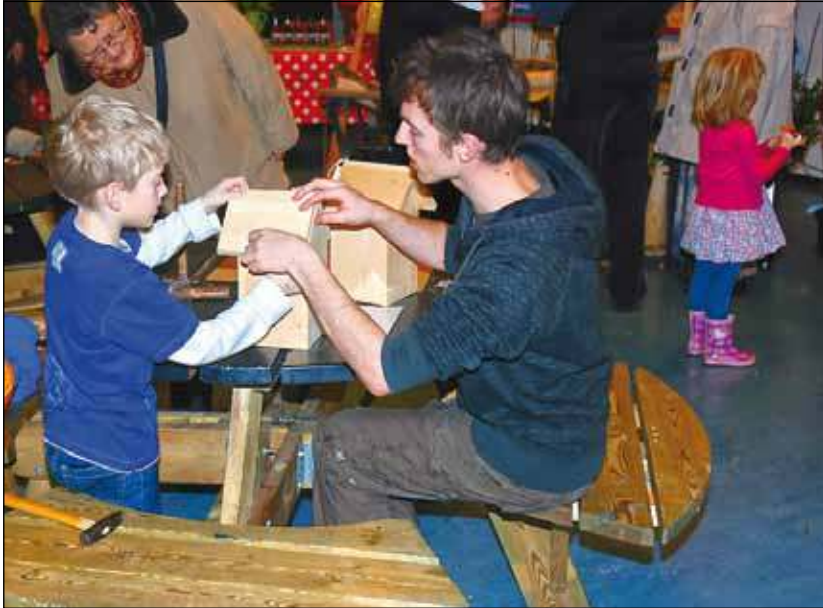
Er is dit jaar opnieuw van alles te beleven op de Muzikale Winterfair van de VVBB.

Maandenlang kijken de leden van muziekvereniging VVBB al uit naar 11 februari 2012. Dan is het tijd voor het jaarlijkse hoogtepunt: de Muzikale Winterfair. Vorig jaar werd de eerste editie gehouden en dat bleek een groot succes. Nu wil de Brandweerharmonie er een jaarlijks feestje van maken in Bilthoven. De VVBB viert tevens haar 85-jarig bestaan en daarom kunnen bezoekers wel wat extra's verwachten dit jaar. Tussen 13.00 en 18.00 uur is iedereen welkom om gratis een kijkje te komen nemen in Het Nieuwe Lyceum aan de Jan Steenlaan 38 in Bilthoven.