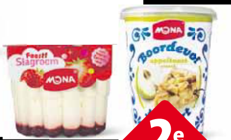
Mona pudding en yoghurt