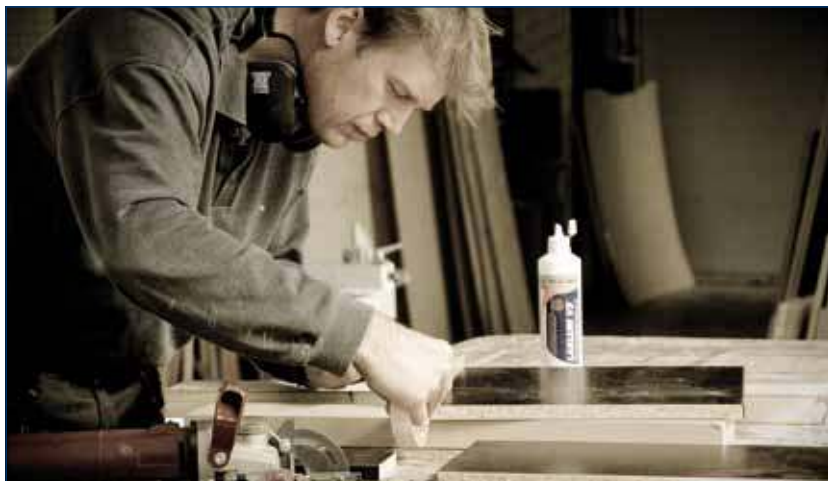
Chirurg versus meubelmaker: Je onderscheidt je door de kwaliteit die je daarin levert. Niet door de status die het nu eenmaal heeft.