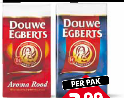
Douwe Egberts aroma snelf groe pak 5