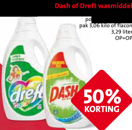
Dash of Drecht wasmiddel

po pak 3,06 kilo of flacon 3,29 liter OP=OP