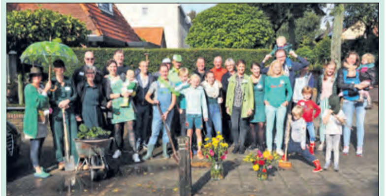
Bewoners van de Looydijk maken de buurt gezelliger én bij-vriendelijk.

Op de Looydijk, tussen de kruising Akker/Soestdijkseweg, hebben de bewoners 15 adressen voorzien van planten en bloemen. De kinderen hebben met allerlei materialen een bijenhotel gemaakt. Hiermee is de Looydijk een stukje groener en bij-vriendelijker geworden. De middag begon met koffie en zelfgemaakte taart en een uitleg over het nut van insecten. Tip hierbij was om de tuin niet al te (winter) schoon te maken, zodat insecten en andere beestjes hier in kunnen wonen. Na het groener maken van de buurt werd het buurtfeest afgesloten met een borrel en een zelfgemaakt buffet. Aan de deelnemers van het buurtfeest was gevraagd zelf borden, bekers en bestek mee te nemen zodat er geen afval zou zijn.