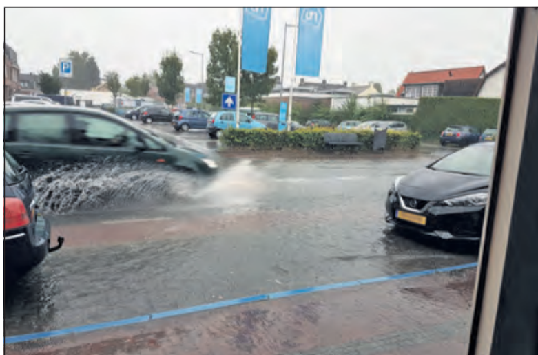
De Bilt ligt laag en ondervindt bij regen veel overlast.