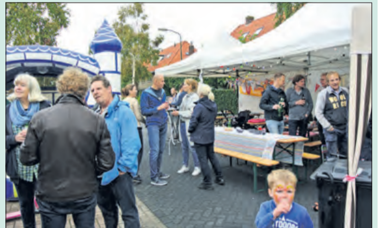
Zaterdag organiseerden bewoners van de Waterweg in De Bilt ook dit jaar weer een straatfeest. Het was een gezellig samenzijn, waarbij er voor de kinderen ook genoeg te doen was.