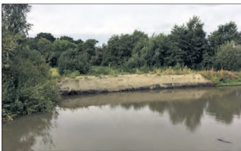
Langs de zuidoever (zijde Fort Voordorp) is een oeverzwaluwwand aangelegd.