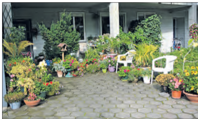
De bewoonster heeft de toegang tot haar woning met veel zorg verfraaid met een ware bloemenzee. Voor menig voorbijganger een lust voor het oog.