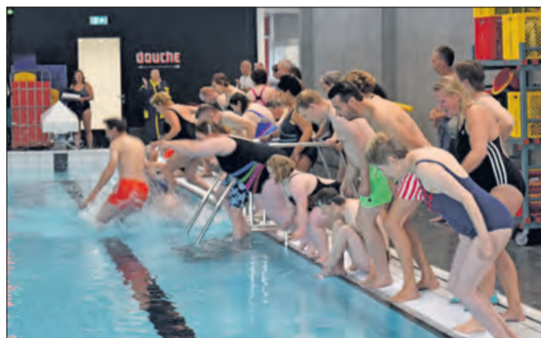
Een groep zwemmers opent officieel het zwembad.

Zondag 29 september konden bezoekers meedoen aan allerlei ac-