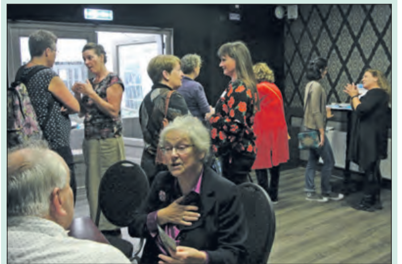
Tijdens de markt worden leuke contacten gelegd.