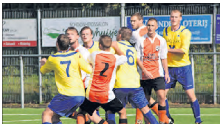
Tweemaal vier spelers - van beide verenigingen - kwijten zich van hun taak.