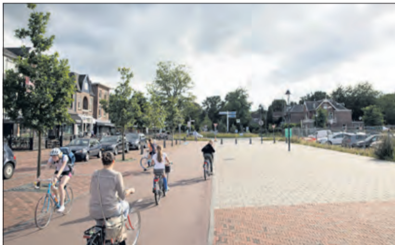
Het Emmaplein is in de huidige vorm het resultaat van de aanleg van de spooronderdoorgangen.

Groet uit De Bilt en Bilthoven is een prachtige uitgave met een harde, linnen koft en 160 pagina's vol beelden van toen en nu. Daarnaast bevat het een fietstocht langs plekken, die in het boek voorkomen. Deze fietstocht bepaalt tevens de volgorde van de kaarten. De toegang tot de presentatie is vrij. Het wordt op prijs gesteld indien u zich vooraf aanmeldt via info@bilthovenseboekhandel.nl of tel. 030 2281014.