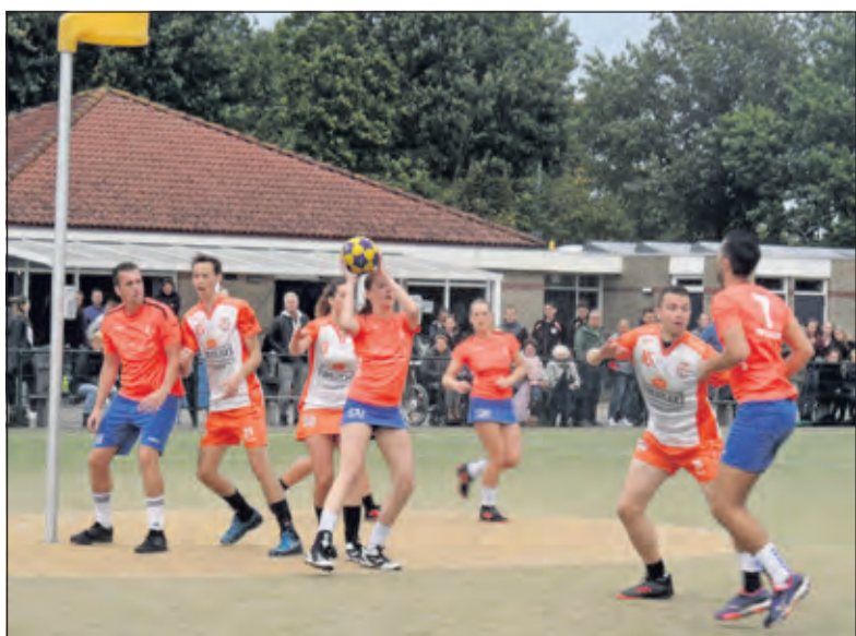
DOS haalt met hakken over de sloot de overwinning binnen.

Aanstaande zaterdag ontvangt DOS haar naamgenoot uit Kampen. De wedstrijd in Westbroek begint om 15.30 uur.