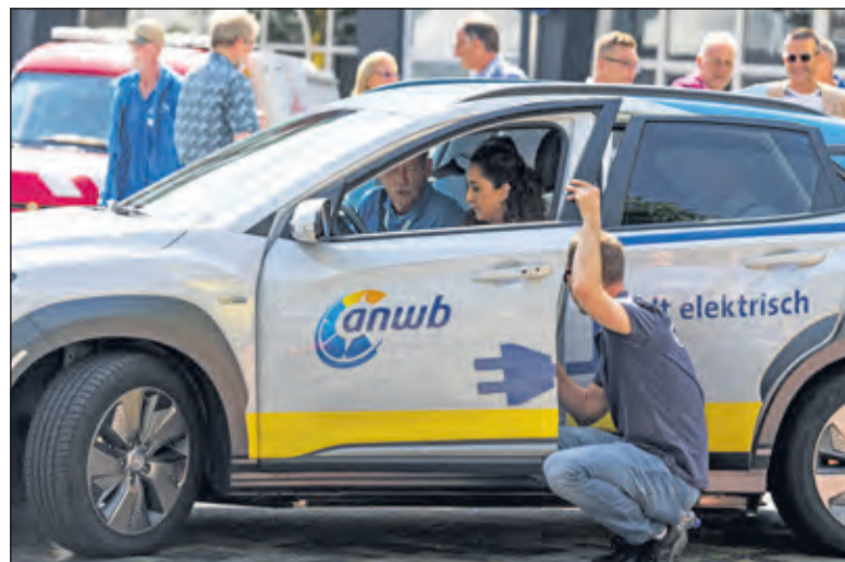
Woensdag 9 oktober kan je een gratis proefrit maken in een elektrische auto.

Voor meer informatie: anwb.nl/elektrisch