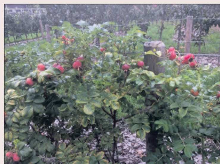
Het plukdoolhof is er klaar voor.

Educatieve activiteiten, natuurbeleving en duurzame voedselteelt zorgen in het Plukdoolhof voor sociale inclusie; in dit geval onderdeel van buurtboerderij De Schaapskooi in Bilthoven. Dit is een dagbesteding en werkplek, waar mensen zich kunnen ontwikkelen met begeleiding van Reinaerde. Het doel is mensen van alle leeftijden te verbinden. Het is daarom ook rolstoel- en rollator toegankelijk. In het plukdoolhof staat 'spelenderwijs leren' centraal. Mensen zien en ruiken hier hoe fruit groeit en bloeit, leren dat een boom ook sla kan zijn en dat je thee kunt maken van bloesem en bloemknoppen. Niet in de schoolbanken dus, maar midden in de samenleving en in de natuur. Het kan uitgroeien tot een echte 'magneet' met positieve uitstraling op thema's als samen spelen, team bouwen, ontmoeten, groenbeleving en duurzame voedselteelt. Er zijn veel organisaties in (en buiten) gemeente De Bilt die het plukdoolhof een warm hart toe dragen. Zij doen dit door samen te werken, financieel te steunen en/of met raad en daad bij staan. (Dos Schaafsma)