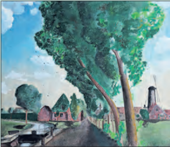
Voorheen de Koppeldijk in Zeist met sluisje over de Biltse Griff.

Op een lezing van de Historische Kring De Bilt vertelt hij over zijn herinneringen en belevenissen als ook de geschiedenis van de plek waar hij opgroeide. Hij laat zien hoe zijn voorouders daar terechtgekomen zijn, exemplarisch voor de verhoudingen in het Nederland van de 19e eeuw. Henks verhaal ligt in het verlengde van de twee jaar geleden uitgebrachte documentaire 'Bestemming: Haven van Zeist' over de Biltse Griff. Ook