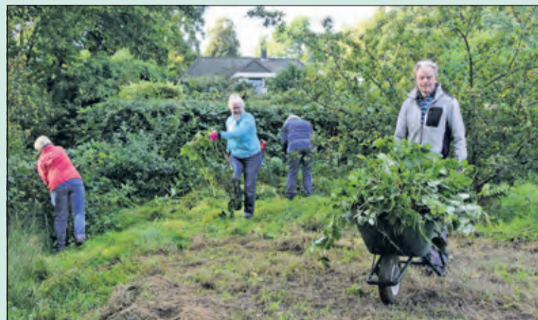
De vrijwilligers gaven zaterdag de boomgaard in het Van Boetzelaerpark in De Bilt een onderhoudsbeurt. Het was mooi herfstweer en de werkers hadden er plezier in.