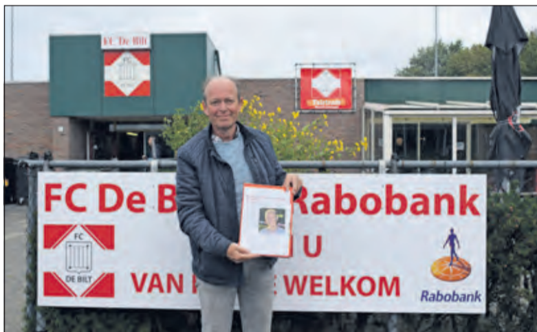
FC De Bilt streeft naar volledige verduurzaming voor 2030.