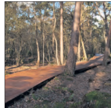
Het pad door de natuurbegraafplaats.