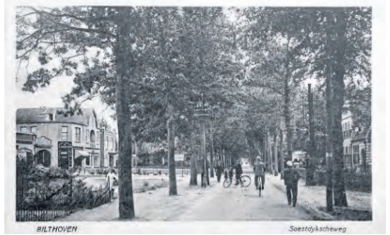
Op het Emmaplein werd na de aanleg van de spoorlijn en de realisatie van een halteplaats in 1864 een stations-koffiehuis geopend. De naam Emmaplein was toen nog niet in gebruik. De weg die de spoorwegovergang kruiste werd Soestdijksche straatweg genoemd.