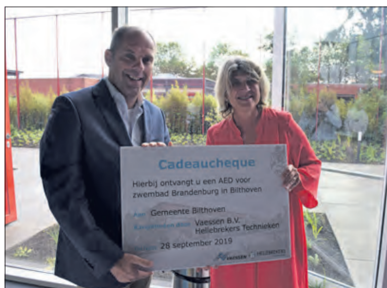
Van de bouwverrijkt Brandenburg een AED.