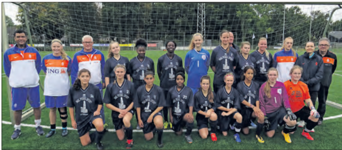
De voltallige selectie van de Oranje Powergirls met technische staf voor aanvang van de training voorafgaand aan het oefenduel.

Uiteindelijk heeft de veiling een bedrag opgebracht van 500 euro. De opbrengst van een verloting bedroeg 300 euro zodat de Stichting Pro Talents 800 euro kan bijschrijven. De overgebleven veilingstukken worden via Marktplaats verkocht.