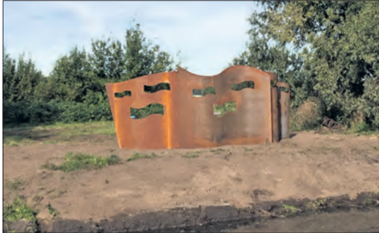
Langs de zuidwestoever (zijde fietspad) is een robuust vogelkijkscherm aangelegd.

Mede om de ecologische waarde van de plas te verhogen, is het zgn. verondiepingproject gestart. Daarbij wordt onder meer de verontreinigde bodem afgedekt. De start van de natuurontwikkeling bestond uit het maken van eilanden, flauwe oevers met riet en ondiep water (circa 1,5 meter diep) aan de noordzijde van de plas. Door het ondiepe water kunnen waterplanten op de bodem groeien. Vermeule: ‘Daarna is het zuidelijk deel van de plas ingericht, waarbij de steile oevers zijn