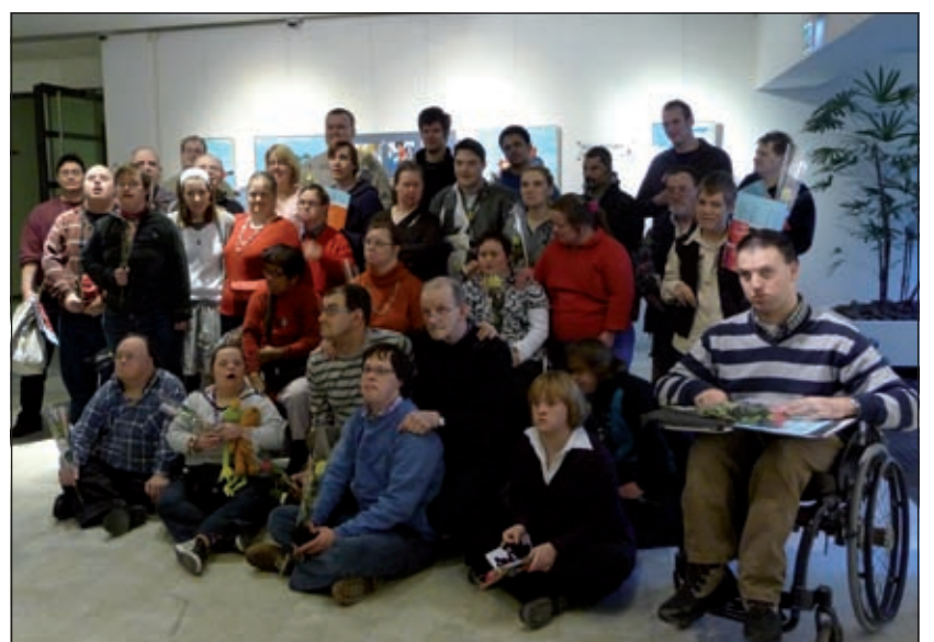
De exposerende kunstenaars van Kunstatelier de Heygraeff en Ateliers De Wijde Doelen.

Veel kunstenaars, begeleiders en geïnteresseerden hebben afgelopen donderdag de officiële opening van Outsider Art II bijgewoond. Liesbeth Bonis, adjunct directeur Werk en Dagbesteding bij Reinaerde, sprak de aanwezigen toe. 'Wij zijn ontzettend blij dat het RIVM ons opnieuw heeft benaderd met de vraag of de kunstenaars hun werk in de mooie centrale hal willen exposeren. De expositie heet Outsider Art II. De kunstenaars zijn binnen de kunstwereld Outsiders maar juist vanwege de manier waarop zij vorm geven aan hun scheppingsdrang worden zij van Outsiders Insiders. Zij komen namelijk overal, zij exposeren op plaatsen, zoals in de Botanische Tuinen, het Centraal Museum en nu weer het RIVM waar menig kunstenaar alleen maar van kan dromen. De kunstenaars zijn allemaal ongeschoolde, gemotiveerde mensen die een eigen, herkenbare stijl hebben ontwikkeld. Samen met hun begeleiders in de