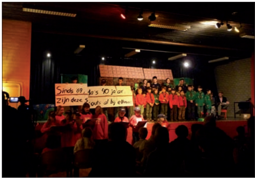
Na de boerenkoolmaaltijd ging men naar De Vierstee. Er waren bijna honderd mensen. Ze hebben kunnen zien hoe Agger Martini de afgelopen veertig jaar heeft gewerkt.

Scoutingclub Agger Martini kan nog best wat jeugdleden gebruiken, variërend in de leeftijd tussen de 5 en 18 jaar. Via de site van Agger Martini ( www.aggermartini.nl ) kan men contact met deze scoutingclub leggen.