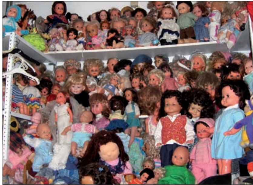
Poppen bij de vleet. Niet zo maar een paar, maar wanden vol. Van piepklein tot levensgroot en in alle maten en soorten.