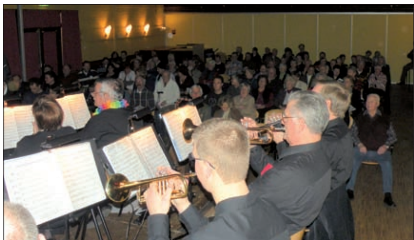
Het nieuwjaarsconcert van Muziekvereniging Kunst en Genoegen op zondag 11 januari jl. in De Vierstee kende een goede belangstelling.

Verschillende muzikanten speelden een korte solo en ook de jeugd liet zich goed horen tijdens de mars 'Ambiance' en het swingende 'Bleuville'. Tijdens de 'Second Wals' (waar Andre Rieux bekend mee is geworden), werd vrolijk meegedeind. Het publiek werd een Gelukkig Nieuwjaar gewenst, ondersteund door een spandoek wat tegelijkertijd ontvouwen werd. Tot slot werd gezamenlijk de traditionele Nieuwjaarmusiek gespeeld (Radetzky mars) waarbij door het publiek enthousiast werd meegekapt werd [HvdB].