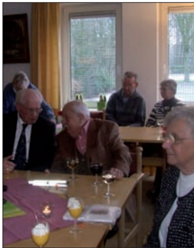
Een gezellige bijeenkomst in met een hapje en een drankje in De Mantel.