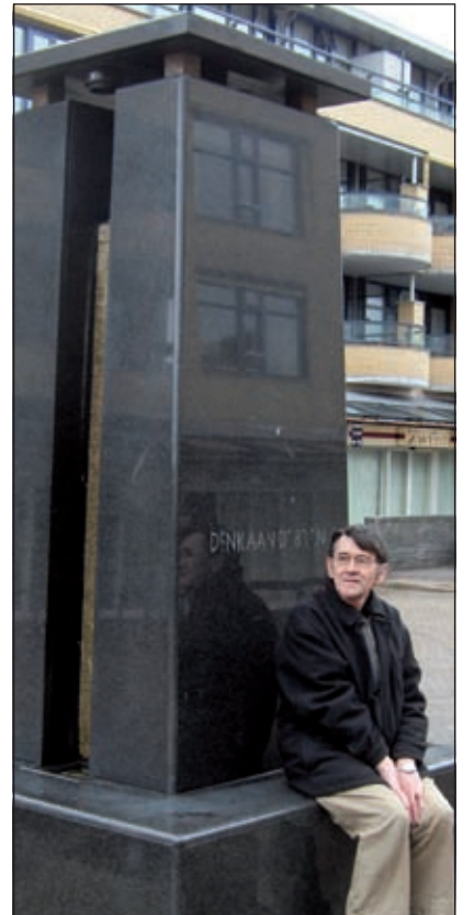
Uiteindelijk geen sta(a)ndbeeld 'Koos' in Maartensdijk, maar een zittend beeld van Koos bij de pomp.

de architectuur van het plein en de omringende gebouwen.