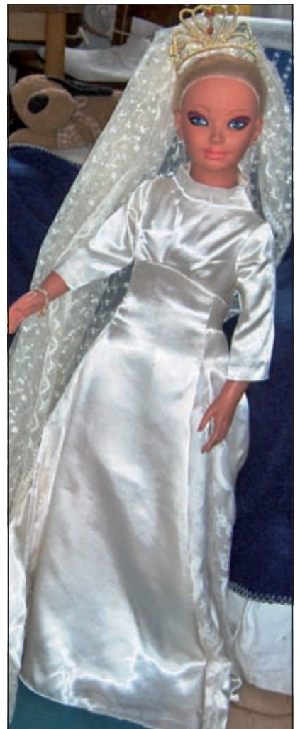
'En natuurlijk ook Maxima.'

wij een uitnodiging in de Janskerk in Utrecht. Hij had een mooi soort pij aan en dat vond ik bijzonder. Die was in Nijmegen voor hem gemaakt, vertelde hij, en ik vroeg toen of ze daar nog lapjes van hadden. Daarna bracht hij zo'n pij mee met koord en alles wat er bij hoort. Dat heb ik helemaal verkleind nagemaakt. Die moet ook op de foto hoor. En natuurlijk ook Maxima.'