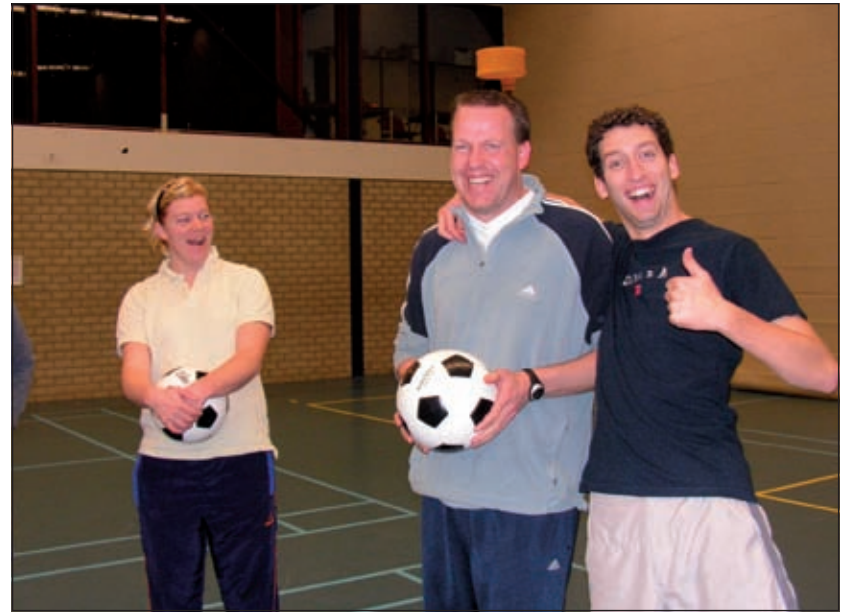
Bij de training wordt ook gelachen.

Het is goed als er om de zoveel tijd een nieuw gezicht voor een team staat, weet Van den Brink. Dat houdt zowel de trainer als de groep scherp. Hij vindt niet dat het nodig moet zijn om zijn spelers te motiveren. 'Dat moet uit hen zelf komen', is zijn mening. 'Ze moeten hun eigen verantwoordelijkheid nemen. De huidige spelers zouden nog wat meer prestatiegericht moeten zijn', vindt hij. Dat dit nog niet zo optimaal is houdt onder anderen verband met de cultuur van Tweemaal Zes. Die heeft altijd een grote sociale functie gehad in Maartensdijk. Van den Brink ziet en erkent de grote waarde daarvan, maar wanneer je mee wilt doen om de bovenste plaatsen van de hoogste