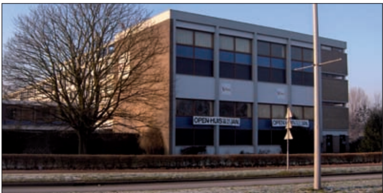
Het Gerrit Rietveld College organiseert twee open dagen en een open lesmiddag. De Open dagen zijn vrijdag 9 januari van 19.00 tot 21.00 uur en zaterdag 31 januari van 11.00 tot 17.00 uur. De open lesmiddag is dinsdag 10 maart van 10.00 tot 14.00 uur [HvdB].

Het Gerrit Rietveld College is al vier jaar de enige school in Utrecht en omgeving die een technasium-afdeling heeft. Het technasium is er voor havo- en vwo-leerlingen. Het technasium is een moderne opleiding voor bètaonderwijs. Naast de gewone bètavakken als wiskunde, natuurkunde, scheikunde en biologie, krijg je het vak Onderzoek & Ontwerpen. Bij dat vak werken de leerlingen in projecten aan praktische, technische opdrachten: denken is gekoppeld aan doen, theorie aan praktijk! Daarom zijn de opdrachten echte opdrachten, gegeven vanuit en door het bedrijfsleven en de beroepspraktijk. Elke opdracht wordt afgesloten met een presentatie aan medeleerlingen, ouders en opdrachtgevers. Het afgelopen schooljaar is het Gerrit Rietveld College gestart met een TheaterKunstKlas opleiding. Leerlingen in mavo/havo 1, havo/vwo 1 en gymnasium 1 kunnen er voor kiezen elke week twee extra uren kunstonderwijs te volgen. De lessen zijn altijd een combinatie van verschillende disciplines, bijvoorbeeld muziek en drama, of ontwerpen en dans. Daarnaast werk je samen aan projecten over bijvoorbeeld een film of een muziekuitvoering die je met elkaar bezocht hebt. Natuurlijk doe je ook mee in een grote voorstelling, als acteur, belichter, decorbouwer of filmer.