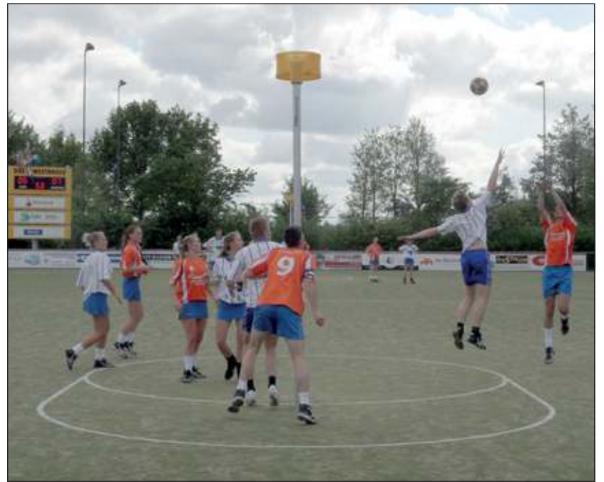
DOS zette zich volledig in tegen koploper Vriendenschaar.

Zaterdag speelt DOS om 15.30 uur in Nieuwegein tegen Koveni. DOS 2 won ruim met 12-7 van Hebbes en blijft hierdoor op de tweede plaats staan.