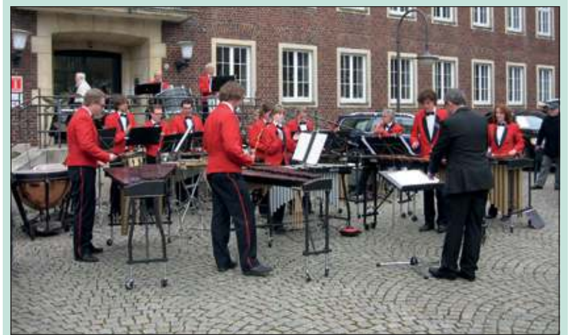
Het optreden van de Melodie Percussie Groep was een groot succes.

Na het concert trok een stel leden van de groep zonnig gekleed door de stad met allerlei soorten trommels en speelde Braziliaanse muziek. Dit werd erg op prijs gesteld, waarschijnlijk ook omdat de jongens er zelf zo overduidelijk plezier in hadden. Hierna volgde weer een concert van de gehele groep, maar helaas ging het regenen en daar kunnen de instrumenten niet tegen. Het concert moest afgebroken worden. (Tine Rigter)