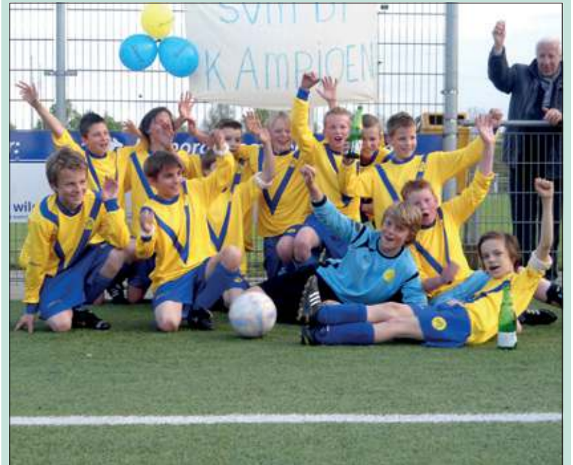
De D1 in uitgelaten stemming na de wedstrijd.