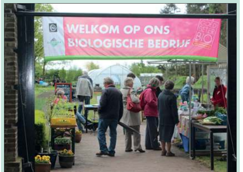
Het seizoen 2012 startte zaterdag jl. met een druk bezochte Open Dag.

Vanaf deze openingsdatum zijn Agnes kruidentuin en Tuinderij Eyckenstein weer de hele zomer open op woensdagmiddag van 13.00 tot 16.00 uur en op zaterdag van 10.00 tot 16.00 uur voor biologische groenten, kruiden, bloemen en kruidenthee. Het adres is Dorpsweg 264-achter in Maartensdijk. [HvdB]