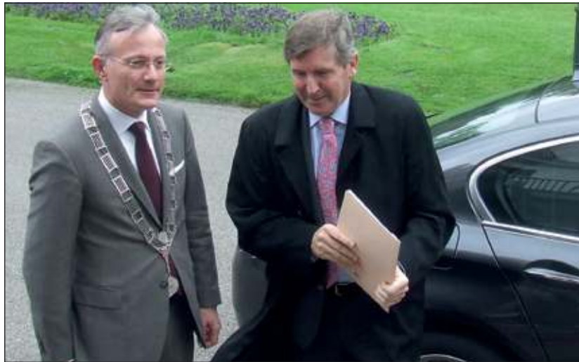
De aankomst van de commissaris van de Koningin bij gemeentehuis Jagtlust.