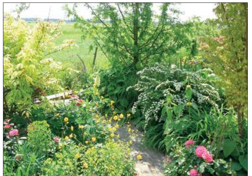
Zaterdag 26 mei zijn er weer prachtige tuinen te bewonderen in Westbroek.

In de zaal is lingerie en ondergoed te koop. Op het buitenterrein: ambachtelijke cake, kwarkbolletjes, heerlijke worst, fruit, kaarten, enz. Dit jaar is er weer volop zomergoed, van zeer goede kwaliteit Nieuw: foto's maken, alleen of met het hele gezin, Auto's wassen en uitzuigen. Ook voor de jeugd zijn er leuke spelletjes te doen zoals koe melken.