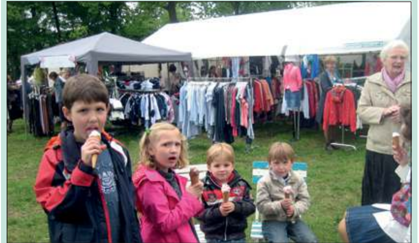
Er viel veel te snoepen.

Afgelopen zaterdag stroomden van 10.00 tot 16.00 uur onder een stralende zon een massa belangstellenden naar de akker aan de Bantamlaan in Maartensdijk waar de tweede Voorjaarsfair nog drukker werd bezocht dan vorig jaar. Op een nabijgelegen weiland stond een eindeloze rij geparkeerde auto's want volwassenen en opvallend veel kinderen kwamen niet alleen uit Maartensdijk maar ook van veel verder. De 57 kramen varieerden van vakmensen met gespecialiseerde ambacht tot een reeks van artikelen op allerlei gebied. De kinderen vermaakten zich bij speelgoed, kleding en snoep terwijl het dierenplein, de twee grote klim-, spring- en duikeloestellen en ritjes met oldtimers ook veel aandacht kregen. De organisatoren Arie en Jan Vonk Noordergraaf waren zeer tevreden over de toeloop die zeker nog meer zal opbrengen dan de vierduizend euro van vorig jaar en bedoeld is voor mishandelde en verwaarloosde kinderen in Bacau Roemenië. [KP]