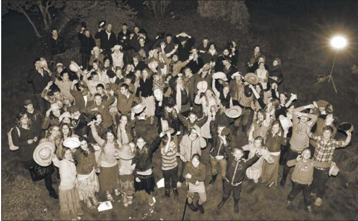
De groep in de verlichte pastoriëtuin.

Aan het einde van de tocht moest een lied worden gemaakt, dat - wanneer iedereen weer was teruggekeerd - vanaf een nostalgische plek voorgedragen moest worden. Het lied werd gezongen vanaf het verlichte balkon van de oude - niet meer in gebruik zijnde - pastorie achter de kerk.