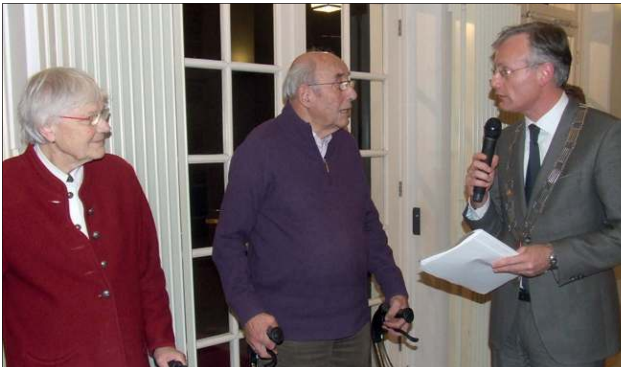
Op 22 december nam burgemeester 1500 handtekeningen in ontvangst.