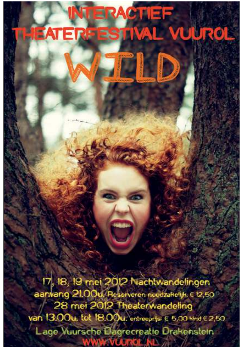
'Wild!' is het thema van het vierde theaterfestival Vuurol.

De tuinen worden op zaterdag 26 mei a.s. van 10 uur 's morgens tot 5 uur 's middags opengesteld op: