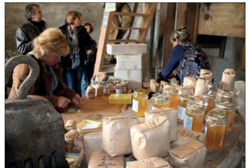
In de molen is een winkeltje, dat iedere zaterdag van april tot en met oktober open is.