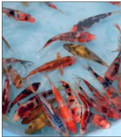
De Mini Koi dagen duren nog tot 26 mei.

kenner zal het assortiment zeker waarderen. Een Koi karper kan goed gedijen in de meeste vijvers. Voor de verzorging kunt u terugvallen op de door Groenrijk opgestelde ‘handleiding’ en ook het voer is in de winkel verkrijgbaar. Naast Koi karpers is er een breed assortiment vijvervissen verkrijgbaar zoals bijvoorbeeld oranje en gele goudvissen, goudwinde en Shubunkin in diverse kleuren. Voor de kinderen is er een leuke prijsvraag en kleurplaten. De winnaar gaat naar huis met een visenkomp met 2 sluiertaarten.