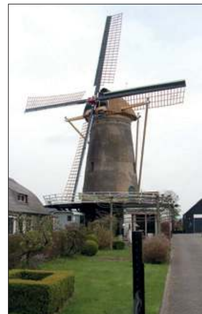
Molen Geesina.