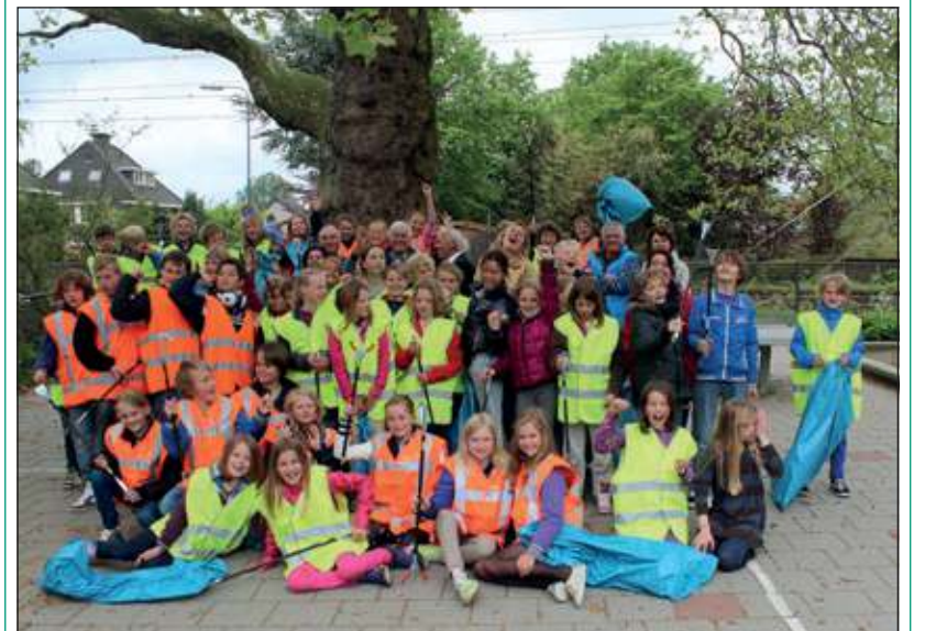
Leerlingen van de Nijepoort uit Groenekan zijn klaar voor de zwerfvuilopruiactie.