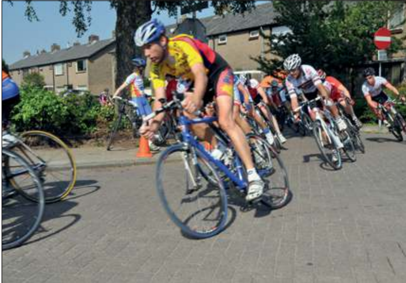
Acht bochten per ronde kenmerken de lastigheid van de wielerronde in Maartensdijk

Als gevolg van bovengenoemde wielerronde zijn op zaterdag 19 mei a.s. tijdelijke verkeersmaatregelen getroffen ten aanzien van de straten die tot het parcours van de wielerronde behoren, waardoor het verboden is om tussen 15.00 en 22.00 uur op genoemde wegen voertuigen te parkeren. De organisatie verzoekt u om tijdig de straat autovrij te maken.