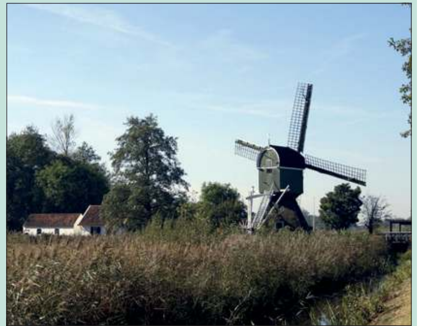
De molen in Tienhoven, waar verschillende wandel- en fietsroutes langs lopen.