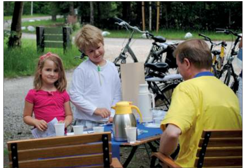
Evenals vorig jaar is ook dit jaar weer een fietspuzzeltocht voor de kleinere fietsertjes.

legen aan de Holle Bilt te De Bilt. Hier is ook het einde van alledrie de routes. Wanneer u tijdig bent gestart, kunt u na afloop van de fietstocht onder het genot van een drankje genieten van de muziek van de Koninklijke Biltse Harmonie die tussen 14.00 en 16.00 uur een openluchtconcert geeft. Naast een drankje zullen er onder andere (voor een gering bedrag) ook hotdogs en popcorn voor de kinderen zijn.