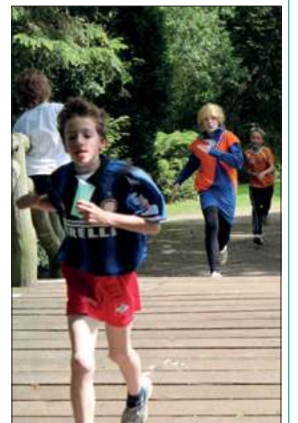
De plaatselijke AH-vestiging in De Bilt sponsorde de drankjes en de versnaperingen.

De meeste deelnemers kwamen lichtvoetig over de brug. Totaal was de opbrengst voor deze activiteit ruim 1500 euro.