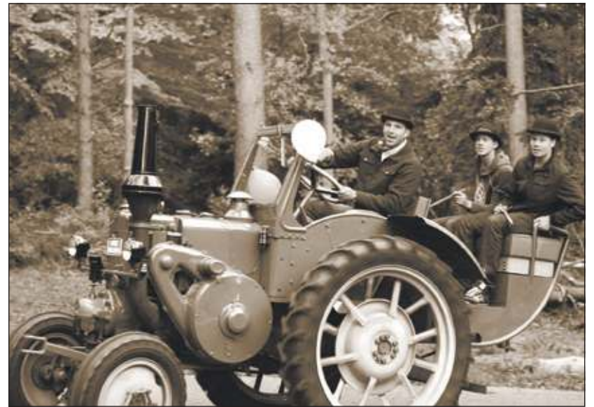
Ringsteken met een oude trekker.

Om het fort ligt een brede gracht, waardoor je het fort ook kunt zien als een spannend onbewoond eiland. Kaap is van 27 mei t/m 8 juli elke zaterdag en zondag en Pinkstermaandag (28 mei) van 11.00-18.00 uur open voor publiek. Kijk voor meer informatie op www.kaapweb.nl