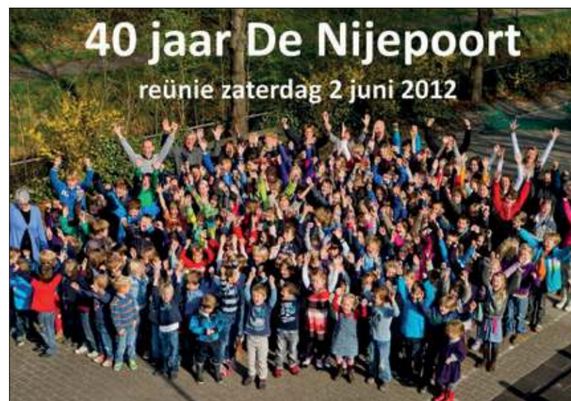
Leerlingen en leerkrachten kijken enthousiast uit naar het jubileum.

Sinds 1972 hebben honderden leerlingen hun basisschooljaren doorgebracht op de kleine dorpschool. De school nodigt alle oud-leerlingen en hun ouders, en daarnaast alle oud-medewerkers uit om het 40-jarig bestaan van de school te vieren tijdens de reünie op zaterdagmiddag 2 juni 2012. Deelnemers kunnen zich aanmelden door hun naam, contactgegevens, geboortedatum en schooljaren te mailen naar nijepoort1972@gmail.com . Iedereen die nog contact heeft met oud-leerlingen (of hun ouders) die niet meer in Groenekan wonen wordt ge-