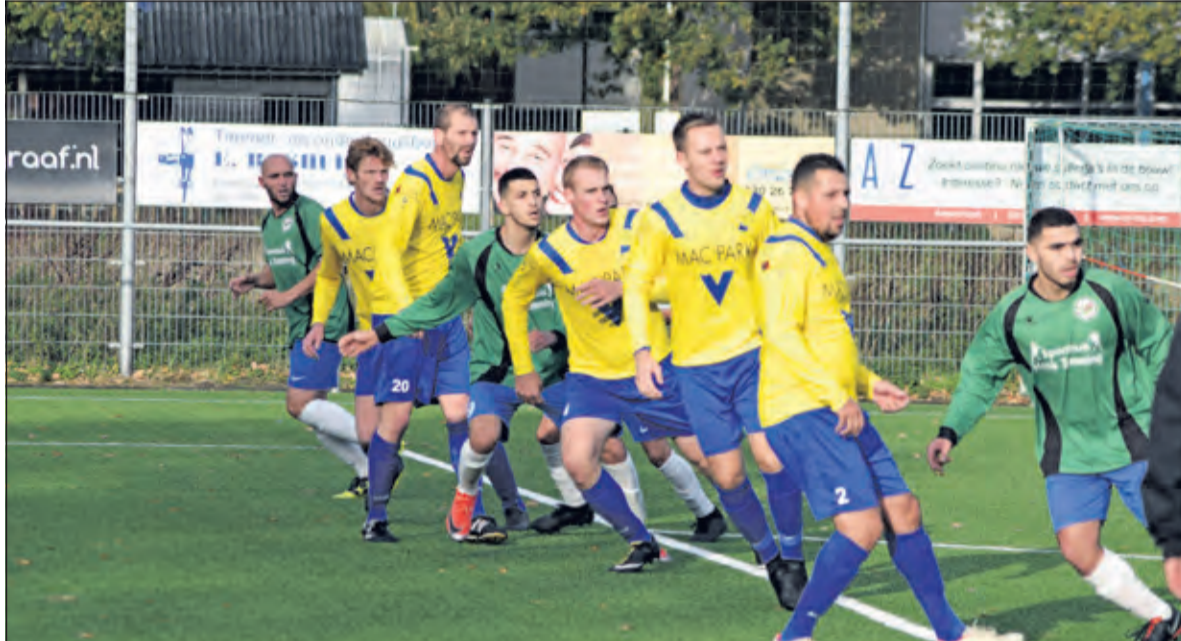
Kiest men voor meer verdedigers op lijn, wordt de afstand tussen alle verdedigers een stuk kleiner waardoor het lastig is voor een tegenstander om hier tussendoor te voetballen.

en volgen er een aantal wissels. In minuut 75 maakt SV Vechtstroom uit een fantastische vrije trap de enige tegentreffer, vijf minuten later gevolgd door de 6-1 van Jordi en Rodney, die met 'zijn' 7-1 en het laatste fluitsignaal van Maurice de Hond deze wedstrijd naar de geschiedenisboeken verwijst.