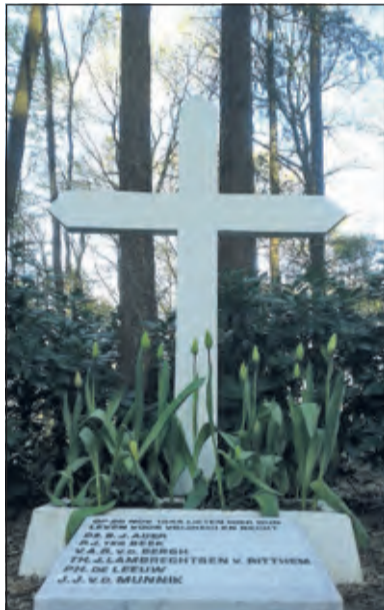
Het kruis op de berg, vanaf de weg zichtbaar. Gelegen in de gemeente Rhenen, aan de Veenendaalsestraatweg (N416) tussen Veenendaal en Elst.