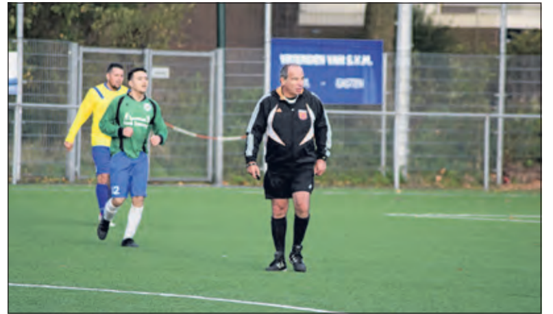
De opiniepeiler is soms ook beslissingsbevoegd.