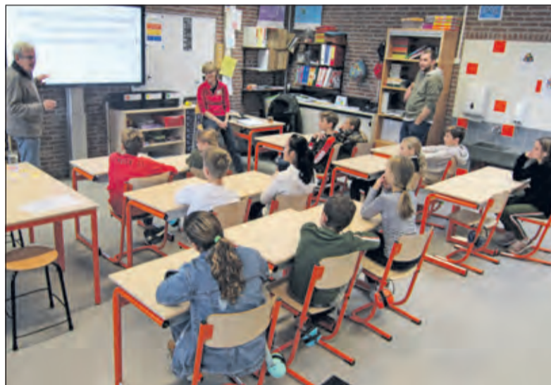
Een tekst als: 'Niemand kan zonder anderen! Nu niet, en vroeger niet; Niemand kan zonder vroeger!' verbaast niet uit de mond van hen, die enthousiast met de geschiedenis omgaan.

Respect ook voor vroeger. Want de kinderen van Hollandsche Rading lopen op straten en wonen in huizen, die door mensen van vroeger zijn gemaakt en die voor hun werk respect verdienen. Er werd over veel dingen gepraat: van een veldslag bij Hollandsche Rading tot verzetsstrijders, die in het dorp woonden. Op die manier werd de klas met hulp van https://onlinemuseumdebilt.nl getoond, waarom het lezen over verleden van Hollandsche Rading niet alleen leuk maar ook heel interessant is, om respect voor te hebben.