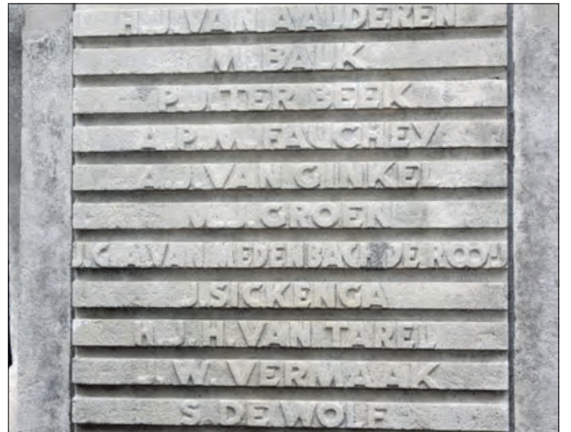
Op de voorzijde van de zuil zijn de namen van elf gesneuvelde verzetsstrijders aangebracht.

De Vierklank van 7 oktober 2015 vermeldt, dat op 18 november 1944 drie verzetsmannen uit Rhenen een aanslag pleegden op de Duitse onderofficier Alt, die daarbij zwaargewond raakte. Toen de daders onvindbaar bleken, werd besloten tot represailles. Op maandag 20 november werden uit de Weteringschans in Amsterdam drie gevangenen gehaald, onder wie dominee Bas Ader, die bezig was om een bevrijdingsactie te plannen voor Westerbork. Aan hen werden in Utrecht