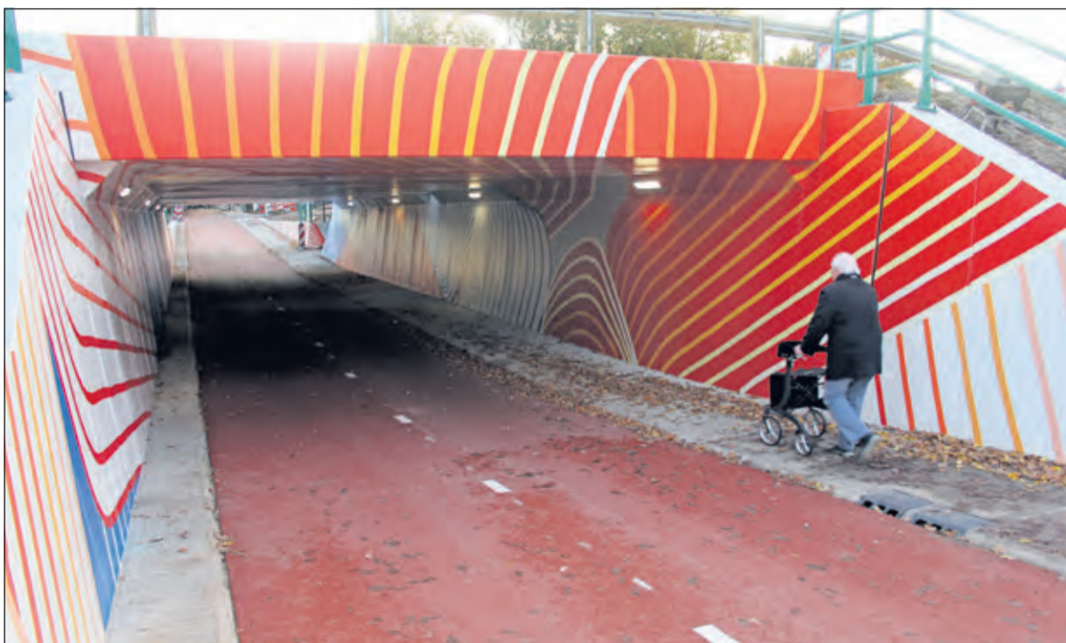
Vanaf donderdag 7 november mochten de eerste fietsers en voetgangers door het tunneltje. Een week later is de officiële opening.

Nu de wegwerkzaamheden voor de nieuwe fietstunnel onder de Utrechtseweg (N237) zijn afgerond, kan een ieder getuige zijn van de officiële en feestelijke opening van het resultaat: een brede, veilige en fraaie tunnel voor de vele fietsers op de route De Bilt-De Uithof op donderdag 14 november van om 10.45 uur bij de partytent bij de Oude Bunnikseweg, nabij de ingang van de fietstunnel.