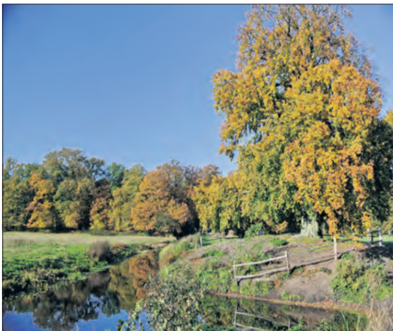
Landgoed Houdringe in herfsttooi. Met op de voorgrond een monumentale beuk van ongeveer 150 jaar oud.