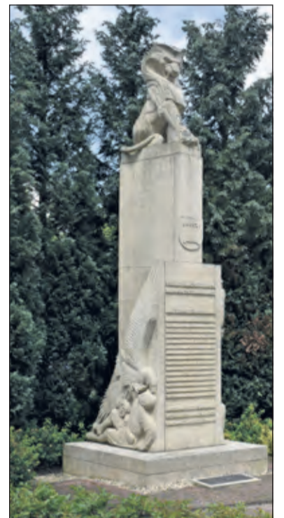
Het oorlogsmonument bij Jagtlust werd op 13 december 1958 onthuld.