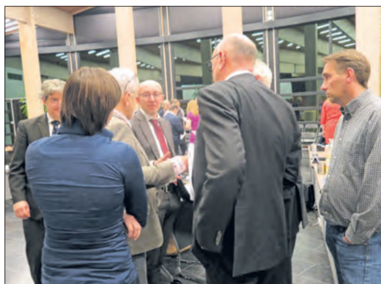
Overleg leidde meestal niet tot overeenstemming.