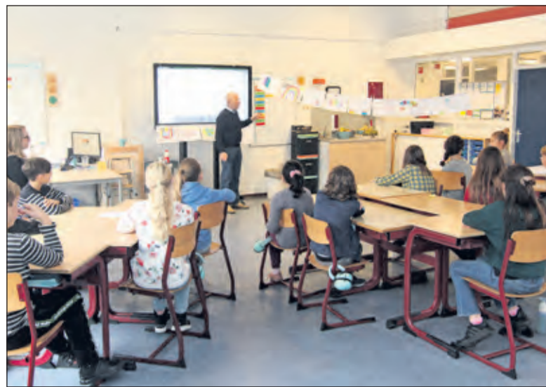
Een mooie zin op een van de A4tjes was: 'Respect moet je verdienen'

Bij de evaluatie met de leerlingen en leerkracht bracht Frans naar voren dat hij onder de indruk was van de maatschappelijke betrokkenheid van de leerlingen, die in de gesprekken een opvallende discipline opbrachten in het elkaar laten uitspreken.