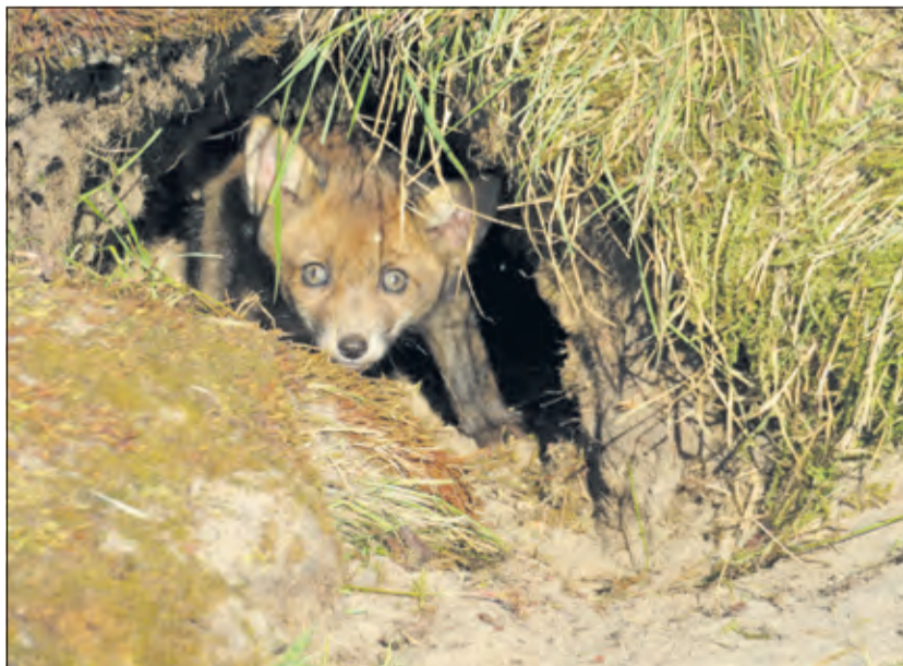
Leer alles over vossen tijdens de KinderNatuurActiviteiten.

KinderNatuurActiviteiten organiseert activiteiten voor kinderen in en over de natuur. Dit wordt gedaan door vrijwilligers van Utrechts Landschap en IVN De Bilt. Woensdag 20 november gaat het over wolven en vossen