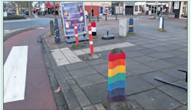
Aangeklede paaltjes sieren de hoek Hessenweg/Looydijk.

Allen zijn zeer positief over de ludieke en multiculturele actie, met vlaggen uit verschillende landen naast elkaar. Na het weekend waren er opeens een paar paaltjes met vlaggen bedekt, daarna kwamen er steeds meer bij. Niemand heeft gezien wie dit gedaan heeft. (Janny Smits)