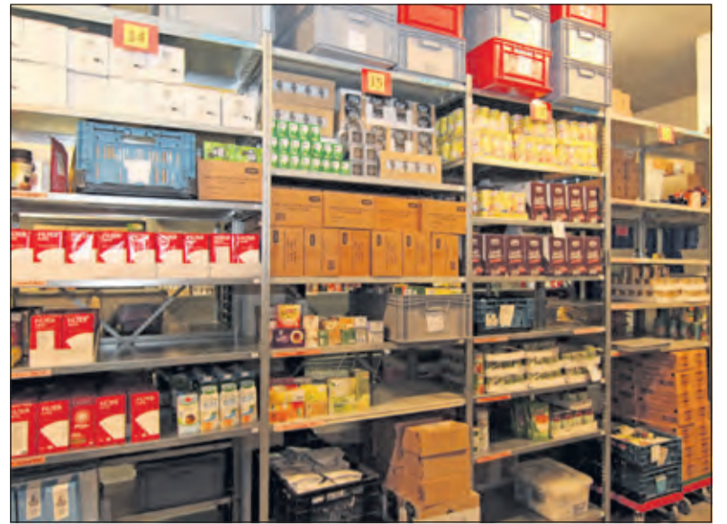
De voedselvoorraad in het magazijn van de voedselbank.