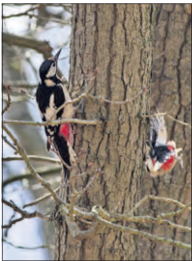
Twee grote bonte spechten hebben elkaar gevonden en zijn aan het baltsen (Ridderoordse bossen, april 2021).

De zwarte specht komt minder vaak voor in onze omgeving. Hij maakt elk jaar een nieuw nest met een ovaal gat in oude beuken of hij gebruikt ook wel bestaande nesten. De roffel van de zwarte specht is zwaarder dan die van de grote bonte specht en klinkt net als een mitrailleur. De zwarte specht broedt in onze omgeving in o.a. Beukenburg, Beerschoten, Eyckenstein en de Ridderoordse bossen.