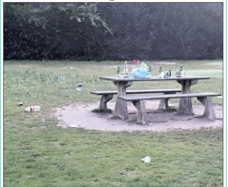
Na Koningsdag 2021 in het van Boetzelaerpark in De Bilt; de avondklok (22.00u) bestond nog, de straatverlichting deed het niet, dus iedereen lag op tijd in bed.