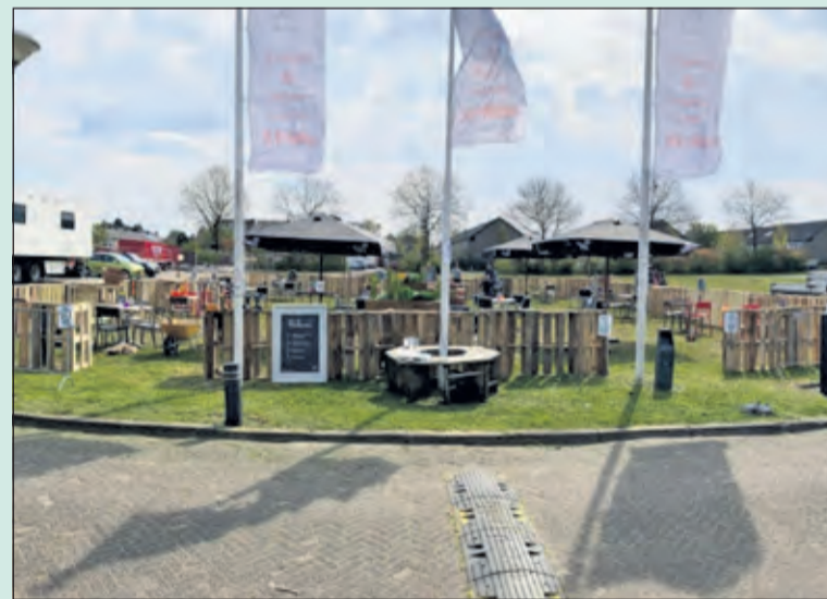
Op het gras voor het HF Witte Centrum is een terras ingericht.

Vanaf 28-4-2021 heeft het HF Witte voor het eerst in 50 jaar een terras gemaakt, en wel op het gras voor de ingang. Op het gras is een Ibiza/festival uitstraling geprobeerd uit te beelden. Even heerlijk een drankje of een klein hapje is nu mogelijk. Mocht de temperatuur aangenaam zijn en er zit geen regen in de lucht kan u bij ons een tafel reserveren op info@hfwitte.nl, aan de deur mag u natuurlijk ook reserveren.