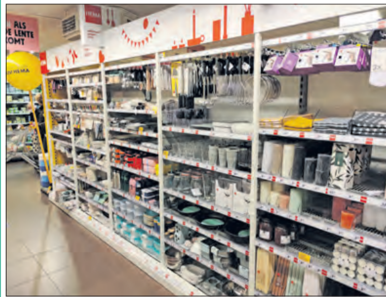
Het speciaal ingerichte Hema schap bestaat o.a. uit servetten, kaarsjes, punaises, borden en meer handige spullen en huishoudelijke producten.

In een aantal Jumbo supermarkten in Nederland is nu een klein assortiment met Hema spullen te koop; ook bij Jumbo Maartensdijk van Jelle Farenhorst. Het is de bedoeling dat het assortiment in anderhalf jaar tijd in alle 670 Jumbo-supermarkten in Nederland en België wordt verkocht. Vanaf de zomer zijn de Hema-artikelen ook verkrijgbaar op jumbo.com. De introductie van het Hema-schap is de eerste stap in de samenwerking tussen de bedrijven.