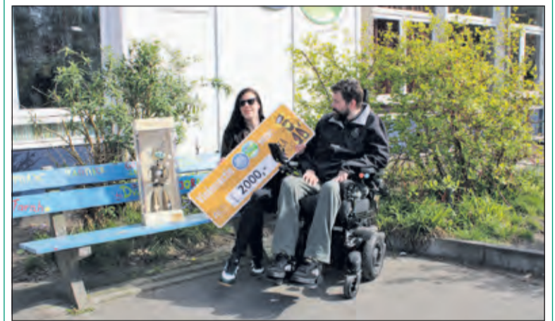
De opbrengst van de violenactie is bestemd voor de ontwikkeling van de ALS robot.