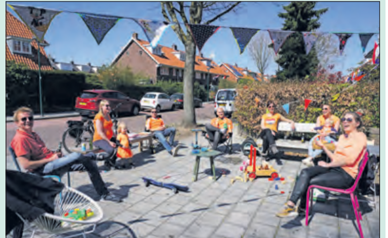
Omdat er ook dit jaar geen openbare feesten waren, bouwden de bewoners van de Steenen Camer in Bilthoven op Koningsdag hun eigen feest en vierden zo, met veel plezier en toch coronaproef, hun eigen Koningsdag. [Frans Poot]