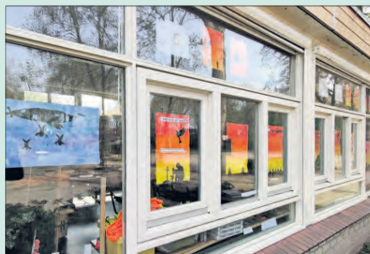
Kinderen laten zien wat vrijheid voor hen betekent.