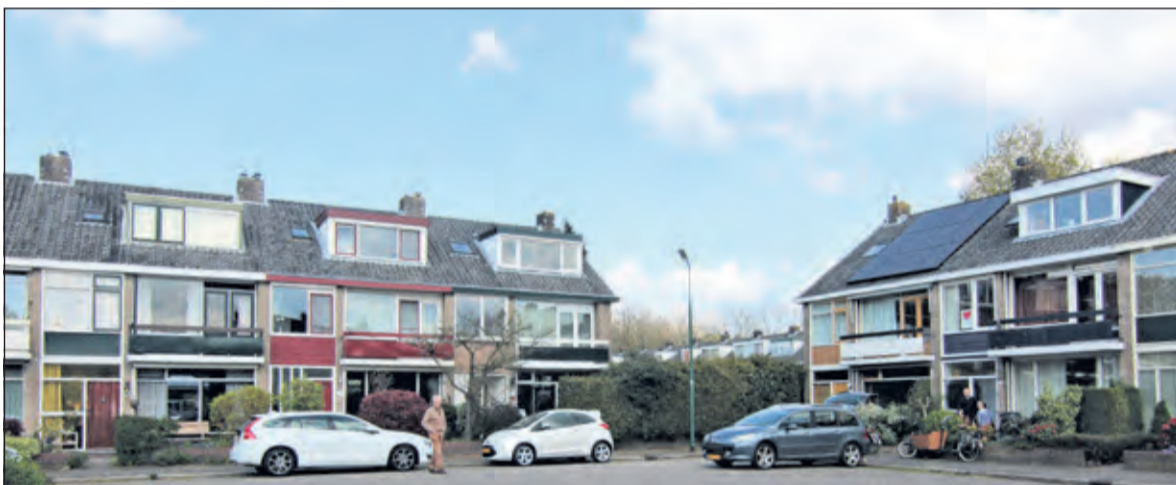
Energiewinning en -besparing verdient een gezamenlijke stap richting de toekomst.

Bodem Maar hoe krijg je de betrokken bewoners en eigenaren zover dat ze mee doen? En van wie is de stroom en warmte die je opwekt? Mastop: 'De meest voor de hand liggende oplossing is samen het Biltse Energiebedrijf te vormen. Die huurt je dak, investeert in de panelen en levert je de warmte en elektriciteit die je nodig hebt. Om opwekking en verbruik op elkaar af te stemmen is opslag nodig. Warmte kun je opslaan in de bodem. Voor elektriciteit zou je zelfs nog een stapje verder kunnen gaan als dat Biltse Energiebedrijf ook voor de balans op het net gaat zorgen door in tijden van overschot elektriciteit om te zetten in bijvoorbeeld waterstof. Dan krijgt De Bilt na zo'n 60 jaar weer een gasbedrijf. Over korte perioden is het benutten van de