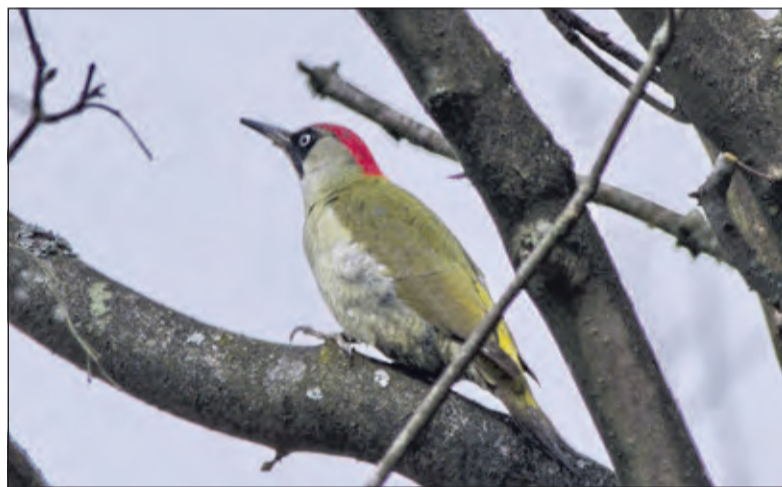
Een groene specht kijkt in Beerschoten uit naar een partner (april 2021).