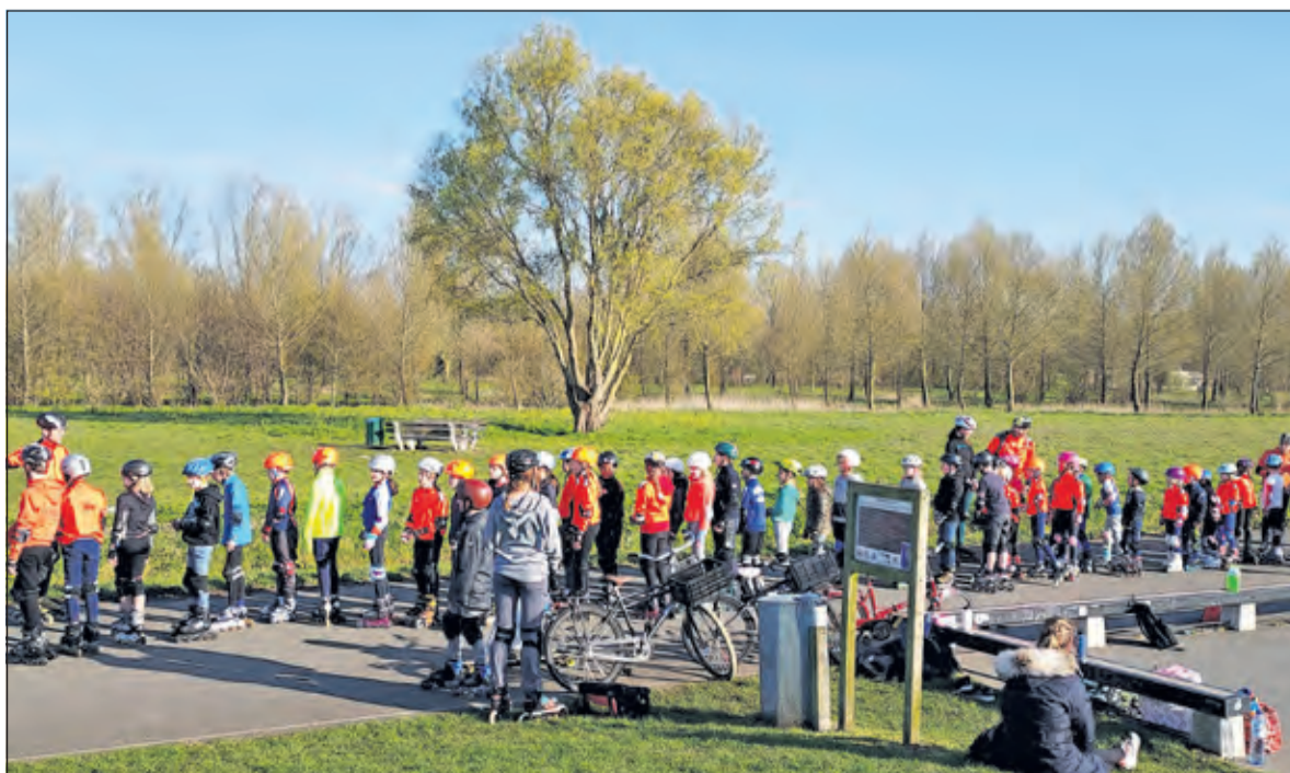
Skeelers in Noorderveld.

Iedereen die deze zomer structureel wil bewegen wordt uitgenodigd op de trainingen langs te komen om zonder verplichtingen en zonder kosten kennis te maken met bewegen in de buitenlucht. Meer informatie www.ijbm.nl