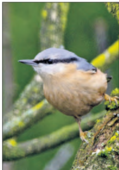
Een boomklever in de Leijense bossen (maart 2021).

De groene specht is erg schuw en voelt zich meer thuis in open loofbossen. Hij broedt meestal in een zelf uitgehakt hol in oude loofbomen. De lachende roep van de groene specht is een opvallend kenmerk. Hij roffelt niet vaak. Hij is in onze omgeving waargenomen in o.a. de Leijense bossen en in Beerschoten.