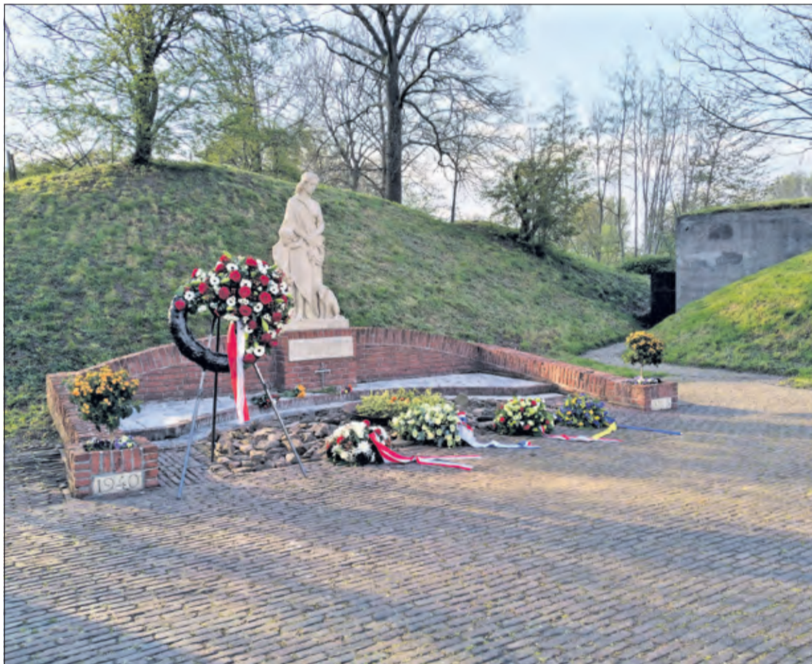
De kransen zijn gelegd.

vele documentaires. Oorlogsgetuigen zijn er nauwelijks meer. Daarom zijn we heel blij met de komst vandaag van Marten Mobach (De Bilt), die op 5 mei 1945 ternauwernood aan executie op dit fort ontsnapte. De heer Mobach hoopt volgende maand 102 jaar te worden'.