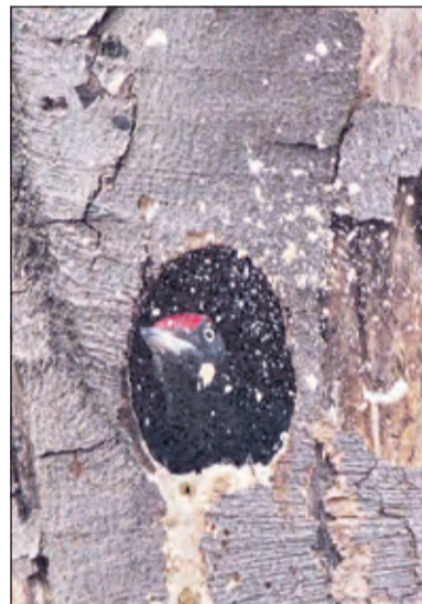
Een zwarte specht maakt een nieuw ovaal nest; hij gooit hier de houtsnippers uit het nest (Ridderoordse bossen, april 2021).

Een opmerkelijke kleine bosvogel is de boomklever (geen specht). Hij is in de lente overal erg luidruchtig aanwezig met schelle fluittonen en trillers. Ze nestelen vaak in oude hopen van spechten en komen overal in onze bossen voor. (Eugene Jansen)