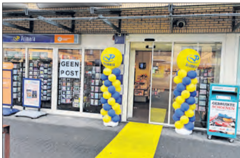
De looper ligt uit bij Primera.