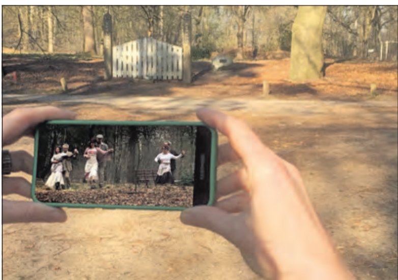
Op 'Het Verloren Kerkhof' wordt de video bekeken.