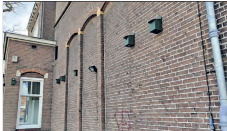
In de directe omgeving van deellocatie Jasmijnstraat 6A zijn meerdere tijdelijke vleermuiskasten opgehangen.