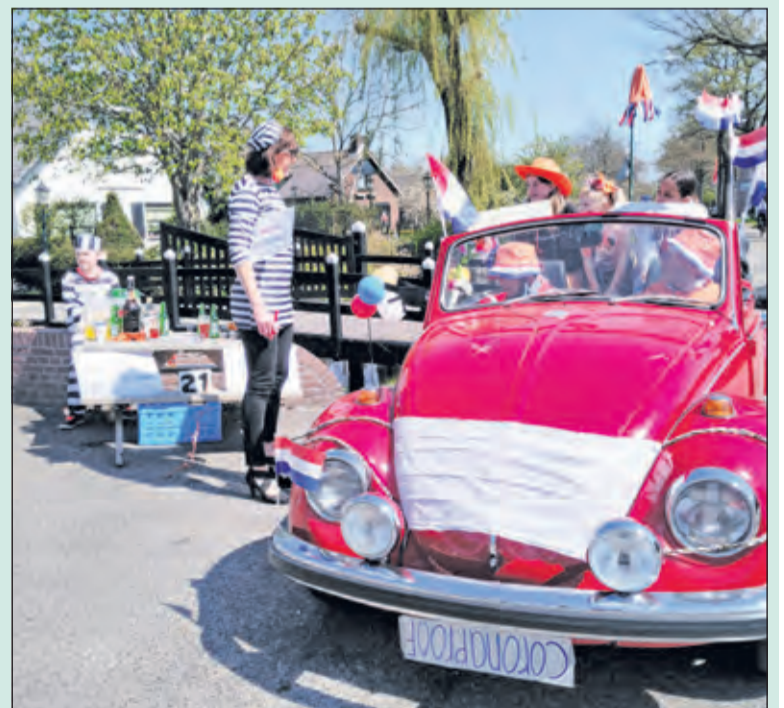
Ondanks de beperkingen zat de sfeer er toch goed in tijdens Koningsdag in Westbroek.