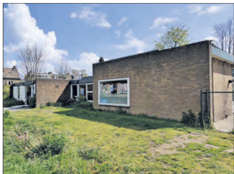
Aeolusweg 14 in De Bilt is een te slopen gemeentelijke herontwikkelingslocatie.

De locaties Jasmijnstraat 6a en Aeolusweg 14 in De Bilt zijn twee van de zeven te slopen gemeentelijke herontwikkelingslocaties. Communicatieadviseur Dagmar de Jong licht verder toe: 'Tijdens ecologisch