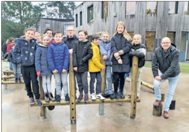
Leerlingen van de Theresiaschool zijn blij met de nieuwe klimtoestellen op het schoolplein.