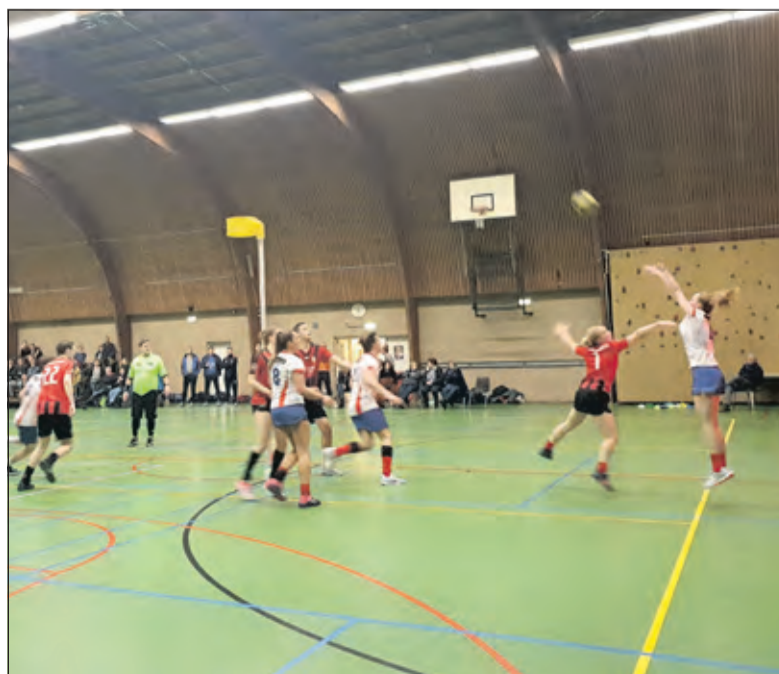
De spelers van Nova toonden veel strijd lust.

weer naast Noviomagum: 27-27. 'Boel dicht houden en gelijk spel meenemen', zou iedereen denken, maar niets was minder waar. Nova onderschepte snel de bal in de verdediging en had nog een kans, de allerlaatste, en deze werd benut in de laatste seconden van de wedstrijd: 28-27 voor Nova 1; de eerste punten waren binnen. Volgende week speelt Nova in Leusden tegen Antilopen. (Mex de Vree).