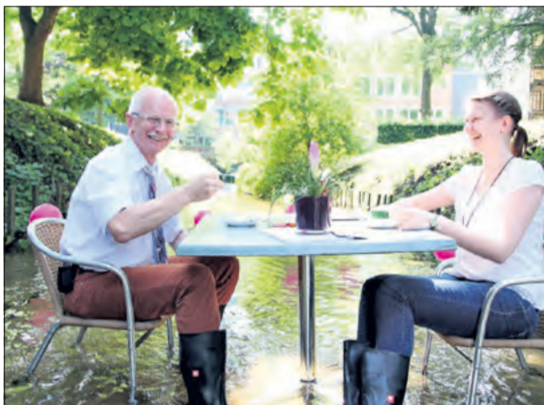
Het vrijheidsfestival vindt plaats in het Slotpark van Coesfeld.