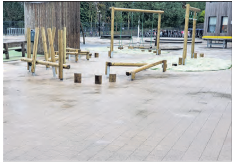
De klimtoestellen op het schoolplein