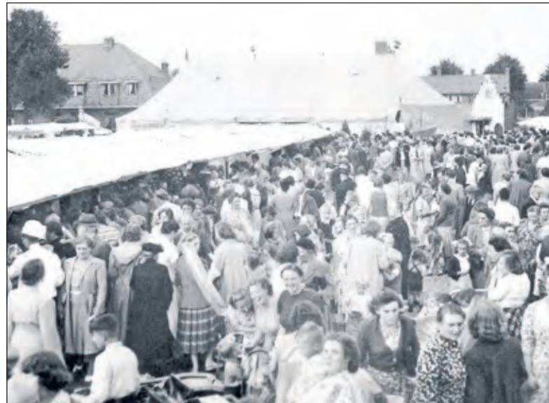
Bevrijdingsfeest voor de 'vork' Dorpsstraat en de Burgemeester De Withstraat in De Bilt. Deze foto is genomen vanuit het bovenraam van de drogisterij van het echtpaar Croiset.

De foto's komen uit de nalatenschap van de heer en mevrouw Croiset; zij hadden een drogisterij aan het begin van de Dorpsstraat in De Bilt. In dit winkelpand zit nu een art-deco-zaak. Foto's uit deze nalatenschap zijn in het bezit van mevrouw L. Rijksen uit Groene-