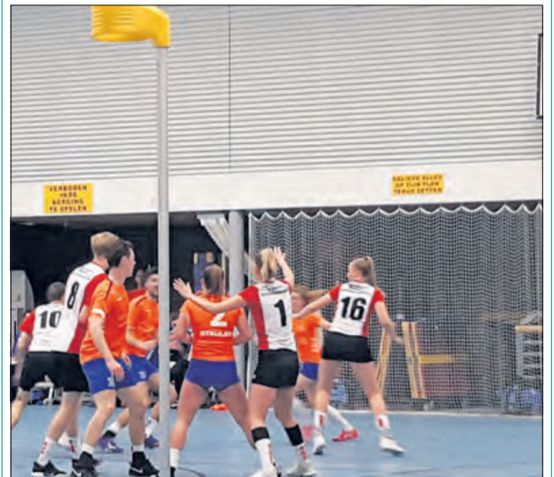
In de verdediging stond bij DOS niet alles op z'n plek.

DOS speelt volgende week tegen koploper Unitas (Harderwijk), dat zaterdag voor de eerste maal deze competitie verloor. De wedstrijd begint om 18.45 uur.