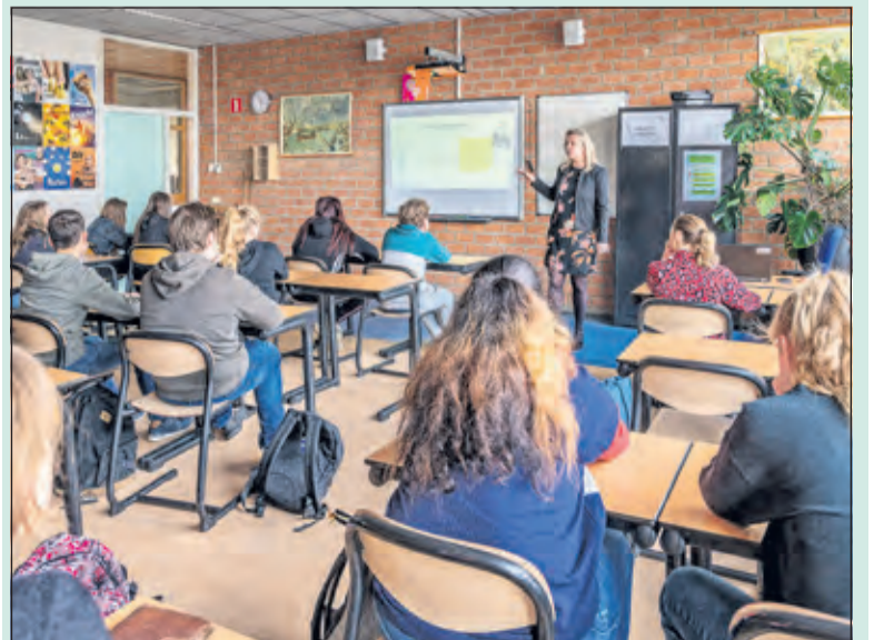
Rabobankmedewerkers vertellen over geld.