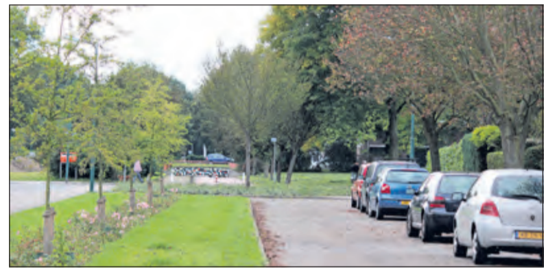
Al vanaf 2014 wordt gepleit voor het doortrekken van de Asserweg naar de Biltse Rading.