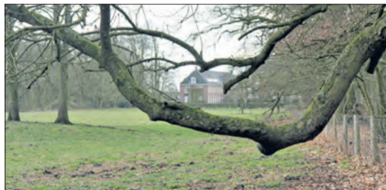
Witte paardenkastanje 'buigt' voor huis Houdringe.

te lezen. Tijdens deze wandeling wordt een aanzienlijk aantal bomen tijdens de route op naam gebracht; bomende gidsen vertellen over