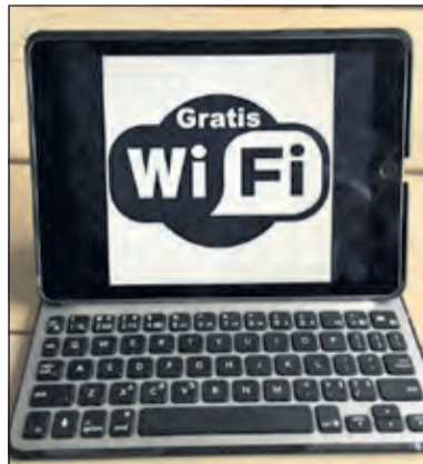
Geen gratis Wifi in Centrum Bilthoven.

Nu geen enkele winkeliersvereniging in onze gemeente interesse heeft voor gratis WiFi met een bijdrage in de kosten van onderhoud en beheer, hebben wij besloten geen verder initiatief te nemen voor het realiseren van gratis WiFi in onze gemeente en daarom af te zien van het aanvragen van een Europese subsidie'. [HvdB]