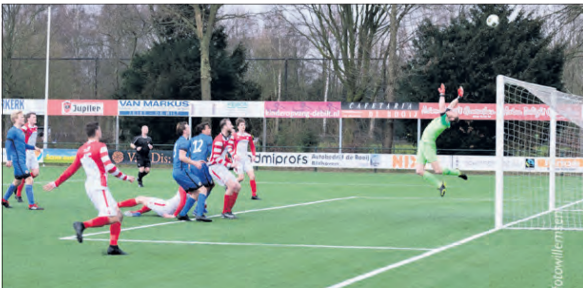
Hoogstaand voetbal, maar geen punten.

De komende weken volgen de uitwedstrijden tegen BOL en Argon en op 28 maart komt HSV Zuidvogens op bezoek.