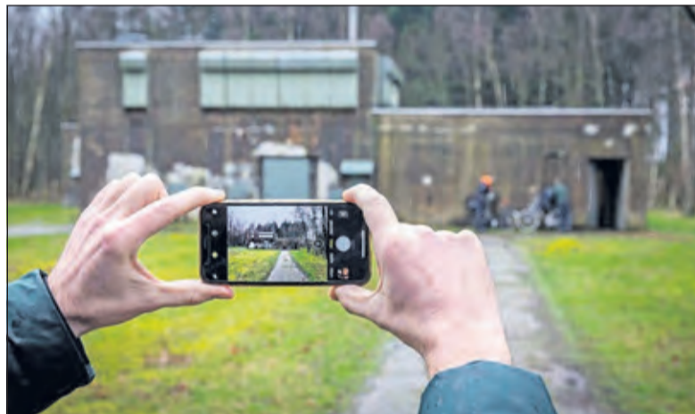
De Koude Oorlog wordt in beeld gebracht

Naar aanleiding van het themajaar Koude Oorlog is de storymap De Koude Oorlog in Utrecht ontwikkeld, met beeldmateriaal en achtergrondinformatie over de Koude Oorlog en de sporen uit deze periode in de provincie Utrecht. De verzamelde beelden uit de crowdsourcing zullen aan deze storymap worden toegevoegd. Tevens worden de beelden toegevoegd aan de Cultuurhistorische Atlas van de provincie Utrecht.