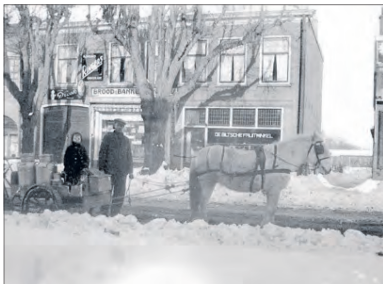
Winter 1941-1942, een hele strenge winter waarin ook de Elfstedentocht gereden werd. Deze foto is genomen vanuit de winkeldeur van de drogisterij: een deel van de paden op de achtergrond staan en nog steeds, maar met wat minder reclame.