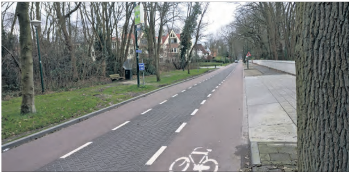
Inwoners zijn blij met het feit dat er geen gelede bus meer in de wijk rijdt, maar liever nog willen ze een vrij-liggend fietspad langs de Jan Steenlaan.