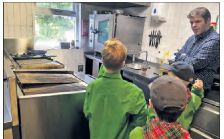
Welpen nemen een kijkje in de keuken van Restaurant de Paddestoel.

Het bezoek aan de keuken was het hoogtepunt; hier mag je gewoonlijk niet komen, maar nu konden de welpen al hun vragen stellen. Terwijl het ene groepje in de keuken was, was het andere groepje in het restaurant zelf alles aan het bekijken. Hoe werkt bijvoorbeeld het systeem van de bestellingen en hoe maak je nou een echte espresso? Nu moeten er thuis en in het clubhuis nog opdrachten gedaan worden en dan zijn de welpen klaar en kunnen ze met een volgende actie beginnen; bijvoorbeeld de aanstaande vlaaienverkoop met Pasen. (Jordi van de Visch)