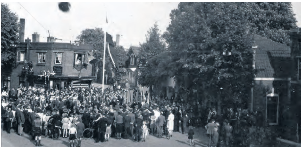
Het feestterrein kijkt uit op de achterzijde van de woningwetwoningen op de Hessenweg. De grote tent loopt er evenwijdig aan. Het is moeilijk te traceren, wanneer dit feest gevierd is.