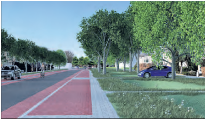
Visualisatie mogelijke nieuwe situatie Asserweg.

De laatste overgebleven belangrijke pijler uit het VCP betreft de herprofilering van de Hessenweg Zuid. Voor deze herprofilering zijn echter geen financiële middelen beschikbaar. Ook een kostenefficiënte aansluiting bij het reguliere wegwerkzaamheden biedt geen oplossing omdat het beheer en onderhoud van de Hessenweg Zuid de eerstkomende jaren nog niet aan de orde is. [HvdB]