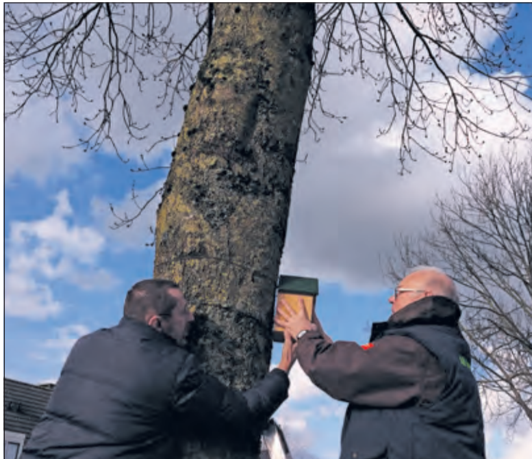
Werkgroep Biodiversiteit brengt nestkastjes aan.

De nestkastjesactie is een initiatief van de Werkgroep Biodiversiteit Westbroek in samenwerking met de Agrarische Natuurvereniging Noorderpark. De twee groepen bundelen hiermee de krachten om de ecologische variatie in de dorpen te bevorderen. Ook in Maartensdijk zullen 5 nestkastjes worden opgehangen in de omgeving van De Vierstee. De gemeente De Bilt heeft bepaald waar de kastjes mogen komen en hoe ze moeten worden opgehangen (zonder spijkers).