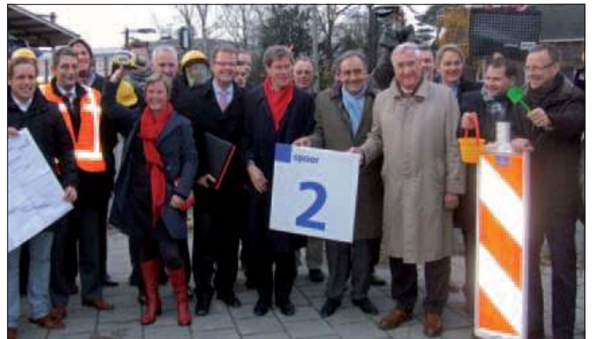
Na de ondertekening poseren partijen bij het station.