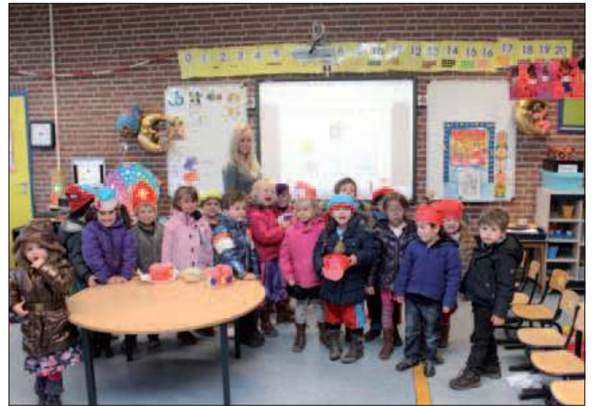
In groep 1-2 van de Bosberg(basis)school wordt ook al een digitaal schoolbord gebruikt.

Een van de wensen is om de mogelijkheid van een schoolbrede 'Yurls' toe te gaan passen, een soort startpagina met alle relevante websites. Hierdoor kunnen ouders meer betrokken raken bij de lesstof en kinderen kunnen hier thuis mee werken op individuele basis en niveau. Verder zal, vermoedelijk in januari 2012, een proef van twee weken worden gedraaid met Laptop's in een bovenbouwgroep, met aansluiting op internet. Maartje werkt momenteel met een whiteboard met een interactieve beamer die draadloos verbonden kan worden met laptop's. Bijzonder is dat er vier laptop's tegelijk op het scherm geprojecteerd kunnen worden. De