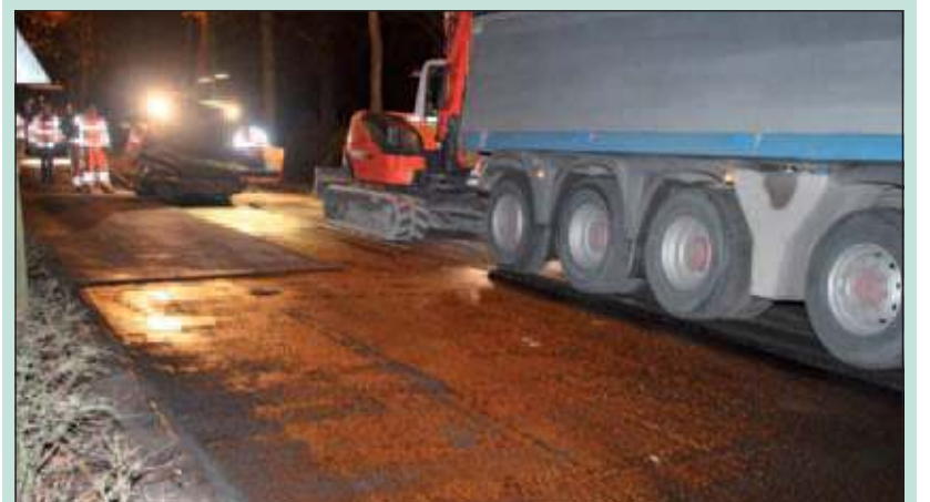
In plaats van de aangekondigde donderdagavond/vrijdagochtend (1-2 december jl.) zijn de asfalteringswerkzaamheden aan de Maartensdijkse Dorpsweg een etmaal later met uitstekend resultaat uitgevoerd. [HvdB]