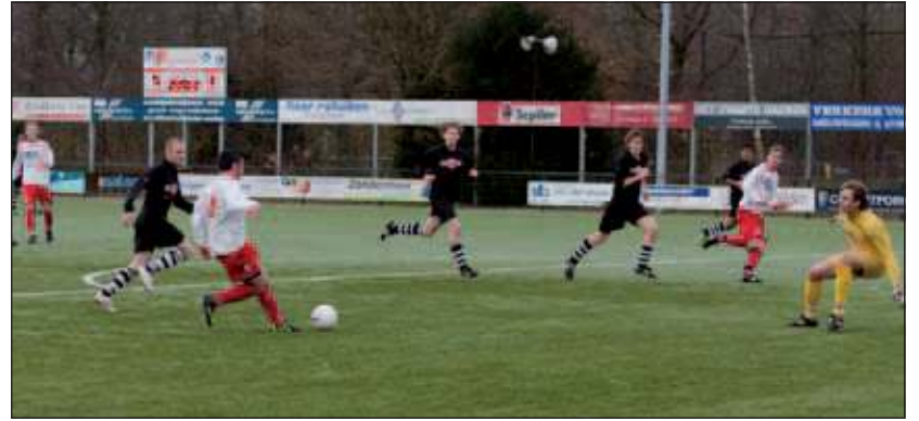
FC De Bilt kwam afgelopen weekend laat op dreef.