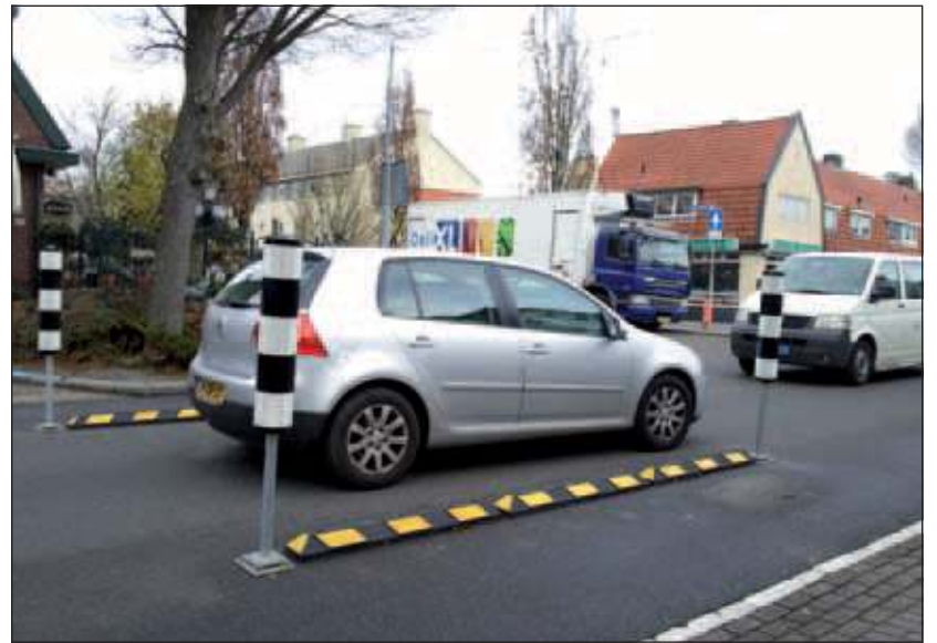
Oei! Bijna een ongeluk door de vreemde verkeerssluis aan de Looydijk.