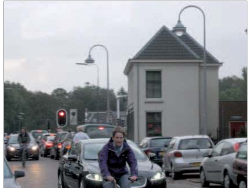
In twee richtingen een dagelijks tafereel van fietsers die hun weg zoeken tussen auto's in dit stukje van een zogenaamde fiets-vrij route.

De gemeente heeft de Dorpsstraat ingericht alsof het een rustige woonwijk is, zonder te kiezen voor het krachtig terug dringen van het autoverkeer. Dat is volgens de fietsersbond onverantwoord. De oplossing is eenvoudig. De voorrang voor doorgaande fietsers op auto's uit de burgemeester de