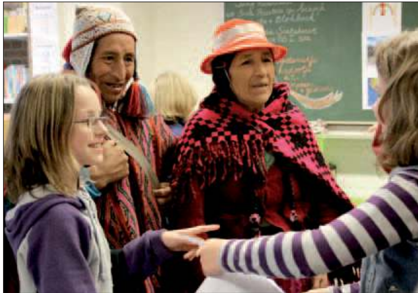
De kinderen van de Montessorischool vonden de Incapriesters maar wát interessant.