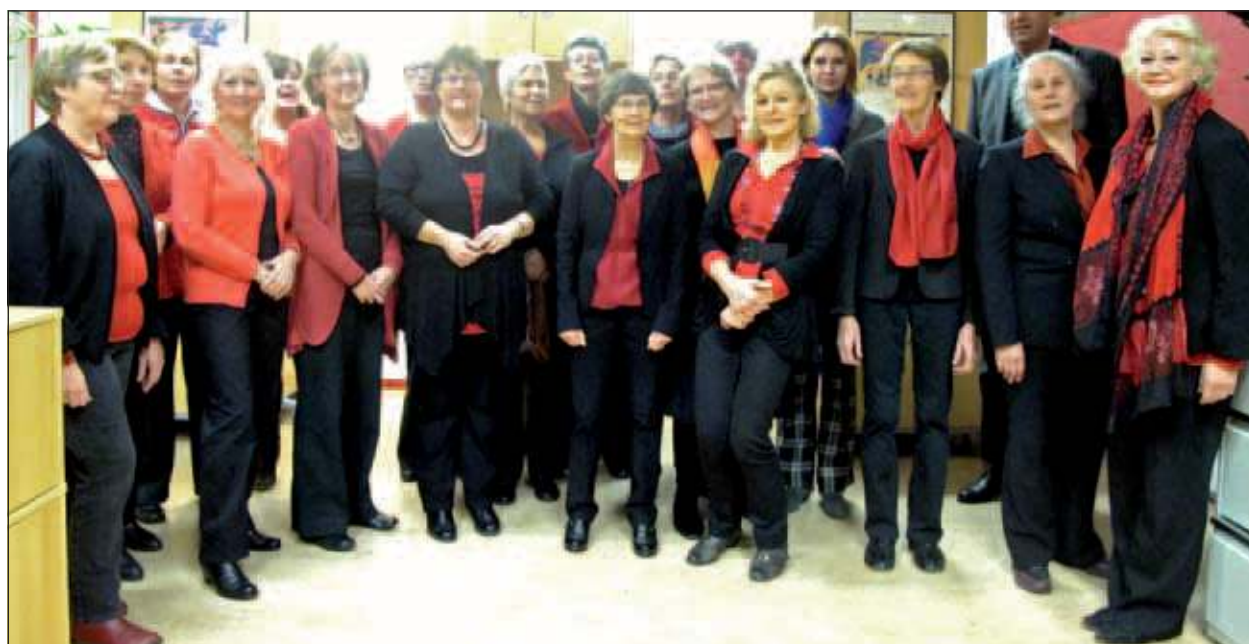
Ludi Cantate werkt heel hard om er een prachtig kerstconcert van te maken.

Het kerstconcert wordt gegeven in de Biltse Muziekschool, Henrica van Erpweg 2, De Bilt en begint om 20.00 uur. Kaartjes kosten 7,5 euro en zijn verkrijgbaar aan de zaal en via de website www.ludicantare.nl .