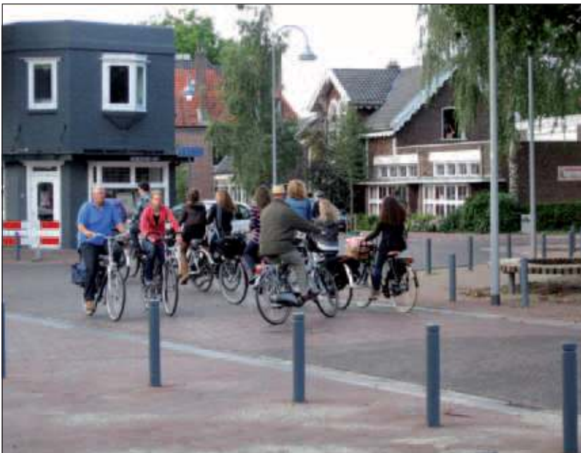
Een kluwen fietsers. Die ene auto uit de burg. de Withstraat wacht gelukkig even.

De Dorpsstraat in De Bilt is heringericht. Het ziet er mooi uit, met een Anton-Pieck-achtige uitstraling. Een plaatje. Maar op een plaatje kun je niet fietsen. Dit knooppunt van wegen is de drukste fietsverbinding in De Bilt. Bij de herinrichting is geen rekening gehouden met de hoeveelheid verkeer, auto's en fietsers, die hier langs gaat. Met name voor fietsers is het een stuk onveiliger geworden. De fietsersbond is hierover zeer teleurgesteld. Ze vindt dat er alsnog een vrijliggend fietspad moet komen.