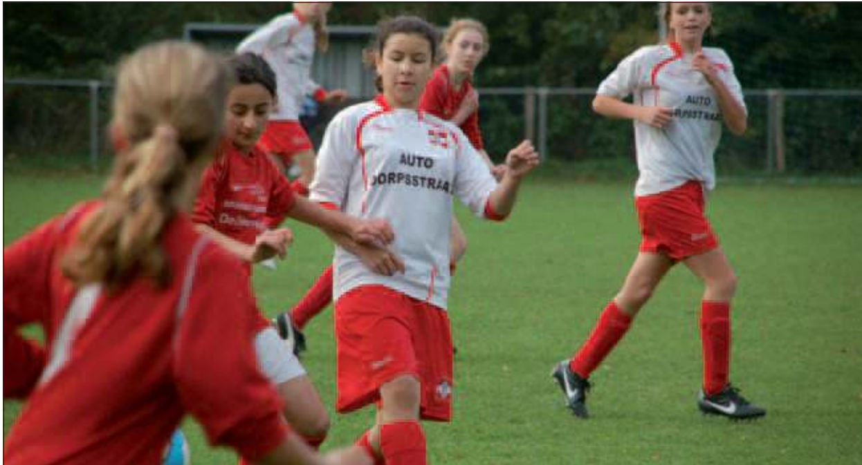
Voetbalmeiden zoeken versterking.