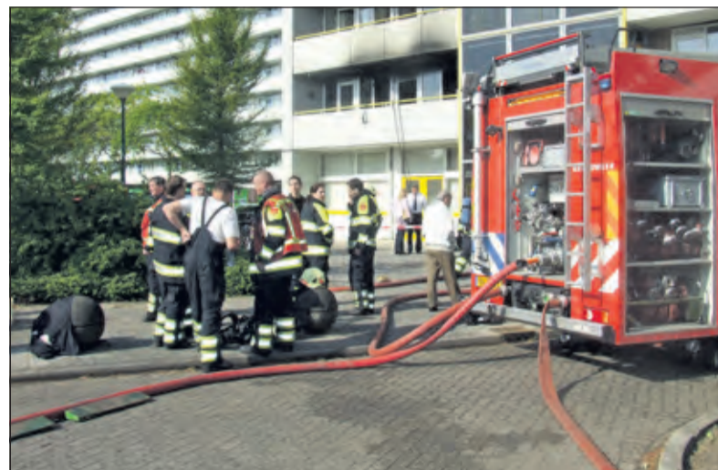
De brandhaard op de eerste verdieping van flatgebouw Noordpool.

Het eerste voordeel is een voor de hand liggende: je bespaart een hoop ruimte. Want als je de hele administratie digitaal opslaat, heb je ook geen horde aan ruimte ro-