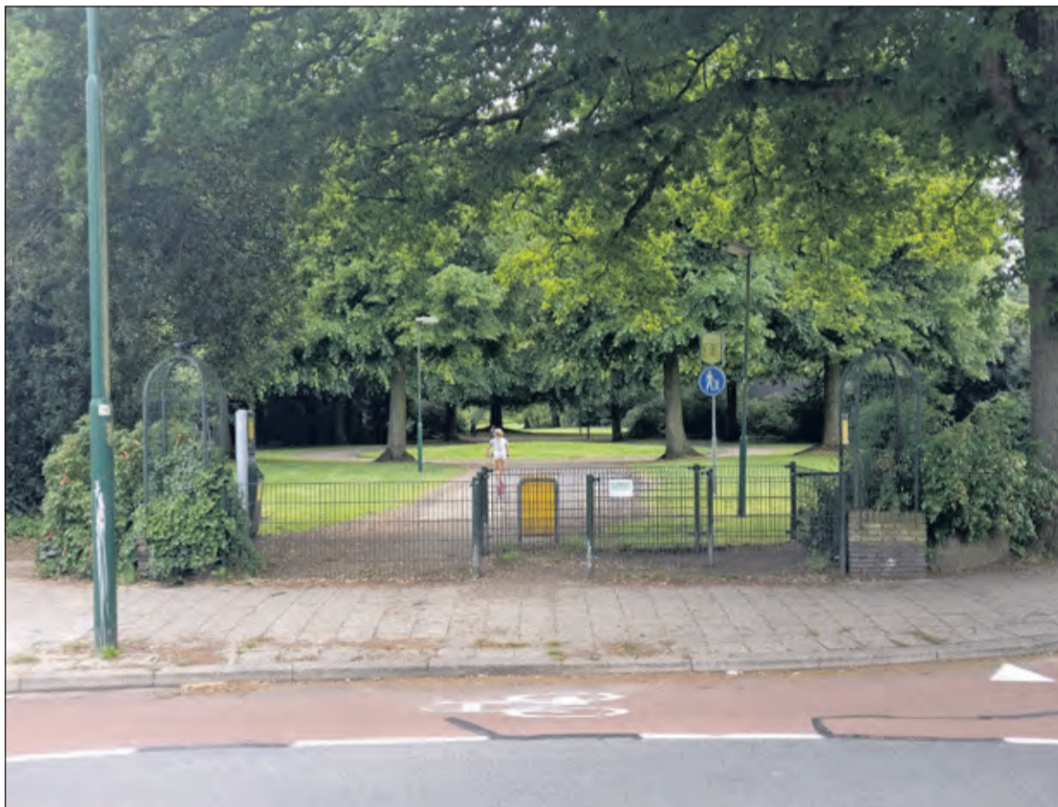
Vrienden van het Van Boetzelaerpark en de gemeente De Bilt hebben samen een plan gemaakt om de entree van het park te verbeteren.

van het cirkelplantsoen een mooi beplantingsvak. Dit vak is door bezuinigingen verdwenen. De Vrienden van het Van Boetzelaerpark willen dit cirkelplantsoen in ere herstellen en zelf het beheer op zich nemen. Zie voor meer informatie over de Stichting Vrienden van het Van Boetzelaerpark, ontwikkelingen en activiteiten in het park de actuele website van de stichting: www.vriendenboetzelaerpark.nl .