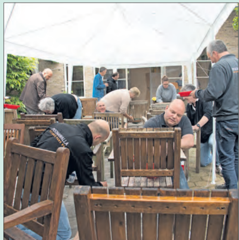
Een deel van het massief houten meubilair was eigenlijk al een paar jaar toe aan een opknappbeurt.