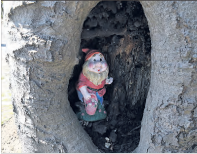
Walter Eijndhoven wist de kabouter eerder op de foto te zetten.