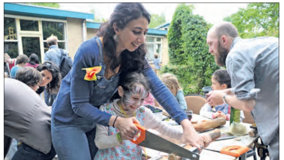
Festivalgangers in De Bilt maken zich hard voor een groenere wereld.