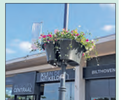
Vrolijke bloembakken fleuren het winkelcentrum op.

Binnenkort zullen ook de banieren in het kader van 100-jaar Bilthoven vervangen worden. De hangende baskets en nieuwe banieren zijn een initiatief van de winkeliersvereniging Bilthoven Centrum om de beleving van het centrum voor zowel bewoners, ondernemers en bezoekers op kleurige en fleurige wijze te versterken.