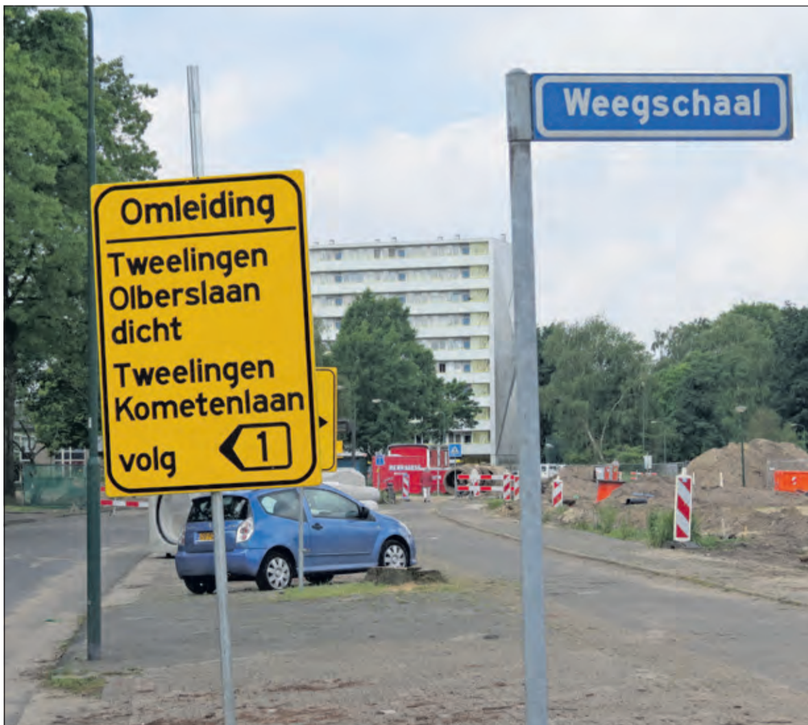
Bouwwerkzaamheden zorgen voor ongemak.

Eigenaren en winkeliers laten zich nu juridisch en strategisch bijstaan, want de situatie in het centrum wordt steeds nijpender. Bovendien geldt bij parkeren dat voldaan moet worden aan redelijke loopafstanden en goede zichtlijnen. De winkeliers: 'Maar het wordt nog urgenter als we alleen naar het deel van het oude centrum kijken. Hier geldt dat de feitelijke parkeerruimte 65% minder is dan de werkelijke behoefte van parkeeraantallen voor bezoekers, bewoners en werknemers. Wij betreuren dat de uitgestoken handen om samen te werken en scenario's uit te werken niet zijn opgepakt. Het is voor ons niet eenvoudig een weg te vinden in de gemeentelijke molen bij dit soort trajecten. Zeker omdat het gevoel heerst dat kennis van buitenaf moeizaam wordt geaccepteerd. Uiteindelijk zijn het juist de retailers, die dagelijks bezig zijn om hun hoofd boven water te houden in een centrum dat al bijna tien jaar in de steigers staat. Letterlijk verbouwen met de winkel open. De Bilt wil daarbij ook nog eens een rol gaan spelen om duizenden bezoekers voor het Utrechts Science Park 'af te vangen'. Dit stelt de ondernemers ook niet gerust, want dit heeft grote impact op de parkeersituatie in het centrum'.