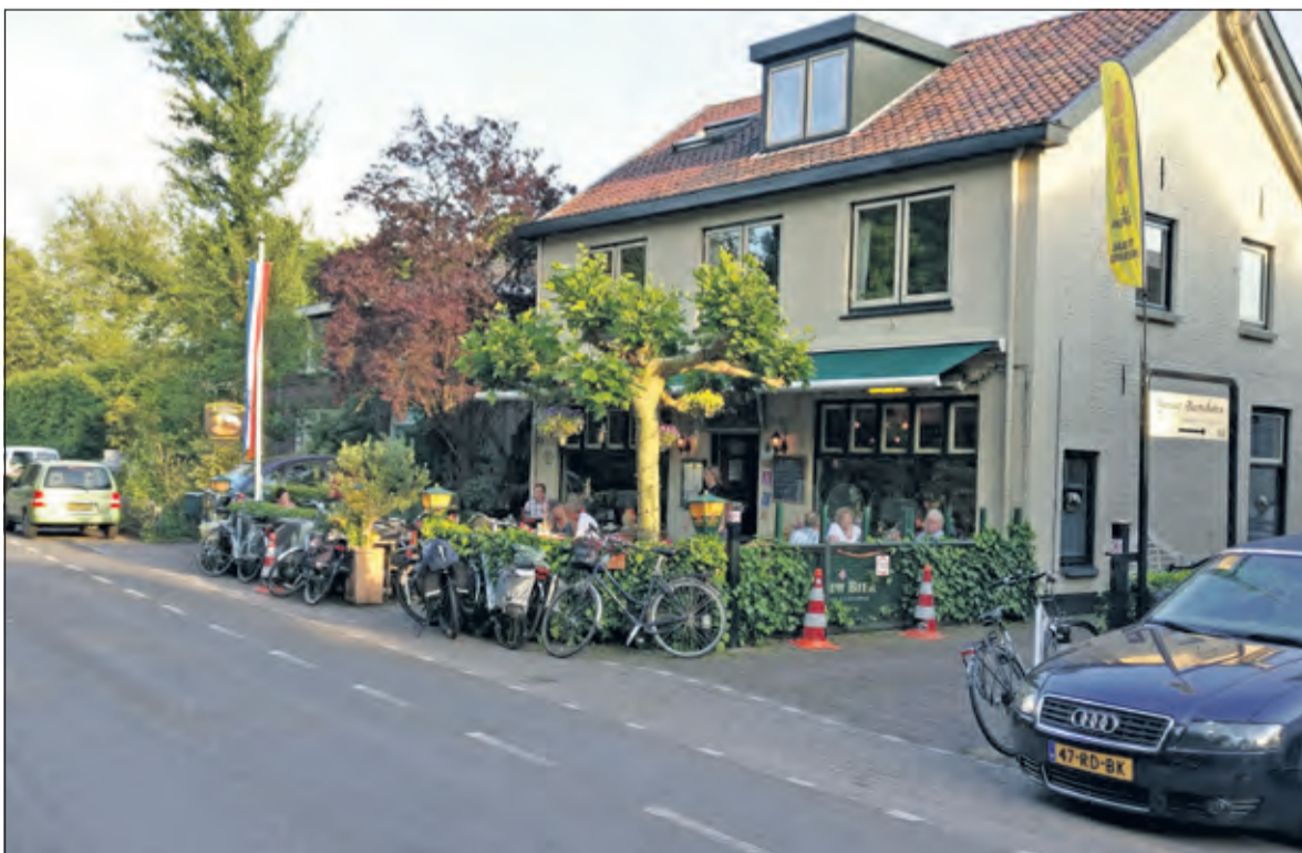
Dorpsbistro Naast de Buren in Groenekan draagt ook een steentje bij aan de SamenLoop.

De SamenLoop voor Hoop wordt gehouden op 28 en 29 juni op het terrein voor gemeentehuis Jagtlust. Meer informatie: www.samenloopvoorhoop.nl/debilt .