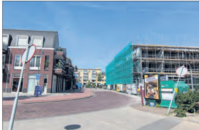
Het Vinkenplein wordt een plek om te ontspannen en te ontmoeten. De nieuwe bebouwing aan het Vinkenplein biedt tevens ruimte om te wonen. Het parkeren vindt plaats in een eigen, ondergrondse parkeervoorziening.