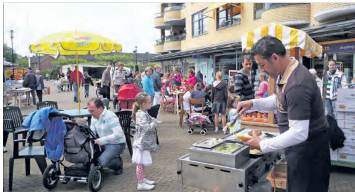
Gezellig druk op Maertensplein.