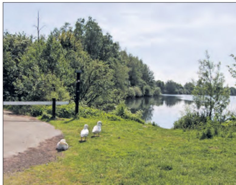
De Hooge Kampse Plas is een oude ontzanding. In de plas is in de loop der tijd van alles gestort. Toch is er een natuurgebied ontstaan, waar watervogels een thuis hebben gevonden en een das een burcht heeft. Het Utrechts Landschap, sinds 2003 beheerder en eigenaar van de plas, wil de natuurwaarden van de plas ontwikkelen.