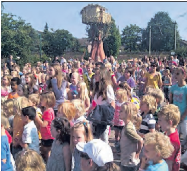
Eind juli rekenen veel kinderen weer op een fantastische vakantieweek.

activiteiten meehelpen. Al die vrijwilligers bij elkaar vormen een heel gemêleerd gezelschap. 'Dat maakt de vakantieweek heel dynamisch'. Subsidie van de gemeente krijgt WVT niet voor de vakantieweek. 'Het is een kostendekkend plaatje. Poppink: 'Wij zijn op zoek naar enthousiaste mensen die de hele week beschikbaar zijn en het leuk vinden om een groep kinderen een leuke start van de zomervakantie te bezorgen. Heb jij het in je om kinderen een leuke activiteit te bieden? De activiteiten zijn 'kant-en-klaar', dus alles is aanwezig om er een week van te maken. WVT zorgt voor de lunch en natuurlijk krijgt iedereen de nodige informatie zodat we er met zijn allen weer een geweldige week van kunnen maken.