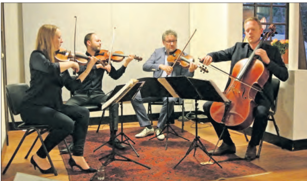
Met hun gloedvolle spel en vlotte presentatie zijn de leden van het Matangi Quartet boegbeelden van een nieuwe generatie klassieke musici.

‘Muzikale ideeën achtervolgen me en martelen me haast... Ik kan ze niet ontvluchten, ze staan als muren voor me. Mijn verbeelding speelt op mij als op een piano... eigenlijk ben ik weinig meer dan een levende piano...’ Dat zei de toen al ernstig zieke Joseph Haydn op zijn ziekbed, slechts drie jaar voor zijn overlijden. Een treurig einde voor de anders zo levenslustige componist, die met zijn tijdgenoten Mozart en Beethoven, die hij allen ook goed kende, de zogenaamde Eerste Weense school vormde: drie muzikale giganten, van wie afgelopen woensdag alle drie werken werden gespeeld in een volgepakt Huize Gaudeamus.