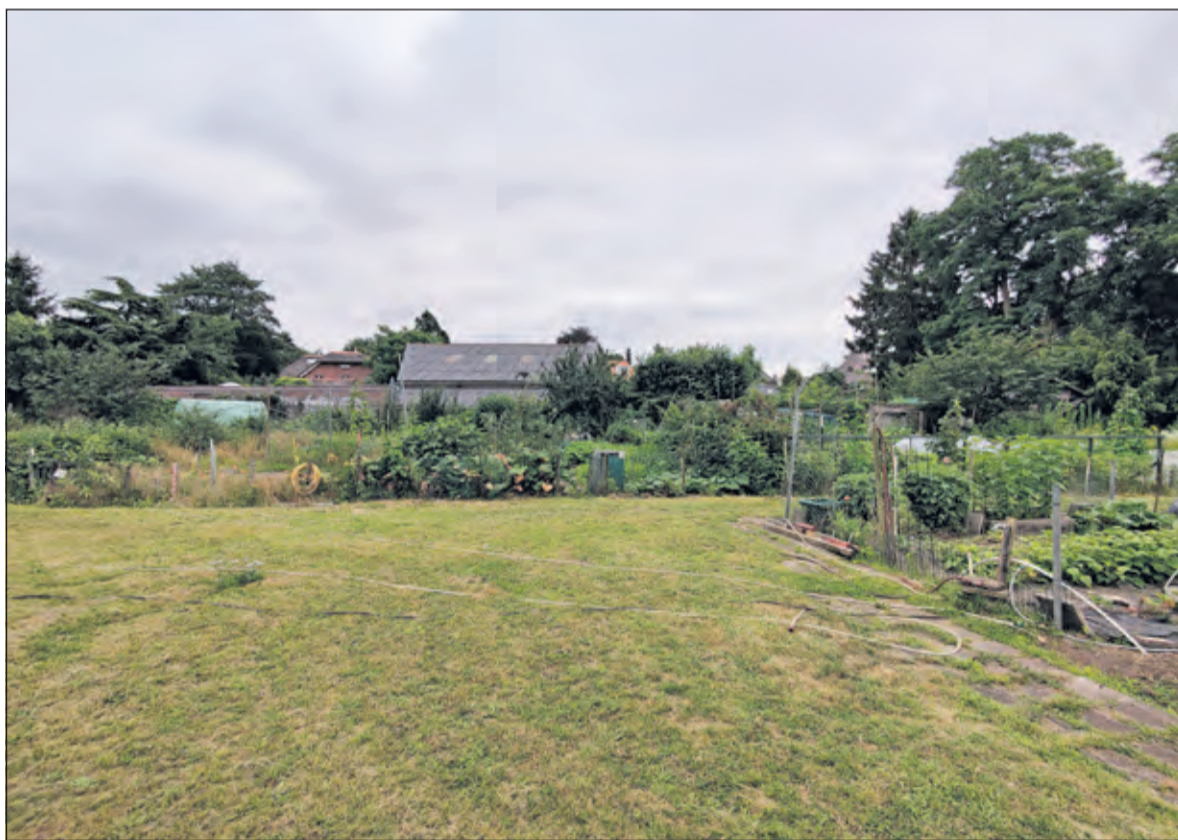
Voor het naastgelegen volkstuinencomplex wordt gezocht naar een alternatieve locatie.

aan meer woningen, in het bijzonder appartementen. Gedurende het proces is er een maximale invulling gepresenteerd van 88 appartementen als potentieel wenselijk model, maar dat is mede door het participatieproces aangepast naar de huidige 68 woningen, deels eengezinswoningen, deels appartementen op een (door verwerving van het perceel van de brandweer) iets vergroot plangebied. Vanuit het Adviesteam is aanvankelijk gepleit voor vooral eengezinswoningen. Gaandeweg het overleg is de combinatie van eengezinswoningen en appartementen acceptabel bevonden. Dat zou echter tot een maximum van 50 à 60 woningen moeten leiden. Het Adviesteam pleit voor een planopzet waarbij alle bebouwing in twee lagen met een kap wordt uitgevoerd, wat tot 57 wooneenheden zou moeten leiden. Het is aan de gemeenteraad om dit verschil in opvatting te wegen in haar besluitvorming'.