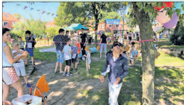
Stralende weersomstandigheden maken de Buitenspeeldag compleet.

Het was een enorm succes met 140 kinderen uit de buurt; zij kregen een spelkaart en konden langs alle spelletjes zoals schminken, bubbelvoetbal, blote voetenpad, verfmachine, Twister XL, Joe's webb (groot klimbos), ouderwets koekhappen en natuurlijk was er een springkussen en limonade. Dankzij vele vrijwilligers rondom de speeltuin en de onmisbare sponsors kan men dit jaar weer terugzien op een succesvolle dag voor de kinderen. (Judith Voskamp)