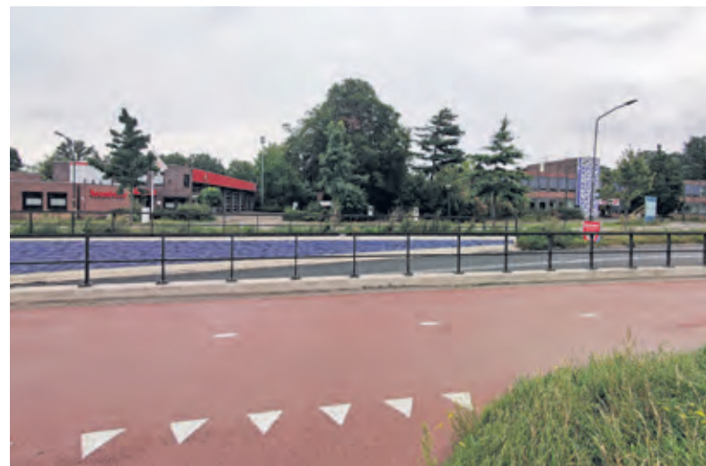
Op verzoek van de Veiligheidsregio Utrecht (VRU) kunnen enkele aanpassingen aan de naastgelegen brandweerpost worden uitgevoerd met o.a. mogelijkheden voor een veiliger verkeersontsluiting.

Het college vervolgt: 'Direct bij de aanvang van het traject in februari 2020 is het college een participatieproces met omwonenden gestart. Het participatieniveau rondom het opstellen van de ruimtelijke randvoorwaarden past in de categorie 'meedenken'. Het participatieproces was uitgebreid en intensief. Tussen twee buurtbrede bijeenkomsten hebben zes bijeenkomsten met een delegatie van omwonenden in een samengesteld Adviesteam plaatsgevonden. Alle informatie over de bijeenkomsten is terug te vinden op de gemeentelijke website. Op basis van de inbreng van de buurt is het plan aangepast met een groenere inrichting en een 'jaren '30 bouwstijl', maar op onderdelen als de bouwhoogte en woningaantallen zijn verschillen van mening gebleven. Gelijktijdig met het participatieproces over de ruimtelijke randvoorwaarden, hebben wij in samenspraak met de gebruikers van het naastgelegen volkstuinencomplex gezocht naar een alternatieve locatie voor de volkstuinen. Een locatie aan