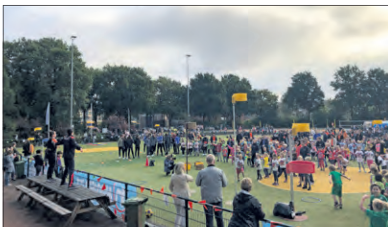
De opening van de derde Giga Kangoeroedag in 2019.