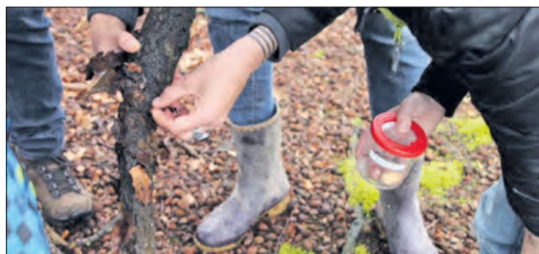
Kleine beestjes vinden in het bos vereist speurderskwaliteiten.

Het is voor de leeftijdscategorie 6 t/m 10 jaar op woensdag 22 september van 14.30 tot 16.30 uur in Paviljoen Beerschoten, de Holle Bilt 6, De Bilt. Aanmelden per email tot en met zaterdag 18 september via kindernatuuractiviteiten@gmail.com