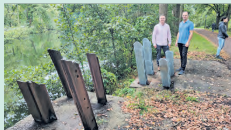
De Gebroeders Verschuur plaatsten al eerder een vechtwagenhindernis.

Anne Holvast uit Blauwkapel: 'In de Bastionweg zijn nog de uiteinden van een betonblok te vinden, waar destijds ook een vechtwagenhindernis stond'. Omdat de combinatie Nederlandse-Duitse vechtwagenversperring uniek is in Nederland, ontstond het idee om de Nederlandse 'in