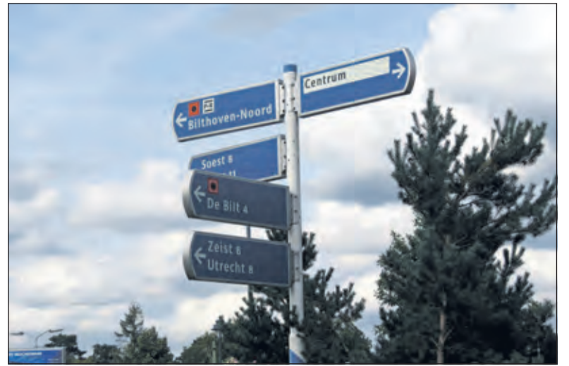
De weg naar Bilthoven-Noord.

Over de 155 planschadeclaims die in 2021 door inwoners zijn ingediend en behandeld zijn zegt de wethouder dat die erin geresulteerd hebben dat de vergoeding die de gemeente moet betalen op nul staat. 'Alle claims zijn dus niet gehonoreerd. De reden voor afwijzing van de claims is divers. Het betreft 155 individuele gevallen die aan de hand van een individueel advies van een onafhankelijk planschadebureau beoordeeld zijn. In alle