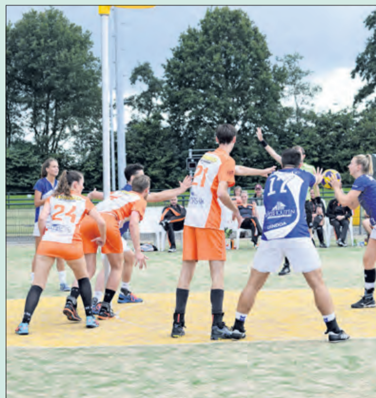
De seizoenopening is voor Tweemaal Zes weer een feit. Het eerste team van de Maartensdijkers boekte een 18-14 overwinning op Dindoa dankzij een felle start waarin de Maartensdijkers ver voor kwamen.