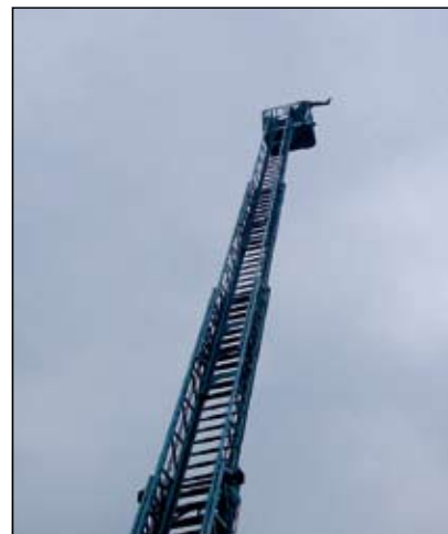
IJzingwekkend hoog met z'n drieën in het bakje.

Natuurlijk werd er een bezoek gebracht aan Amsterdam want dat mag je als buitenlander niet missen. De rondvaart met alles wat je daarbij