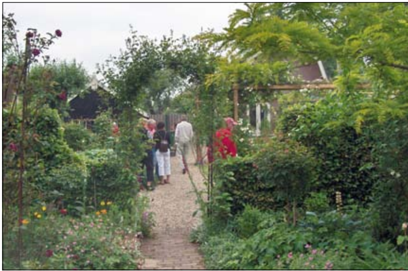
Publiek liep af en aan en consulteerde regelmatig de eigenaren van deze prachtige liefhebberstuin.

te kunnen nemen. Opnieuw wordt het gesprek onderbroken, door een enthousiaste bezoeker, die over een plant een vraag wil stellen. Zonder lang na te hoeven denken wordt het antwoord over soort en groeiwijze beantwoord en feilloos wordt de plek, waar deze in de tuin staat aangewezen. Het echtpaar de Rooij mag dan de tel kwijt zijn geraakt, de passie is er niet minder door geworden. Paul de Rooij: 'Aanvankelijk was de drijfveer de passie van mijn vrouw, maar gaandeweg is ook daarbij de vonk overgeslagen. Ik krijg er steeds meer kijk op, begin ook namen te leren en ervaar het als een heerlijke ontspanning door er niet alleen in te recreëren, maar ook in te werken. En het is toch leuk, als je gelet op het enthousiasme van de bezoekers, constateert, dat het wel aardig is geworden'.