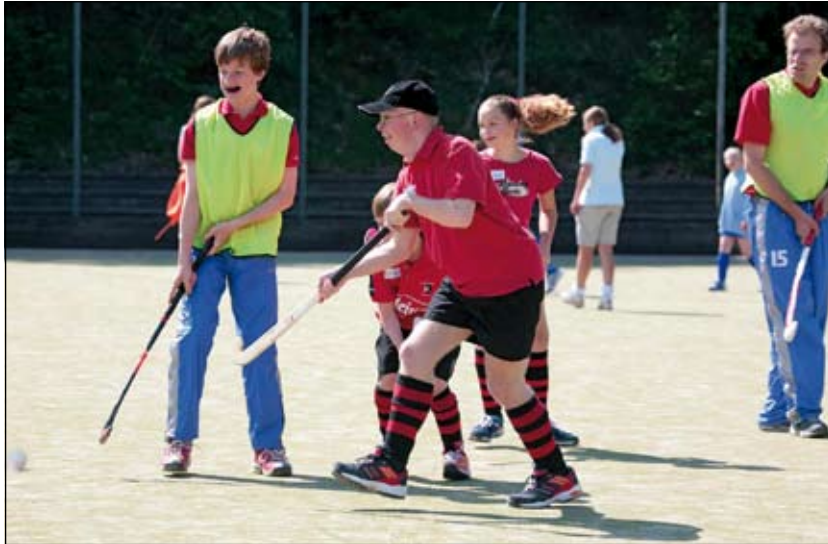
Het midzomerfeest op zaterdag 21 juni is een eerste aanzet om een G-hockeyteam te vormen.

Ook als deelname aan het sportief programma niet tot de mogelijkheden behoort, is er voldoende te genieten voor de inwoners van gemeente De Bilt met een verstandelijke beperking. Net als twee jaar geleden heeft de Koninklijke Biltse Harmonie (KBH) haar medewerking toegezegd. De KBH zal de gasten vanaf drie uur 's middags op een muzikale manier ontvangen en begeleiden naar de terreinen van SCHC. Na het sportieve programma zal de Brandweerharmonie een grootse show geven en na een