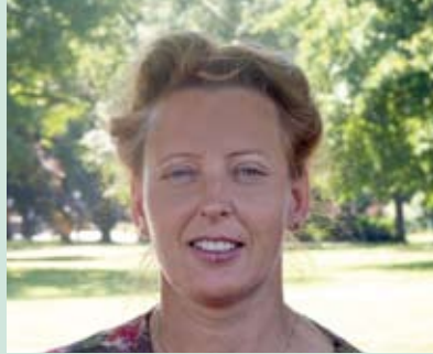
Wijkcontactambtenaar van de wijk Weltevreden en voor Maartensdijk is ook per e-mail te bereiken ( vosa@debilt.nl ).