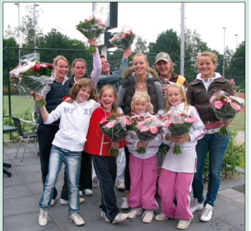
Afgelopen weekend waren de laatste wedstrijden in de tenniscompetitie bij tennisvereniging Tautenburg. Vier competitieteams zijn er in geslaagd om kampioen te worden. Twee kampioensteams bij de jeugd gaan de komende weken nog strijden voor het districtskampioenschap. Op de foto een deel van de kampioenen. Meer informatie op www.tautenburg.nl .