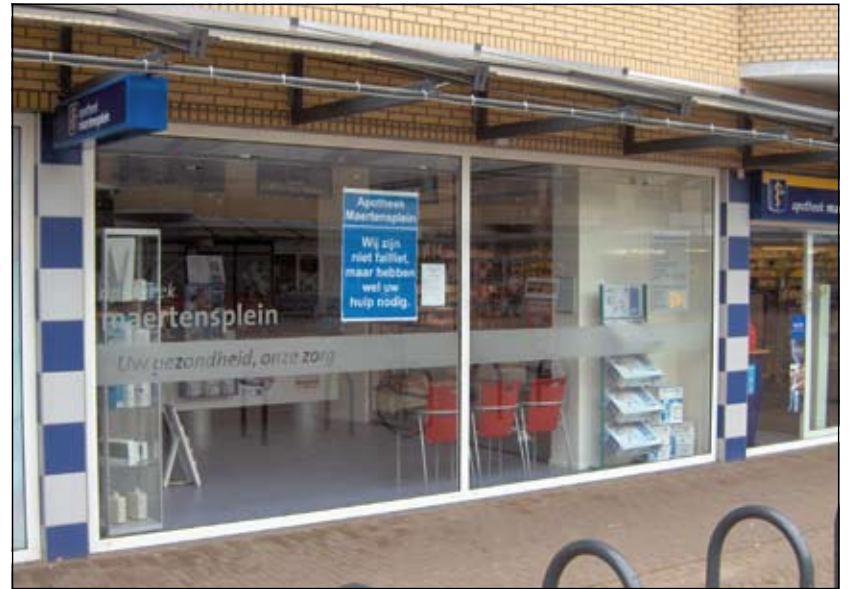
Via een groot raambiljet worden klanten de Apotheek op het Maertensplein geïnformeerd.