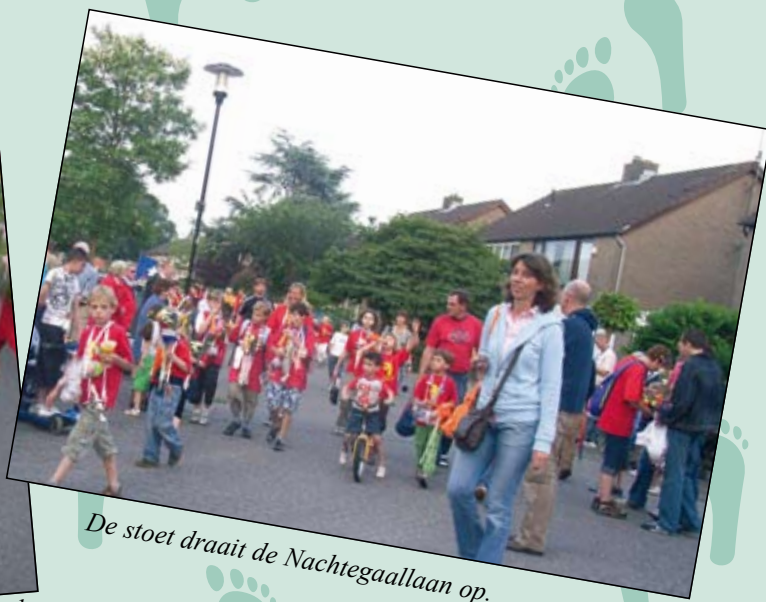
De stoet draait de Nachtegaallaan op.