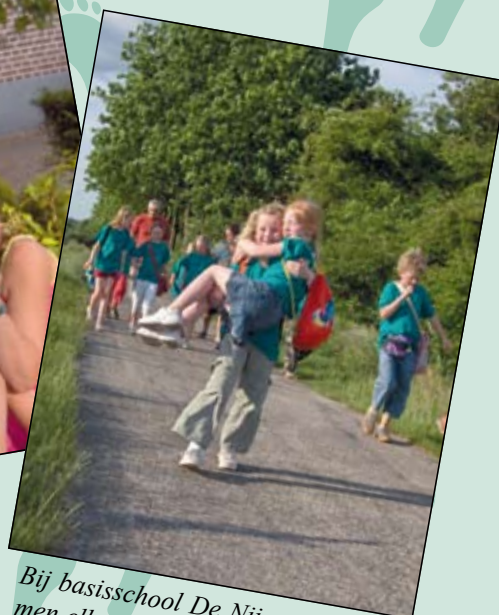
Bij basisschool De Nijepoort draagt men elkaar op handen.