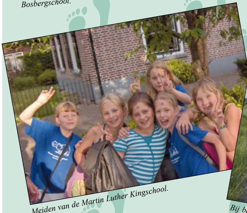
Meiden van de Martin Luther Kingschool.