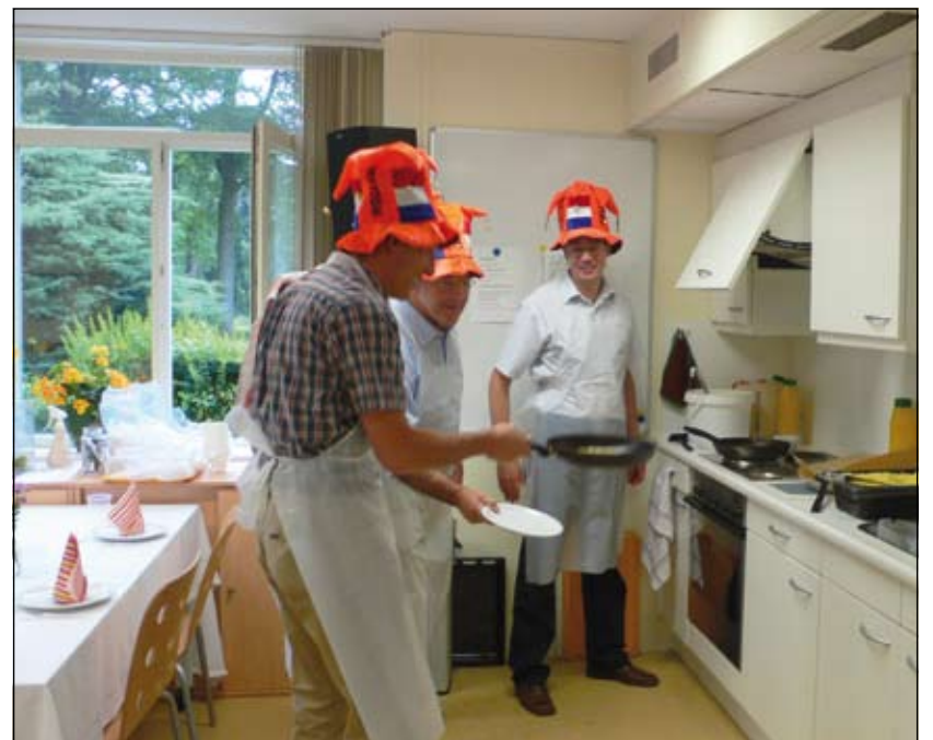
Net als de bewoners genoten ook de pannenkoekenbakkers.

Op 29 mei jl. hebben 9 Biltse ondernemers voor 35 bewoners van Altrecht pannenkoeken gebakken in huis De Windehof in Bilthoven. Dit 'pannenkoekenfeest' is een match, die gemaakt is tijdens de tweede editie van de Beursvloer De Bilt vorig jaar oktober.