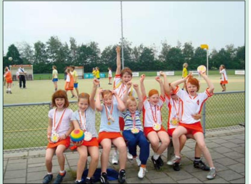
Ook de E4 van Korfbalvereniging Tweemaal Zes werd onlangs kampioen en wilde dat best even laten zien.