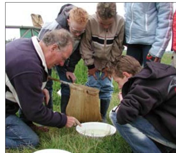
Er valt aanstaande zondag van alles uit de sloot te vissen.

Natuurgidsen van het IVN afdeling Eemland staan op zondag 8 juni om 14.00 klaar voor een héél bijzondere activiteit. Het gaat dit keer om een activiteit, gericht op kinderen: wat leeft er zoal in de sloten? Onder begeleiding van ervaren IVN-gidsen wordt er gevist naar slakjes, bootsmannetjes, schrijvertjes, waterspringstaarten en wat nog meer te vinden valt. Daarbij zijn moeders, vaders, opa's en oma's van harte uitgenodigd! Zijn de groene kikkers weer paraat? Elke keer weer zijn er bijzondere ontdekkingen! Er wordt gevist in het poldergebied van de gemeente Soest, aan de A.P. Hilhorstweg, hoek Spiekerweg. Er is voldoende parkeerruimte aanwezig. Het is een gratis activiteit en aanmelden vooraf is niet nodig. Duur ca. 1 1/2 uur. De nadruk van de aandacht ligt natuurlijk bij de kinderen: de natuurbeleving zal voor hen prachtig zijn. Voor jonge kinderen wordt begeleiding vanuit de ouders of andere familie gewaardeerd. Het spreekt vanzelf dat de kleding méér dan een beetje vies mag worden!