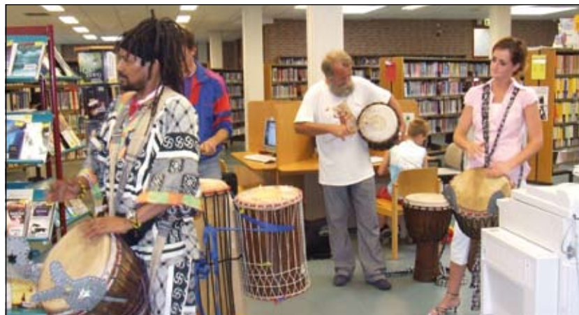
Een groep muziekschoolleerlingen zorgt voor de muzikale omlijsting.