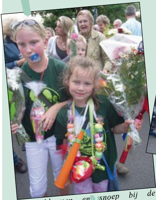
Ook bloemen en snoep bij de Bosbergschool.