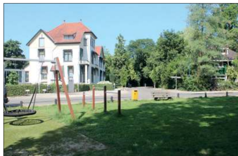
Anno zomer 2013 is de buitenzijde van de bebouwing vrijwel onaangestast gebleven. In de ervoor gelegen kindvriendelijke speeltuin is einde 2012 zelfs kunstgras aangebracht: de ideale ondergrond om 's zomers en 's winters van de schommels en ander speelgoed gebruik te maken.

De panelen 8 en 7 sieren de Emmalaan. Met name de oude foto op paneel 7 van De Biltse Grift zou zo maar gisteren genomen kun-