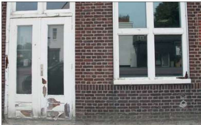
Voordat het pand kan worden ingericht, moet er nog veel achterstallig onderhoud worden verholpen. We kunnen er dus vanuit gaan dat het nog enkele maanden gaat duren voordat het Grand Café op de hoek van de Julianalaan en de Melchiorlaan in Bilthoven opengaat.