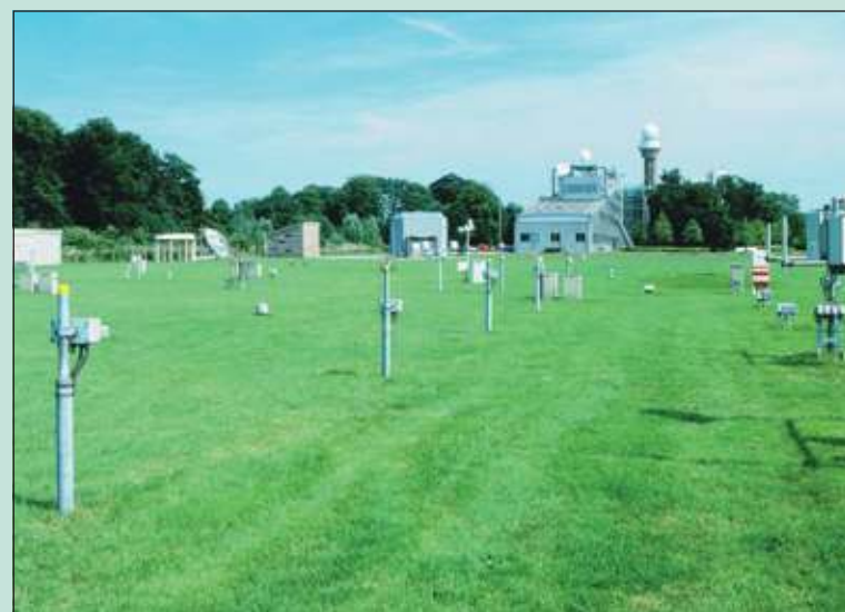
Het waarneemveld op het KNMI terrein.