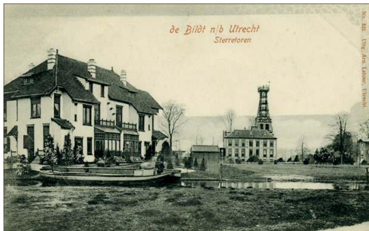
Op deze foto uit 1900 links de achterkant van een dubbele villa en op de voorgrond de Biltse Grift. Op het vooruitspringende hogere deel staat Aprica, toen in gebruik bij het KNMI.

Utrechtseweg komt. Langs de Wilhelminalaan zijn grote villa's te vinden, maar ook kleinere woningen. Vanaf bord A is het volgende bord langs de Wilhelminalaan paneel 4: ter hoogte van de markante in de zichtlijn van de Oude Bunnikseweg gelegen villa Kloosterend uit 1922