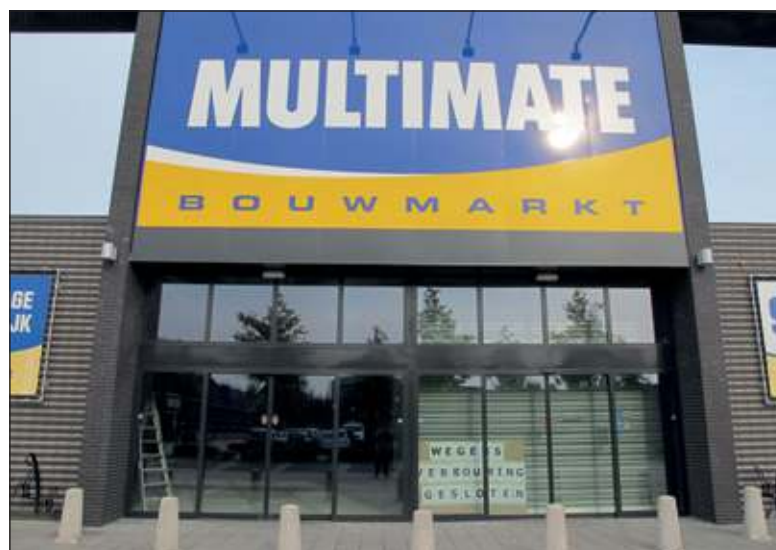
'Wegens verbouwing gesloten', staat op het raam te lezen. Wie naar binnen tuurt, ziet dat er een scheidingswand wordt aangebracht en dat er binnen een aparte entree komt, van buitenaf gezien aan de rechterkant.

winkels. Ketens als Etos, Zeeman, Shoeby en enkele supermarkten die geen Hoogvliet zijn, huren winkels van Hoogvliet Beheer. Ook behoren 200 woningen, zowel appartementen als woonhuizen, tot het vastgoedbezit van het concern. Verder is Hoogvliet Beheer verantwoordelijk voor de verwerving van nieuwe vestigingspunten voor Hoogvliet supermarkten. De ambities zijn hoog: het is de bedoeling dat in 2020 de honderdste Hoogvliet supermarkt wordt geopend. Het verbeteren van de marktpositie van Hoogvliet gebeurt ook