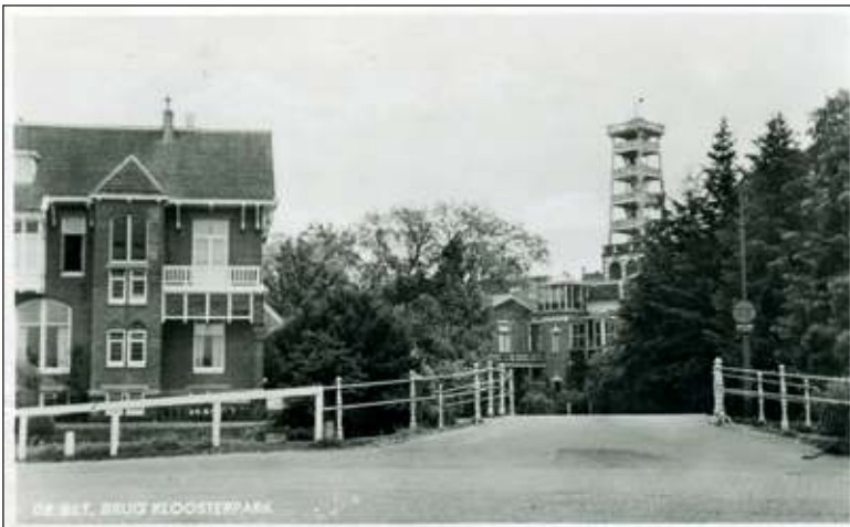
De oude ingang van de Wilhelminalaan aan de Utrechtseweg in 1955.

In deze jachtige tijd verlang je soms terug naar die oersaai maar rustgevende dingen van vroeger. Het tv-programma 'Ontdek je plekje' bijvoorbeeld: 10 minuten rust begeleid door idyllische beelden van een stad of dorpje in Nederland. In mijn herinnering begon het stevast met een houten paneeltje waarop de tekst "Ontdek je plek" was geschreven, begeleid door prachtige muziek. Daarna een rustgevende stem: Altijd in termen van het water, de eindeloze lichten en 'de tijd van vroeger'; hier en daar indrukwekkende stiltes midden tussen de zinnen. De serie begon in 1972 en liep door tot maart 1993. Daardoor geïnspireerd willen wij in dit jubileumjaar de zes kernen van de gemeente De Bilt herontdekken; Lekker weg in eigen kern (3).