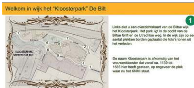
Het overzichtsbord genummerd 1.

Op wel drie ingangen staat het bord, genummerd 1: (A) Langs de Oude Bunnikseweg, komend vanaf de Universiteitsweg (A), bij de fietseronderdoorgang met de Biltse Grift (hoek Emmalaan) en daar, waar de Wilhelminalaan weer op de