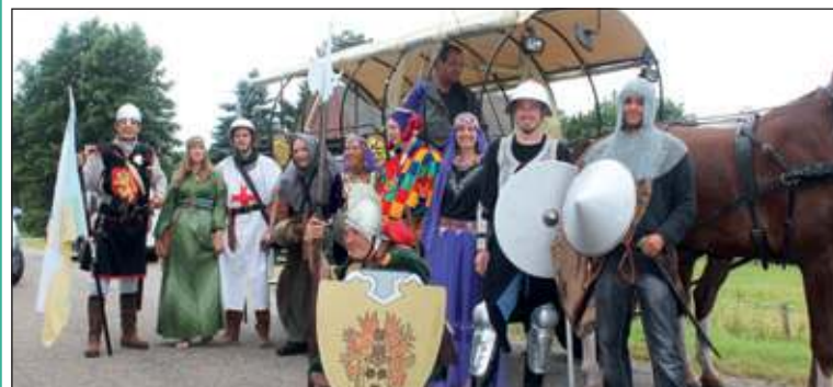
De stoet vertrok vanaf de Nieuwe Weteringsweg.