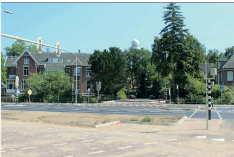
Donderdag 18 juli werd het nieuwe kruispunt van de Utrechtseweg (N237) met de Bilthovenseweg en de Wilhelminalaan in De Bilt in gebruik genomen. De oude toegang tot het Kloosterpark en het KNMI via de Oude Bunnikseweg en de Universiteitsweg (N412) gaat vervallen. De woonwijk, Kloosterpark, is alleen maar vanaf de N237 te bereiken. Nieuw zijn bijvoorbeeld ook de veilige oversteekmogelijkheden voor voetgangers en fietsers.

boeren hun overschotten konden verkopen en goederen, die niet voor handen waren in De Bilt, konden aanschaffen. Handkarren, hondenkarren en in een enkel geval paard-en-wagen waren de voornaamste transportmiddelen om goederen te vervoeren. Door het graven van de Biltse Grift was het mogelijk geworden om grotere vrachten over water te vervoeren.