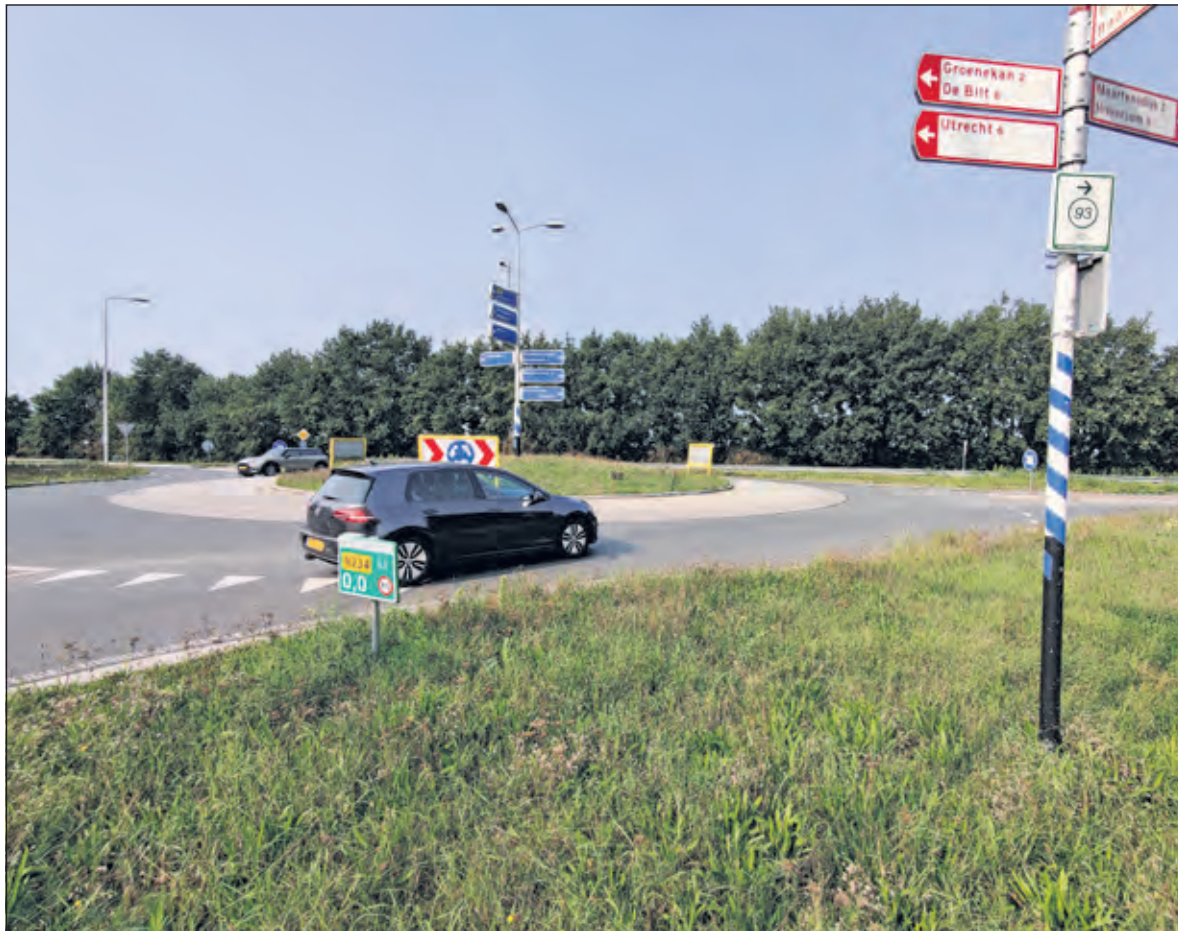
Fase 1 betreft het weggedeelte dat loopt vanaf de rotonde met de Provincialeweg (234) langs de rotonde bij de Achter Wetering tot aan de 'schoolfoto-rotonde' bij de Maartensdijkse Dorpsweg.

de agenda. Daarnaast moet er rekening worden gehouden met veel verschillende wensen en belangen van bewoners, bedrijven en weggebruikers.