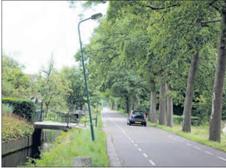
Lantaarnpalen langs de dokter Welfferweg zakken scheef.

Dit bericht in het NOS-journaal van woensdag 2 september spreekt van een verontrustende situatie. Het is niet het eerste afgegeven signaal, want al jaren komen dergelijke adviezen - door tal van instanties en (advies-)organen afgegeven - in de publiciteit. Het bericht vervolgt: De bodemdaling heeft nadelige effecten op de kwaliteit van de natuur en het water, stelt de RLI. Ook stoot drooggelegd veen relatief veel CO 2 uit en kost de schade door de bodemverzakkingen handenvol geld. Volgens de raad is een omslag nodig in het waterbeheer van veenweidegebieden en moet de Rijksoverheid zich daar actief mee bemoeien.