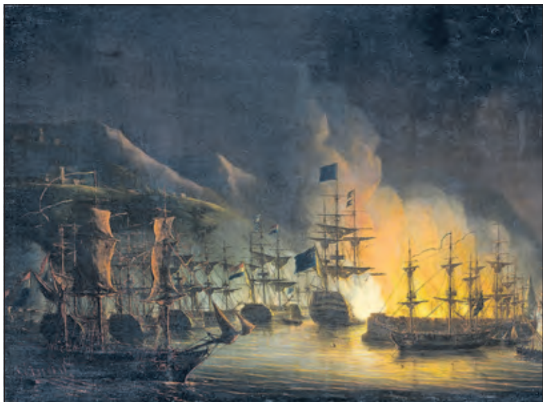
'Schilderij van het bombardement van Algiers, ter bevrijding van christenslaven (1816)' (Martinus Schouman, Rijksmuseum Amsterdam).

Er is voor 'elck wat wils' in het boek te vinden om over na te denken. Zo