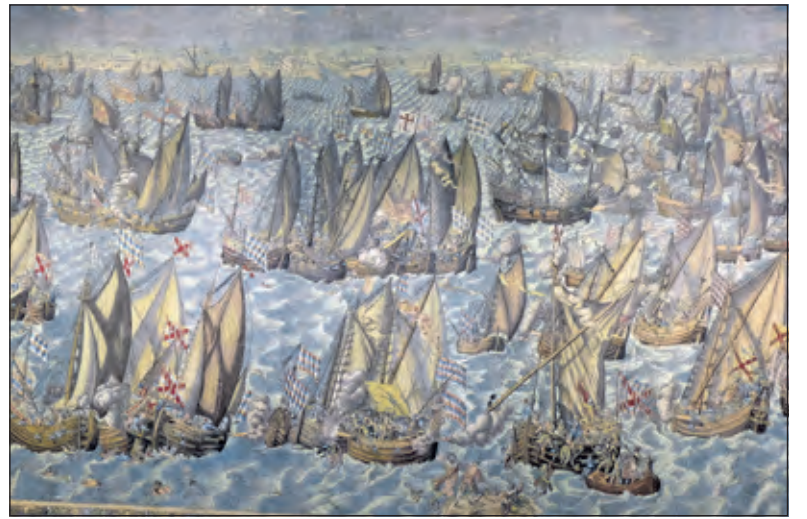
Een tapijt ('Een zestiende-eeuws gobelin') in het Zeeuws Museum met weergave van de strijd tussen Geuzen en Spanjaarden bij Reimerswaal.

met vele hoogte- en dieptepunten, waar je deel van uitmaakt en wat zoals de Slag in de Javazee en de ondergang van Karel Doorman. De Canon van de Marine is echter