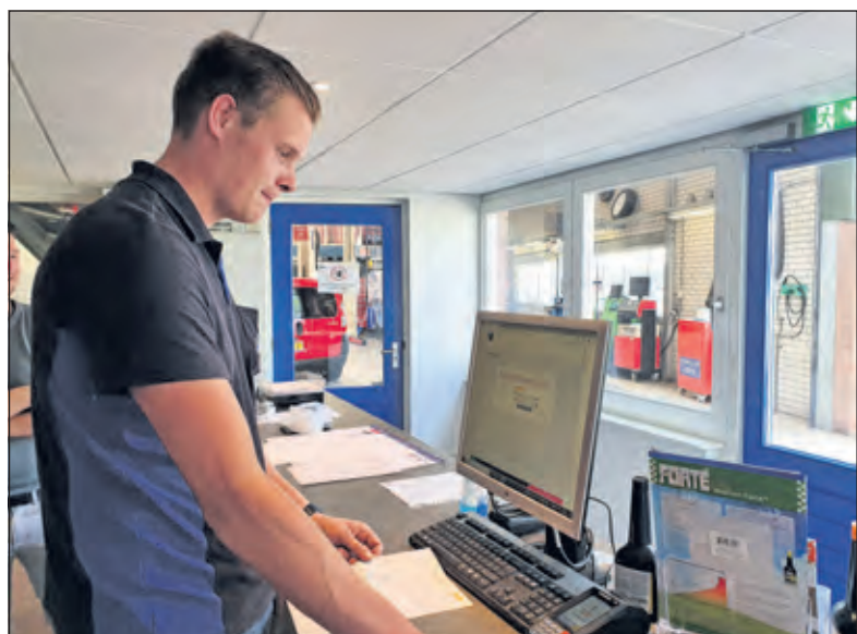
Van iedere klant wordt het kenteken ingevoerd.