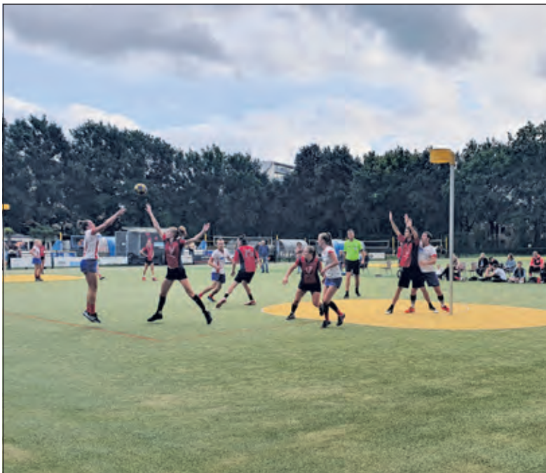
Nova wint van Synergo na een spannende slotfase.

'Vandaag gaan we punten pakken'. Dat was het gevoel dat bij Nova leefde. Na het verlies bij Viko was iedereen vastberaden om nu te winnen. De tegenstander Synergo is een bekende van Nova, dus Nova wist waar de kansen en risico's lagen.