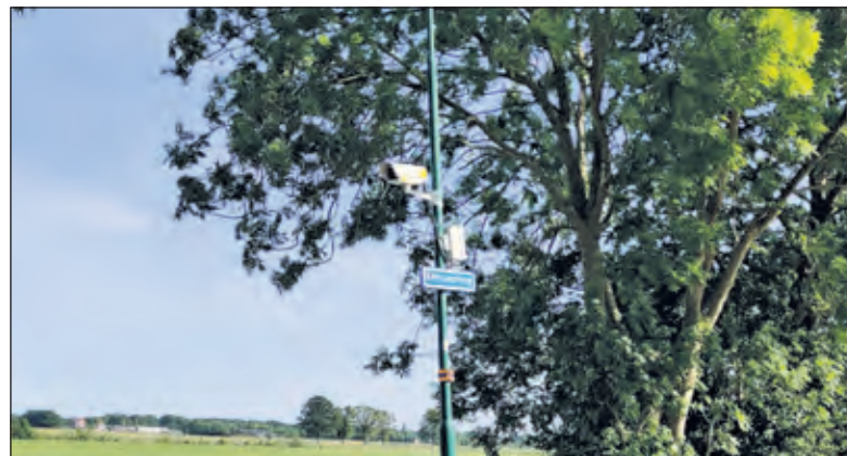
Het doorrijverbod op de Korssesteeg tijdens de spitsuren is aangegeven met borden en wordt gemonitord met camera's.