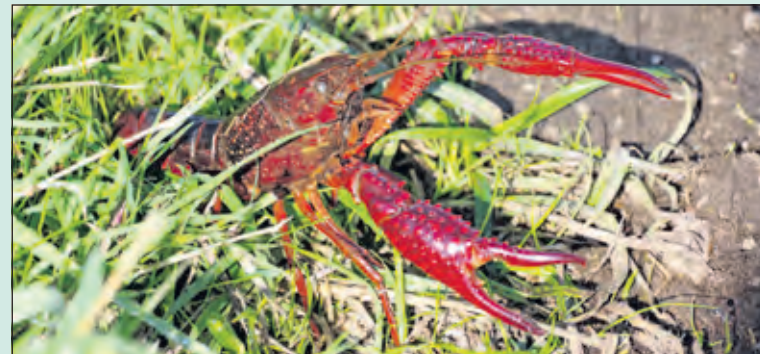
De rode rivierkreeft.