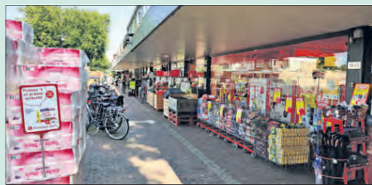
Op correcte wijze coronaproef passeren is moeilijk op de Hessenweg.

Samen met de winkeliers treft de gemeente De Bilt een aantal maatregelen om het winkelend publiek op het trottoir langs de Hessenweg meer ruimte te geven. Dat is nodig omdat het op sommige plaatsen en momenten niet mogelijk is om elkaar veilig op anderhalve meter afstand te passeren. Winkeliers en gemeente brengen samen de knelpunten en mogelijke oplossingen in beeld en ook aanwonenden kunnen een steentje bijdragen.