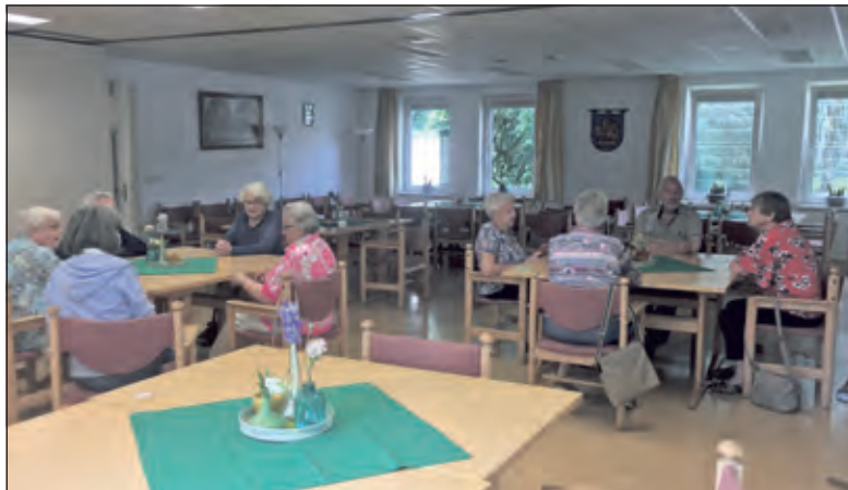
Zonnebloemgasten zijn blij weer eens bij te kunnen praten.

Net als vele anderen hebben ook gasten van de Zonnebloem de afgelopen maanden als onwerkelijk en enigszins eenzaam ervaren; geen activiteiten, geen bezoek, geen ontmoetingen. De Zonnebloem heeft de mensen nog wel een keer verrast met een advocaatje, een vergeetmij-nietje en een zonnebloem, maar dat was op dat moment de enige mogelijkheid om te laten zien dat ze niet vergeten werden.