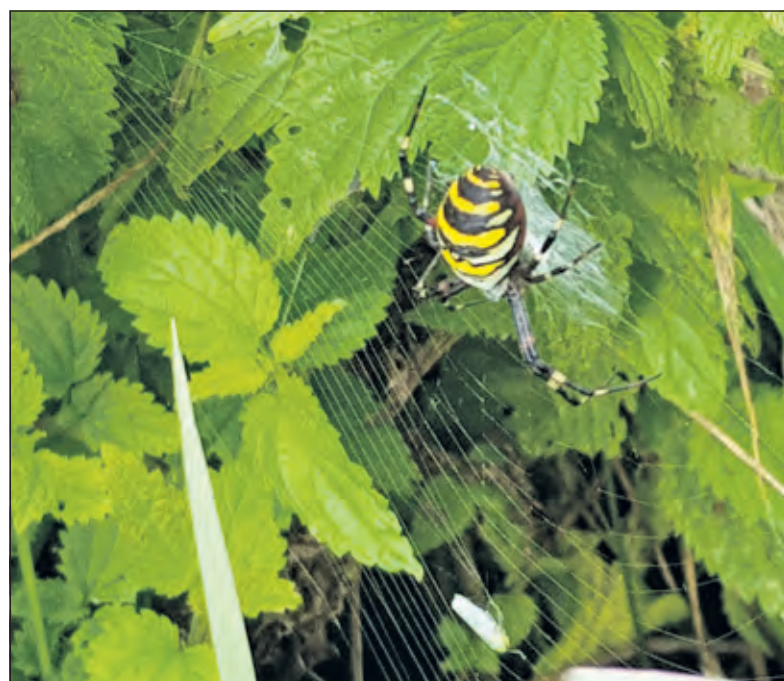
De wespenspin, wespenspin of tijgerspin met de wetenschappelijke naam Argiope bruennichii .