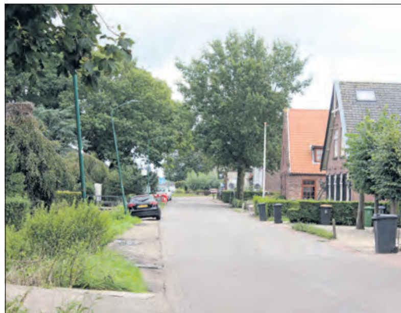
Lappendeken van lengtescheuren langs de Kerkdijk en ook daar scheefstaande lantaarnpalen.

Het rapport 'Stop bodemdaling in Veenweidegebieden' is raadpleegbaar op www.rli.nl/publicaties/2020 [HvdB].