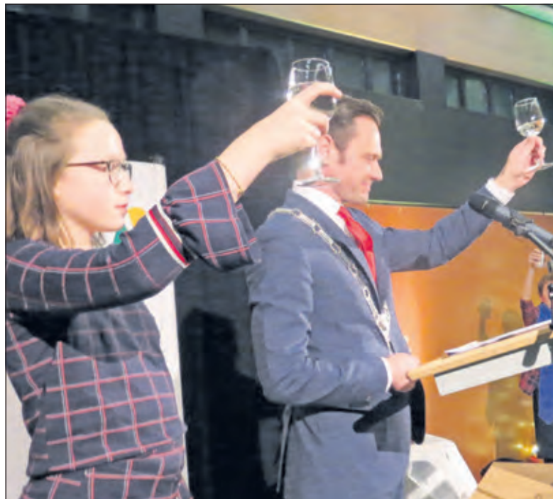
De kinderburchemeester vergezelt vaak de burgemeester bij officiële gelegenheden