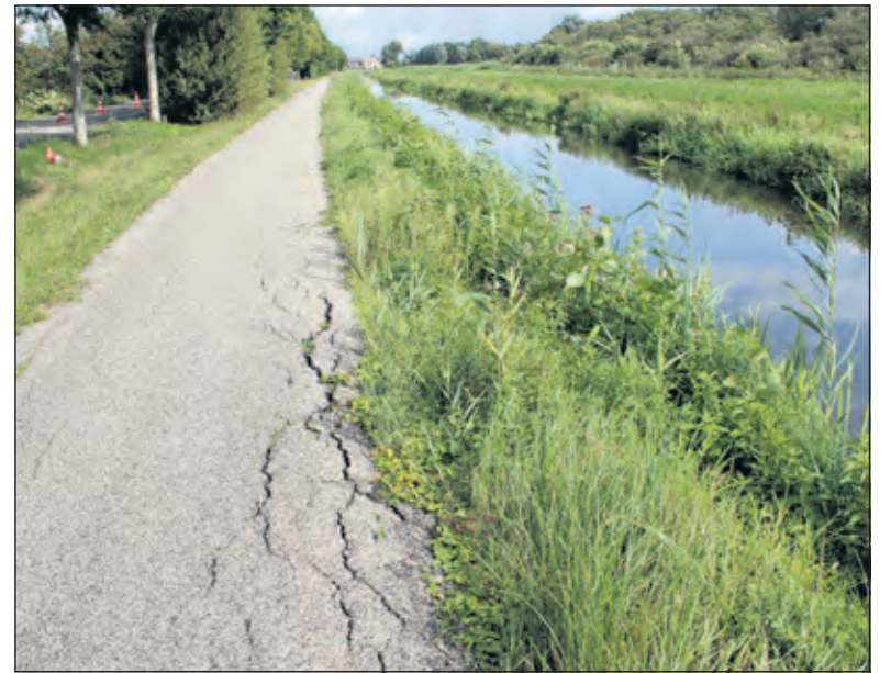
Ook het niet eens zo oude fietspad naast de Maarsseveense Vaart vertoont alweer verzakkingsscheuren.

'Toen het maaiveld daalde tot beneden het gemiddelde peil van de rivier moest kostbare bemaling worden ingezet. Inmiddels was in het verlengde, hogerop in het nog onontgonnen veen, een nieuw blok akkers ontwaterd. Totdat bij de Hollandse Rading letterlijk de grens werd bereikt van het territorium van de bisschop. Bij de Utrechtse Heuvelrug, waar het onderliggende zand boven NAP lag verdween door de steeds diepere ontwatering al het bovenliggende veen. Ook in de hogere delen van De Bilt eindigde de veenbodemdaling op de zandondergrond. En waar, dicht bij de Vecht het veen tot diep in de ondergrond aanwezig was ontstonden laaggelegen veenpolders, met maaiveld beneden NAP. Uiteindelijk werd veel van het diepe veen tot op de zandondergrond weggebaggerd, voor de productie van turf. Daardoor ontstonden diepe veenplassen. Alleen de Bethunepolder werd daarna drooggemalen. Daardoor ligt het maaiveld er nu tot enkele meters lager dan in de omringende veenpolders. Als afvoerputje van het vanuit de zandondergrond en de omgeving toestromende kwelwater'.