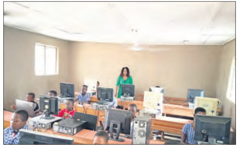
ICT-klas gerealiseerd in Ghanese Corsa school.