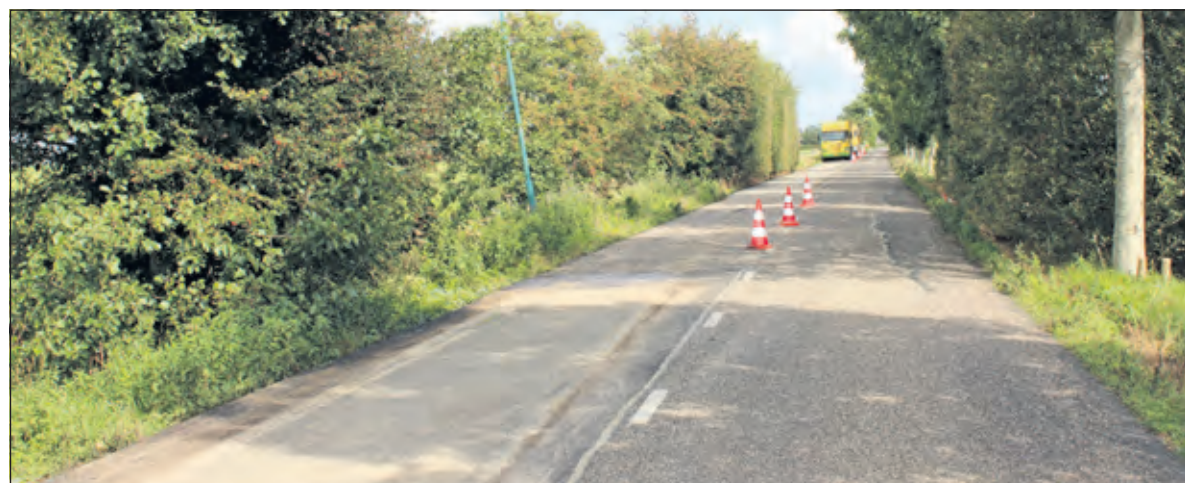
Scheurende en wegzakkende wegedeelten langs de Maarsseveensevaart naast de diepe Bethunepolder worden stuk voor stuk gerepareerd en geasfalteerd en ook daar scheefstaande lantaarnpalen.

Baas gaat in zijn uitleg terug naar de laatste ijstijd; wij volgen hem met grote stappen: 'Uiteindelijk raakte het grootste deel van Nederland met hoogveen bedekt, behalve delen van de Veluwe en Limburg. Behalve de Oostelijke Vechtstreek, waar het zandlandschap beneden NAP lag, werd ook de boven NAP