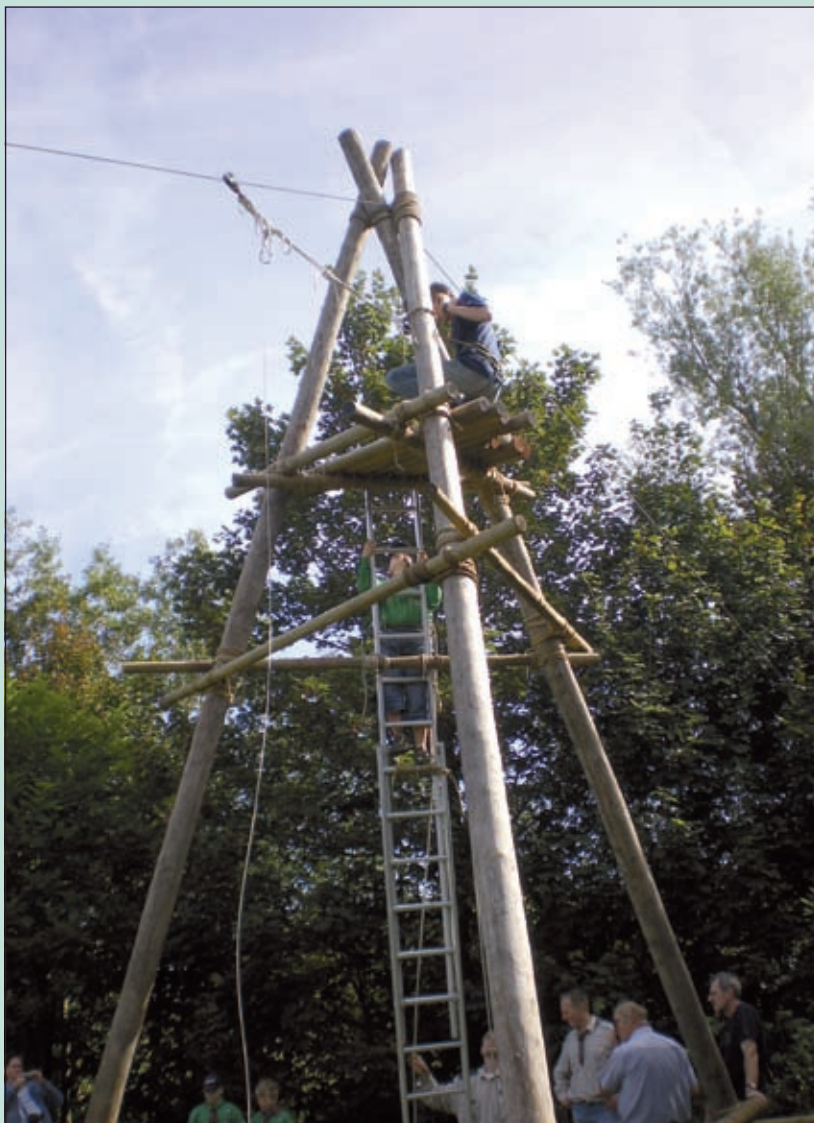
Er wordt gepionierd: bouwwerken maken van touw en hout.

De scout-mee-day is niet alleen voor kinderen die zelf graag op scouting willen. Ook kinderen en volwassenen die gewoon zin hebben in een gezellige middag zijn zaterdag 13 september vanaf 12.30 uur van harte welkom. Het clubhuis staat