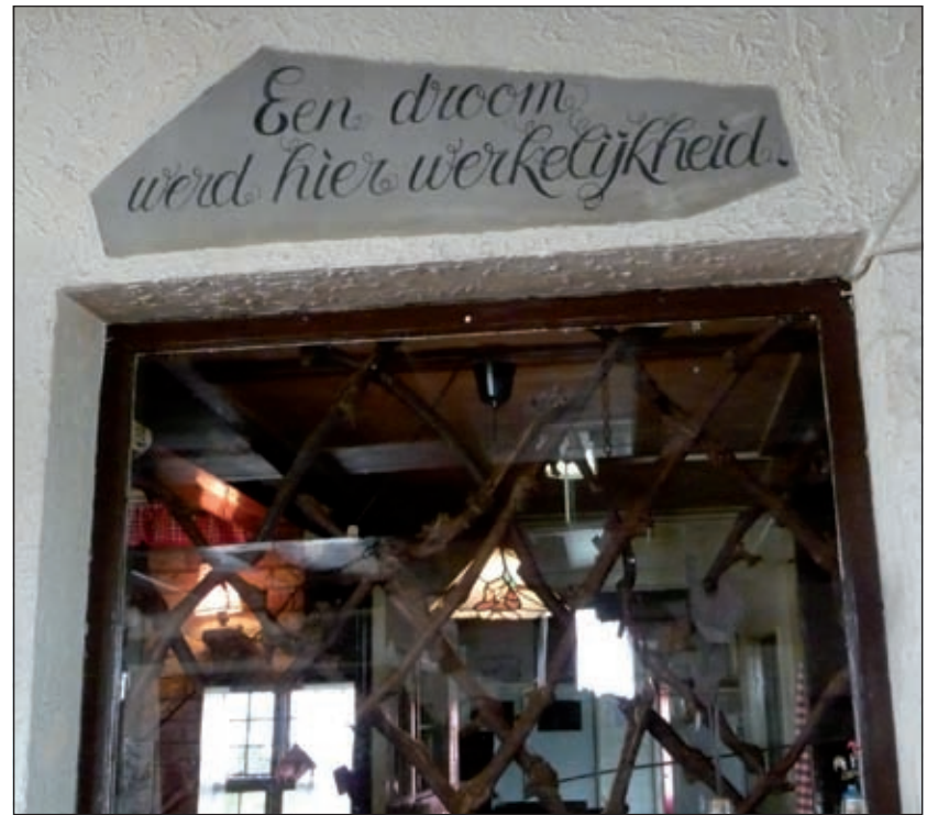
Joop en z'n vrouw gaan in Maastricht verder dromen.

lid, over muziek bij films. Welke muziek maakt de film sterker en wat past niet zo goed? De eigen producties van de leden komen op 21 oktober, 18 november en 16 december aan de orde. De avonden worden gehouden in het SWO-centrum, Jasmijnstraat 6 in De Bilt en beginnen om 20.00 uur. Gasten zijn altijd welkom, maar zeker bij de openbare les. Verdere informatie over deze vereniging voor videoamateurs is te vinden op www.filmgroepcentrum.nl .