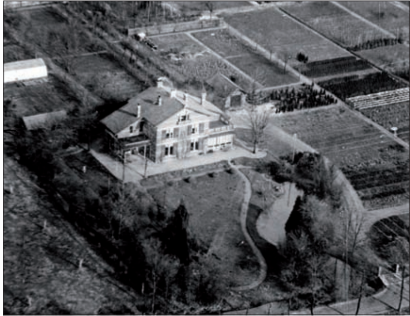
In 19 liet boomkweker en tuinarchitect Hendrik Copijn dit dubbellandhuis bouwen. Op deze luchtfoto uit 190 zijn de landschappelijke tuin met gazon, een serpentinevijver en een slingerend pad goed te onderscheiden.

dag voor het publiek opengesteld. De toren kan worden beklommen, onder begeleiding en in groepen van beperkte omvang.