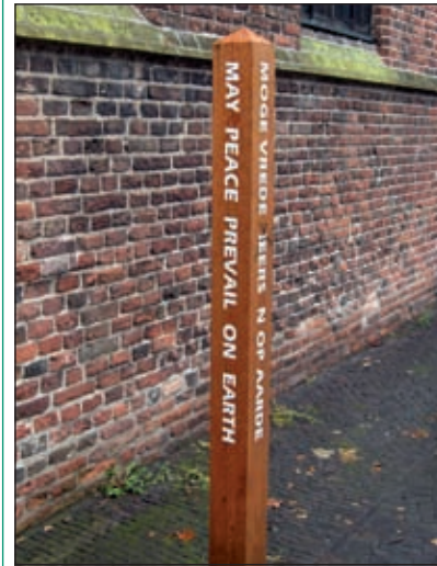
De Vredespaal bij de Geertekerk

Enige tijd terug op een zaterdag liep ik ambtshalve om de Geertekerk te Utrecht. Binnenkort, op donderdag 25 september a.s., worden daar voor mantelzorgers, hun familie en bekenden in deze regio twee gratis theatervoorstellingen over dementie gegeven en om de lezers van De Vierklank 'op weg' te helpen, dacht ik, na overleg met de organisatie en SWO-deskundige Willemien Hak, dat een foto van die Remonstrantse kerk bij dat bericht daarover wel zou kunnen bijdragen. Nu vind ik (oude) kerken kijken helemaal geen straf. Vaak zijn ze onderwerp van prachtige verhalen uit nog prachtiger boeken, maar bijna altijd maken ze deel uit van oude stadskernen, die het bezien alleen al meer dan waard zijn. Voorbeelden zijn de Grote Kerk in Maassluis, De Noorderkerk in Amsterdam en de Geertekerk in Utrecht.