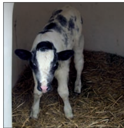
Een kalfje van nog geen dag oud kijkt verbaasd toe.

de behandeling van bestemmingsplannen. 'Je hebt als raadslid wel invloed, maar we zijn oppositiepartij. Oppositie voeren ligt mij wat minder. Ik ben toch bestuurder en dan wil je altijd meedenken. Maar je hebt wat invloed, zonder meer. Het CDA is natuurlijk geen echte oppositiepartij en de fractie heeft zich die rol de eerste jaren moeten aanleren. We hadden daar geen van allen ervaring in. In mijn statenperiode was het CDA collegepartij en dat is toch anders.' Hij merkt ook wel dat de politiek smalle marges heeft. 'Als je in de politiek iets wilt veranderen, gaat het nooit met een haakse bocht. Maar de politiek beslist wel uiteindelijk. Ik zeg altijd probeer er bij te zijn, want dan heb je wat invloed. We hebben samen met ChristenUnie en SGP het belang van de kleine kernen aan de orde gesteld en voor elkaar gekregen dat in Westbroek misschien wat woningen komen.'