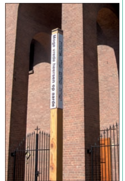
Vanaf 1 januari 2006 staat deze paal bij de ingang van de St. Michaelkerk in onze gemeente De Bilt.