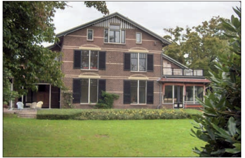
De Boschhoeve (Groenekanseweg 119) is een rijksmonument. Het huis wordt tijdens Open Monumentendag 2008 voor het eerst publiek opengesteld.

Het grote landhuis is gebouwd in eclectische stijl met veel neo-renaissance details. Vooraan bij de weg staat een loofprieel, een zogenaamde beukenkoepel. Het huis, een rijksmonument, wordt tijdens Open