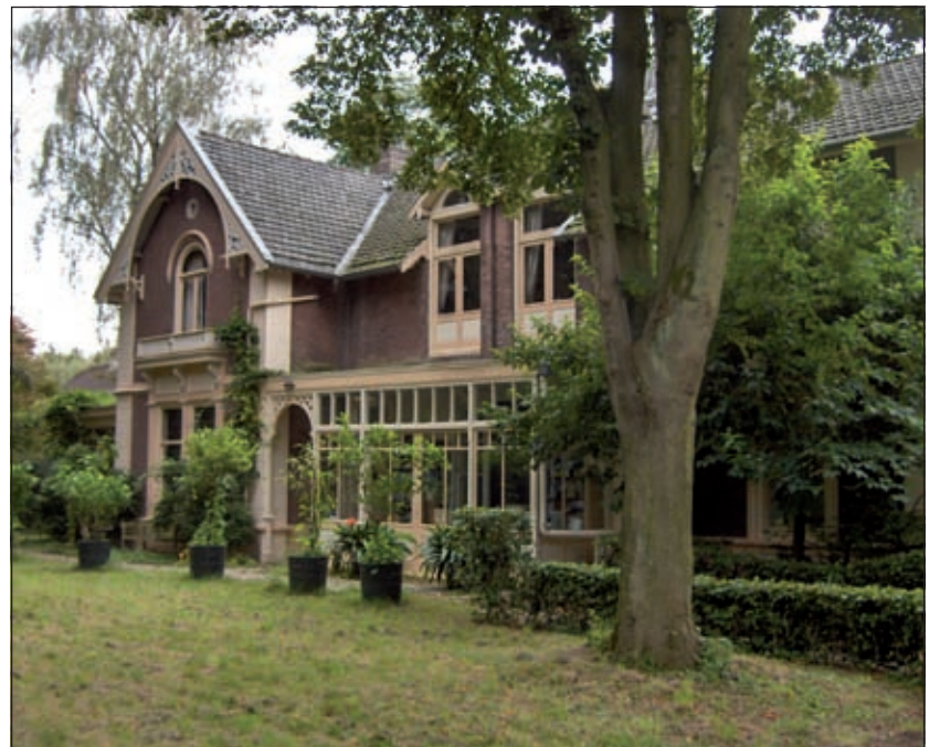
Boomkweker Copijn liet omstreeks 1881 villa Welgelegen bouwen.