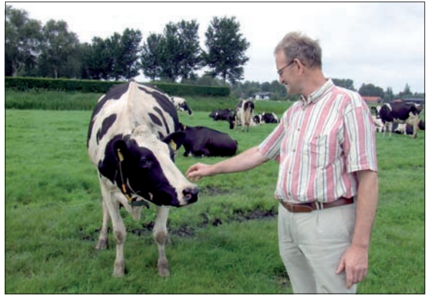
Zij wil wel eens weten wat er aan de hand is, haar collega's grazen rustig door.

De CDA-fractie wil de komende tijd wat meer aan de weg gaan timmeren en met de bewoners in gesprek gaan. Van den Broek vindt het wel eens moeilijk om achter de mening van de bevolking te komen. 'Zo'n vijftien procent zet vaak de toon. Een klein percentage bepaalt het dus voor de rest.' Hij merkt verder dat bij de gemeente veel zaken wat ad hoc verlopen. 'Als ondernemer ben je ook met een bepaald doel bezig. Daar maak je dan een planning voor. We hebben nu 70 melkkoeien en we willen naar 90. Dat betekent dat je nu aan het bouwen van stallen moet gaan denken. Daar zijn we dus mee bezig. Als dit mijn doel is moet ik dat en dat doen. Dat vind ik bij de gemeente dus vaak wat ad hoc.' Westbroekers weten mij ook wel te vinden, maar de Westbroekse bevolking is niet zo ontevreden. Het sluipverkeer is natuurlijk een probleem, maar daar komt nu ook een oplossing voor. Over het algemeen is men in het dorp niet ontevreden over de gemeente. Alles loopt hier redelijk. De korfbalclub kreeg een kunstgrasveld en ook het dorps huis ziet er goed uit en wordt redelijk onderhouden. De samenvoeging met De Bilt leverde hier ook minder problemen op dan in Maartensdijk. Westbroek had de samenvoeging met Maartens-