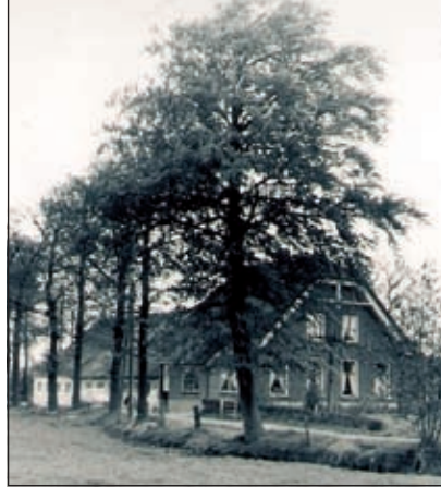
De in 1908 afgebroken Boerderij De Ridderhofstad aan de Prinsenlaan in Maartensdijk.