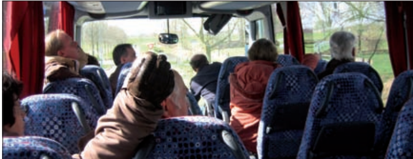
Ook vanuit de bus werden de banen bekeken.