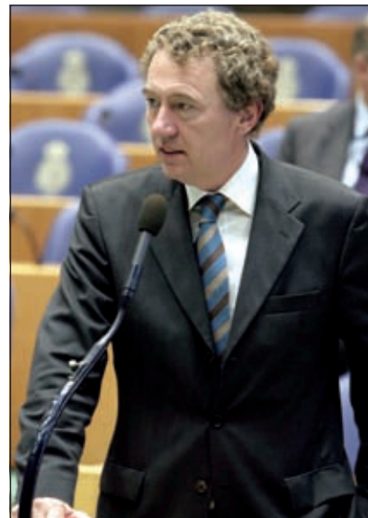
Henk Jan Ormel spreekt op 8 april over de positie van Nederland binnen de EU.

Op uitnodiging van de plaatselijke afdeling van het Christen Democratisch Appel brengt Tweede Kamerlid Henk Jan Ormel op 8 april een bezoek aan de gemeente De Bilt, waarin hij zal spreken over de huidige stand van zaken in Europa en de aanstaande Europese Verkiezingen in juni 2009.