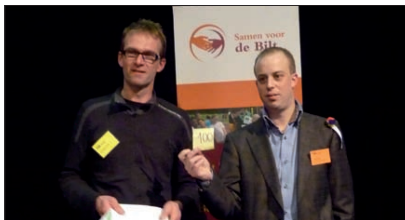
Jongerenorganisatie Animo vond in 2B Mobile een partner om een mobiel netwerk aan te leggen tijdens de jongerenmanifestatie in september op Fort Ruigenhoek.