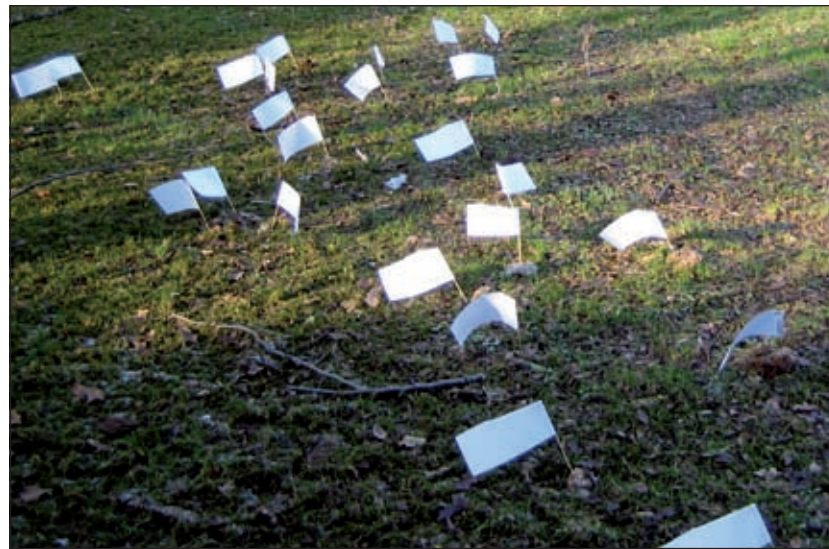
Er zijn voldoende hondenbezitters in Maartensdijk. Wees alert op onraad bij het uitlaten.