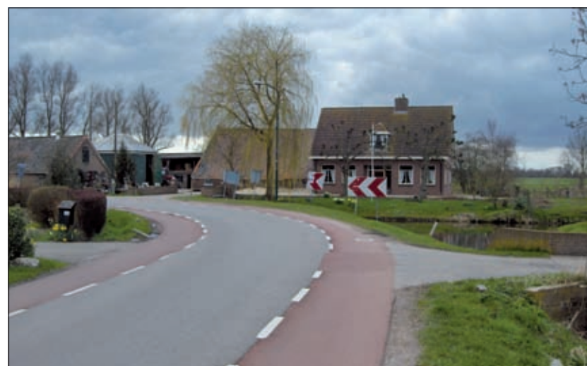
Aan het eind van de Kerkdijk, waar deze overgaat in de Nedereindse Vaartdijk is het bedrijf van Wijnen met vleesvee. Op dit stekje voelt 'Juffrouw Jansen brocante' zich op zijn plek; oude spulletjes in de stal.

8. W. Wijnen, Kerkdijk 176, 3615 BK Westbroek. Vleesveehouderij, ca. 40 vleesstieren, 40 schapen en lammeren. Ook is hier een schuurverkoop van allerlei oude spulletjes uit grootmoeders tijd.