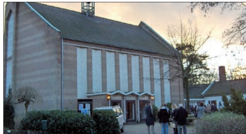
In de Noorderkerk aan de Laurillardlaan te Bilthoven wordt zondag 5 april 2009 de Johannes Passion uitgevoerd.

Kaarten zijn tot vrijdag 3 april in de voorverkoop á € 10,- verkrijgbaar, telefonisch op 030 2205880 of te bestellen via de mail: ck.bilthoven@gmail.com Op 5 april verkrijgbaar in de kerk á € 12,50 vanaf 15.00 uur.