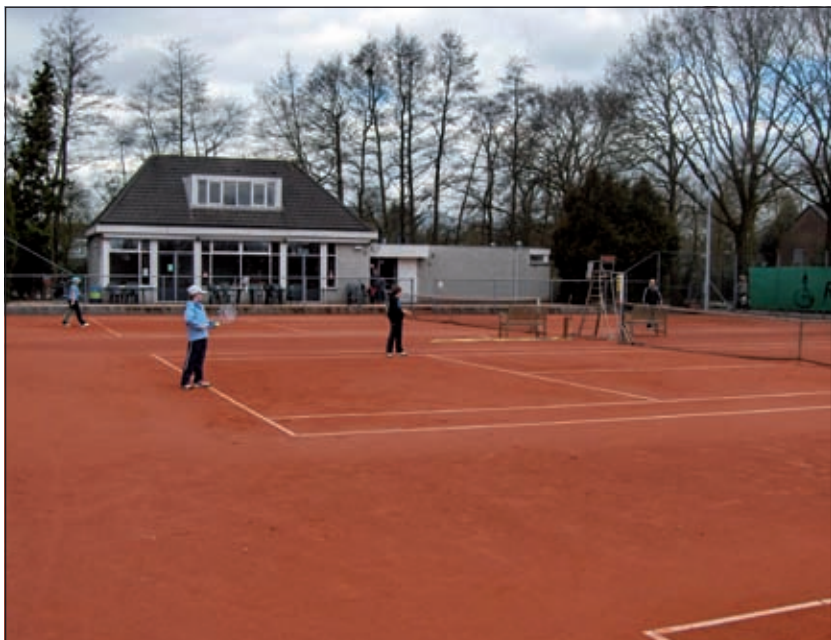
De banen in Hollandsche Rading zijn gravelbanen.

Meer informatie en heel veel fotomateriaal is terug te vinden op de website van de tennisvereniging: www.tvhollandscherading.nl . Nieuwe leden kunnen zich ook via de website aanmelden. TVHR kent geen wachtlijsten, dus kan er dit seizoen nog gespeeld worden.