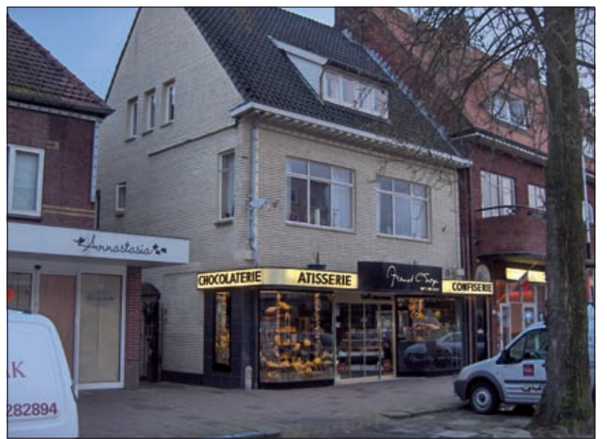
Patisserie Top's Edelgebak aan de Julianalaan 6 in Bilthoven.