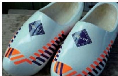
Meer politiecontrole in het buitengebied is wenselijk.

Drie jaar geleden werd de bewoner van een ander pand in de laan bij aankomst thuis buiten overvallen door twee gewapende mannen. Zij namen de auto met inhoud mee. De auto werd vervolgens gebruikt bij een overval elders. Daarna werd in een sloot in Amstelveen de koffer van de eigenaar gevonden. Deze daders zijn later gepakt. Voordat de overval plaatsvond, was er dicht bij de woning een wit busje met daarin twee mannen gezien. Bewoners van de Planetenlaan hebben intussen afspraken gemaakt beter op te letten en elkaar te waarschuwen als er vreemden in de buurt worden waargenomen.