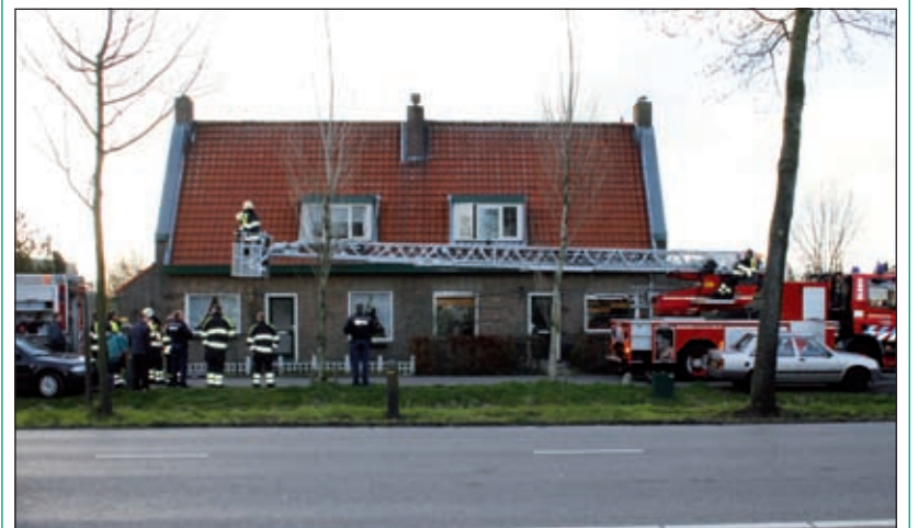
Woensdag 25 maart moest de brandweer uitrukken bij een schoorsteenbrand aan de Koningin Wilhelminaweg in Groenekan.