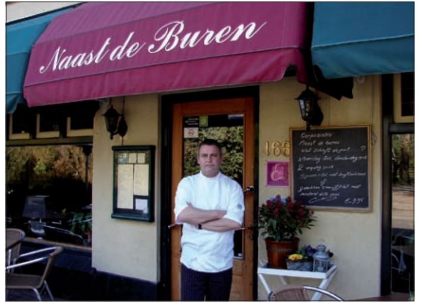
Naast de buren: al jaren een doorslaand succes.