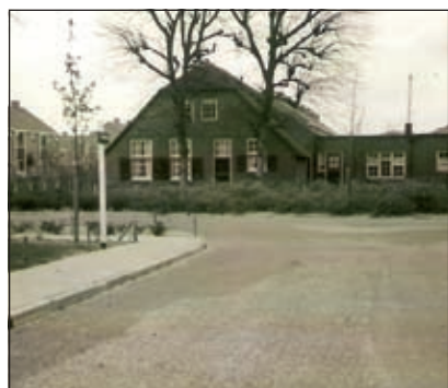
De in 1965 afgebroken Boerderij Bildzigt aan de Groenekanseweg in De Bilt.