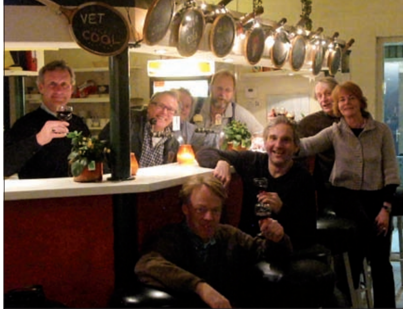
Bestuurs- en commissieleden proosten alvast op het komende jubileumjaar in het gezellig clubhuis.