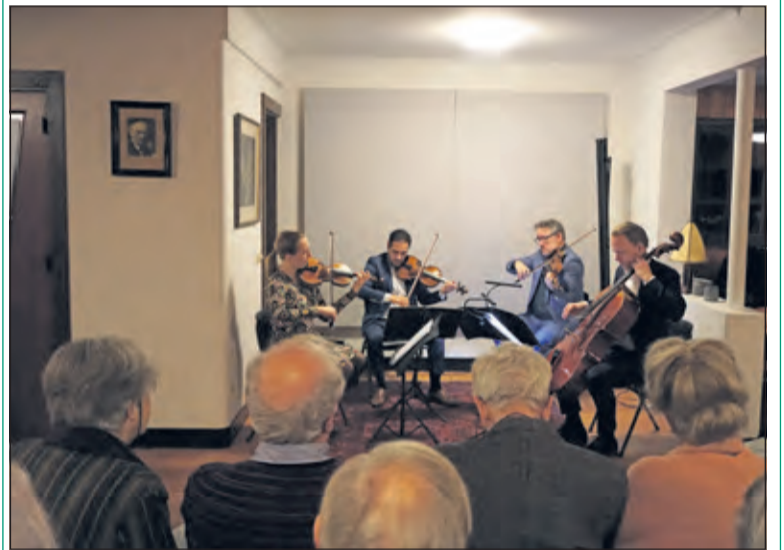
Het publiek geniet van een gave weergave van vooral lastig te bespelen composities.