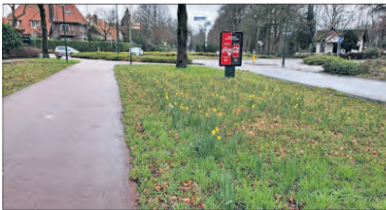
Bloemen langs de weg dienen als stepping-stone voor insecten tussen natuurgebieden.