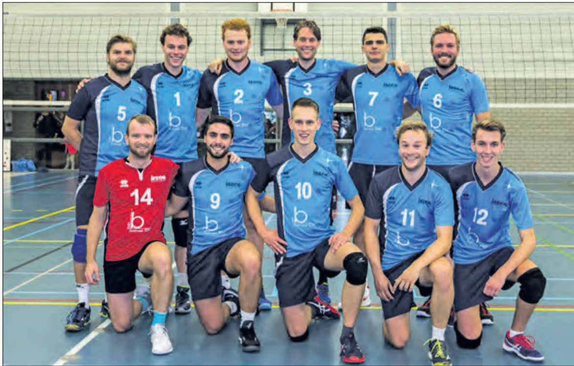
Team heren 1 anno 2020

Zaterdag 1 februari viert Irene-Volleybal haar 65 jarig bestaan in de Kees Boeke Sporthal te Bilthoven. Tijdens deze 'Super Saturday' zijn er de hele dag activiteiten die door belangstellenden kunnen worden bijgewoond.