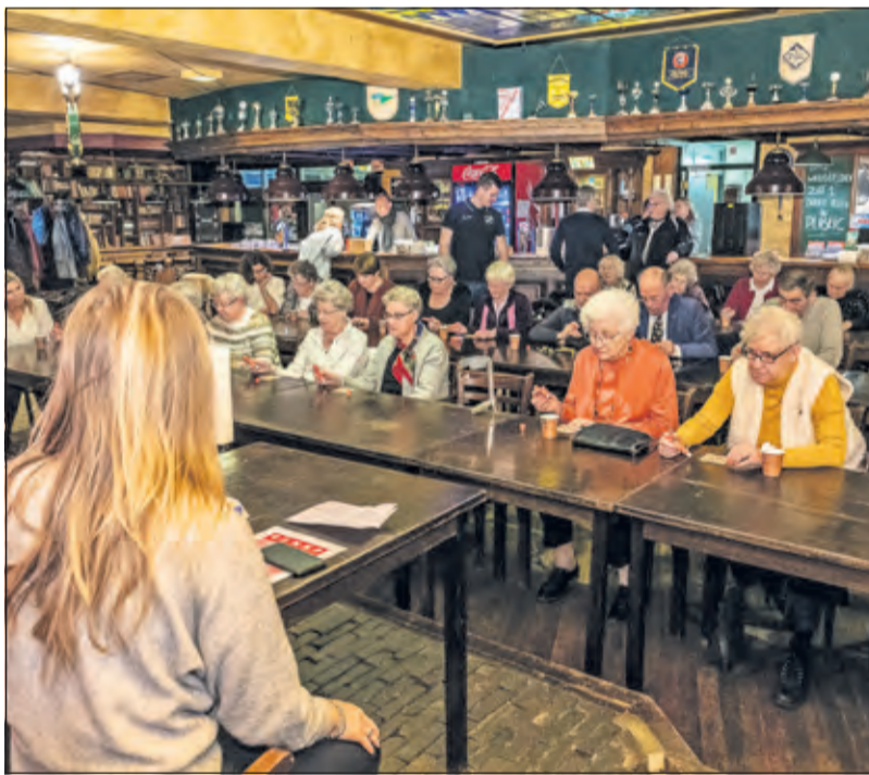
In het clubhuis van FC De Bilt zat de sfeer er afgelopen vrijdag goed in.