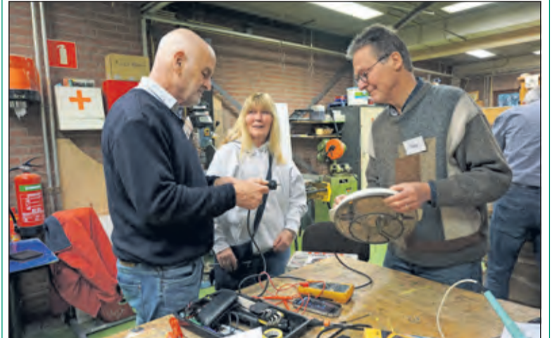
Twee vrijwilligers van het Repair Café bestuderen een defect gourmetstel.

Er heerste weer een opgetogen sfeer met tevreden bezoekers en werd het doel van een duurzame samenleving ook nog gediend. (Frans Poot)