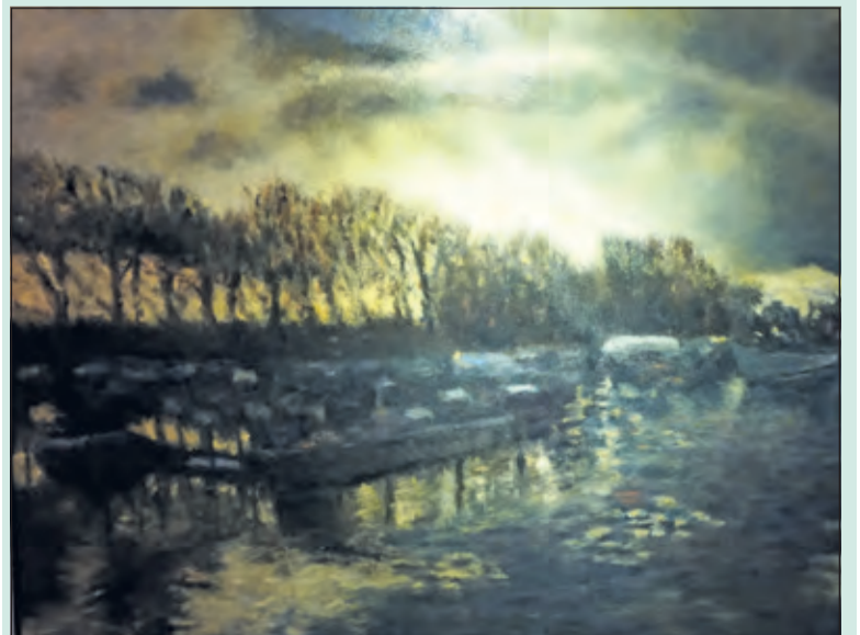
Sjef Bertrams versterkt zijn werk met bijzondere lichteffecten.