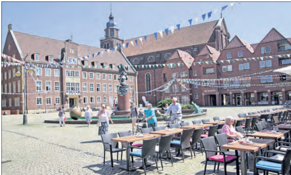
Het gemeentehuis en marktplein van Coesfeld.

trum für Niederlande-Studien). Hij is een expert op het gebied van Duits-Nederlandse betrekkingen en zal het hebben over de resultaten van een recent onderzoek naar Duits-Nederlandse jumelages. En natuurlijk zal De Vierklank, trendend in een goede traditie, in mei bijzondere aandacht besteden aan de gezamenlijke aandacht voor 75 jaar Vrijheid, op 5 mei in De Bilt en op 9 mei in Coesfeld. Door het jaar heen doen we zoals gewoonlijk verslag van de activiteiten die inwoners uit Coesfeld en De Bilt samen organiseren. Nieuw zullen dit jaar de initiatieven op het gebied van duurzame energie en klimaatbeleid zijn. Daarin volgen we onder meer Bilthoven Energie Neutrale Gemeente (BENG) en enkele partners in Coesfeld. Heel spannend allemaal en ook te volgen op website: www.jumelage-debilt-coesfeld.nl