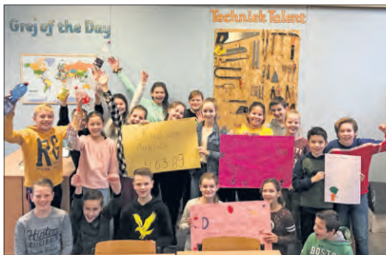
Groep 8 van de Martin Luther Kingschool met de opbrengst van de actie.

Vorige week ging dat over de bosbranden in Australië. De leerlingen uit groep 8 vonden het erg om te horen hoe de situatie daar is en besloten in actie te komen. Samen bedachten ze een titel voor de actie: Drink koffie of thee, want daar helpt u Australië mee. Na schooltijd werd koffie en thee verkocht aan ouders die hun kinderen kwamen ophalen. Daarnaast zijn de leerlingen door het dorp gegaan om lege flessen op te halen, een aantal heeft zelfs een deel van het zakgeld opgeofferd voor dit doel. In totaal werd er € 403,89 ingezameld en overgemaakt naar Giro 5125. (Arjan Dam)