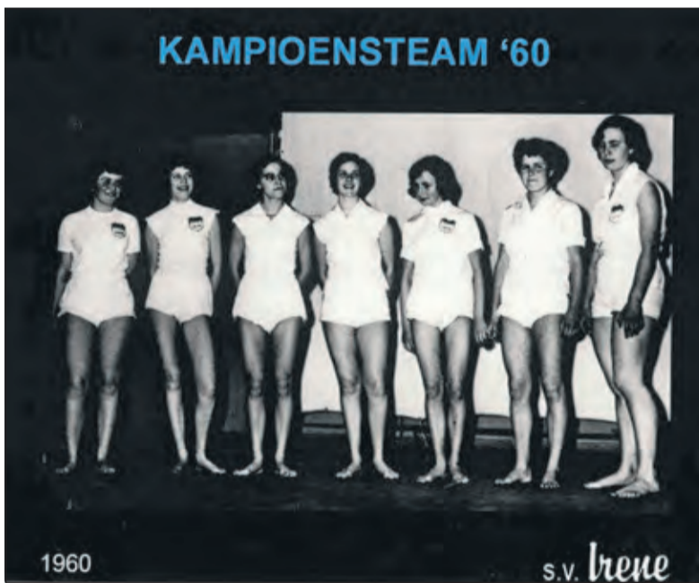
In 1960 werden de dames van Irene kampioen.

Programma van Super Saturday: 09.45 - 18.30 Volleybalwedstrijden 10.30 - 17.00 Loterij voor jeugd en senioren 11.00 - 15.00 Join Volleybal Tour voor jeugd 3 -12 jaar 13.30 - 14.30 2e divisie dames wedstrijd met VIP-tribune 16.00 - 19.00 Reünie voor (oud) leden 16.15 - 18.30 Promotieklasse heren wedstrijd met VIP-tribune