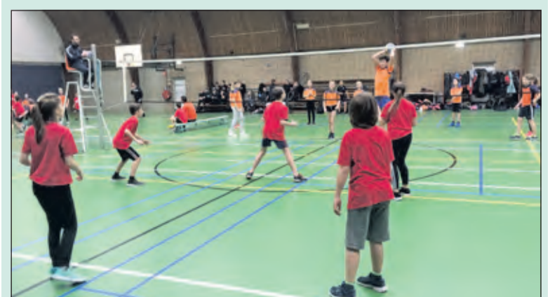
Cooler moves tussen de groep 8 leerlingen.

Prijzen waren niet te winnen, maar desalniettemin vertrokken de leerlingen na 6, 7 of 8 gespeelde wedstrijden weer voldaan naar huis of naar school. Volgende sportactiviteit waar leerlingen uit groep 5 t/m 8 aan deel kunnen nemen is het schoolvoetbaltoernooi op de woensdagen 8 en 22 april aanstaande. (Paul van den Brink)