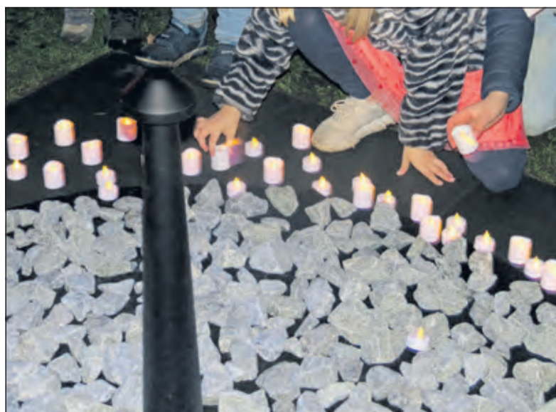
Schoolkinderen zetten kaarsjes rond het tijdelijk monument.