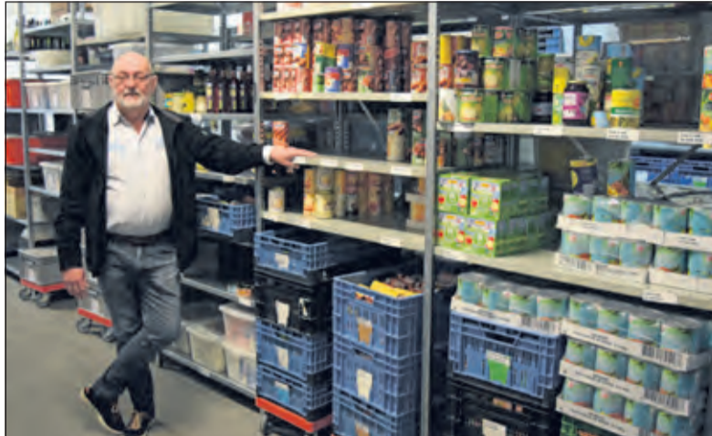
Het magazijn van de Voedselbank zoekt een coördinator.

Wat houdt deze functie precies in? 'Tijdens werkdagen worden levensmiddelen bij de supermarkten door ons team opgehaald en naar het magazijn van de Voedselbank gebracht', legt Schleiffert uit. De pakketten worden op dinsdagochtend en vrijdagochtend klaargemaakt en worden op dinsdag- en vrijdagmiddag opgehaald door de afnemers.