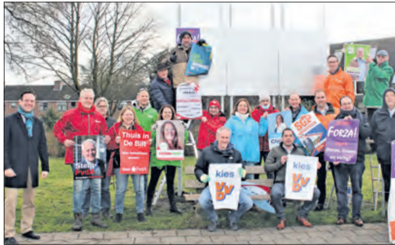
Eensgezinde start van een vaak verdeelde raad.

De campagne voor de gemeenteraadsverkiezingen werd zaterdag afgetrapt met het plakken van de eerste posters. Alle deelnemende partijen plakten hun eigen poster op