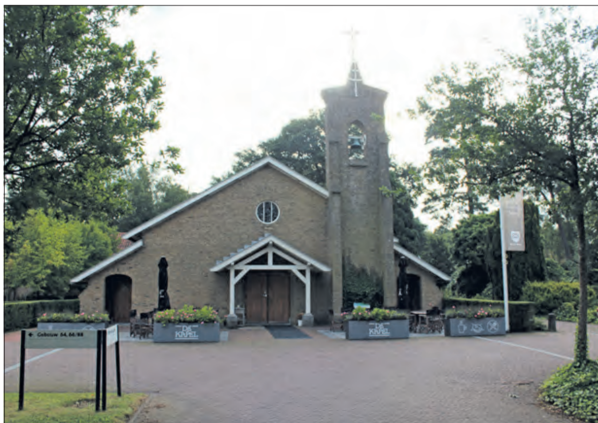
In De Kapel verpleegden de zusters Dominicanessen zieken die aan tuberculose leden. De schitterende architectuur, verfraaid met veel kunstwerken en gebrandschilderde ramen, is al die tijd ongemoeid gebleven.