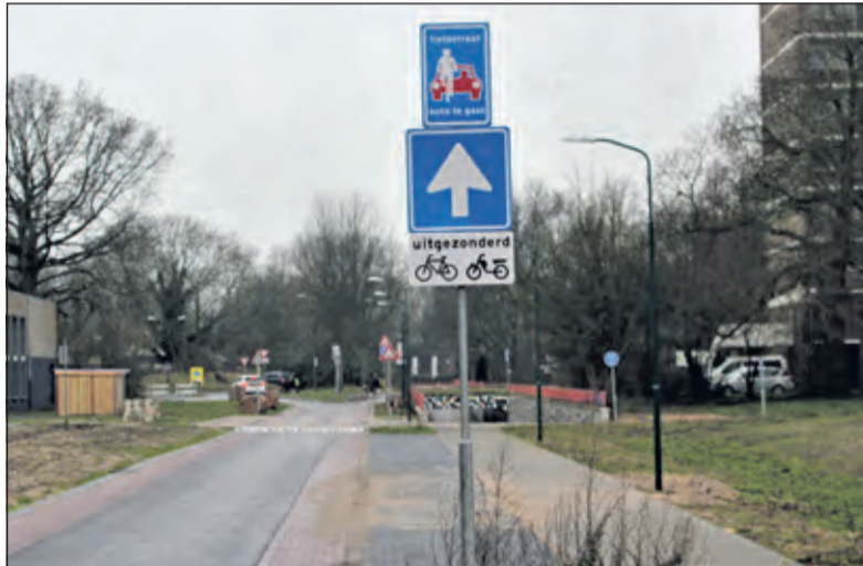
De gemeente beoogt met het invoeren van éénrichtingsverkeer dat ook bromfietzers vanaf de Biltse Rading niet de Asserweg oprijden. Echter mogen er wél brommers door de tunnel vanaf Weltevreden rijden richting Asserweg.

korte weggedeelten in te stellen blijft de impact op lokaal verkeer beperkt. De gemeente is op grond van deze overwegingen tot het besluit gekomen om op de Blauwkapelseweg tussen Biltse Rading en Park Arenberg éénrichtingsverkeer in te stellen in de rijrichting 'dorp in'. De tegengestelde rijrichting op de Blauwkapelseweg blijft wel beschikbaar voor lijnbussen, zodat het openbaar vervoer op gebruikelijke wijzen doorgang blijft vinden. Hierdoor hoeven er geen haltes te vervallen. Op de Dorpsstraat (Oost) tussen Soestdijkseweg Zuid en de Burg. de Withstraat wordt eenrichtingsverkeer ingesteld in de rijrichting 'dorp in'. Ook deze besluiten treden in werking zodra de borden zijn aangebracht.