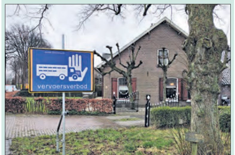
Recente uitbraken van vogelgriep in Hierden en Zeewolde leidden tot een vervoersverbod in De Bilt.

Wie wil weten of er vogelgriep heerst op bedrijven in de buurt en of er vervoersmaatregelen van kracht zijn kan zijn/haar postcode invullen op www.rvo.nl/dierziektenviewer/index.html . Op rijksoverheid.nl leest u op basis waarvan wordt bepaald hoe ver het vervoersverbod reikt.