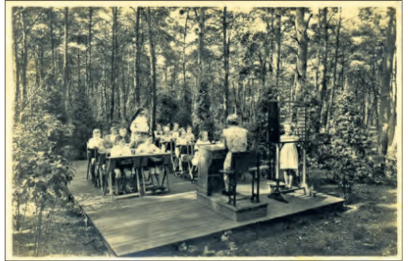
Kinderen kregen ook onderwijs, op bed, in een open schoolgebouwtje of in de openlucht.

patiëntenadministratie, de ruimten voor onderzoek, de operatiekamer en de röntgenafdeling. Ook de geneesheer-directeur en zijn staf, de laboratoria, de wachtkamers, de bibliotheek en diverse dienstafdelingen hadden daar een plaats gekregen. Op de bovenverdieping lagen de woning voor de inwonende rector en kamers voor de medische assistenten. De aan het Heilige Hart van Jezus gewijde kapel, een ontwerp van architect Kropholler, vormde het geestelijk middelpunt van Berg en Bosch. Aan de noordzijde daarvan lag het klooster van de zusters Dominicanessen. Bij de