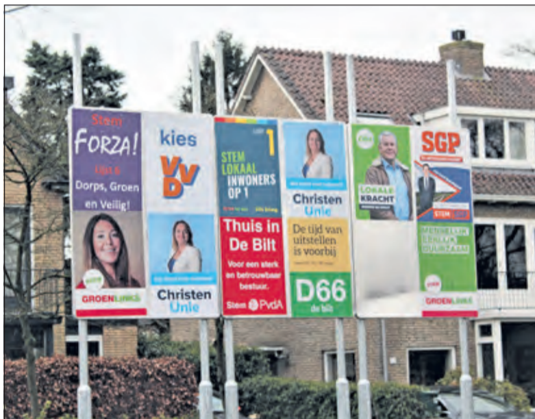
In Groenekan op de hoek Copijnlaan/Groenekanseweg.

In totaal worden er 9 aluminium verkiezingsborden in de gemeente geplaatst: in Maartensdijk aan de Nachtgaallaan, in Hollandsche Rading aan de Tolakkerweg, in Westbroek aan de Burg. Huydecoperweg / Schutmeesterweg, in Groenekan op de hoek Copijnlaan/Groenekanseweg, in De Bilt langs de Biltse Rading, aan de Soestdijkseweg Zuid en aan het Dr Letteplein en in Bithoven op de hoek Massyslaan/Leyenseweg en op de hoek Sperwerlaan/Kruisbeklaan.