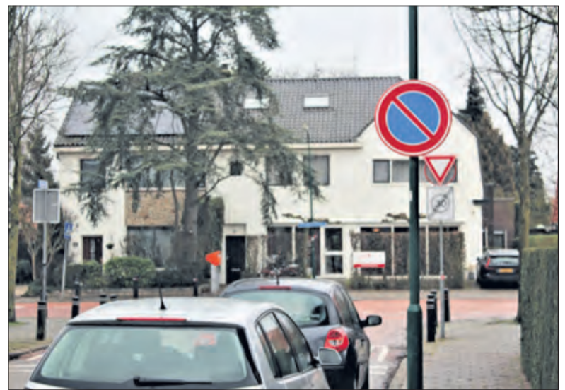
Op een gedeelte van de Kerklaan mag nu niet meer geparkeerd worden.