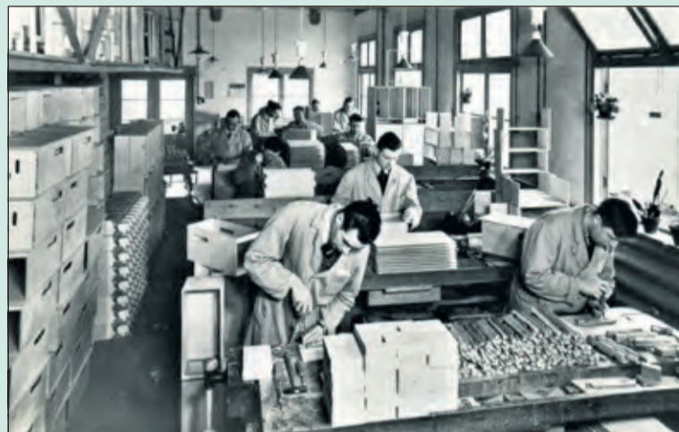
In de werkplaats van sanatorium Berg en Bosch werden oud Tbc-patiënten te werk gesteld. Meer over de geschiedenis van Sanatorium Berg en Bosch op pag. 13.

geweten dat de vestiging van een behandelcentrum hier tot onduidelijkheid zou gaan leiden hadden we strakker toegezien op de gemaakte afspraken op 5 november. Het was van meet af aan de bedoeling om omwonenden en de mensen op het terrein tijdig en goed te informeren. Fivoor heeft in de aanloop onder meer contact gelegd met de Berg en Boschool, de Biltse Hof, de Boskapel, de beheerder, het Leendert Meeshuis, Lievegoed, de wijkagent en de gemeente. De bedoeling was ook met een aantal direct omwonenden. Dat is op onderdelen niet tijdig of onvolledig gebeurd.'