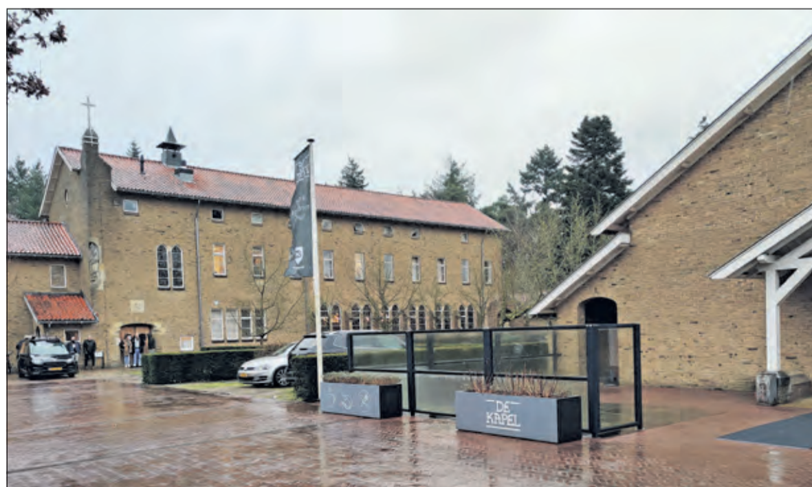
Het behandelcentrum op het Berg en Boschterrein in Bilthoven.