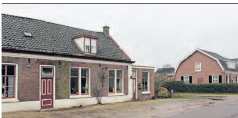
Ambachtsgilden Westbroek ligt achter Kerkdijk 35-37.