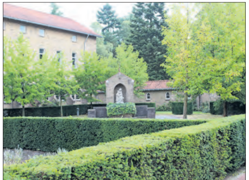
Aan de linkerkant van de kapel bevindt zich een weggapelletje met altaar en beeld van Maria en het lichaam van de dode Christus op haar schoot (pietà) van beeldhouwer Piet Jungblut.

arbeidslocaties waar deze patiënten te werk gesteld konden worden en die als zelfstandige productiebedrijfsjes konden opereren. Bronkhorst liet zich bij de keuze van deze bedrijfsjes leiden door enkele fundamentele uitgangspunten. Onge routineerde mensen moeten een nuttige inbreng in de productie kunnen hebben en hiervoor ook geenthousiasmeerd kunnen worden. De producten moeten door een artistiek kwaliteitsniveau een meerwaarde hebben ten opzichte van het gewone massa-artikel in de markt en de ontwerpen moeten uit eigen hand komen en altijd eigendom blijven