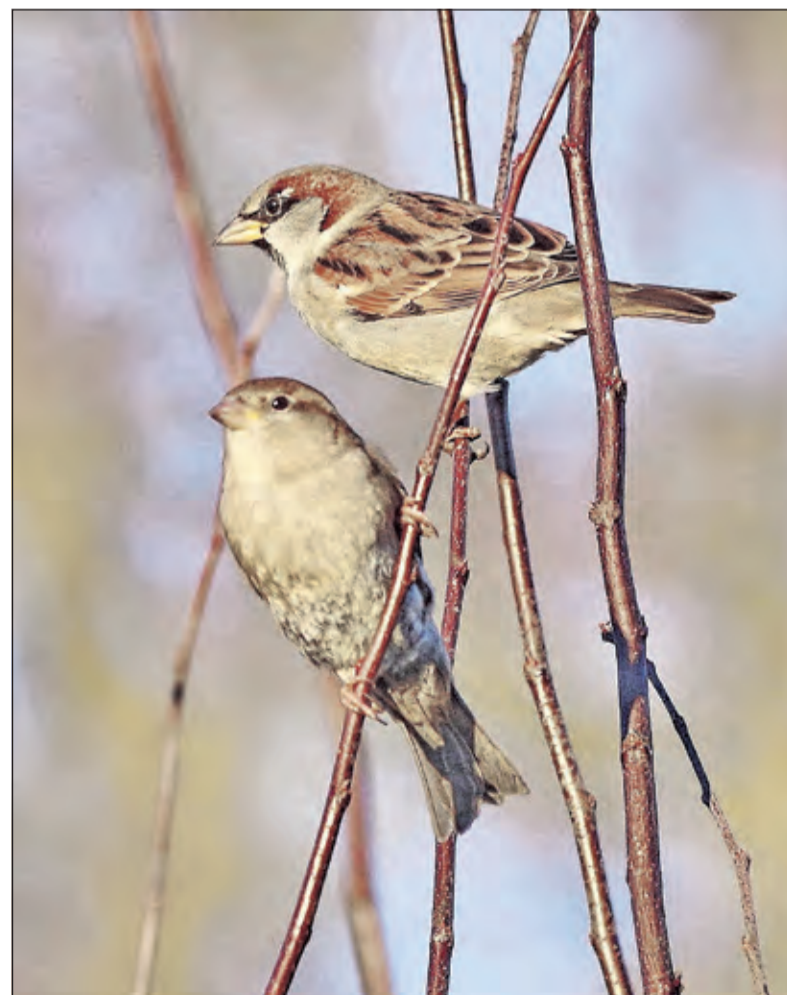
Huismussen - Het mannetje rechtsboven en het vrouwtje linksonder.

Alweer voor de 22e keer organiseerde Vogelbescherming Zeist en SOVON Vogelonderzoek de nationale Tuinvogeltelling. Met alle