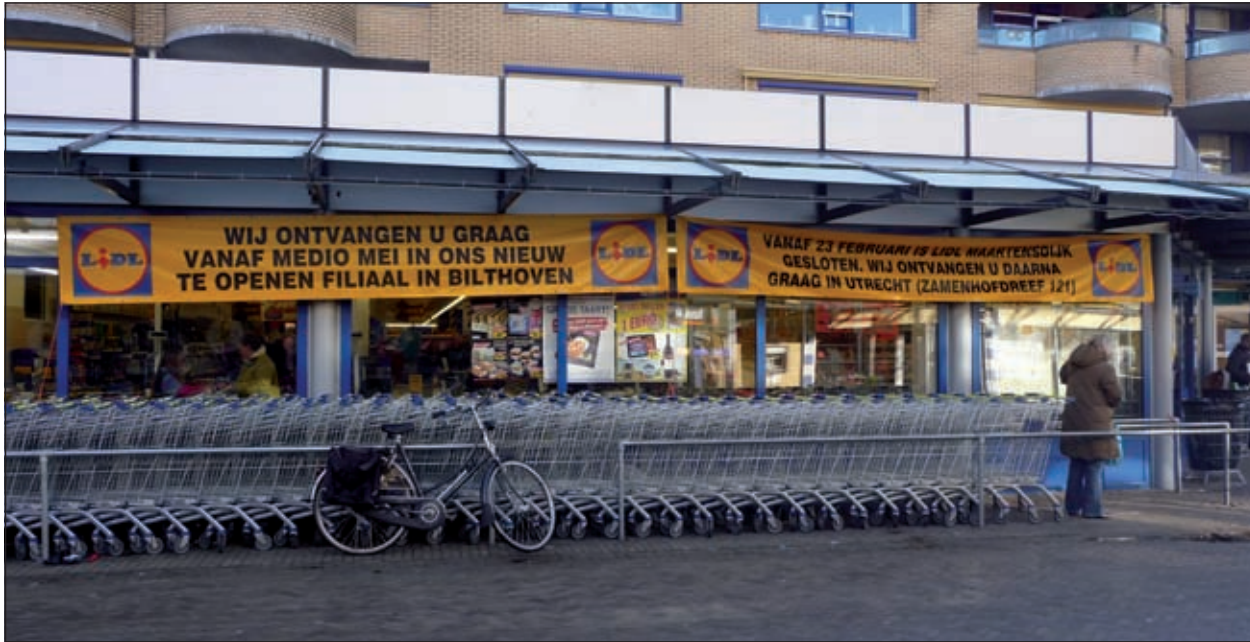
Zaterdag 21 februari sluit het filiaal van de Lidl aan het Maertensplein in Maartensdijk haar deuren definitief.