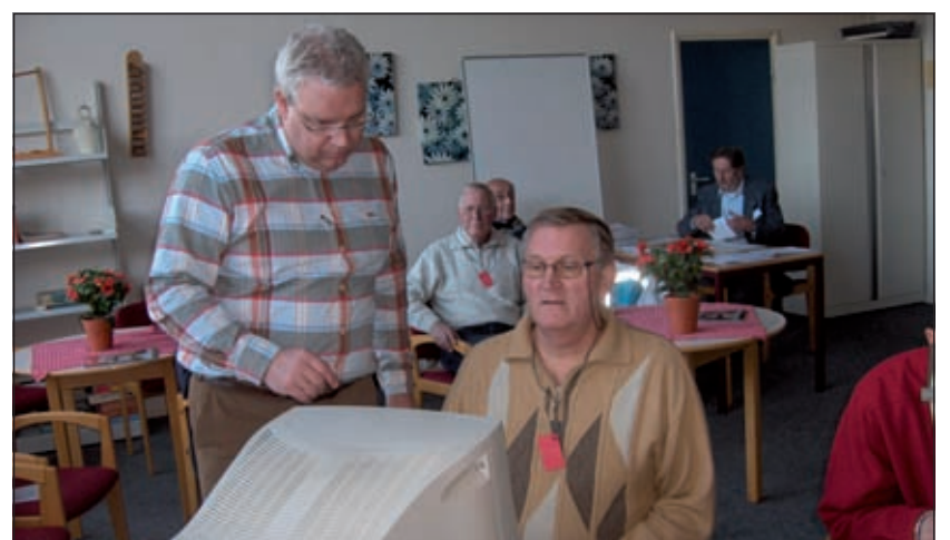
Net als eerdere jaren wordt er weer een reactietest afgenomen.

Om aan deze cursussen te kunnen deelnemen dient u in het bezit te zijn van een PC en de basiscursus PC te hebben gevolgd of tenminste hetzelfde niveau van kennis en vaardigheid te bezitten. Voor de cursus wordt gebruikt gemaakt van Windows XP en Office 2000. Voor aanmelden of inlichtingen: SWO vestiging Maartensdijk, tel: 0346 21461.