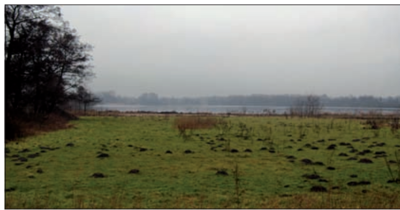
De Hooge Kampse Plas, gezien vanaf de Voordorpsdijk.

De aanwezigen kregen na een persoonlijke inleiding van de initiatiefnemer de gelegenheid om vragen te stellen. Van deze gelegenheid werd door de bezoekers goed gebruik gemaakt. Er zijn vele zinvolle opmerkingen gemaakt, waarmee bij de verdere uitwerking rekening wordt gehouden. Alle aanwezigen die hun adres hebben ingevuld op de presentielijst worden persoonlijk op de hoogte gehouden. Binnen enkele weken zullen de definitieve vergunningsaanvragen bij de overheid worden ingediend.