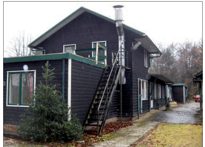
Tijdens de monumenteninventarisatie in de jaren '90 is niet opgemerkt dat op Beukenburg zich een landhuis bevindt.

Het is verbazingswekkend de opningszin in de krant van zaterdag jl.