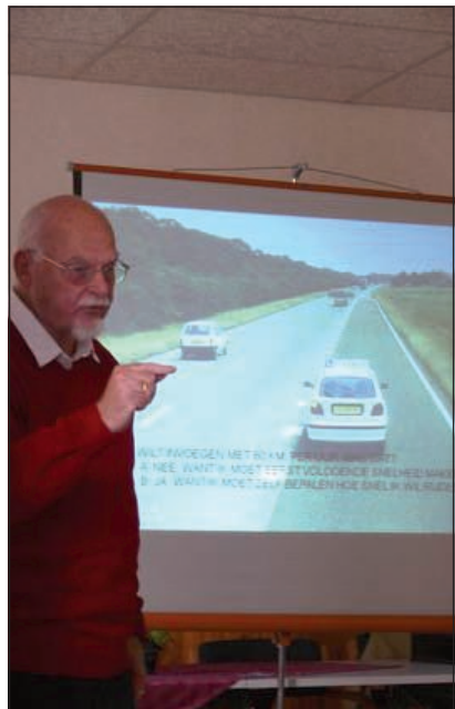
Ook de theorie wordt uitgebreid behandeld.

wegsituaties, enz. 'Waarom niet?', terwijl men overal bijscholingscursussen moet volgen om bij te blijven en zelfs om bevoegdheden te kunnen blijven behouden. Het verkeer is een serieuze zaak waar ook serieus mee behoort om te worden gegaan. Daarom zetten Veilig Verkeer Nederland en anderen zich in om de mogelijkheid te bieden om vaardigheden in het verkeer vrijwillig te optimaliseren. En: het is een 'opfriscursus' is en geen examen.