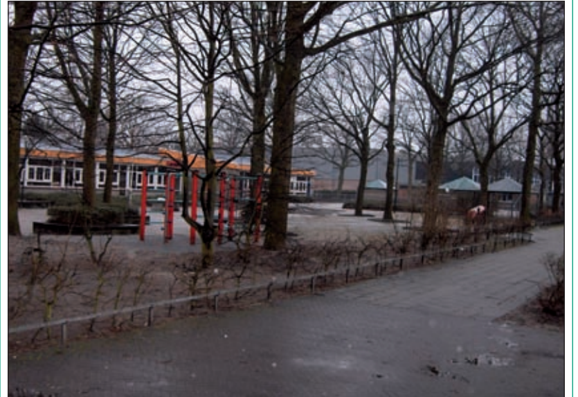
Onderzoek heeft aangetoond dat het wel haalbaar maar niet wenselijk is een hek te plaatsen rond het terrein, behalve rond het schoolcomplex aan de Nachtegaallaan te Maartensdijk.

Onlangs heeft het College aan de gemeenteraad bericht, dat het onderzoek intussen afgerond is en heeft geleid tot de conclusie dat een hek rond het betreffende scholencomplex - onder bepaalde voorwaarden - haalbaar is, maar niet wenselijk. De voordelen wegen naar de mening van het College onvoldoende op tegen de nadelen van een dergelijk hek. Voor nadere informatie verwijst het College naar de inhoud van de onderzoeksnotitie die op de gebruikelijke wijze ter inzage ligt [HvdB].