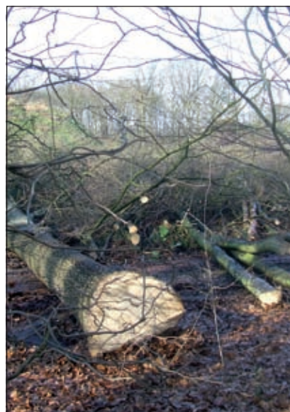
Het kappen van bomen moet voor half maart klaar zijn.

Bram Quaak vertelt tijdens een presentatie welke activiteiten op het bedrijventerrein de komende maanden te verwachten zijn. Quaak is