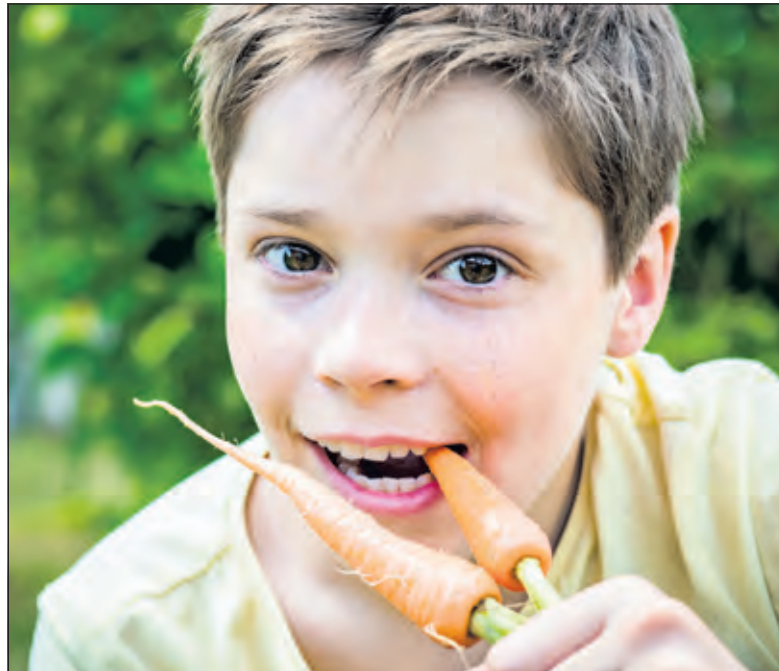
Je zelf geteelde wortel smaakt natuurlijk fantastisch.

Het aanleren van gezonde voedingsgewoonten op jonge leeftijd is een stuk makkelijker dan op latere leeftijd ongezond gedrag af te leren, weten ook de mensen verbonden aan lokale duurzaamheidsorganisatie Biltsheerlijk en het landelijke programma Jong Leren Eten (dat gericht is op structurele aandacht in het onderwijs voor voedsel educatie). Dit jaar hebben zij de handen ineen geslagen om samen met een bont