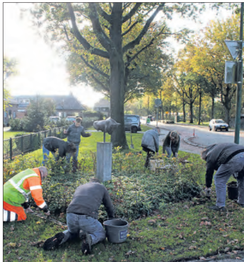
Op de hoek van de Nachtegaallaan en Dorpsweg, bij De Stier, worden de bollen in de grond gestopt.