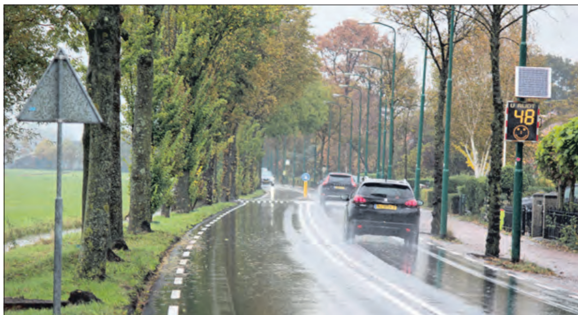
Jl. zaterdag hielden deze auto's zich bij een kletsnat wegdek keurig aan de voorgeschreven snelheid.

De bewonersgroep Koningin Wilhelminaweg en de Vereniging Groenekan verzoeken het college antwoord te geven op vragen als: 'Betreft 'de kade' een beschermd monument?, Waar is dit vastgelegd? En waarop baseert de gemeente dat de kade "een plek is van grote historische waarde"? Volgens hen gaat het om een klein stukje van een loskade van nog