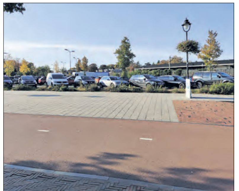
Wim Sonneveld zong er (al) over: 'Dit dorp, Ik weet nog hoe het was..... Dat dorp van toen, het is voorbij.....Dit is al wat er (over) bleef voor mij'.

Er valt heel veel blad van de bomen aan de winter valt niet te ontkomen toen de klok werd verzet lag je iets langer op bed kon dus ook een uur langer dromen