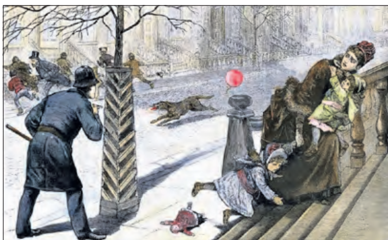
Epidemie van rabiës in 1886.