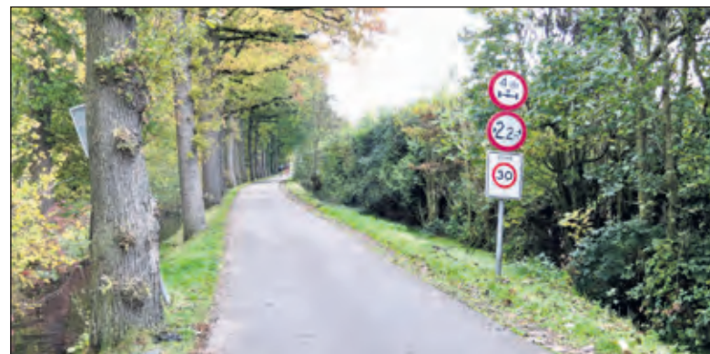
De gemeente De Bilt wil samen met Zeist de Bisschopsweg verbeteren.