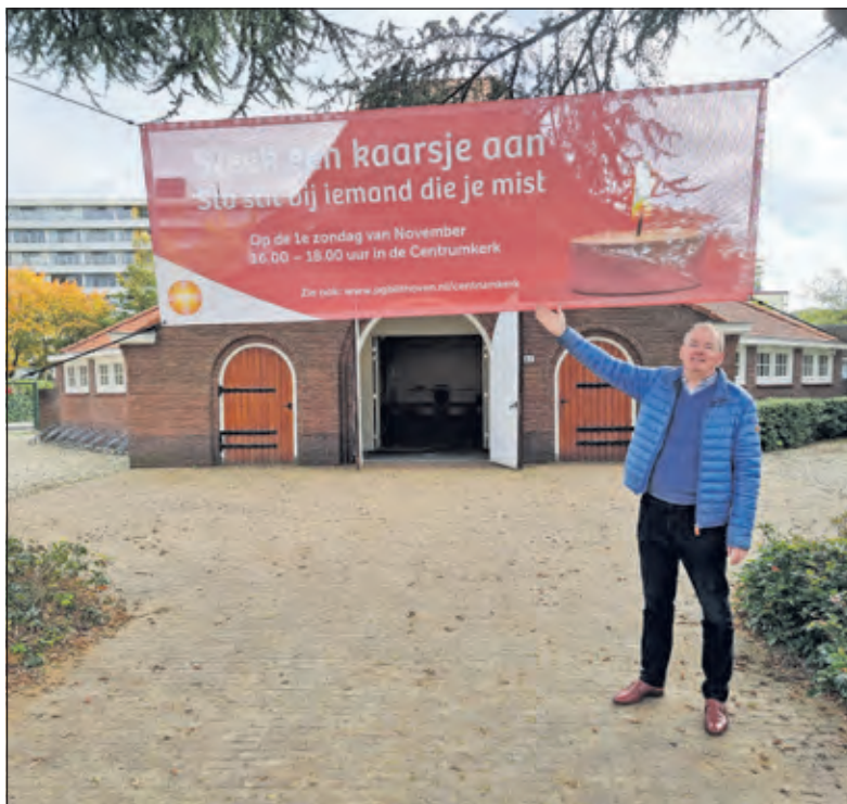
Iedereen is welkom in de kerk

Wanneer de bijeenkomsten plaatsvinden, wordt in onderling overleg bepaald.