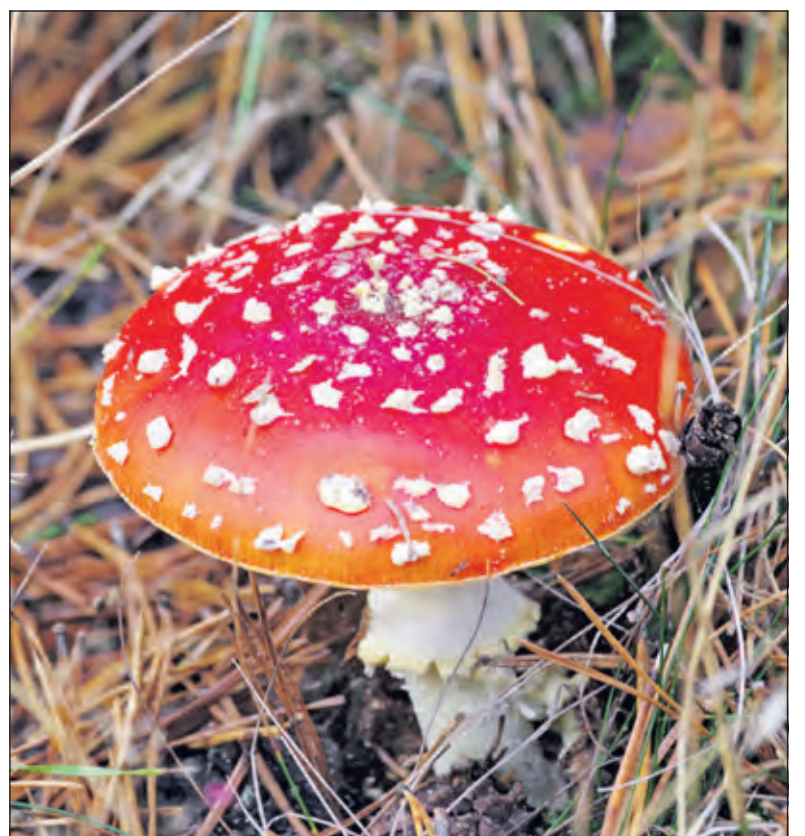
Een vliegenzwam op de hei in Lage Vuursche voltooit het herfstbeeld.

Tekenen van de petitie kan op www.petities.nl