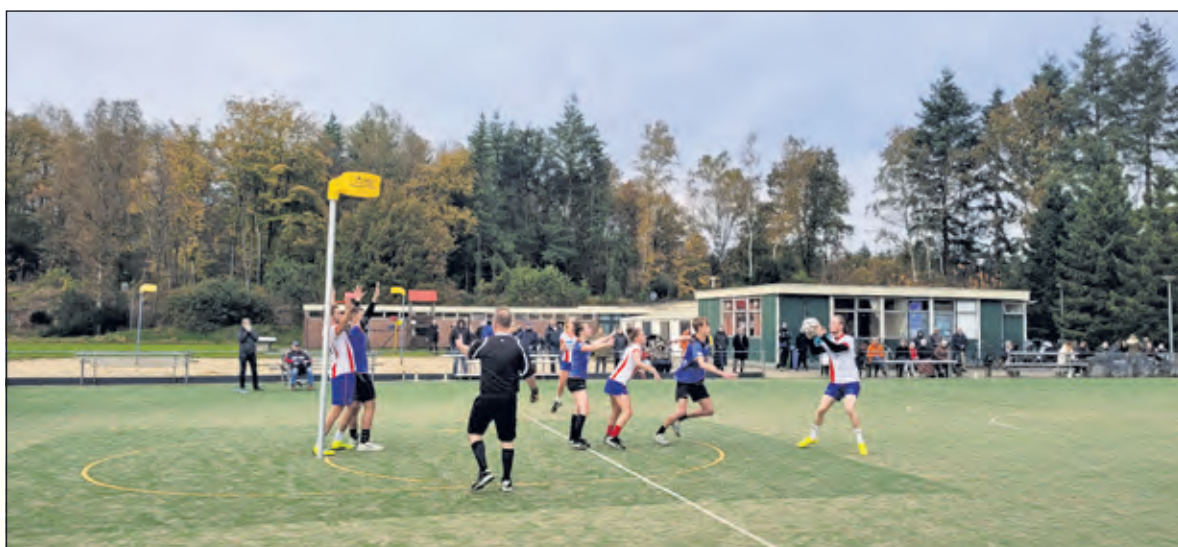
In en tegen Apeldoorn verzamelde Nova de eerste punten.

Over een paar weken start de zaalcompetitie. Hierin wacht voor de selectie weer een nieuwe uitdaging in de tweede klasse. (Mex de Vree)