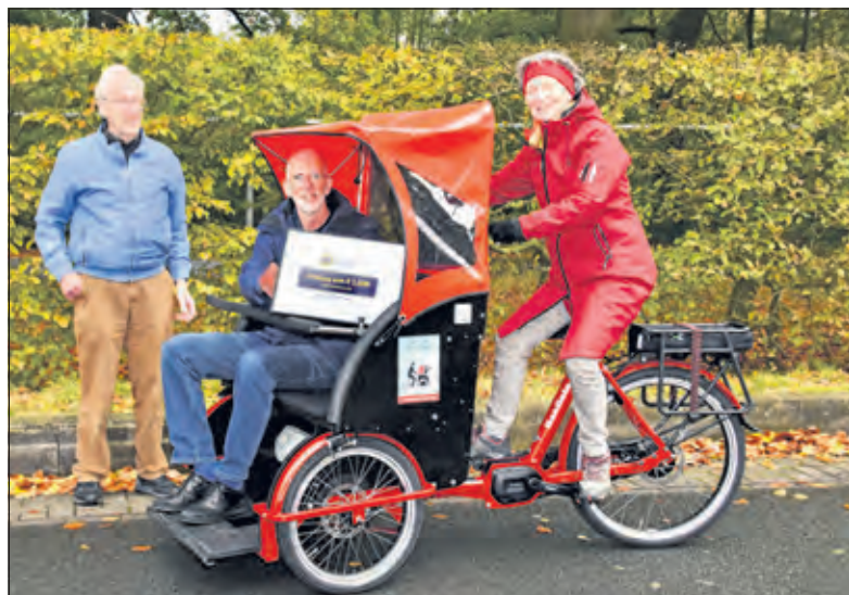
Een dankbaar bestuur van Stichting Riksja De Bilt met de cheque van Lions De Bilt/Bilthoven

Vanaf begin dit jaar heeft Stichting Riksja De Bilt zich ingespannen om