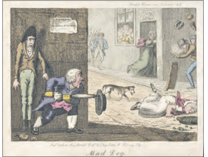
Een dolle hond in Londen, door T.L. Busby 1826.