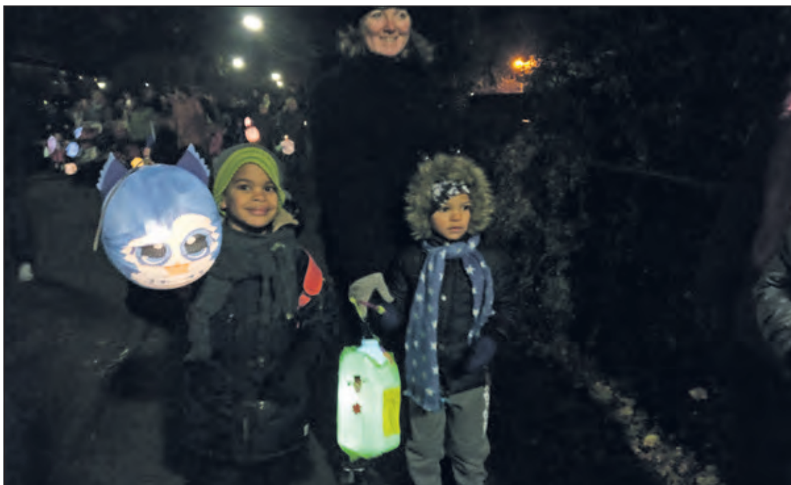
Nog even geen lampionnenoptocht met Sint Maarten.

Omdat het feest van Sint Maarten gaat over delen met anderen - Sint Maarten deelde immers zijn mantel - zou het heel mooi zijn wanneer alle kinderen ook iets meenemen voor een ander. Bij de Sint Maartenskerk kunnen de kinderen daarom die avond iets inleveren voor De Voedselbank; bijvoorbeeld een blik soep, een rookworst of een pot appelmoes. Zo wordt het feest van Sint Maarten echt een feest van samen delen.