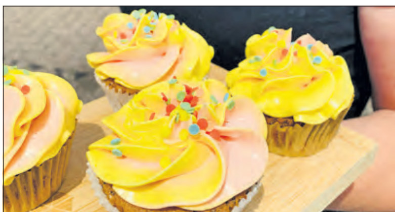
Voor mantelzorgers is er een ontmoetingsmoment met wat lekkers.

De mantelzorgwaardering bestaat uit bonnen met een totale waarde van 50 euro, die te besteden zijn bij aangesloten lokale ondernemers die tijdens de lockdown waren gesloten. Deze waardering is bedoeld voor mantelzorgers die zorgen voor een inwoner van gemeente De Bilt. Mensen die al staan ingeschreven bij Steunpunt Mantelzorg De Bilt ontvangen de waardering per post vanaf medio november. Mantelzorgers die de waardering willen ontvangen kunnen zich tot het einde van dit jaar inschrijven bij Steunpunt Mantelzorg. Dat kan via www.mensdebilt.nl .