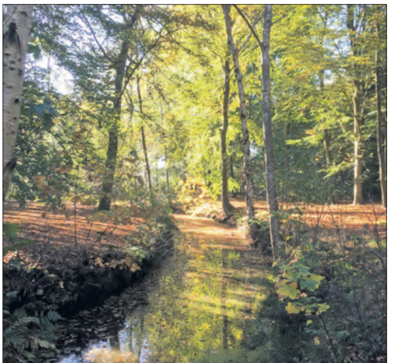
Herfst op landgoed Beukenburg.

A.s. zaterdag gaan de Maartensdijkers op bezoek in en tegen Kockengen.