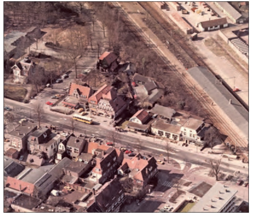
Luchtfoto van het Emmaplein, in de jaren zeventig. Aan de westzijde v.l.n.r. café De Bonte Koe, Dijkman en Niehof, op het binnenterrein de fietswinkel en werkplaats van Van Weelden, met garageboxen en autoherstelwerkplaats van De Witte, Bontwinkel Gasparjan, en uitgaanscentrum De Schouw met er achter de kegelbaan.

Brands die zijn naam aan het hotel verbond: Hotel Brands – en dat werd een begrip.