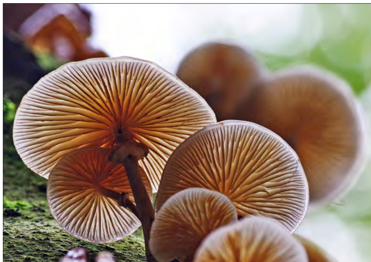
De van onderen genomen foto met tegenlicht van een porseleinzwam bij de Kuil in Lage Vuursche doet eer aan de naam.

Groenekansweg 168 | Groenekan 0346 - 218821 | info@naastdeburen.nl