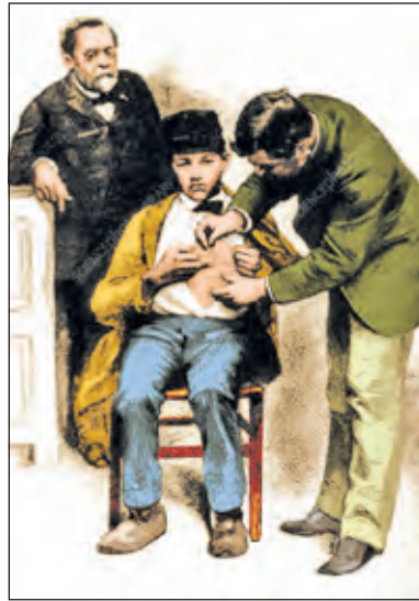
Pasteur geeft een inenting tegen hondsdolheid.

van het aftreksel negen dagen lang iedere ochtend op de nuchtere maag een wijnglas vol drinken. Als er wonden waren, moest men ze openkrabben met spanen van eikenhout tot er bloed uitkwam; daarna waste men ze met het drankje. De drank was een groot commercieel succes, voornamelijk doordat veel mensen door honden werden gebeten.