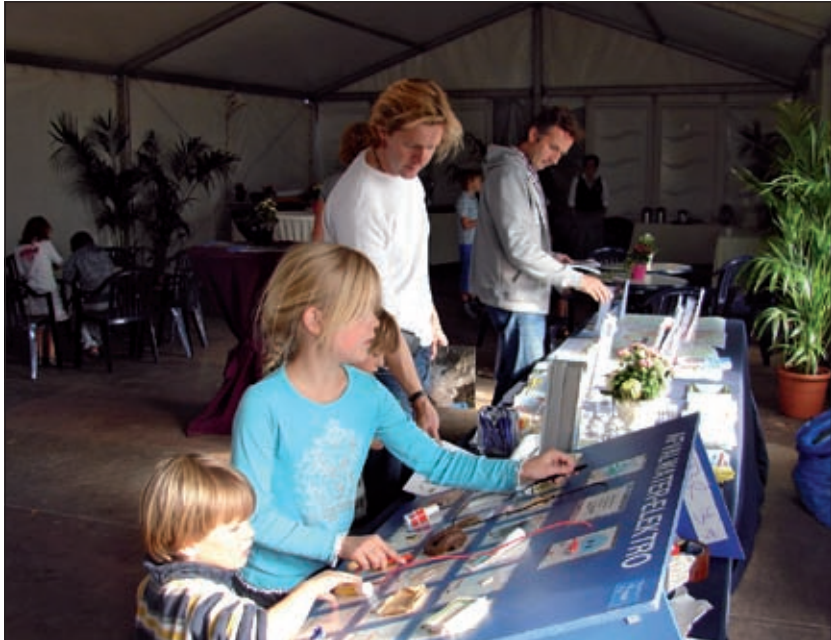
Kinderen leren spelenderwijs wat wel en niet in afvalwater thuishoort.

Een medewerker van de rioolzuiveringsinstallatie: 'Kinderen zijn de toekomst, die kun je nog leren om zuinig met water om te gaan, dus daar besteden we veel aandacht aan'. Voor de basisscholen zijn lespakketten ontwikkeld over de waterhuishouding met alle bijbehorende facetten. De geestige stripboekjes over Droppie (over de reis van het water) vonden zaterdag gretig aftrek bij kinderen én bij volwassenen.