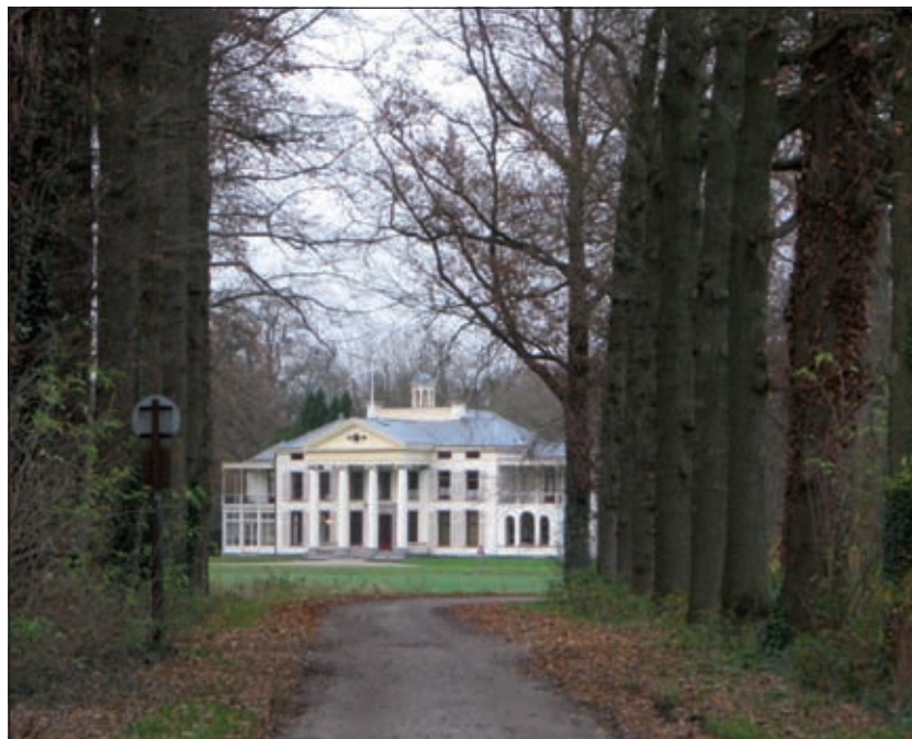
Foto van de Gezichtslaan met Eyckenstein, genomen op het noordelijkste gedeelte van ongeveer 1 km lengte, dat door de aanwezigheid van een slagboom alleen voor langzaam verkeer en bestemmingsverkeer toegankelijk is.

Het boek verschijnt naar verwachting aan het eind van dit jaar en gaat €14,95 kosten.