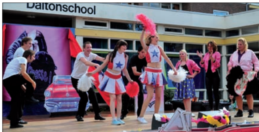
Even terug in de tijd.

Aan het eind van de middag gingen alle aanwezigen zingend en met een warm en tevreden gevoel naar huis.