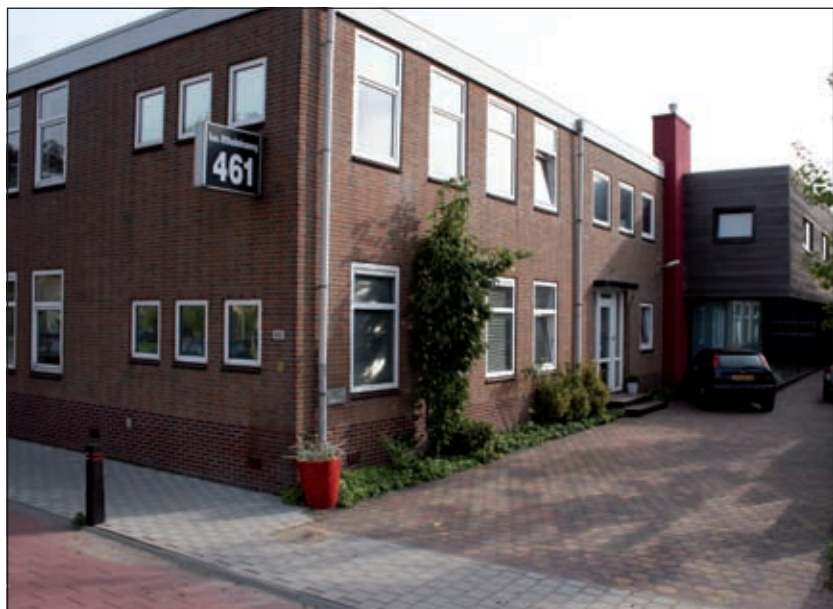
Het kantoor van De Vierklank, Koningin Wilhelminaweg 461 Groenekan.