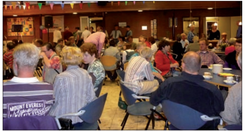
Samen Verder heeft rond de 50 leden, die uit alle kernen van de gemeente De Bilt afkomstig zijn, en voorziet duidelijk in een behoefte. Samen met vrijwilligers, bestuursleden en genodigden werd afgelopen vrijdag het 20 jarig jubileum gevierd.