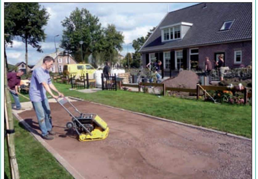
...en daarvoor in de plaats kwam, binnen een betonnen raamwerk, wit zand, grof grind en fijner grind.