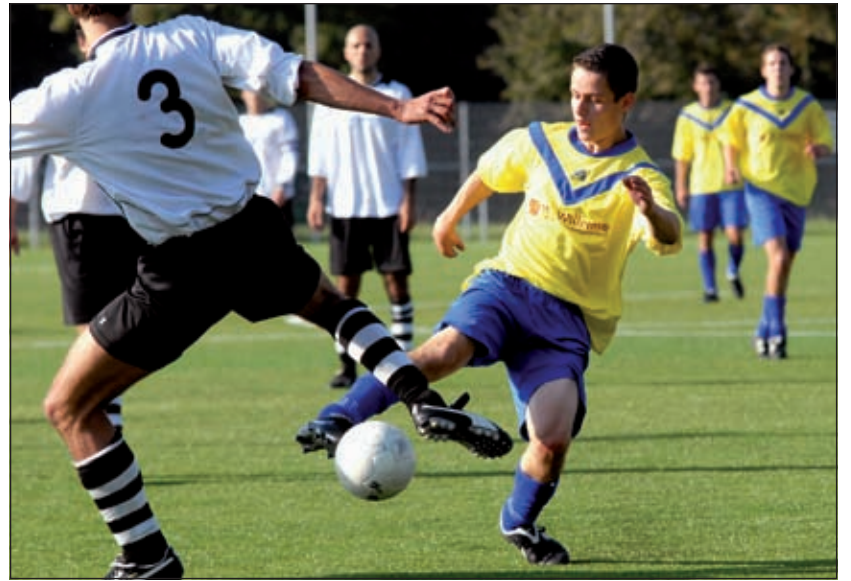
SVM heeft zijn derde wedstrijd op rij gewonnen. In de thuiswedstrijd tegen Maarssen ging het lange tijd gelijk op, maar in de slotfase wist SVM de score tot 6-3 uit te breiden.