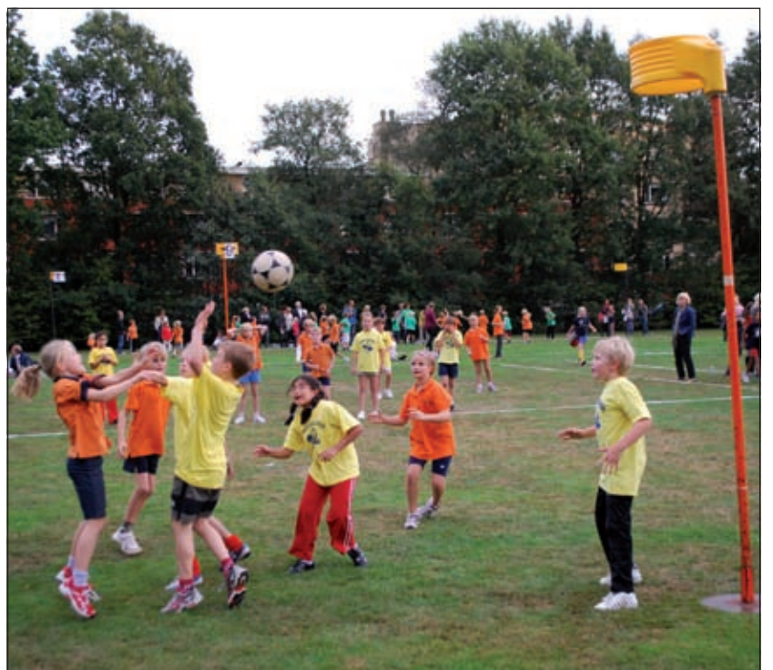
Er werd fel strijd geleverd; hier tussen teams van de Julianaschool en de Laurenschool.

Karate is een oosterse vechtsport die ook heel goed is te gebruiken als zelfverdediging. De lessen zijn hier dan ook op ingericht, maar het belangrijkste tijdens de lessen is het plezier en de gezelligheid die ook bij de sport horen. Instromen kan op elk moment.