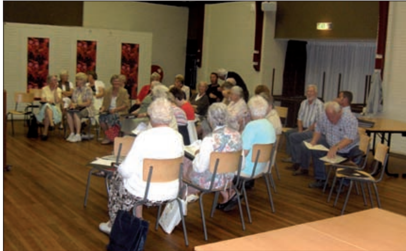
Het koor tijdens een repetitieavond in Dorpshuis de Furs.