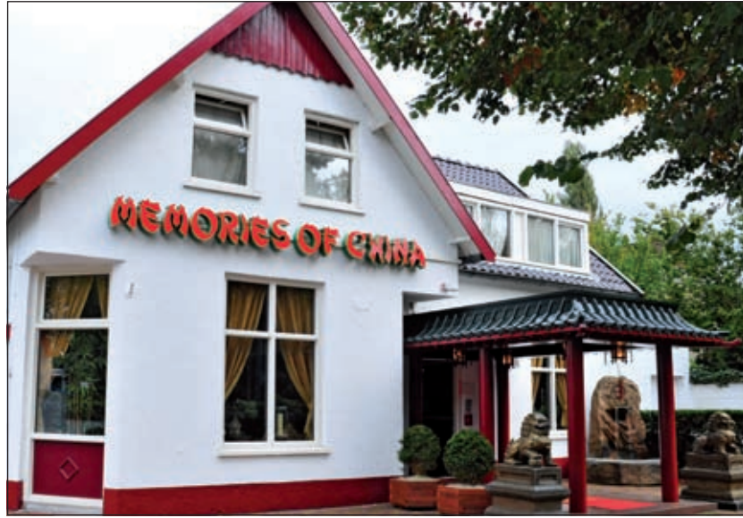
Memories of China bestaat 10 jaar.

Bao: 'Bij de voorgerechten kan er o.a. gekozen worden uit Chinese loempia's, Chinese pansit goreng, gefrituurde vleespastei, gebakken bananen of Sushi mix. Uiteraard kan er ook een keuze gemaakt worden uit verschillende soorten soep. Wat de hoofdgerechten betreft zijn er de gefrituurde gerechten, zoals de Babi