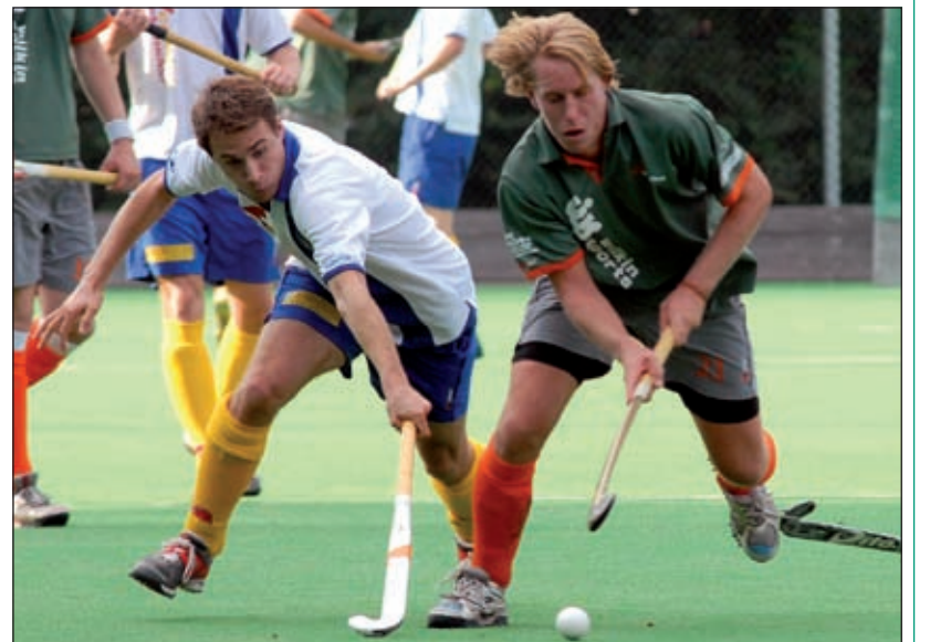
In de thuiswedstrijd tegen het Tilburgse Were Di heeft Voordaan punten laten liggen. Na een 0-1 achterstand bij rust knokte Voordaan zich in de tweede helft naar een 3-1 voorsprong. Dit bleek echter niet genoeg. In de slotfase wist Were Di op gelijke hoogte te komen en met nog enkele minuten te spelen wisten de mannen uit Tilburg de 3-4 te maken. Voordaan probeerde de gelijkmaker nog te forceren, maar het mocht niet baten. Zondag speelt Voordaan de uitwedstrijd tegen het nog puntloze Oss.