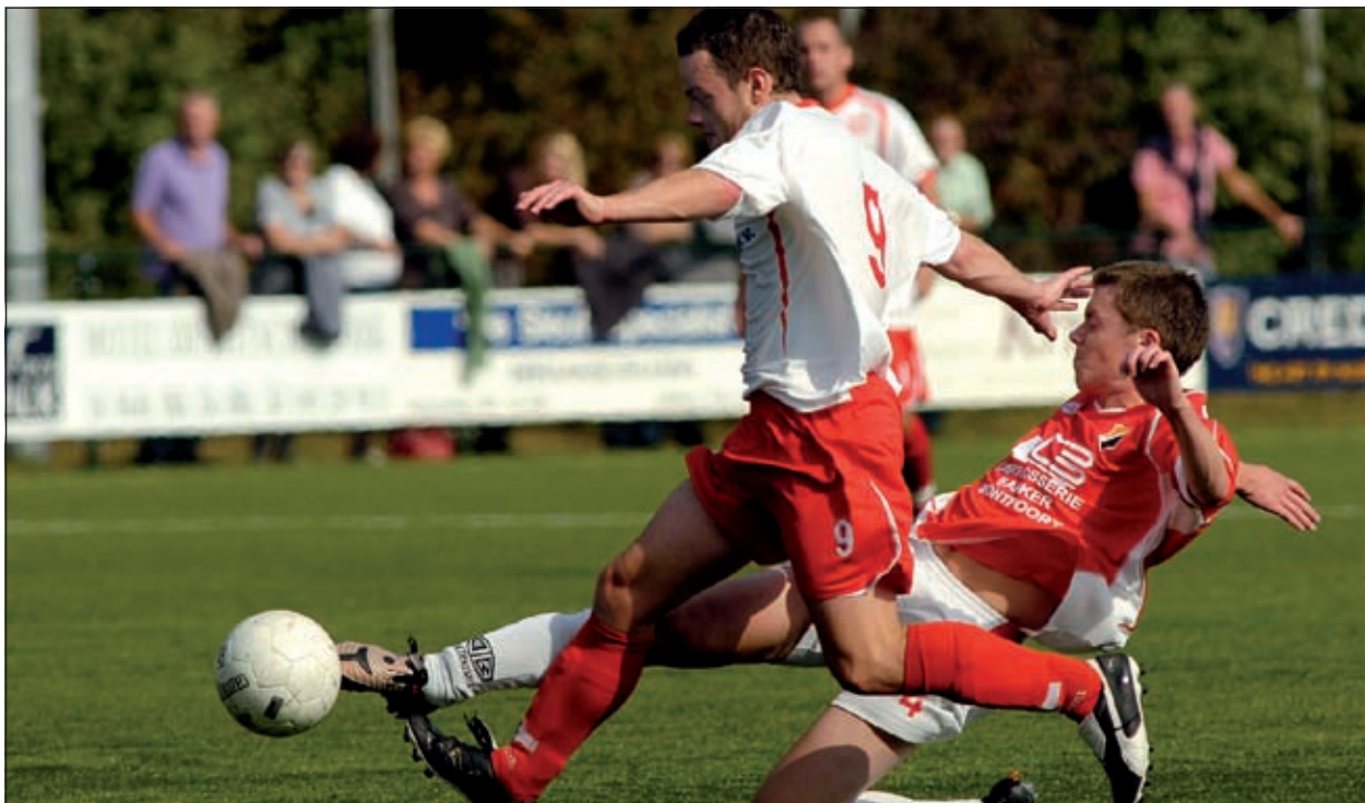
FC De Bilt heeft zijn thuiswedstrijd tegen het Montfoortse MSV '19 met 4-2 gewonnen.