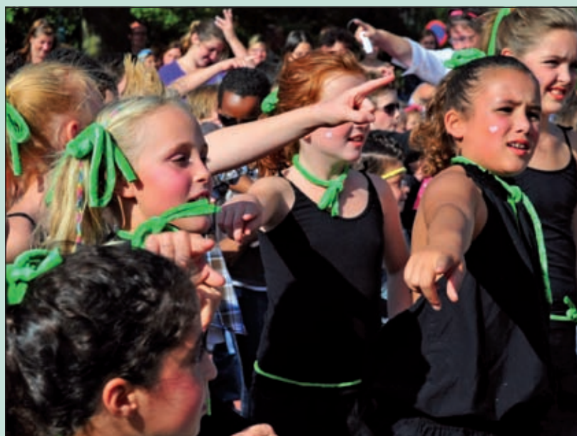
De festiviteiten rondom het 50-jarig bestaan van de Rietakker hadden een 'greasie' karakter. Meer foto's op pagina 15. [AvZ]