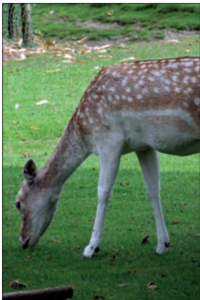
Het hert vindt alles goed, als er maar gras is.