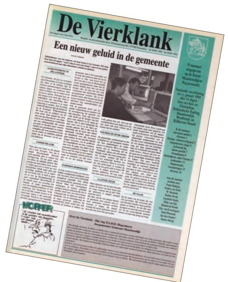
De allereerste Vierklank uit 1994

gekregen. Wij weten dan meteen om welke bezorger het gaat en die moet dan zorgen dat de krant wordt nabbezorgd. In de oude Maartensdijkse kernen loopt dat uitstekend. Daar bestaat zelfs een wachtlijst van mensen die bezorger willen worden. Dat willen we in het nieuwe verspreidgebied ook zo. De eerste tijd zal dat wellicht wat minder soepel verlopen, maar we werken er hard aan om het te verwezenlijken.