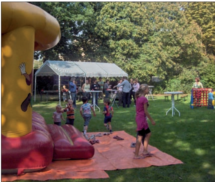
Voor de kinderen stond er een groot springkasteel en een suikerspinmachine en waren er oud Hollandse spelen.