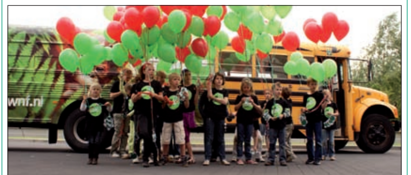
De apenbus is een oude Amerikaanse schoolbus, die helemaal is omgebouwd tot rijdende tv-studio, helemaal in de stijl van de jungle. Kinderen mogen er gratis hun eigen spot opnemen.

Vrijwilligers van het WNF uit de regio Gooi en Vechtstreek, met medewerking van vele WNF-vrijwilligers uit het hele land, organiseren de WNF-Walkathon. Niet alleen voor de wandelaars, maar ook voor bezoekers is de WNF-Walkathon een dagje uit. Tijdens en na afloop van de sponsorloop is er van alles te beleven in het dorp. Zo is er de speciale apenbus van het WNF. De apenbus is een oude Amerikaanse schoolbus, die helemaal is omgebouwd tot rijdende tv-studio, helemaal in de stijl van de jungle. Kinderen mogen er gratis hun eigen spot opnemen. Na ongeveer een week krijgen de kinderen via e-mail een link thuisgestuurd en kunnen ze hun eigen filmpje op YouTube terugzien en downloaden. Verder kunnen kinderen zich laten schminken, klimmen en klauteren in een klimwand en meedoen aan diverse spelletjes. Meer informatie staat op www.wnf.nl/gooi [HvdB].