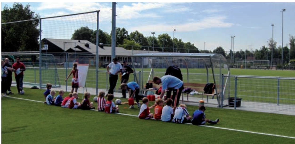
Het bestuur van SVM heeft met het College van B. en W. overeenstemming bereikt over de privatisering van de kleed- en wasaccommodatie en de verhuur van de velden. Op zaterdag 3 juni jl. bereidden de allerjongsten zich al c.q. nog op die geprivatiseerde toekomst voor.

het bepaalde in artikel 169, vierde lid, van de Gemeentewet, stelt het College de gemeenteraad in de gelegenheid om ten aanzien van het contract eventuele wensen of bedenkingen kenbaar te maken. Daarom is de ondertekening van het contract uitgesteld tot na de raadsvergadering van 25 juni 2009 [HvdB].