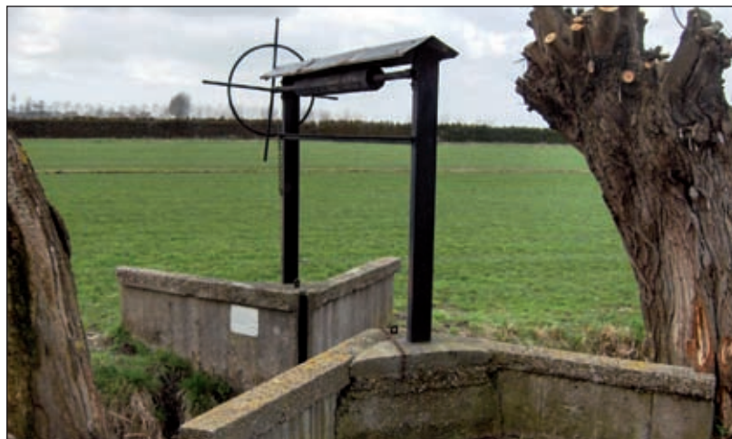
Nu, in 2009 is het sluisje aan de Koningin Wilhelminaweg weer opgeknapt. Dat gebeurde in 1979 ook al, maar het was weer hard nodig.