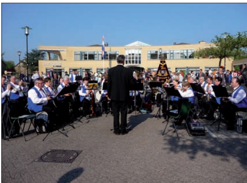
Kunst & Genoegen gaf met Koninginnedag 2009 ook al een openluchtconcert.

Naast de organisatie voor de Vaderdagmarkt is de activiteitencommissie