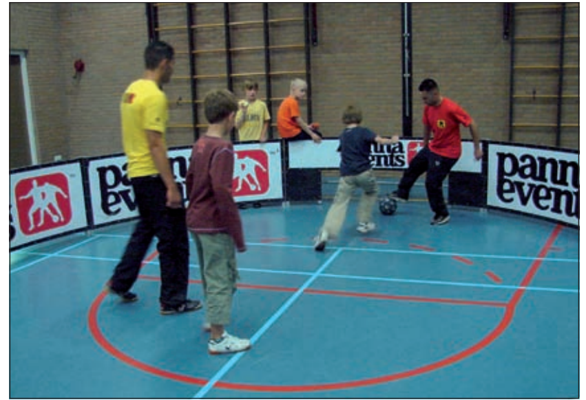
Kinderen uit Groenekan mochten zich meten in de gymzaal met de professionele jongens van pannaevents.