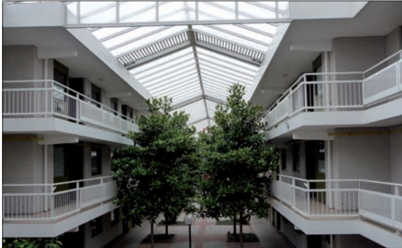
Om in aanmerking te komen voor een huurwoning in Dijkstate of Toutenburg moet men in ieder geval ingeschreven staan als woningzoekende bij Woonstichting SSW.

Om voor een appartement in aanmerking te komen dient men in ieder geval ingeschreven te staan als woningzoekende. De heer Corbee van Woonstichting SSW: 'Het is belangrijk dat mensen zich inschrijven als woningzoekende. Dat geldt zowel voor jongeren vanaf 18 jaar als voor 55 plussers. Mensen wachten vaak een tijd omdat ze denken nog niet aan een woning toe te zijn. Juist dan is het belangrijk om je in te schrijven. Er is al langere tijd een tekort aan woningen en het duurt daarom vaak toch wel enige jaren voordat je sowieso in aanmerking komt. Het criterium dat gehanteerd wordt is in eerste instantie de datum van inschrijving als woningzoekende'.