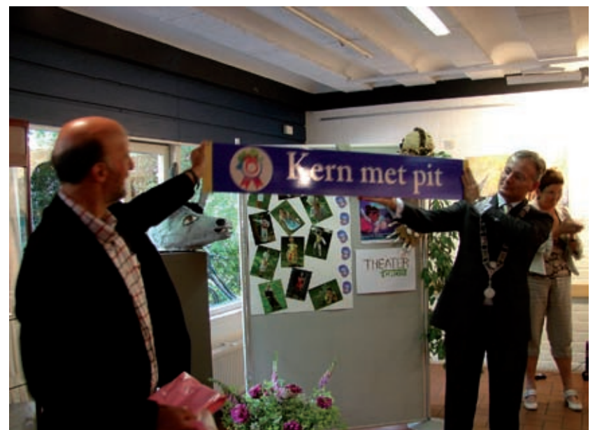
Twee projecten in Groenekan zorgden ervoor dat Groenekan de leefbaarheidswedstrijd Kern met Pit heeft gewonnen: de JOP voor de jeugd en het theaterstuk Midzomernachtsdroom dat vorig jaar werd opgevoerd op fort Ruigenhoek.

ze in een hoofdwatergang liggen inmiddels toebedeeld aan het waterschap De Stichtse Rijnlanden. Dat is ook verantwoordelijk voor het onderhoud ervan. Het Groenekans Landschap echter blijft er op toezien dat dat bij alle drie de sluisen op de juiste wijze gebeurt.