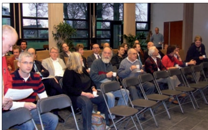
Het college heeft eerst op dinsdag 7 april jl. de omwonenden en de betrokken bedrijven geïnformeerd over de uitkomsten van de variantenstudie. Daarvoor werd een informatiebijeenkomst gehouden in het gemeentehuis.

Hoewel naar aanleiding van de tijdens de informatieavond gestelde vragen nog nader onderzoek nodig is, heeft het college gemeend niet langer te wachten met het publiceren van dat verslag. Burgemeester en Wethouders verwachten nog in het derde kwartaal van 2009 de raad te kunnen informeren over de uitkomsten van het nader onderzoek en over hun voorstel omtrent het verdere proces van besluitvorming over de aanpak van de restanten van de bunker. Het college heeft het verslag van de op 7 april 2009 gehouden informatieavond gepubliceerd op de gemeentelijke website en ook op de gebruikelijke wijze ter inzage gelegd [GG].