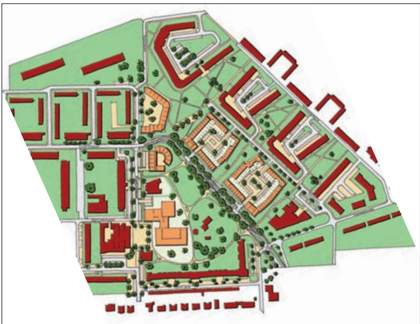
Het Project Melkweg.

Woensdag 3 juni organiseert de gemeente van 17.00 tot 19.00 uur een inloopavond over het cultuurhuis in de Mathildezaal van het gemeentehuis. Belangstellenden kunnen daar de maquette bekijken van het Project Melkweg en er vragen over stellen. De plannen werden eerder tijdens een informatiebijeenkomst eind september 2008 in het kantoor van de woonstichting SSW gepresenteerd