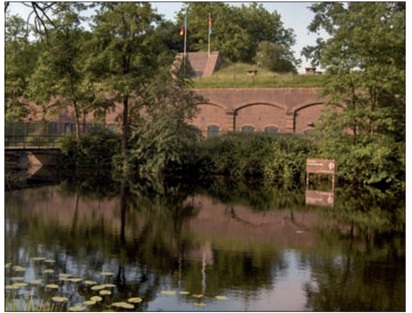
Op fort Ruigenhoek wordt hard gewerkt aan de opbouw van Kaap.

Kaap wordt georganiseerd door Stichting Storm, tevens organisator van het nationale jeugd- en jongerentheaterfestival Tweetakt. Tweetakt vond dit jaar plaats van 21 t/m 29 maart en presenteert hoogtepunten van afge-