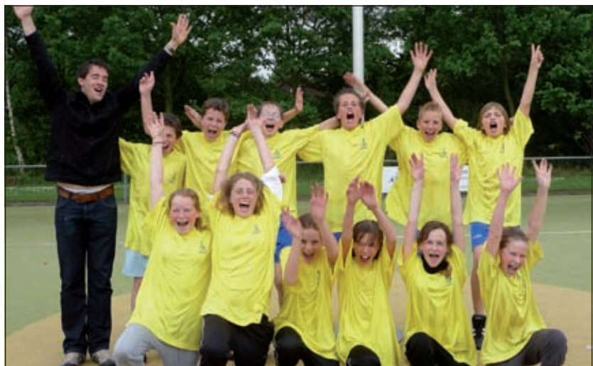
Groep 8 van Het Kompas.

's Middags werd er gestreden door leerlingen van de groepen 7 en 8. Hier ging de finale tussen groep 7 van de Martin Luther Kingschool en groep 8 van Het Kompas. De finale eindigde onbeslist en strafwerpen moesten een winnaar opleveren. Het Kompas scoorde net 1 keer meer dan de MLK en dus ging ook deze beker naar Westbroek.