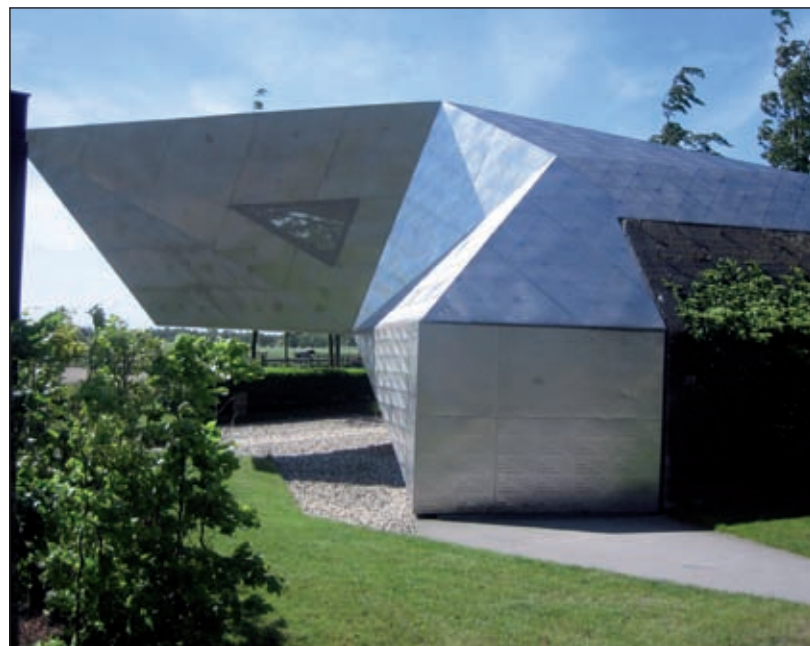
Een voorbeeld van een creatieve oplossing voor hergebruik van een bunker.

Daarmee wordt een oud monument als de bunker met een nieuw architectonisch ontwerp gecombineerd in een schitterende oplossing, die in het landschap is ingepast. Bilts Belang hoopt met deze en andere alternatieven dat voor alle partijen meerwaarde gaat ontstaan. Bilts Belang wil graag met ondernemers, financiers en ontwerpers in De Bilt in contact komen om een vergelijkbare oplossing tot stand te brengen.