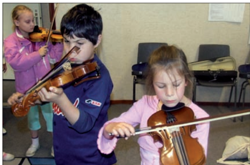
Een toekomstige maestro in actie.

Zaterdag 16 mei hield de muziekschool open huis met een uitgebreid programma. Bezoekers konden kennismaken met allerlei muziekinstrumenten die door leerlingen van de muziekschool werden bespeeld. Op het binnenplein van De Kwinkelier vonden de hele middag optredens plaats [GG].