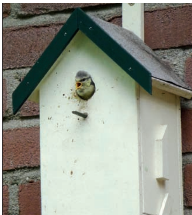
Negen koolmeesjes zijn vorige week donderdag uitgevlogen uit dit kleine nestkastje.