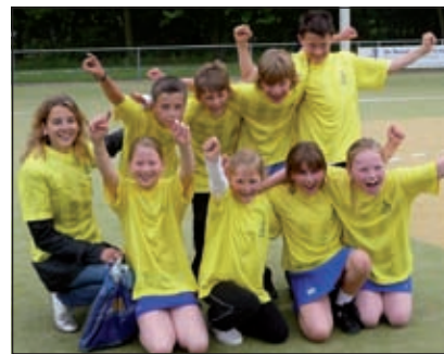
Groep 5 van Het Kompas.