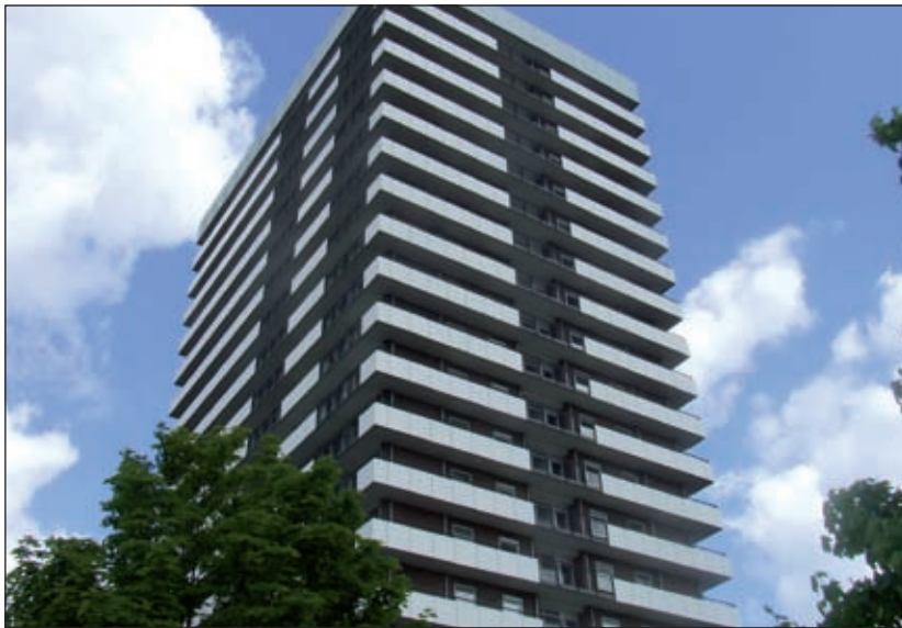
Het kantoor van de Verhuisadviseur 60+ is gevestigd in Flat De Hoogt, Beneluxlaan 2, Utrecht.

Het postadres van de Verhuisadviseur 60+ is: Het vierde huis, Verhuisadviseur 60+ Postbus 8037, 3503 RA Utrecht. Dagelijks bereikbaar van 09.00 tot 13.00 uur, behalve op woensdag. Telefonisch via 030-2958600 (Het vierde huis). E-mail: verhuisadviseur@vierdehuis.nl .