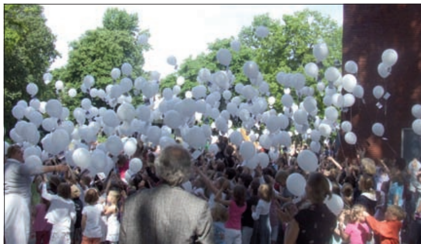
Honderden witte ballonnen om de dag van het vermiste kind onder de aandacht te brengen. Lees verder op pag. 7.