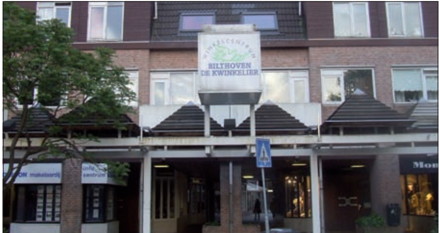
Over deze toegang heeft de welstandscommissie opmerkingen gemaakt.

Na de ondertekening vindt de concrete uitwerking plaats en worden de vergunningen aangevraagd. De opmerkingen op het projectplan uit 2005 van de welstandscommissie en de klank-