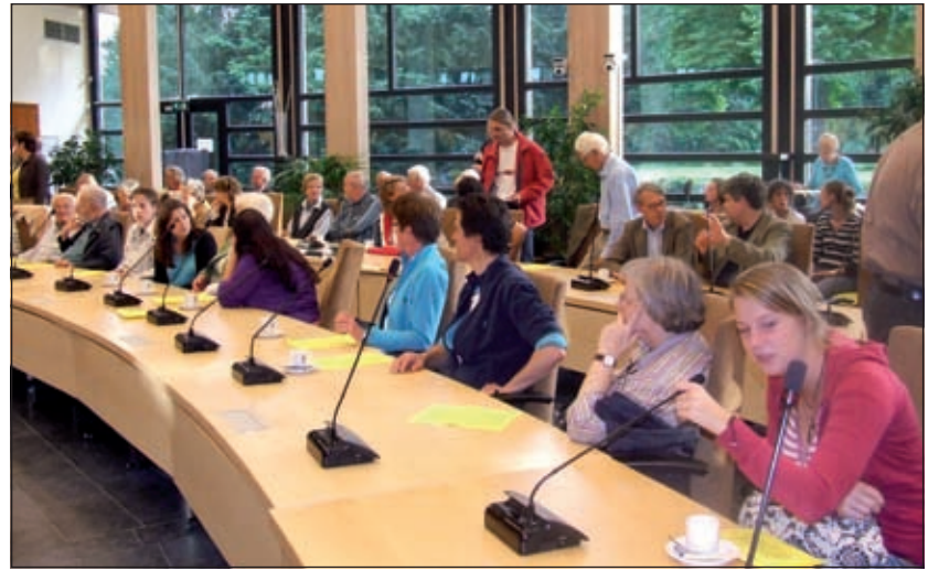
Nog nooit zoveel mensen bij een Europadebat.

SGP geldt: samenwerken waar nodig, maar verder alles zo laag mogelijk regelen.