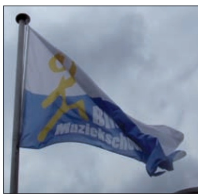
Natuurlijk hing de vlag met het logo uit.