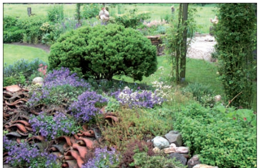
Iedere dag is anders, met steeds een andere kleur en dat in die heerlijke zoete voorjaarsgeur.

De tuin van de familie de Rooij is een jonge tuin die ze zelf hebben aangelegd op een zeer vruchtbaar stuk weiland. De tuin, waarvan het begin en eind gemarkeerd wordt door twee prachtige zeer verschillende vijvers, is dwars op de kijkrichting opgedeeld in stukken. Het is een echte liefhebberstuin met een grote diversiteit aan planten; er staan bijvoorbeeld meer dan 100 soorten rozen. Huisdieren worden niet toegelaten.