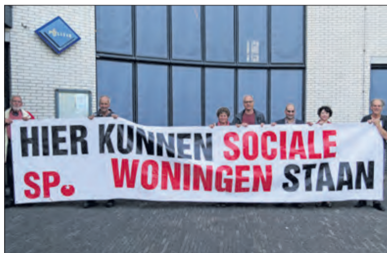
Voor het gemeentehuis demonstreerde de SP voor meer woningen.