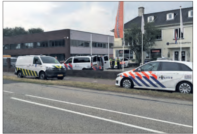
Met name het verzamelpand links naast de dierenarts aan de Tolakkerweg kostte veel tijd.

Burgemeester Sjoerd Potters is realistisch over de geconstateerde feiten: 'We moeten constateren dat de meeste bedrijven aan de Industrieweg hun activiteiten keurig binnen de regels uitvoeren. Ik had niet anders verwacht. Maar we moeten niet naïef zijn: er hoeft maar één