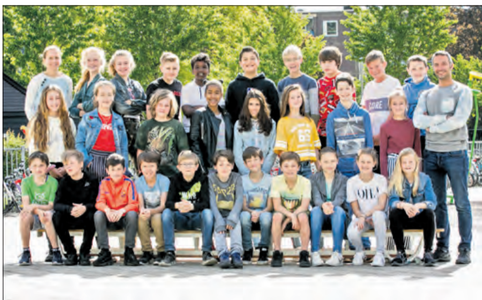
Groep 8 - De Regenboog