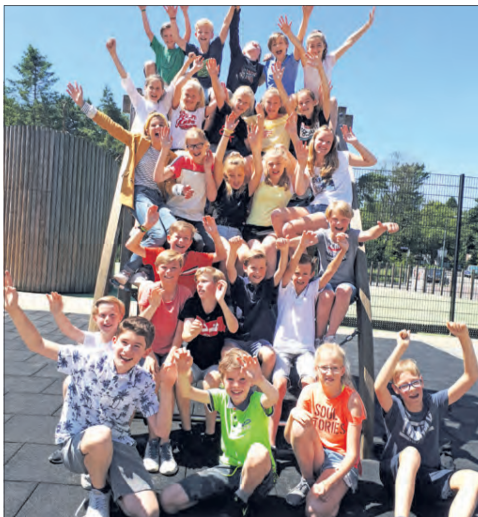
Groep 8A - St. Theresiaschool