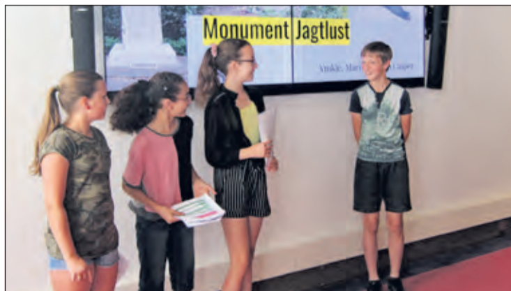
Leerlingen houden een presentatie over het oorlogsmonument, de 4 mei-herdenking en wat zij van de oorlog weten.