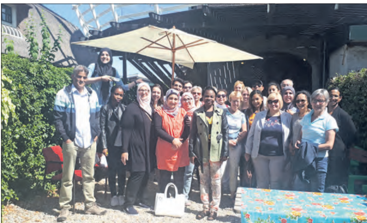
Deelnemers en docenten van Taalpunten bij de molen in Groenekan.