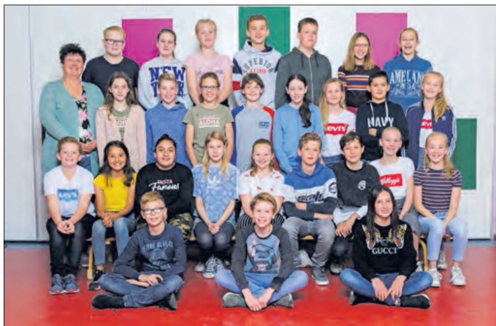
Groep 8 - De Rietakker