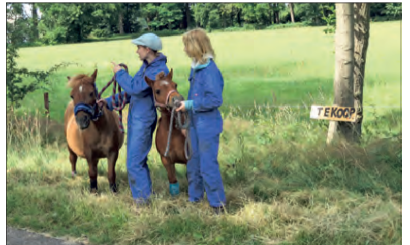
Twee boertjes wijzen er op dat een boerderijtje te koop is.