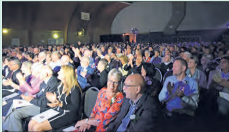
Zo'n 750 bezoekers geven de Marinierskapel een warm applaus.