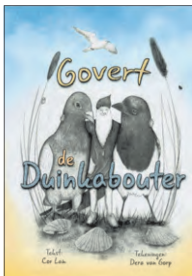
Elf leuke verhaaltjes in een handig boekje.