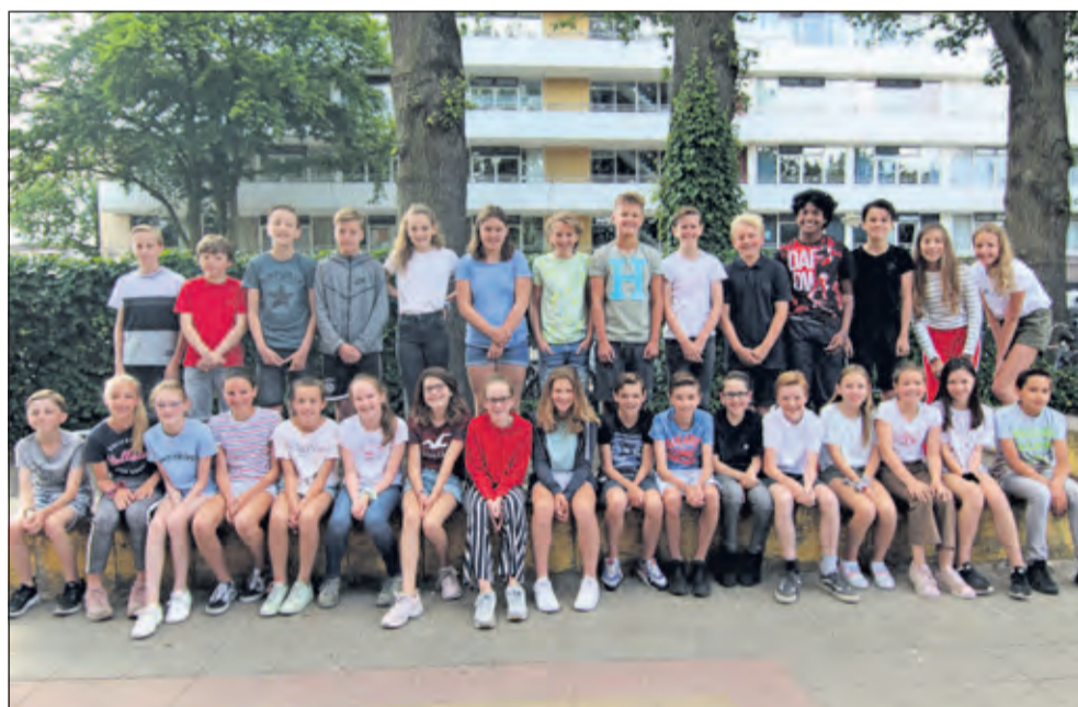
Groep 8A - Julianaschool