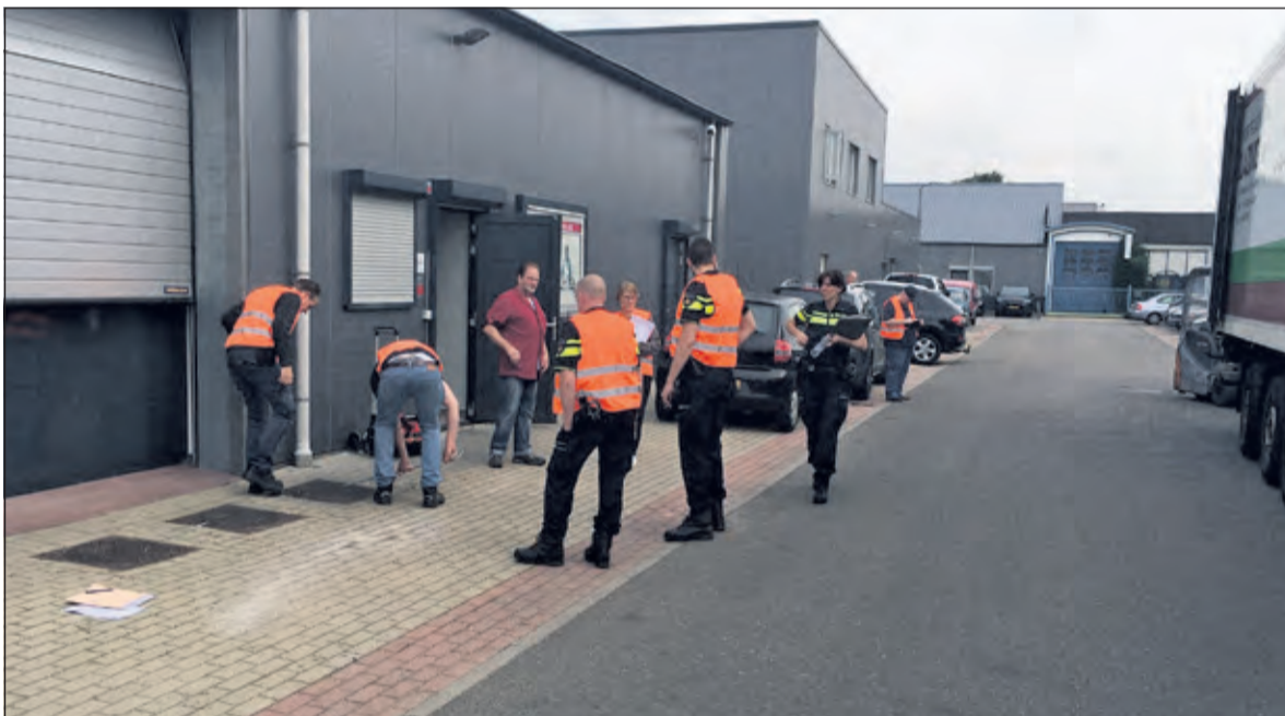
De meeste bedrijven zijn op deze manier bezocht door een team van diverse specialisten.

Zie ook de reportage van Roadtv op www.vierklank.nl