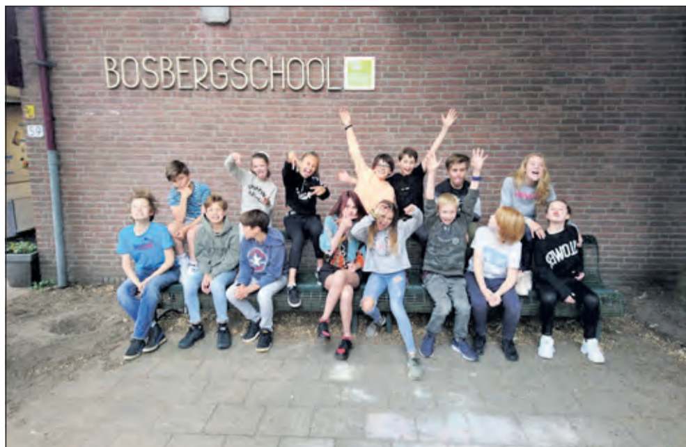
Groep 8 - Bosbergschool