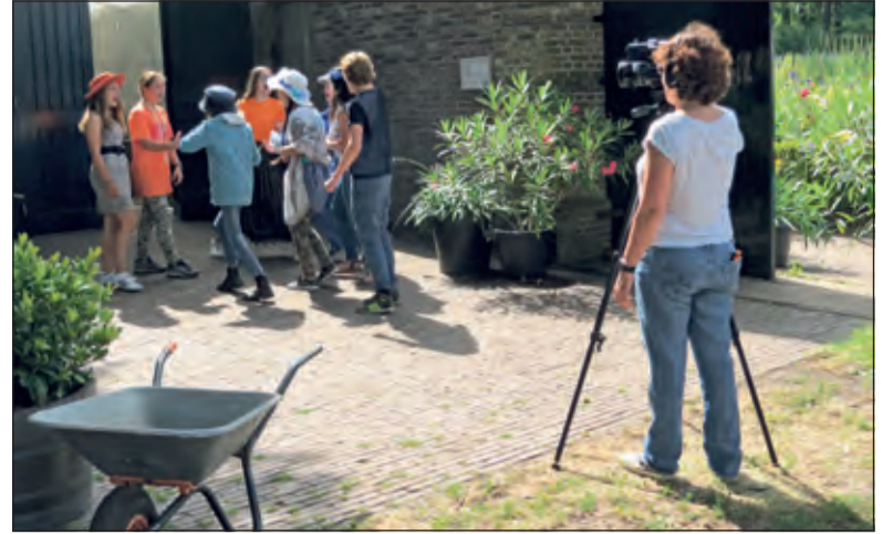
Patriotten en Prinsgezinden slaags met elkaar.