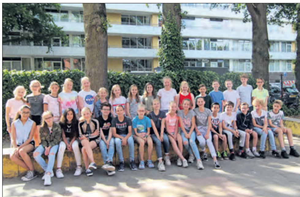
Groep 8B - Julianaschool