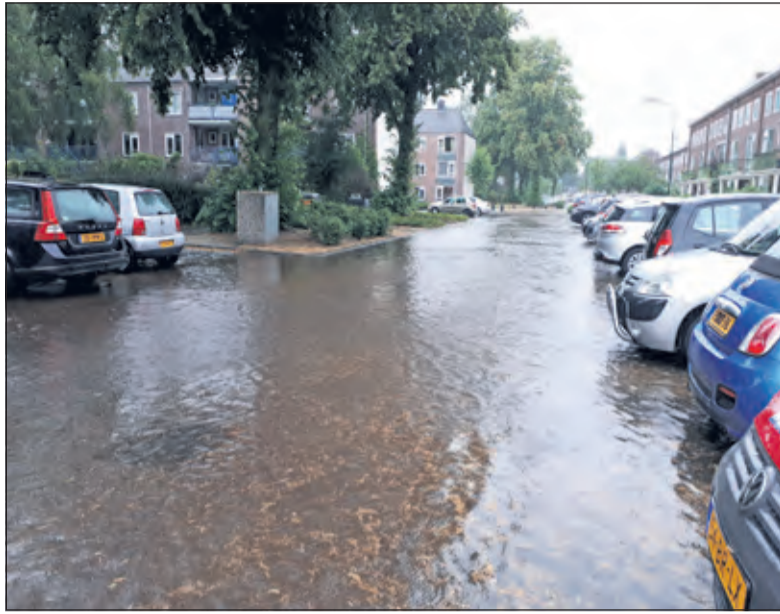
Plutolaan in Bilthoven veranderd in zwembad.

Een willekeurige plaats in ons land krijgt gemiddeld vijf keer per jaar een hoeveelheid regen van minstens 20 en 24 millimeter binnen een etmaal. Maar het kan nog erger. De meeste regen valt in de zomer, vooral uit onweersbuien. Zo kreeg De Bilt op 1 augustus 1917 een hoeveelheid van 62,3 millimeter in de regenmeter en op 19 juli 1966 viel hier 61,2 millimeter. Landelijk staat het record op 208 millimeter door wolkbreuken op 3 augustus 1948 in Voorthuizen. Uitzonderlijk was vooral de zware regen op 28 juli toen in een groot gebied in twee dagen meer dan 100 millimeter werd opgevangen. In deze eeuw waren de zomer van 2003 en 2013 met landelijk gemiddeld achtereenvolgens 119 en 137 millimeter in De Bilt de droogste zomers. De overige waren nat of zeer nat, de