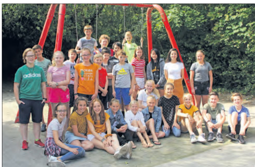
Groep 8 - Groen van Prinstererschool