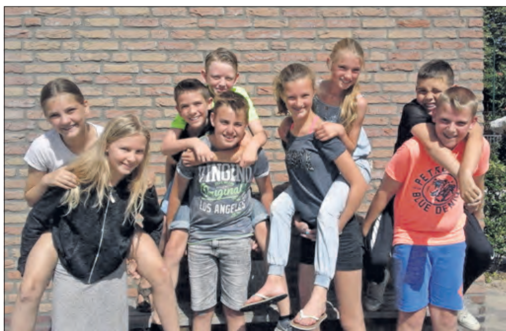
Groep 8 - 't Kompas