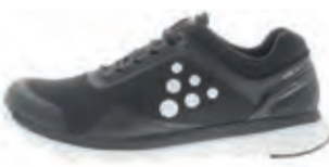
CRAFT V175 LITE M II | € 149,95

Sport, wandel en beweeg je fit met de Craft ademende zomer sneakers!