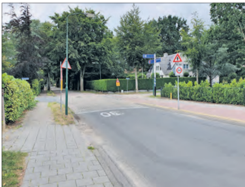
Het is niet altijd even druk op de Jan Steenlaan.

Vanuit gemeente De Bilt zijn diverse tellingen geweest in de omgeving Jan Steenlaan, te weten in de periode 6 april tot 19 april en tussen 20 mei en 2 juni. Zowel passerende auto's als fietsers zijn geteld. Naast aantallen werd ook gekeken naar de gemiddelde snelheid van passe-