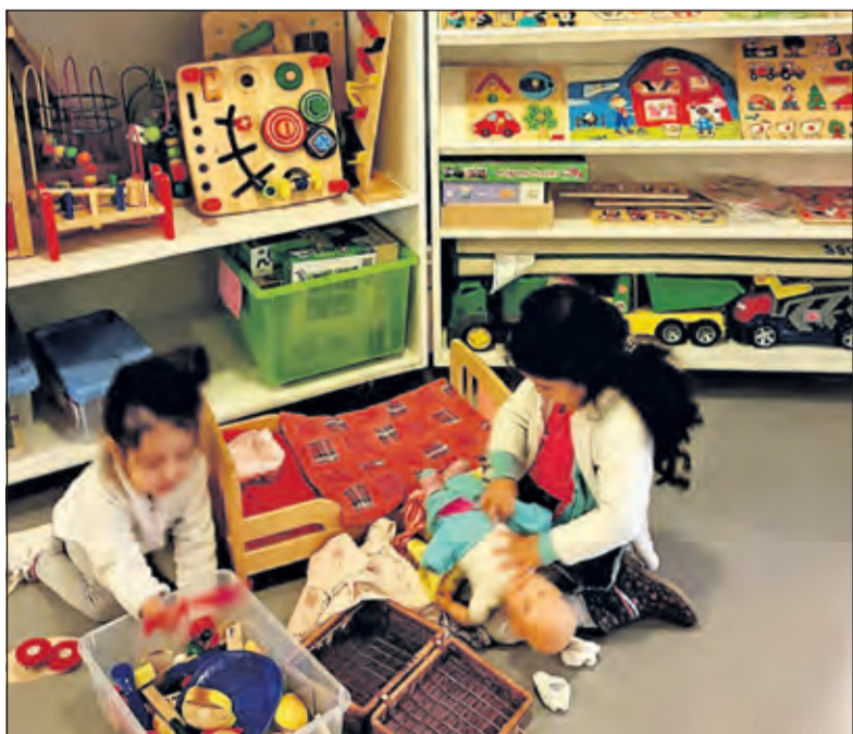
In de speeltheek is ruime keus aan speelgoed.