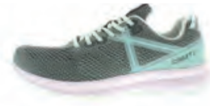
CRAFT X165 FUSEKINT W | € 129,95