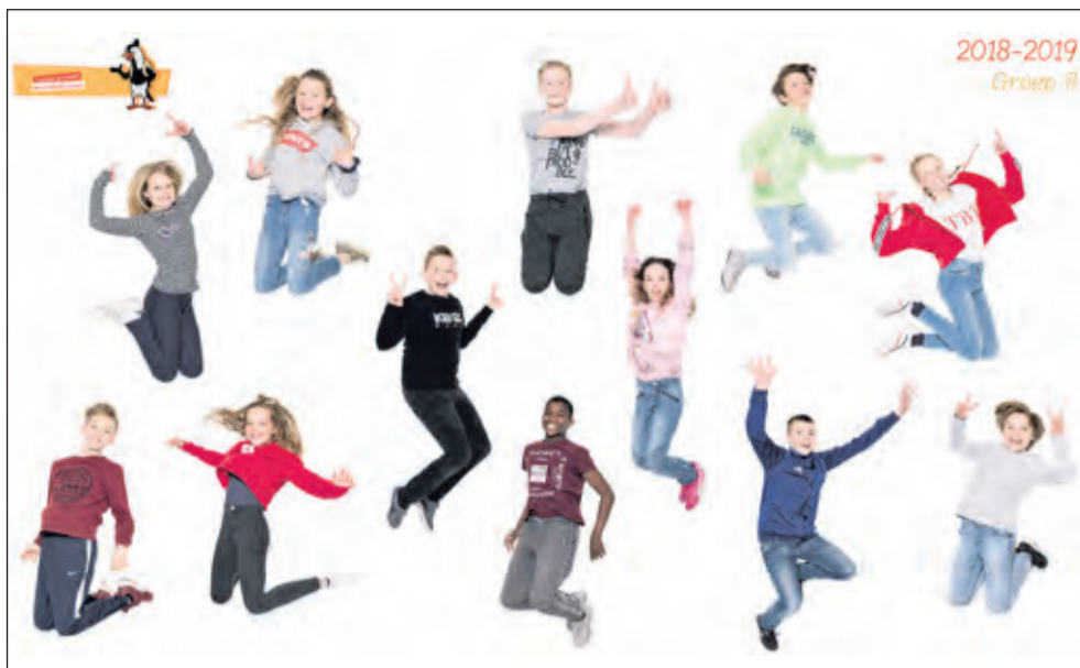
Groep 8 - Kievitschool