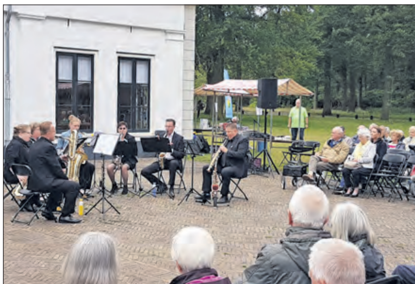
Prima weer tijdens dit zomerconcert. Op 8 september wordt de reeks afgesloten met een optreden van het Grootharmonieorkest van de Koninklijke Biltse Harmonie.

Donderdag Belangstellenden zijn welkom om op donderdagavonden tot en met 29 augustus te bridgen in het Dorpshuis van Hollandsche Rading. Aanmelding als bridgepaar bij voorkeur voor de betreffende donderdag om 17.00 uur via e-mail naar hc-hollandscherading@gmail.com of eventueel ter plaatse voor 19.15 uur. [HvdB]