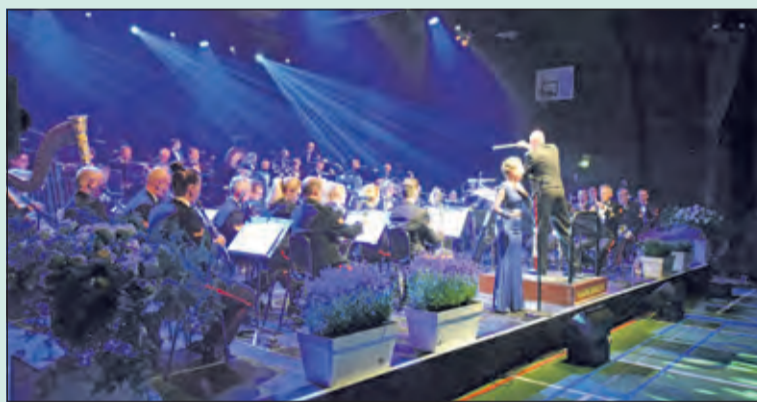
De Marinierskapel verzorgt een prachtig concert in het HF Wittecentrum.

Mogelijkheden op de (nieuwe) Algemeen Bijzondere Begraafplaats Maartensdijk