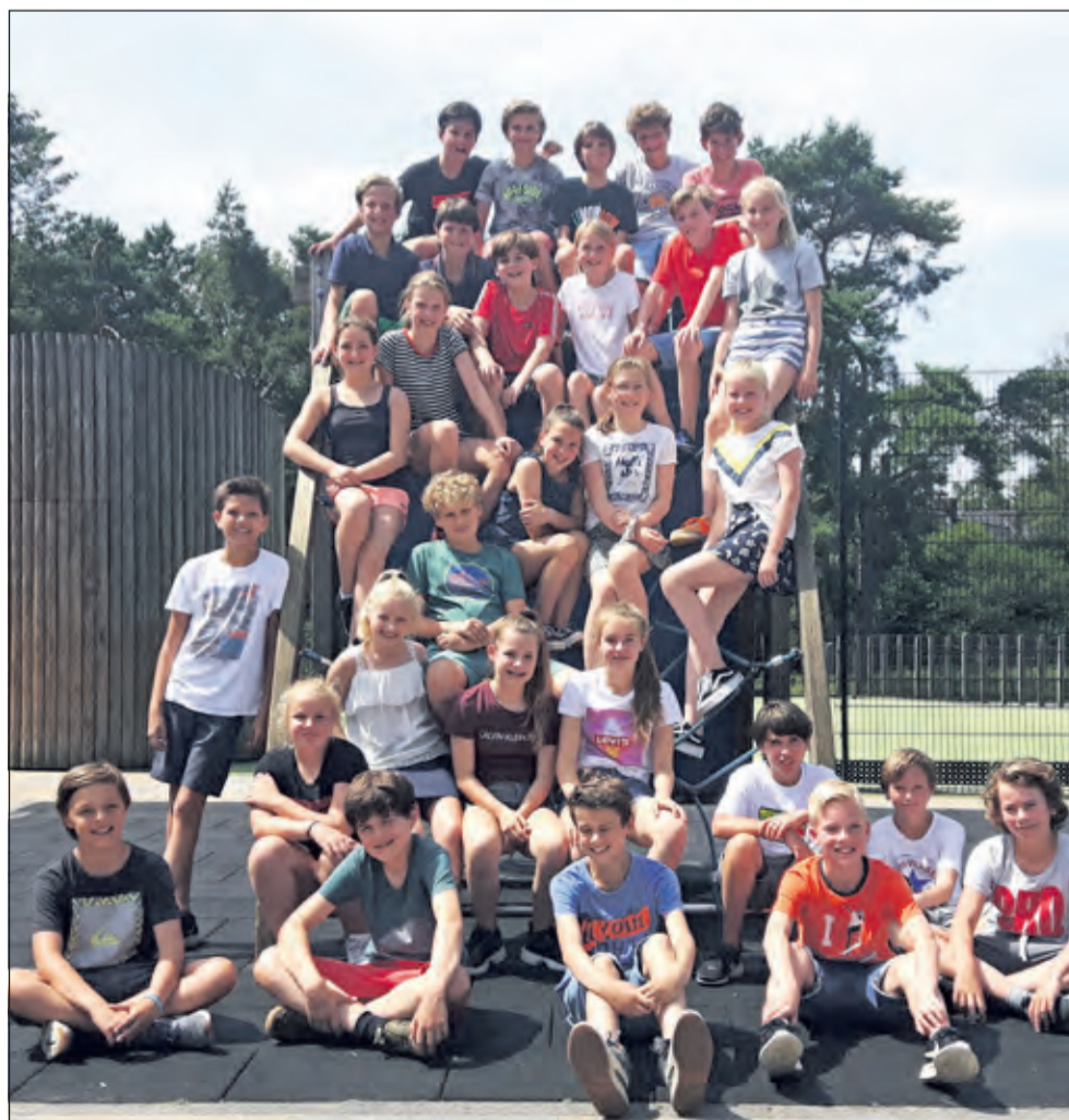
Groep 8B - St. Theresiaschool