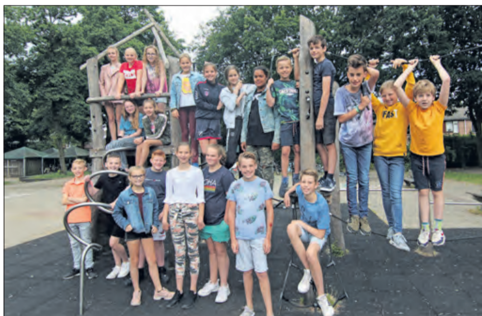
Groep 8 - Martin Luther Kingschool