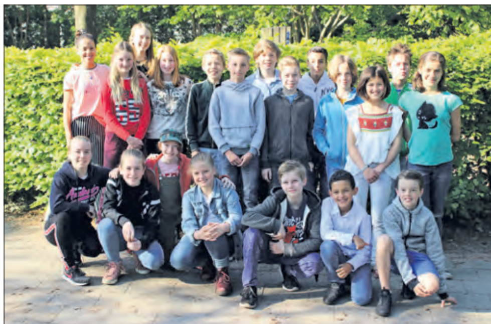
Groep 8 - Het Zonnewiel