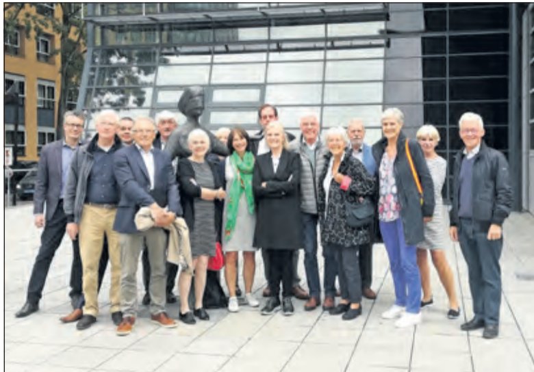
Een grote opkomst bij het beeld van Vrouwe Justitia op het plein voor de Rechtbank in Utrecht.

In het participatietraject voorafgaand aan het bestemmingsplan had HVB gedaan gekregen de bouwhoogte aan de Melchiorlaan met één bouwlaag te vermindern. Het bestemmingsplan werd vervolgens op de nieuwe afspraken vastgelegd: de goothoogte en de bouwhoogte aan de Melchiorlaan werden verlaagd. HVB: 'Het goedgekeurde bouwplan 'Vinkenplein' voldeed volgens HVB echter niet aan de regels van het bestemmingsplan, omdat onder andere de goothoogte van de gevels aan de Melchiorlaan naar haar mening aanzienlijk hoger is dan de regels van het bestemmingsplan toelaten. Met name