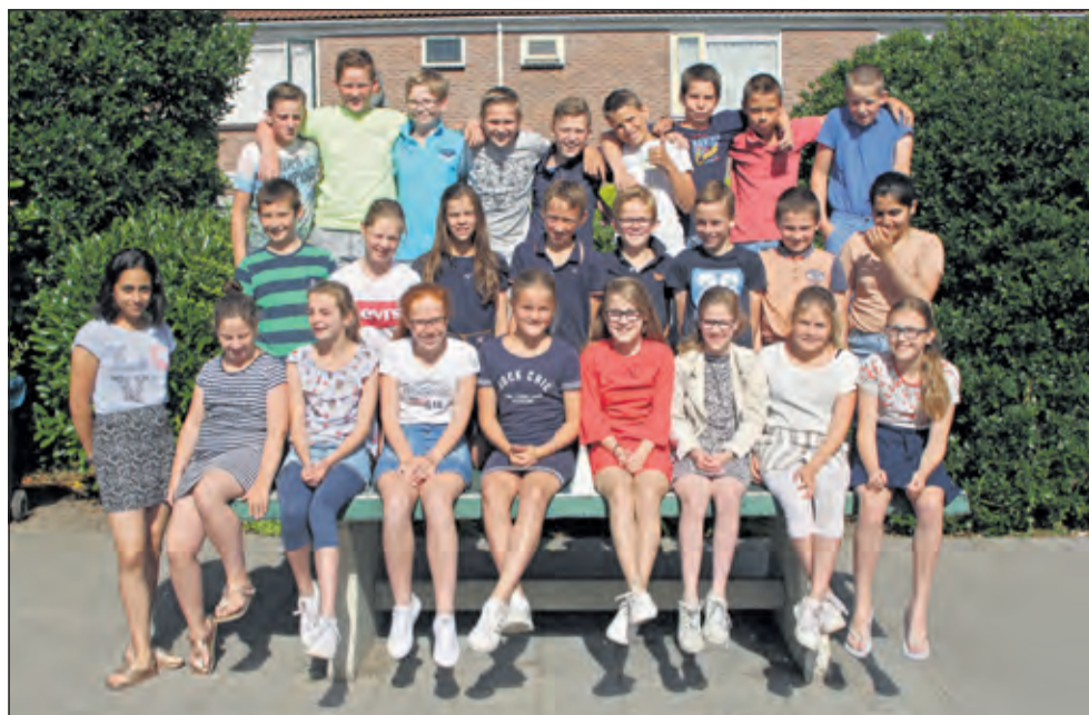
Groep 8 - School met de Bijbel