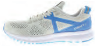
CRAFT X165 FUSEKNIT M | € 129,95