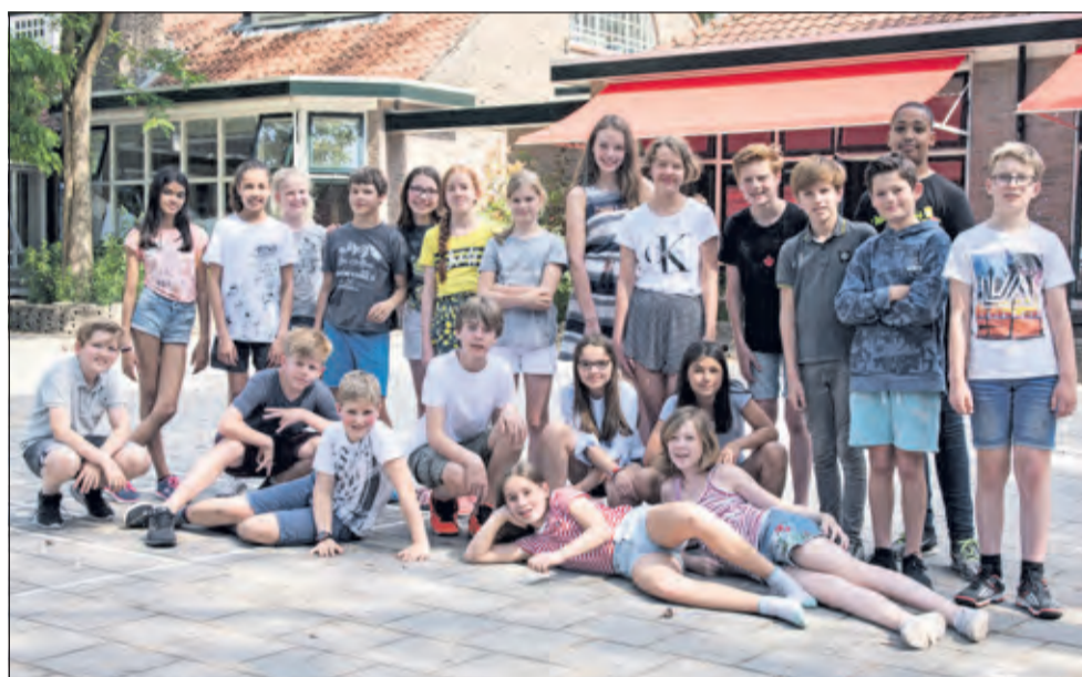
Groep 8 - Montessorischool