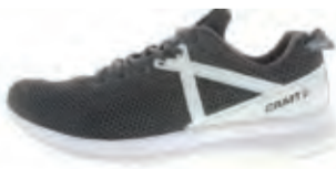
CRAFT X165 FUSEKINIT M | € 129,95