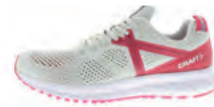
CRAFT X165 ENGINEERING W | € 129,95