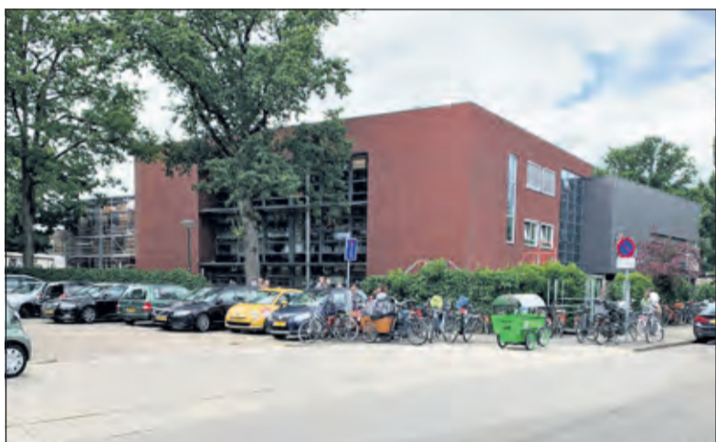
Spitsuur bij de Julianaschool.

Navraag bij de basisscholen, die thans gehuisvest zijn in Het Lichtruim in Bilthoven (Wereldwijs en (tijdelijk) Regenboog) leert, dat er door de tijdelijk wegomleggingen en beperkte bereikbaarheid rondom de Melkweg e.o. geen echte wijziging valt op de merken in het gedrag van leerlingen en ouders bij het vervoer naar en van school.