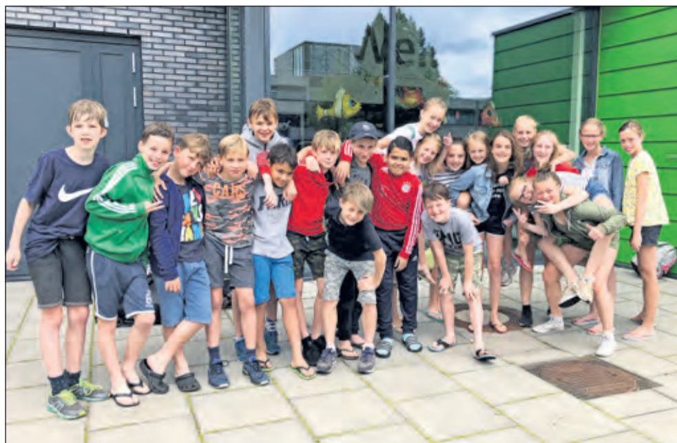
Groep 8 - Nijepoort