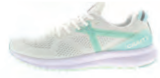
CRAFT X165 ENGINEERED W | € 129,95