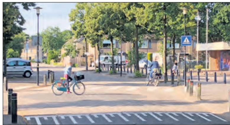
Het zebrapad bij de MLK school garandeert niet altijd een veilige overstek.

Echter, wanneer de kinderen naar huis toe gaan moet soms wel een drukke weg worden overgestoken. Het zebrapad zou een veilige overstek moeten garanderen. Helaas kunnen de kinderen er niet op vertrouwen dat automobilisten stoppen voor de overstekplaats. Regelmatig rijden automobilisten of fietsers door. Soms bewust, soms omdat de situatie rondom de overstekplaats onoverzichtelijk is door geparkeerde auto's. Wat opvalt is dat deze onveilige situatie vaak wordt veroorzaakt door ouders die hun kinderen met de auto naar school brengen en hen voor de deur willen afzetten. In het scholencomplex bevinden zich twee scholen, daarnaast zorgt de sporthal in de Vierstee ook voor de nodige ver-