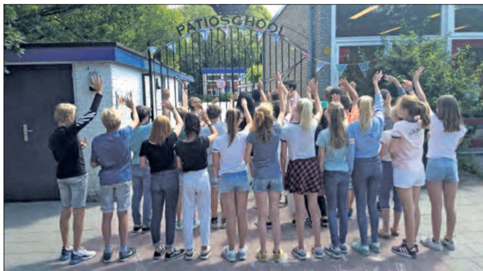
Groep 8 - Patioschool