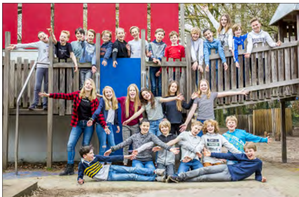
Groep 8 - Michaëlschool