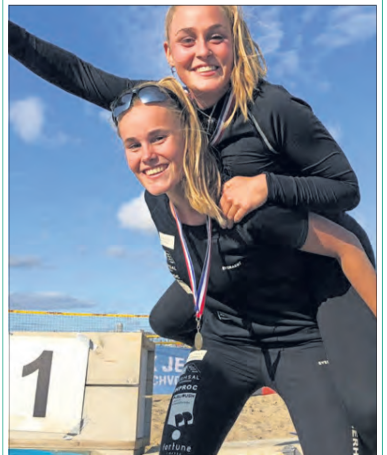
Grote blijdschap op het NK Jeugd.