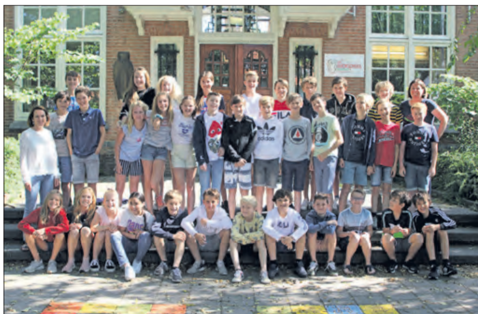
Groep 8 - Van Dijkschool