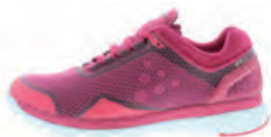
CRAFT V175 LITE W II | € 145,95

Deze schoenen hebben een uitstekende demping gecombineerd met een stabiele hak. De schoen is rekbaar en ontlast de voorvoet en hiel.