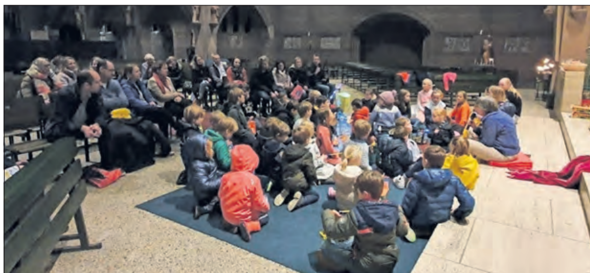
Ouders en kinderen luisteren geboeid naar het verhaal van Sint Maarten.

mandarijn, een zakje lekkers en een waxinelichtje om het licht met anderen te kunnen delen, trokken de kinderen weer de regen in. De zakjes snoep en mandarijnen die over waren, zijn 12 november naar de Voedselbank gebracht.