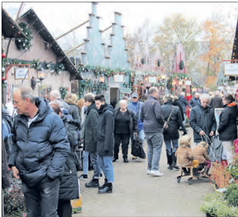
Het kerstdorp bij Vaarderhoogt trekt jaarlijks veel bezoekers.

Eén van de pleisterplaatsen in het dorp is het zéér verleidelijke Smulplein. Hier zijn allerlei eetentjes verzameld. Oliebollen, pofertjes, broodjes, snacks, koffie, thee, soep, warme chocola, warme worst en natuurlijk Glühwein. Op het Smulplein is ook het theaterpodium waar telkens andere koren, bands en artiesten optreden.