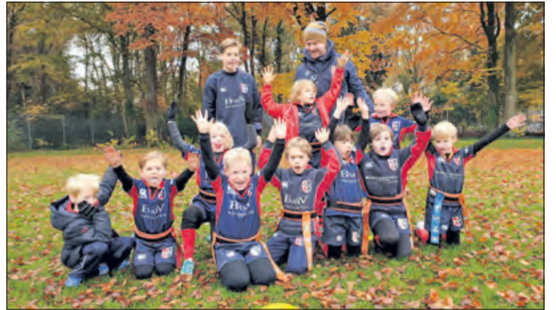
De U8 rugbyers zijn trots op de prestaties bij hun thuiswedstrijd

gen te houden. In de laatste minuten maakt URC de beslissende Try. Met 7-6 was het een reuze spannende wedstrijd en liet Stichtsche mooie vooruitgang zien met dit team. Zaterdag 23 november wordt er van 10.00 tot 12.00 uur weer thuis gespeeld.