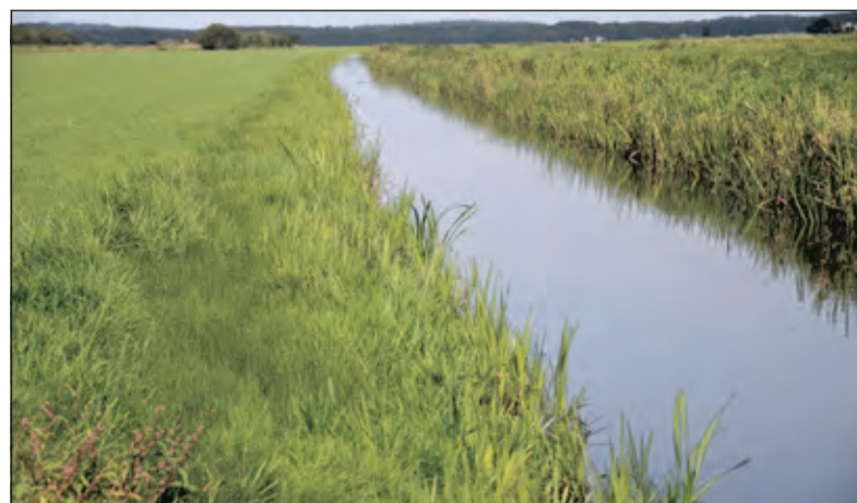
Verbetering van natuur- en waterkwaliteit staat op de agenda voor de boeren in het Noorderpark.

De bijeenkomst is op Landgoed Oostbroek, Bunnikseweg 39 te De Bilt voor wie mee wil praten over Boeren voor water en natuur. Aanmelden kan bij Hein Pasman van Landschap Erfgoed Utrecht, h.pasman@landschaperfgoed-utrecht.nl, tel. 06 46061745