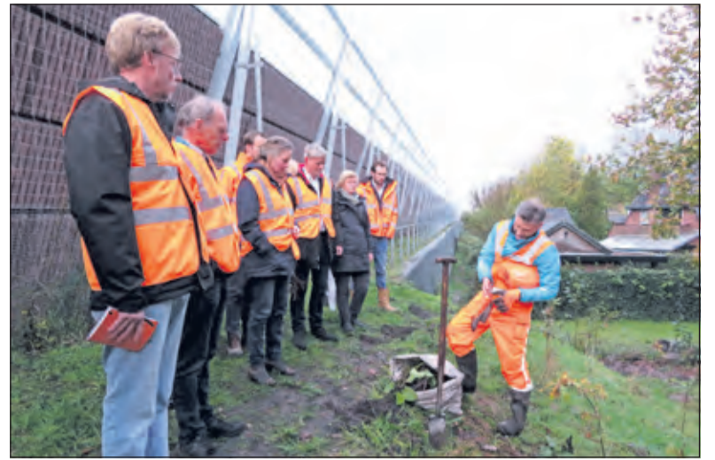
De positief ingestelde bewoners van Holl. Rading werden overtuigd van de daadkracht van RWS en 3Angle op dit dossier en gingen vervolgens de problematiek en bestrijding ervan ter plekke bekijken. (foto Adri Gerssen)

Er is geld binnen RWS vrijgemaakt voor de bestrijding van deze plant en er is met de bestrijders een contract afgesloten voor acht jaar. Maar men hoopt in vier jaar al goed opgeschoten te zijn. (Kees Floor)