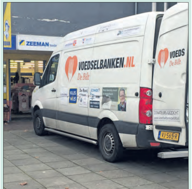
Het speelgoed wordt met de Voedselbank-bus opgehaald.