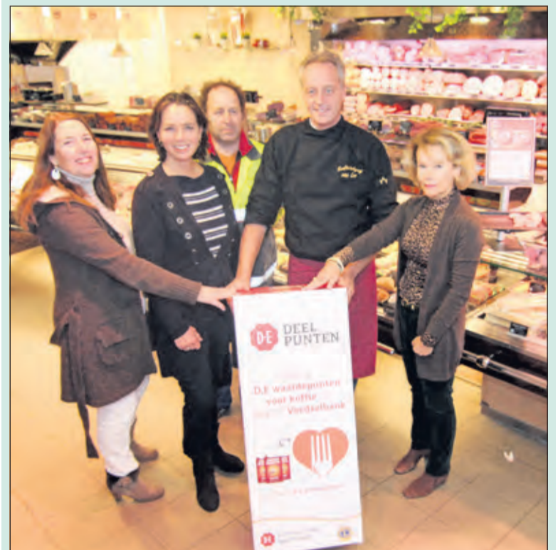
Eén van de dozen staat bij Slagerij van Loo aan de Biltse Hessenweg

Aan de Biltse schatkist blijkt wat te schorten en Den Haag is niet zo gul om bij te storten dat doet echt wel pijn want om sluitend te zijn moeten ze nu op veel dingen gaan korten