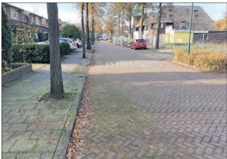
Met een te lage verkeersdrempel blijft de Jan Gossaertlaan een racebaan.

Nog meer minpunten: veel ouders met sportende kinderen rijden nog steeds veel te hard. Omwonenden aan de Jan Steenlaan ergeren zich groen en geel aan het gedrag van deze ouders. Ook appende jeugd