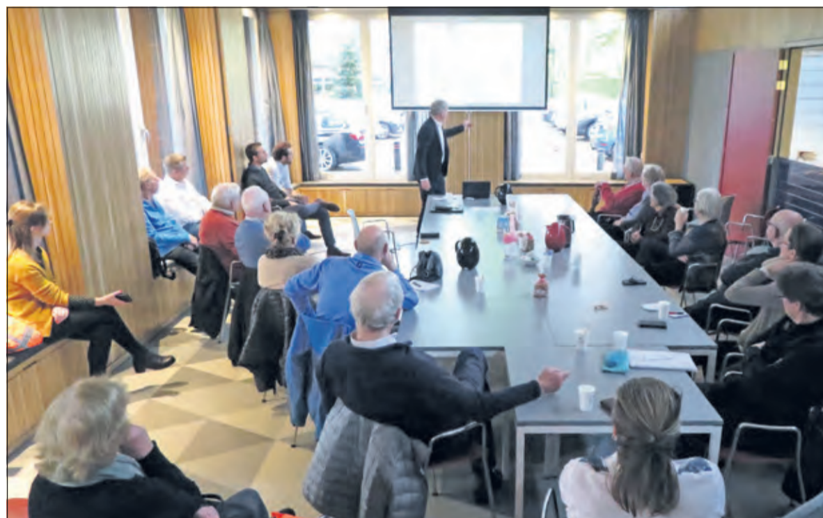
Informatiebijeenkomst in het Dorpshuis. (foto Adri Gerssen).