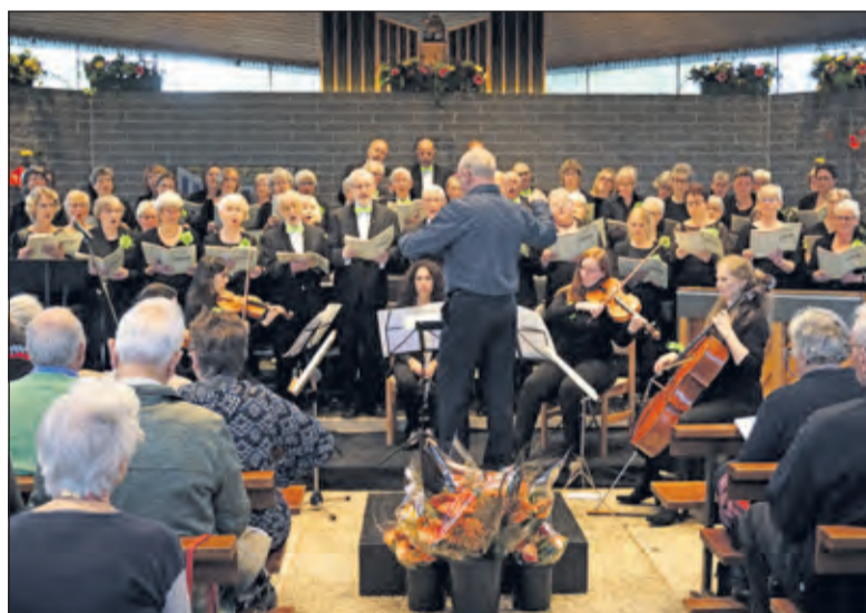
In een volgepakte Sint Maartensdijk zingt AZM haar jubileumfeest.

Vervolgens zong het koor haar En- gelse repertoire. De Spanish Sere- nade en het nummer As Torrents in Summer van componist Edward Elgar werd op gloedvolle en over-