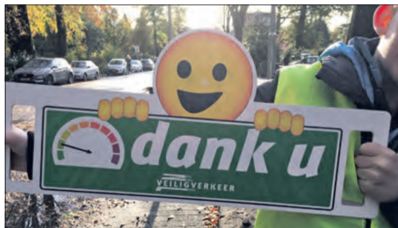
Leerlingen bedanken automobilisten voor hun verkeersgedrag.

menspraak met de buurt, school en de politie zijn er vervolgens drempels aangebracht. Ook zijn de belijning en de schoolzone verbeterd.