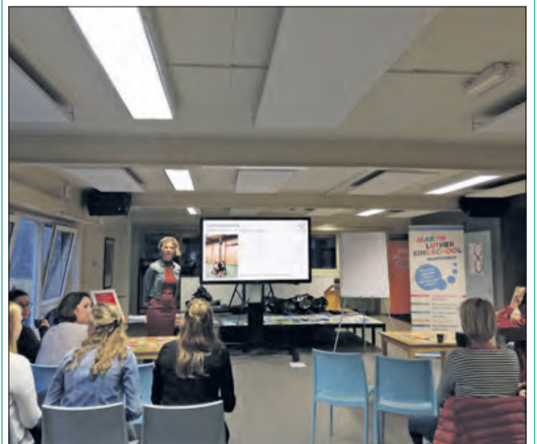
Leerkrachten van de MLK school in Maartensdijk geven een andere invulling aan de stakingsdag.