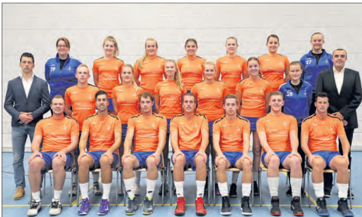
De selectie van DOS is klaar voor het zaalseizoen.

menaar Assen. Tegenstander AVO ontvangt op zaterdag 23 november DOS bij de start van het zaalseizoen. De wedstrijd begint om 17.00 uur. Voorafgaand spelen om 15.30 uur beide reserveteams tegen elkaar.