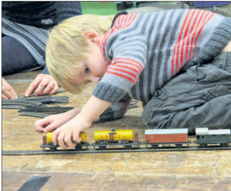
Eindeloos vermaak tijdens de Trix Express clubdag.

'De Schatkamer van Sint Nicolaas' is het thema van de internationale open club-dag van de Trix Express club, grootste Modelspoorclub van Nederland. Prominente modelspoor verzamelaars uit Nederland, Duitsland en België halen vele antieke en splinternieuwe Trix Express topstukken speciaal uit de vitrines om er in De Bilt het publiek mee te verwennen.