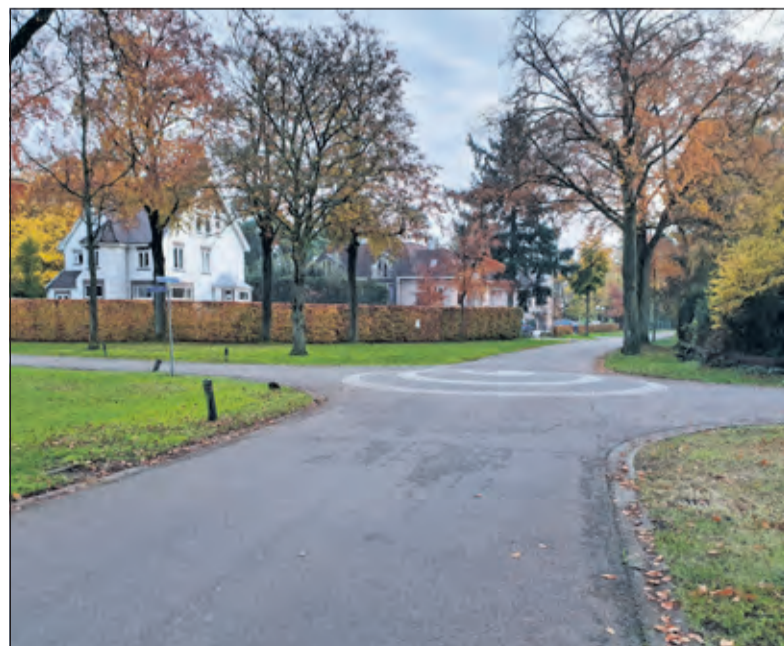
Hier ligt geen verkeersdrempel, waardoor automobilisten te hard rijden.