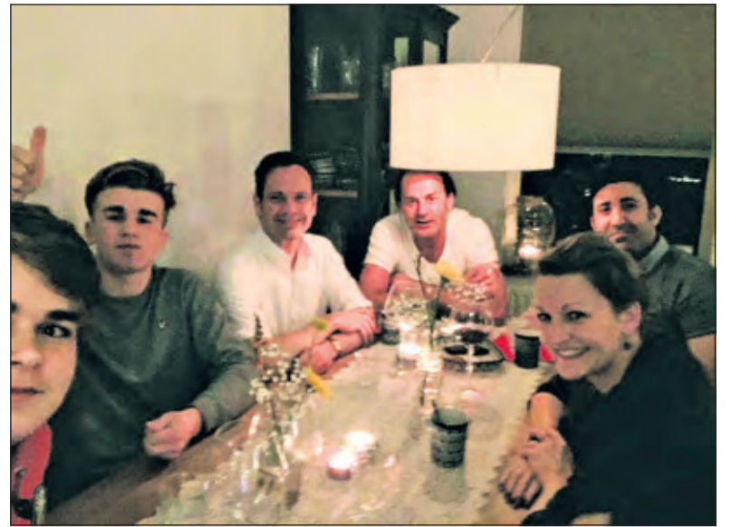
Gezellig natafelen bij de familie Winters.