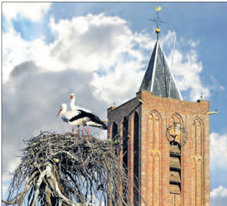
Ooievaars op hun nest voor de kerk van Westbroek.

verkoop; bij Van der Neut, Groenekansweg 5 in Groenekan, bij Kapper Hans Stevens, Maartensplein 26, Maartensdijk en bij de Bilthovense Boekhandel, Julianaalaan 1 te Bilthoven. (Frank Klok)