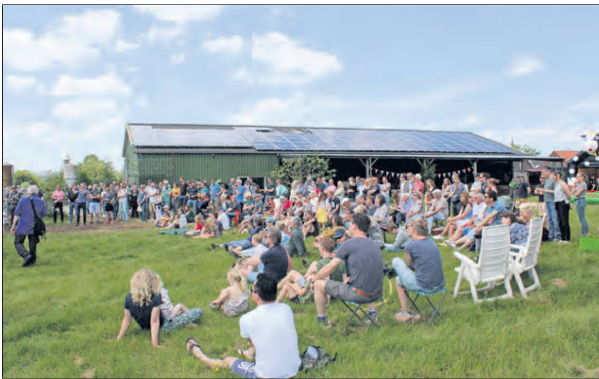
De belangstelling is groot. Bij de opening werd gesproken over plm. 480 leden, verzameld uit meer dan 220 gezinnen.

Huishoudens betalen eenmalig 2000 euro aan investeringskosten, zodat de boerderij opgestart kan worden. De wekelijkse contributie van de huishoudens betalen dan weer de salarissen van de boeren. 'Dit kost ongeveer een tientje per mond die gevoed moet worden, dus uiteindelijk is het niet veel duurder dan de supermarkt', zegt Mick.