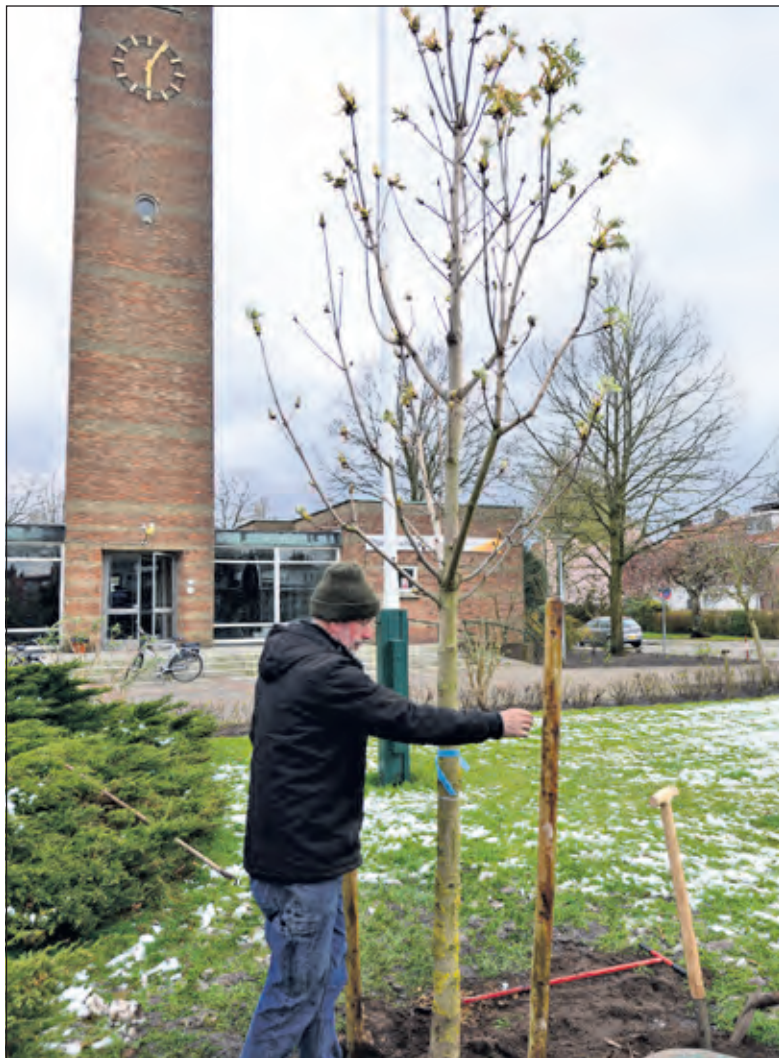
Op 1 april werden twee nieuwe kastanjebomen geplant.