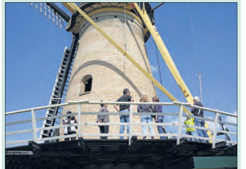
Bezoekers krijgen uitleg van de gids.