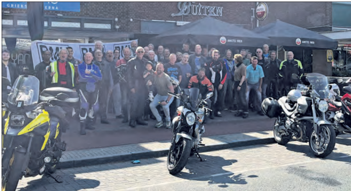
De jubileum-groepsfoto ter gelegenheid van 25 jaar BMV.

Voor meer info kunt u de website bmvmotor.nl raadplegen of bellen met Jan Verheul, 06 51348650.