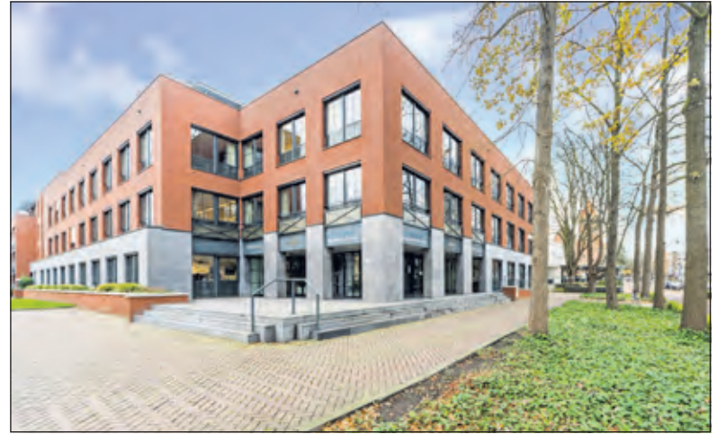
RSD helpt ZZp'ers en flexwerkers die door corona in de problemen zitten.

Met elkaar in gesprek gaan is noodzakelijk om tot een mogelijke oplossing te komen. Voor info : RSD tel. 030 - 692 95 00 of kijk op www.rsdkr.nl/ondernemers