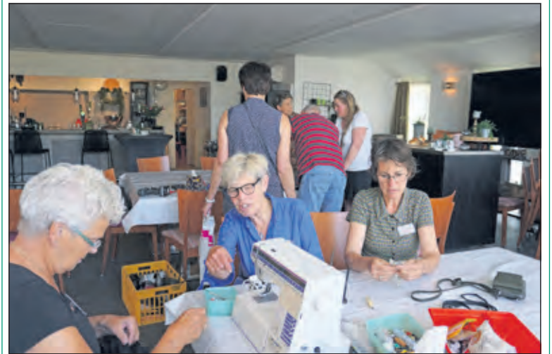
Zaterdag vond het Repair Café in Westbroek plaats in het Dorpshuis. Vrijwilligers gaven daar kapotte kleding, apparaten, fietsen etc. een tweede leven. Dit Repair Café bestaat dit jaar 8 jaar en wordt georganiseerd door de mensen van Westbroek Doet en andere Westbroekse inwoners.