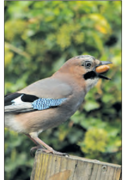
Gaai met eikel.

Aan zogenaamde veerluizen heeft de gaai een broetje dood. Hij heeft daar een goede oplossing voor, namelijk mierenzuur. Hij stopt met zijn snavel een mier tussen zijn veren. De mier wil zich natuurlijk verdedigen en spuit daarom mierenzuur naar de vogel. De gaai merkt hier zelf nauwelijks iets van, maar de veerluis kan er niet tegen