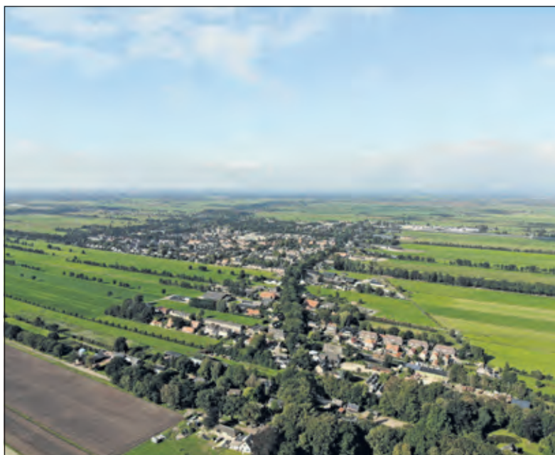
Een vergezicht van oost naar west in Maartensdijk.