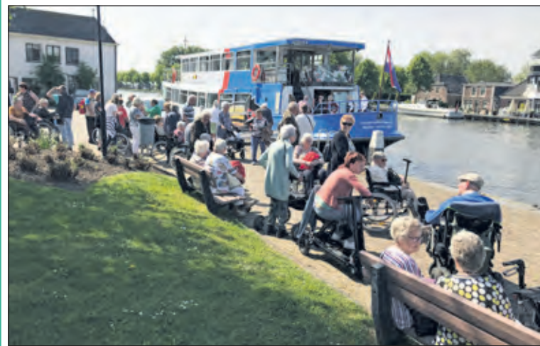
Zonnebloemgasten schepen in op de rondvaartboot.