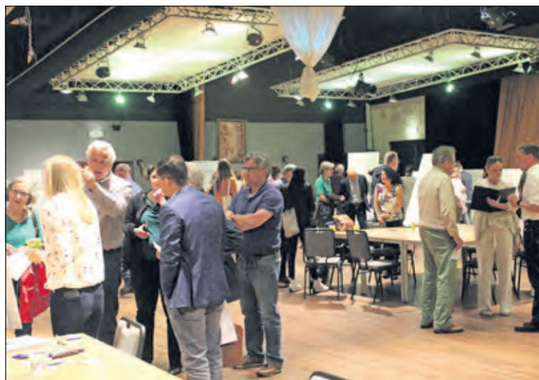
Het liep niet storm tijdens de Toekomstdialog.

staat ook in het tweede vergezicht centraal, maar hier is wel aandacht voor het bewaken en versterken van de vitaliteit van de gemeente. Zo wordt op basis van de eigen woningbehoefte gebouwd, waarmee de gemeente licht groeit. Er wordt in dit vergezicht meer aandacht gegeven aan het vergroenen van de bestaande stedelijke gebieden en het opkalefateren van verouderde bedrijventerreinen. Daarentegen leidt het uitbreiden (mogelijk buiten de rode contour) wel tot negatieve effecten op de omliggende natuurgebieden (vooral NNN en gemeentelijk groen).