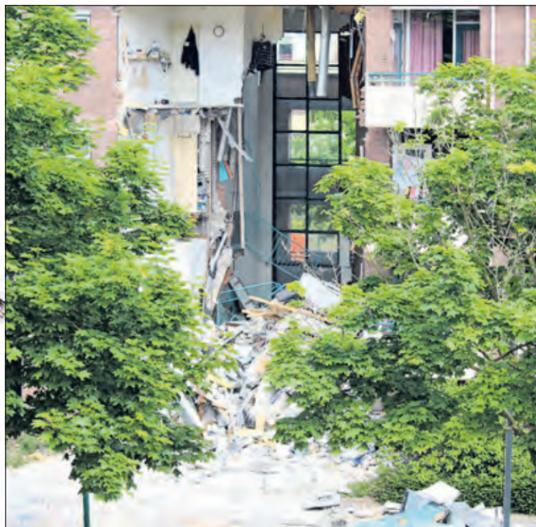
Het restant aan de Weegschaal (zuidzijde).

De afgelopen weken hebben de Onderzoeksraad voor Veiligheid, de Arbodienst en verzekeraars onderzoek gedaan naar de oorzaak van de explosies. Zij hebben het gebouw nu voorlopig vrijgegeven, maar zullen hun onderzoek voortzetten nadat het flatgebouw verder is veiliggesteld.