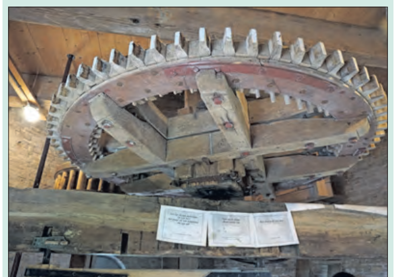
Het spoorwiel in het hart van de molen drijft de maalstenen aan.