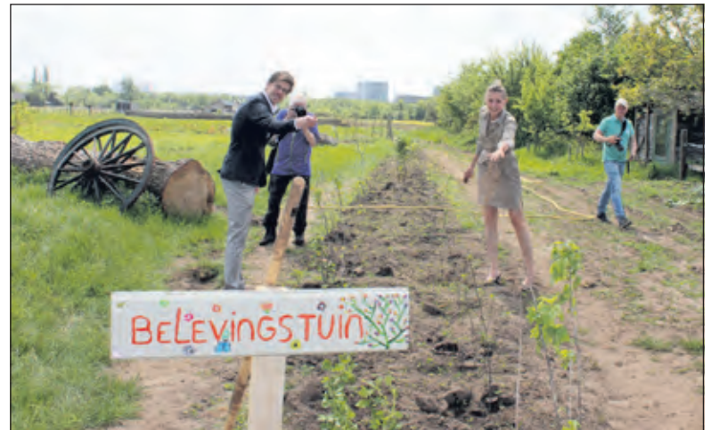
De wethouder vindt het mooi dat er zoveel enthousiasme is onder Biltse inwoners om mee te doen.