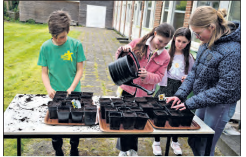
Op 12 april kreeg de plantactie bij de Dorpskerk een vervolg met het zaaien van zonnebloemen.

De bomen waren ook zeer welkom omdat zowel bij de Dorpskerk als bij de Oosterlichtkerk in de loop