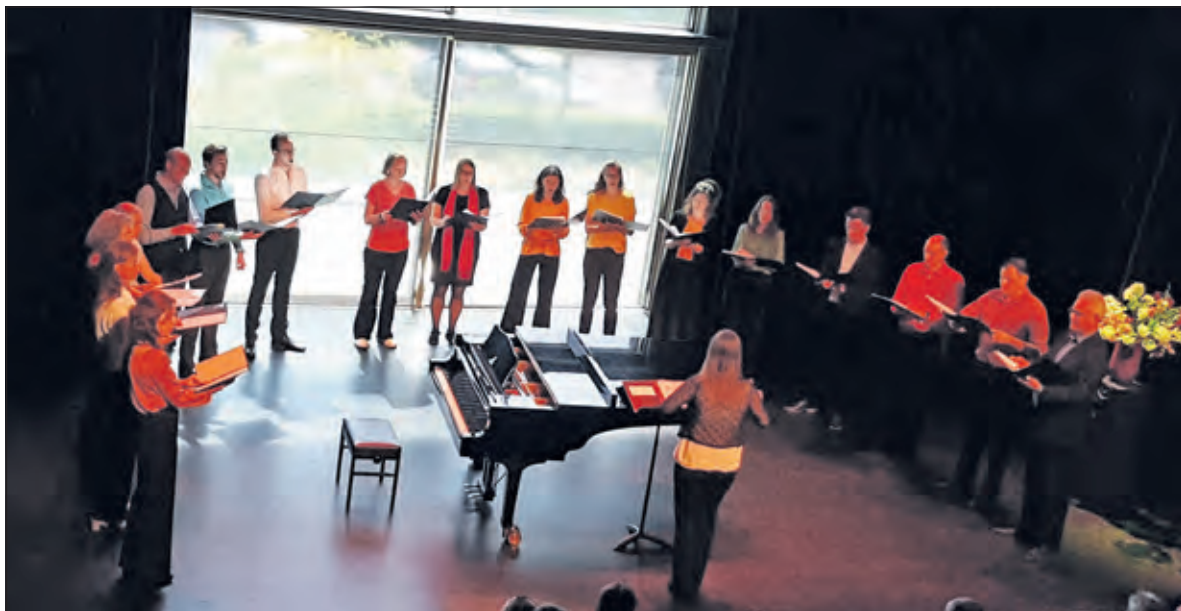
Kamerkoor Concerto Cherise brengt een ode aan de lente in Het Lichtruim.