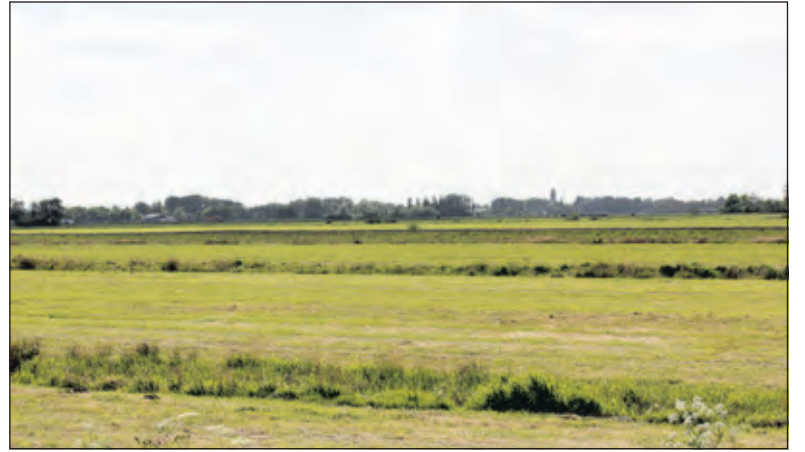
Een vergezicht van Oost(-broek) (Maartensdijk) naar West(-broek).

De komende maand worden alle resultaten in een participatieverslag verwerkt. Naar verwachting rondt men dit eind juni af en plaatst men e.e.a. op het participatieplatform www.doemeedebilt.nl . De opbrengsten van deze 2e Maand van de Leefomgeving zijn input bij het maken van afwegingen voor de gewenste ontwikkeling van de gemeente. Het college bundelt de belangrijkste keuzes in 'de Kern van de Visie'. Dit document wordt besproken met de gemeenteraad. Alle vervolgstappen op weg naar de Omgevingsvisie zijn opgenomen in de tijdlijn op www.doemeedebilt.nl .