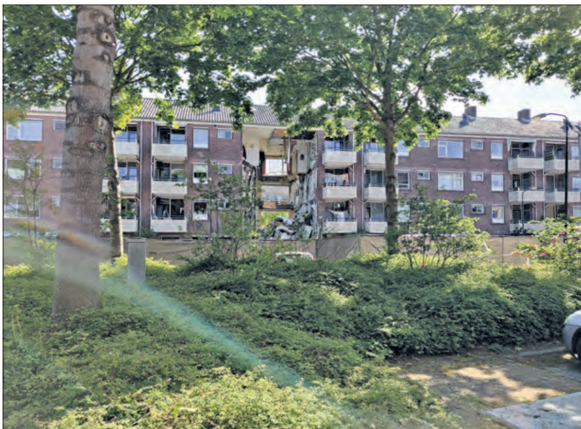
Het beschadigde flatgebouw.

Een deel van de bewoners uit de drie weken geleden door een explosie getroffen flatgebouw aan de Weegschaal in Bilthoven krijgt binnenkort de mogelijkheid hun woning kort te bezoeken. Daarna wordt de inboedel ingepakt en opgeslagen of verhuisd. Dit kan omdat toegang tot een deel van de woningen onder strenge veiligheidsvoorwaarden mogelijk wordt.