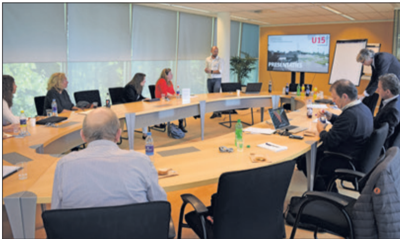
Voor de derde keer kwamen vertegenwoordigers van Biltse bedrijven en maatschappelijke organisaties bijeen om oplossingen te zoeken voor mobiliteit.

Op het gebied van bedrijfsvoering valt ook nog heel wat winst te behalen: de leasevoorwaarden voor auto's kunnen worden versoberd en worden vervangen door mobiliteitsbudgetten, waardoor de werknemer keuzevrijheid heeft voor zijn mobiliteit. Via een nieuwsbrief van bijvoorbeeld de U15 kunnen bedrijven elkaar tips geven en nieuws delen op het gebied van duurzame bereikbaarheid en mobiliteit, en moeten zij meer doen aan gezondheid van het personeel, zoals het Vitaliteitsprogramma bij Sweco. In een volgende bijeenkomst worden de oplossingen verder uitgewerkt. Deelname aan de bijeenkomsten en/of gratis advies kan via www.U15.nl