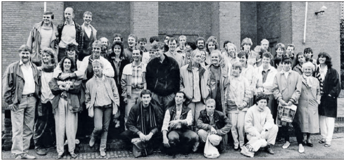
Het koor rond 1985 voor de kerk.

Hoogtepunt in de jaren zeventig was de Nederlandstalige uitvoering van de rockopera Jesus Christ Superstar, waarmee het koor door het hele land trok. De koor- en bandleiden vertaalden zelf de teksten vanuit het Engels. Deze versie was de eerste en lange tijd de enige Nederlandstalige uitvoering. De kroon op het werk was de plaatopname in 1973. Ook de uitvoering van de door Rob Kops gecomponeerde rockopera Samson tijdens de viering van het 15-jarig bestaan van het koor in 1983 was een hoogtepunt. Wat in 1968 begon als een klein maar enthousiast gezelschap is in de loop van de tijd uitgegroeid tot een succesvol jongerenkoor, dat zowel bij jong als oud de harten wist te stelen. De laatste periode van het 21-jarig bestaan heeft Kees van Miltenburg het koor geleid. Maar door beperkende en dwingende voorschriften van hogerhand hield het jongerenkoor er in 1989 mee op'.