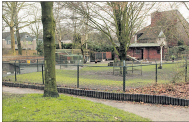
Voor ruimere openingstijden van de dierenweide in Maartensdijk zijn meer vrijwilligers nodig.