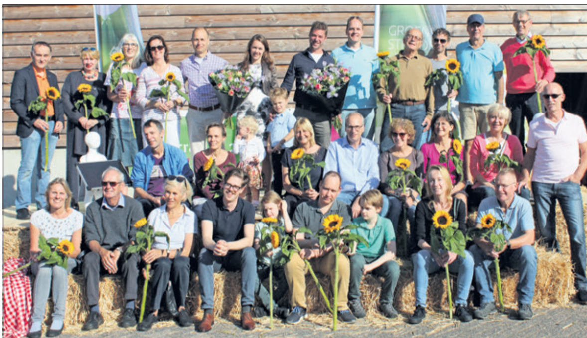
Deelnemers ontvingen een toepasselijke zonnebloem.