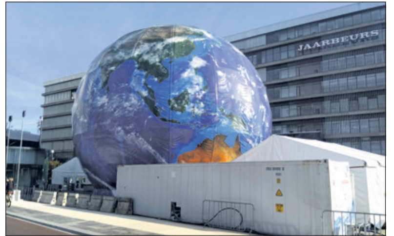
Tot 3 november staat deze werldebol met de hoogte van een gebouw van zes etages op het nieuwe Jaarbeursplein in Utrecht.

Wethouder Dolf Smolenaers vertelde de gehele week al met Duurzaamheidsthema's in de weer te zijn geweest: 'Eerder was ik er al met de fiets op uit in Hollandsche Rading. Ook was ik deze week op uitnodiging met politieke collegae te gast in Utrecht bij de internati-