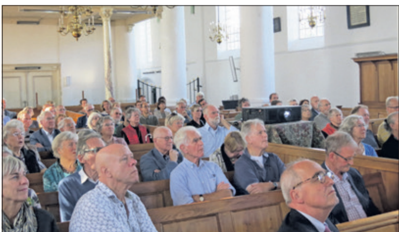
De goed gevulde Hervormde Kerk van Westbroek.