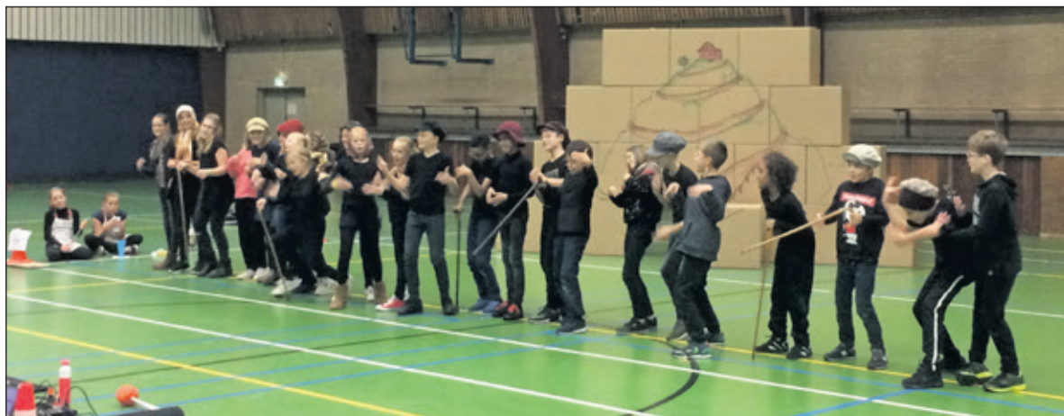
Leerlingen zetten hun beste beentje voor in de voorstelling 'De Reuzenperzik'.