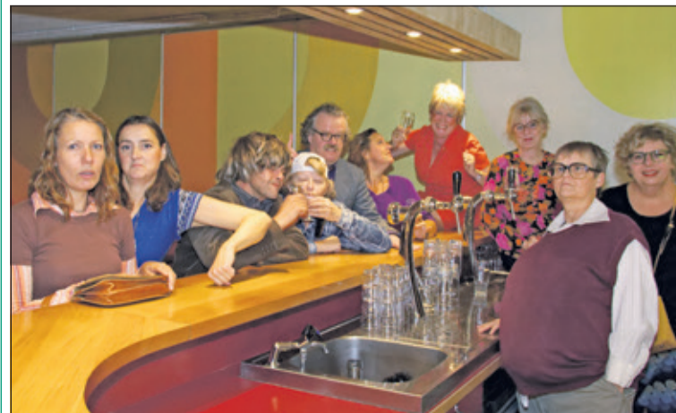
De cast van Sojater oefent aan de bar van De Vierstee.

De voorstellingen zijn op vrijdag 2 en zaterdag 3 november, vrijdag 9 en zaterdag 10 november in De Vierstee in Maartensdijk. Aanvang voorstelling 20.30 uur. Kaarten zijn tel. te bestellen via telnr. 0346 213635 of op www.sojater.nl. Tevens kunnen kaarten gereserveerd worden bij de Primera in Maartensdijk.