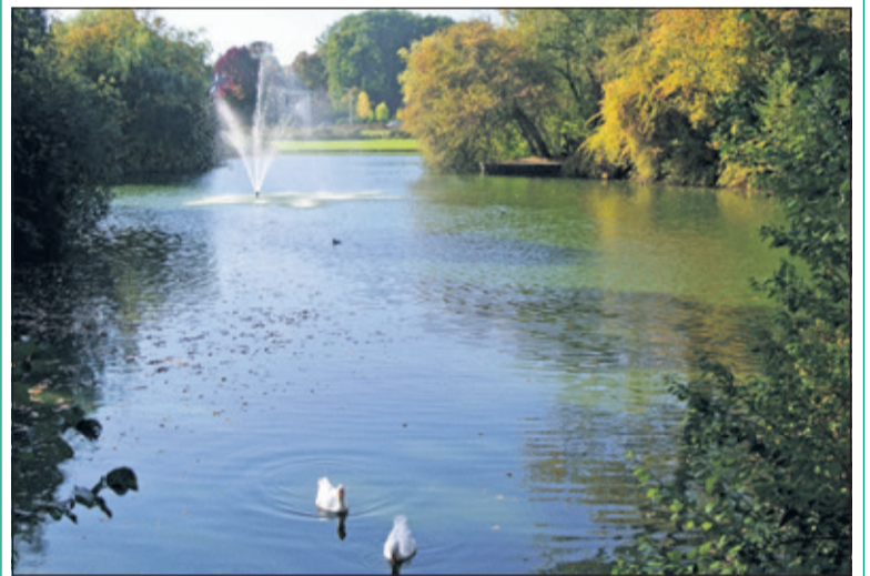
Ondanks de hoge temperaturen is het toch echt herfst in het Van Boetzelaerpark.