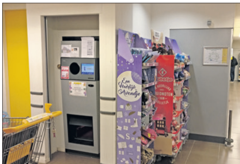
Naast de lege-flessenautomaat, op de plaats waar nu nog peppernoten staan, zullen straks met name lang-houdbare producten voor 'dorpsgenoten in nood' staan.

in het magazijn en op de koelbus, wekelijks om de pakketten samen te stellen en om de afnemers te begeleiden. Dat vergt ook organisatorische ondersteuning, onderhoud van de website e.d. De Voedselbank zal nieuwe vrijwilligers dan ook met open armen ontvangen, vooral voor de ICT, het secretariaat en voor het voeren van acties als van de Jumbo.