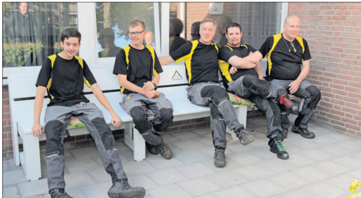
Na gedane arbeid is het goed rusten op het bankje bij De Vierstee in Maartensdijk.