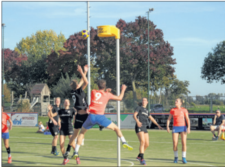
Gevecht om de bal.

DOS kende een goede start en kwam met 2-0 voor, maar Unitas wist weer snel langszij te komen. Halverwege de eerste helft, bij een 3-4 stand, kwam er een lange periode dat Unitas niet wist te scoren. DOS bouwde in die periode met goed spel naar eerst een 6-4 voorsprong bij rust, die later werd uitgebreid naar een ruimere voorsprong