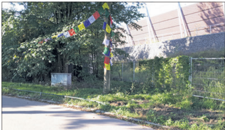
De versierde boom aan de Spoorlaan die eventueel het 'loodje' zou leggen als op deze plek ondergrondse afvalcontainers zouden worden geplaatst.

Vervolgens werd er koffie gedronken in het Dorpshuis waar om deze tijd wekelijks 'Leut' bij elkaar komt. De wethouder had namens de gemeente versnaperingen bij de koffie meegenomen: volledig verantwoorde chocoladekoekjes (fair trade, biologisch en duurzaam). In Hollandsche Rading westzijde werden Schaapsdrift, Tolakkerweg en de nieuwe bouwlocatie op het voormalige tuincentrum aangedaan. Tot slot werd bij het bezoek aan dit deel van Hollandsche Rading aan de wethouder het verschil duidelijk gemaakt tussen het 'vierkantje' en het 'rondje'. Aan het einde bedankte de wethouder alle aanwezigen voor de informatieve ochtend. Hij zei veel nieuwe dingen te hebben gezien en gehoord.