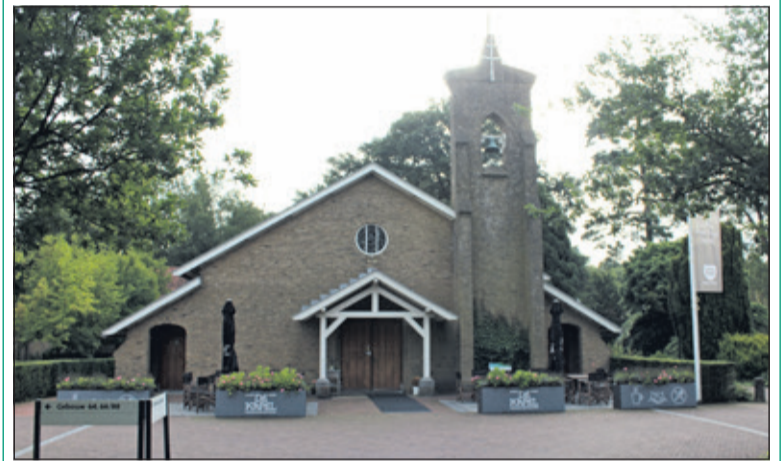
De beursvloer wordt dit jaar in De Kapel op het Berg en Bosch-terrein gehouden.

Biltse bedrijven en Biltse maatschappelijke organisaties kunnen zich inschrijven via www.samenvoordebilt.nl . Deelname is gratis. Wel is het belangrijk dat aangegeven wordt wat vraag en aanbod is. Ter voorbereiding op de Beursvloer kunnen deelnemers op 15 november om 15.00 een korte workshop volgen met tips en trucs voor een goede match. Inschrijven voor deze workshop kan tegelijk met de inschrijving voor de beursvloer. (Judith Boezewinkel)