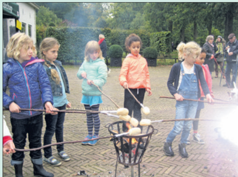
Broodjes bakken is een van de populaire activiteiten bij Beerschoten.

Ter gelegenheid van de opening van het seizoen zijn er bij Beerschoten Holle Bilt 6 in De Bilt, op zondag 21 oktober tussen 12.00 en 16.00 uur leuke activiteiten zoals broodjes bakken in de vuurkorf, oud-hollandse kinderspelen en een speurtocht 'herfstraadsels' rijden met de groenkoets. Naast al deze activiteiten zijn er ook twee wandelexcursies. Eén wandeling over de landgoederen Beerschoten en Houtringe en een wandeling in het Panbos. Zie de website van Utrechts Landschap, onder activiteiten. Het informatiecentrum is open van 11.00 tot 16.30 uur.