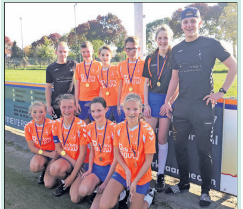
Met een 11-0 overwinning op Victum (Houten) behaalde DOS C1 (Westbroek) het kampioenschap. Er was geen puntverlies en er werden bijna 100 doelpunten gescoord.