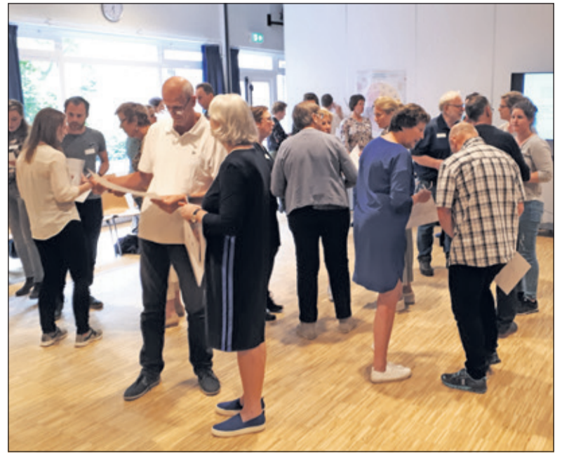
In een soort van speeddating maken de diverse deelnemers aan de werksessie kennis met elkaar.

Om overgewicht te kunnen bepalen wordt de BMI (Body Mass Index) gebruikt. Deze wordt bepaald door een verhoudingsgetal: het aantal kilogrammen gedeeld door het kwadraat van je lengte. Een BMI tussen de 25 en 30 geldt als overgewicht, een BMI van boven de 30 geldt als obesitas, ernstig overgewicht. In Nederland hebben we te maken met een omgeving waarin energierijk voedsel makkelijk verkrijgbaar is. De verleiding om te veel te eten en te drinken is daardoor groot. De beschikbaarheid van een goed wegennet en openbaar vervoer zorgt daarnaast voor een omgeving waarin de noodzaak om te bewegen minimaal is. Het is daarom van groot belang om juist een omgeving te creëren die stimuleert tot gezond eten en meer bewegen. Hoe lager het opleidingsniveau, hoe hoger het percentage mensen met overgewicht en ernstig overgewicht; Mannen hebben vaker overgewicht, terwijl vrouwen vaker ernstig overgewicht hebben