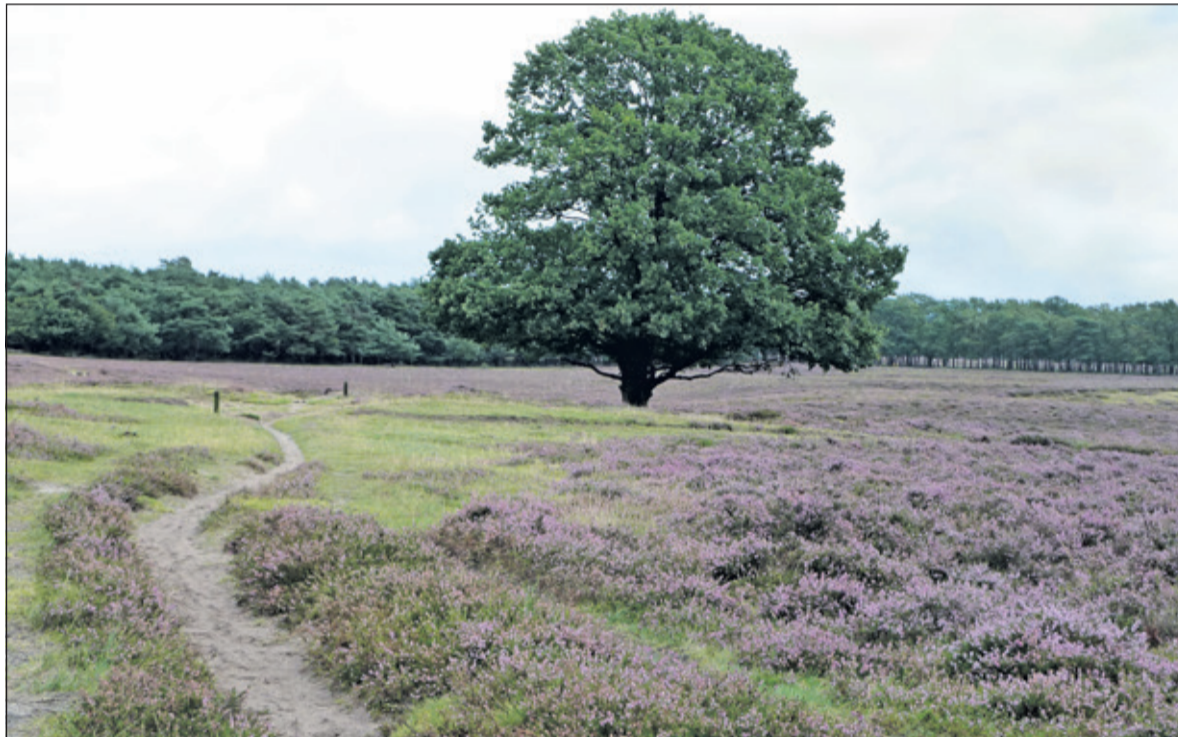
Bestaande hei in het Gooisch Natuur Reservaat.

De te kappen oppervlakte bos is teruggegaan van ca 65 ha naar ca 22 ha, dus ongeveer een derde van het oude plan. Aan GNR Natuurreservaat is gevraagd de provincie Noord-Holland te verzoeken om maatregelen te nemen ter compensatie van de bomenkap, door herplant of andere CO2 reducerende maatregelen, het liefst in de eigen regio. De adviescommissie vindt het noodzakelijk dat door middel van monitoring nauwlettend in de gaten wordt gehouden hoe het heidelandschap zich ontwikkelt en hoe succesvol de verbinding is. Op basis hiervan kan in de toekomst eventueel aanpassing van de heideverbinding plaatsvinden. Ook is er gevraagd een klankbordgroep in te stellen specifiek voor de uitvoering van dit project en om het hondenbeleid, op en rond de Natuurverbinding Hoorneboeg, in het belang van de biodiversiteit tegen het licht te houden en het vastgestelde beleid strikt te handhaven.