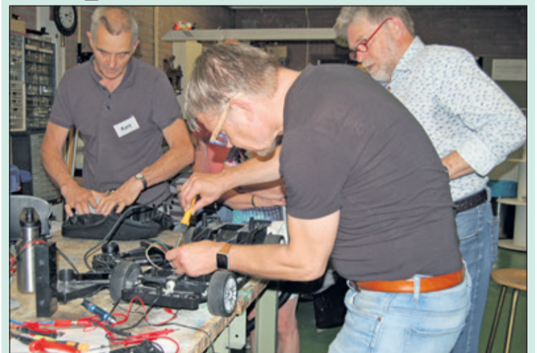
Handige handen aan het werk bij het Repaircafé.

Op zaterdag 30 juni is er Repair Café bij de WVT in Bilthoven.