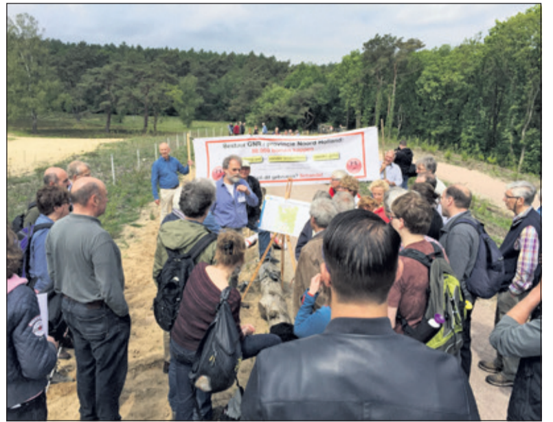
Het plan (2016) met omvorming van bos naar heidelandschap tussen de Hoorneboegse heide leidde tot grote commotie bij de omwonenden.

Op hoofdlijnen houdt het advies van de adviescommissie in dat de route van de heideverbinding korter en smaller wordt dan in het oorspronkelijke plan het geval was.