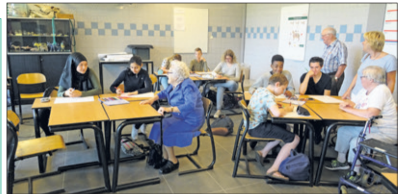
Het maken van een tuinplan was voor sommigen een reden om in een groepje aan te schuiven en vragen te stellen.