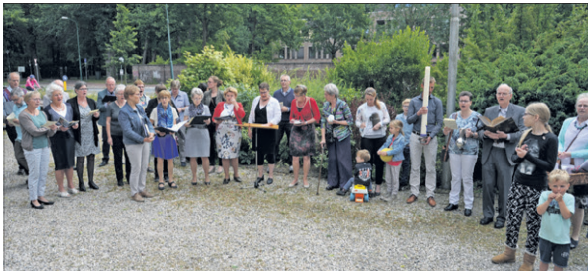
Iedereen staat buiten opgesteld met een deel van de inboedel.

stil bij het evangelie van Marcus 4: 35-41; in deze tekst is de oversteek door Jezus en z'n discipelen over het meer beschreven: 'Plotse storm stak er een hevige storm op. De discipelen maakten zich grote zorgen, terwijl Jezus lag te slapen.'