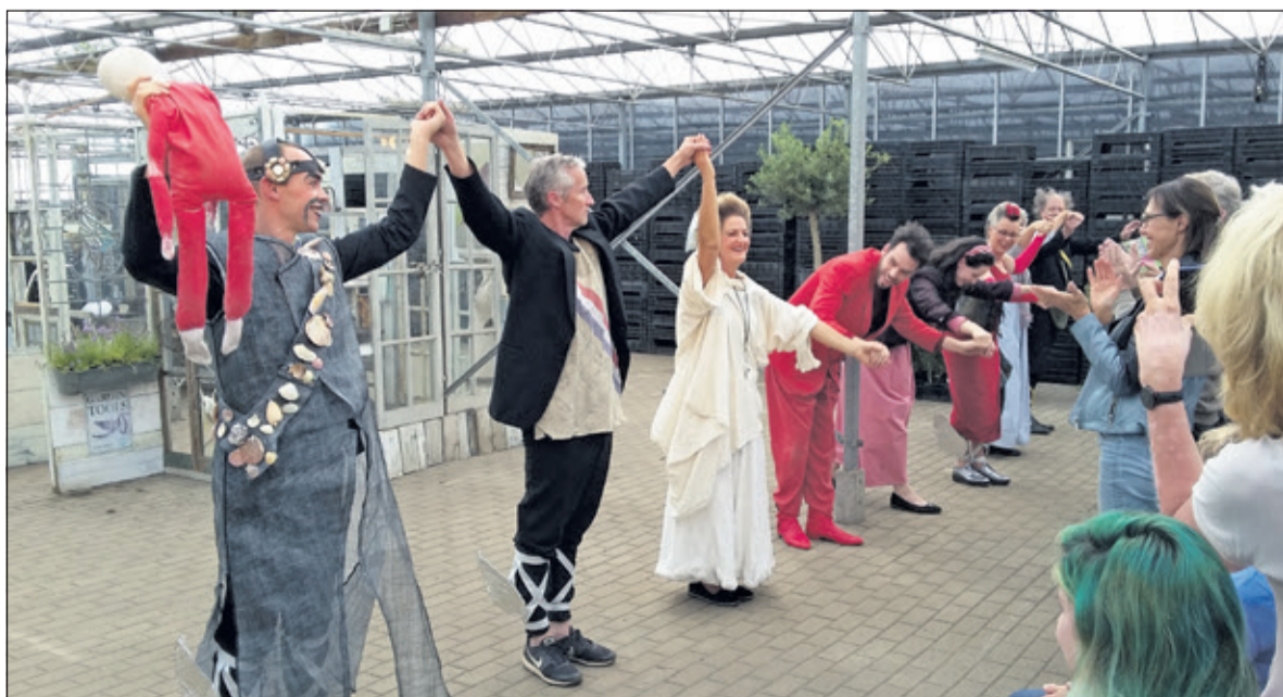
Applaus voor Theater in 't Groen in de kas van Van Vulpen.