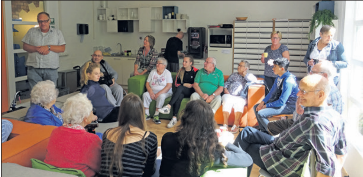
De ouderen met hun begeleiders worden door leerlingen en organisatie ontvangen met een kopje koffie en cake.

Om het contact tussen jongeren en ouderen te bevorderen organiseerde Aeres (voorheen Groenhorst in Maartensdijk) op 21 juni een Ouderendag. Twaalf ouderen met begeleiders waren te gast en maakten gebruik van de gelegenheid om kennis te maken met de school en zijn leerlingen.