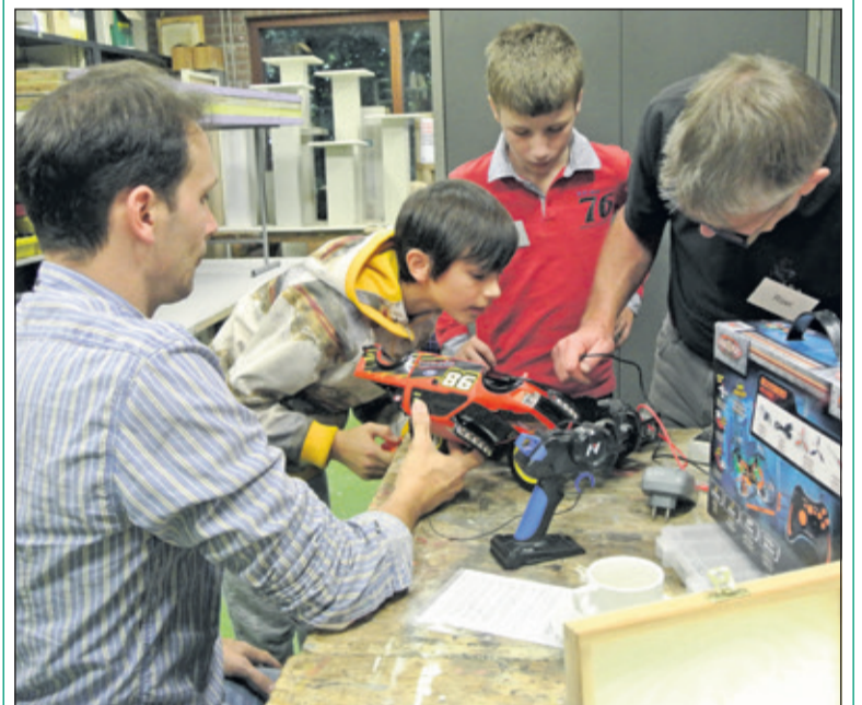
Kinderen betrekken bij reparatie werd twee kanten op.