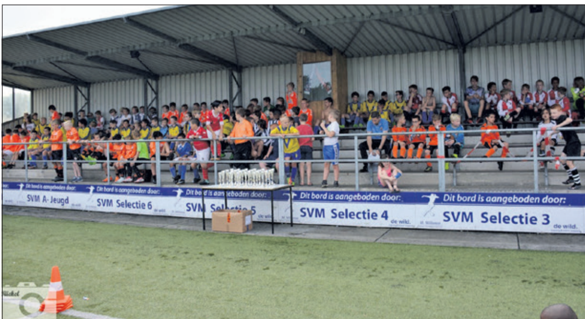
Voor de 3e keer werd bij SVM het Frans van der Tol-jeugdtoernooi georganiseerd. Er waren 6 poules met in totaal 22 teams. Het weer zat mee en de ijscoman was een welkome verrassing. Dank aan de vele vrijwilligers: het was weer een geslaagde dag voor de kleinste SVM voetballers. (Hans Nauta).