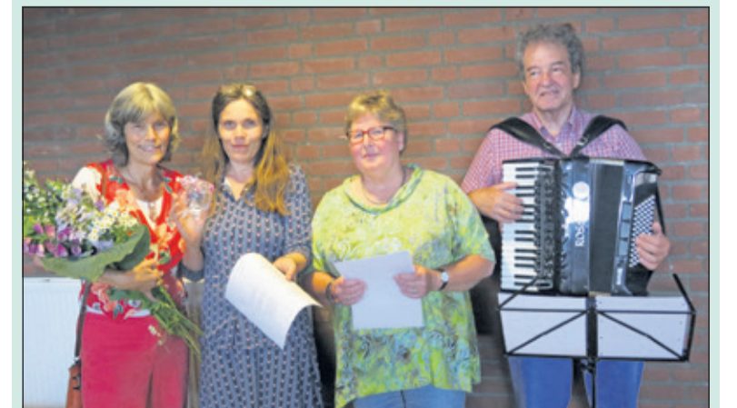
De zesde budgetkring De Bilt werd met een lied afgesloten.